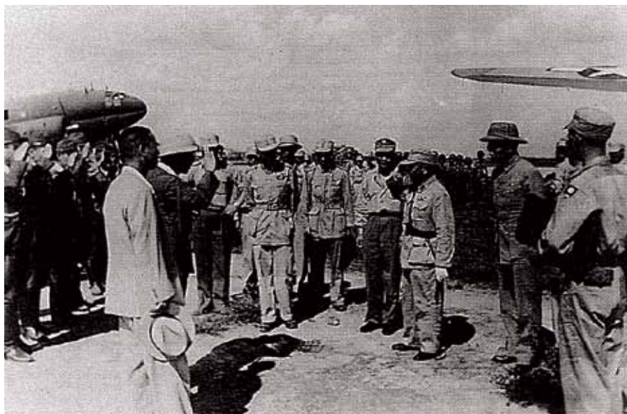
▶民國三十四年九月五日，國軍受降人員抵達南京。