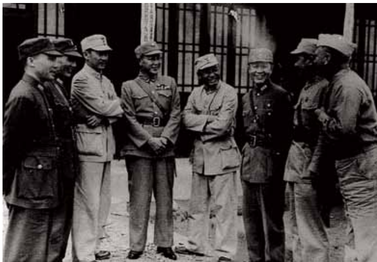
◀ 抗戰勝利，民國三十四年八月二十一日芷江受降儀式結束後，中美高級將領洽談，左三起為張發奎、何應欽、湯恩伯、杜聿明、蕭毅肅、中國戰區美軍作戰司令部參謀長柏德納。