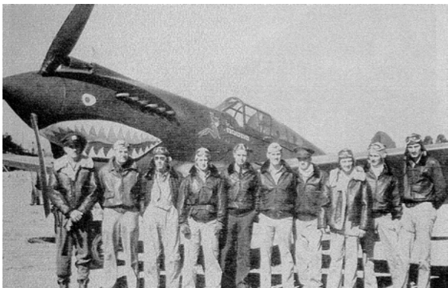
▶ 協助國軍抗日的飛虎隊。