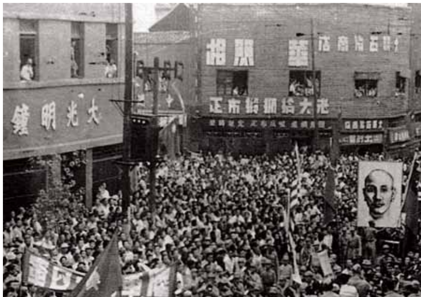
◀民國三十四年九月三日抗戰勝利後，重慶民眾遊行慶祝勝利。