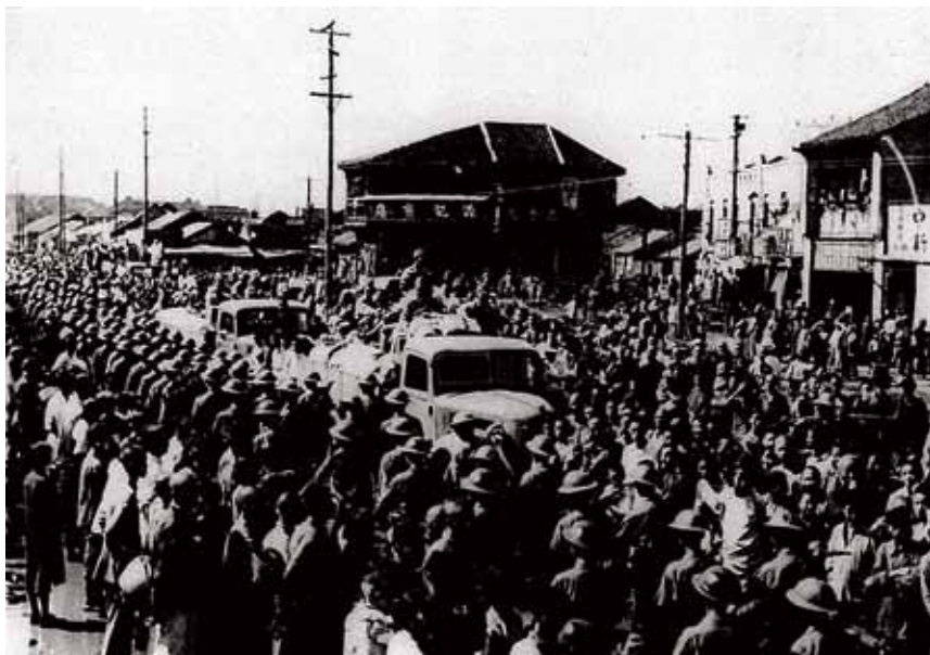
◀ 民國三十四年九月十一日抗戰勝利，光復南京，南京市民歡迎國軍入城。