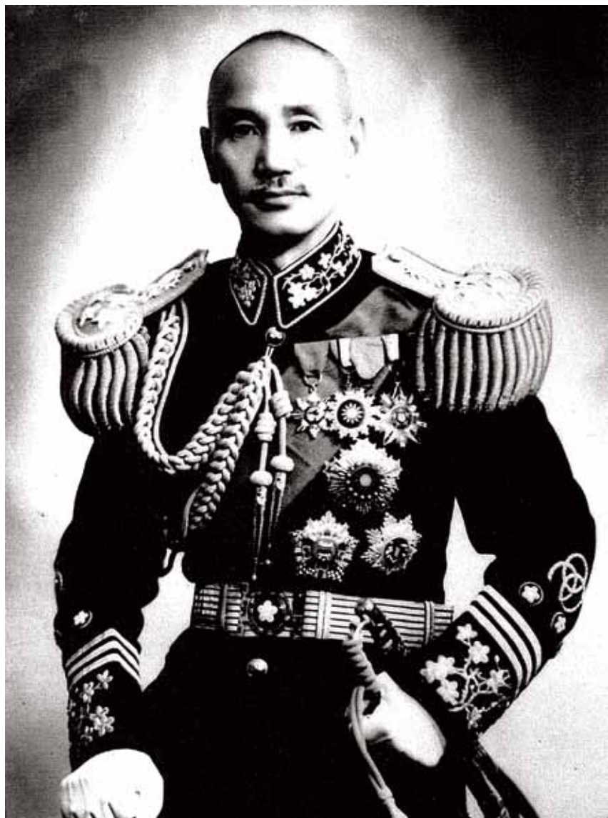
▶民國三十一年，蔣委員長被盟國推舉為中國戰區最高統帥。