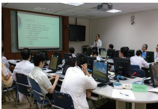
103 年 3 月 28 日 RCT 工作坊

藥師職類在過去幾年教學奠定基礎後，今年舉辦實證醫學進階課程，訓練已有基本實證醫學概念之藥師，課程著重於進階文獻評讀及精進實證藥學之臨床應用，此外亦針對世代研究之研究設計進行評讀及統計分析教學。課程採工作坊模式進行，可以讓參與課程的藥師實際演練如何評讀 RCT、正確使用實證醫學方法處理臨床問題及學習世代研究設計及評析統計方式。共計 4 場活動，培訓教師 59 人次。