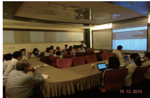
103年12月15日口腔醫學部月會