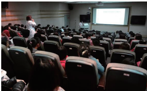
103年2月19日護理部月會

舉辦方式是以各專科及次專科為單位，每次由1-2個專科或次專科各選派一住院醫師輪流報告，由主治醫師或組內種子教師擔任、協助指導。報告內容以自己照顧的臨床個案所遇到的問題，循實證醫學的五個步驟解決的過程，報告時間為20-30分鐘，討論為20-30分鐘，103年排定輪值表如附件二。為增進臨床單位與報告者之學習，每場月會皆推派實證醫學種子教師給予評論，參與各科議題之討論。該活動主要開放鼓勵參加對象為，院內所有各臨床次專科主治醫師、住院醫師、實習醫師、實習醫學生，其他醫事人員及實習生參與，103年度共385人次參與，統計情形如下表：