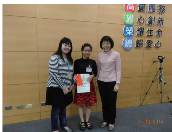
當場公佈得獎並頒獎