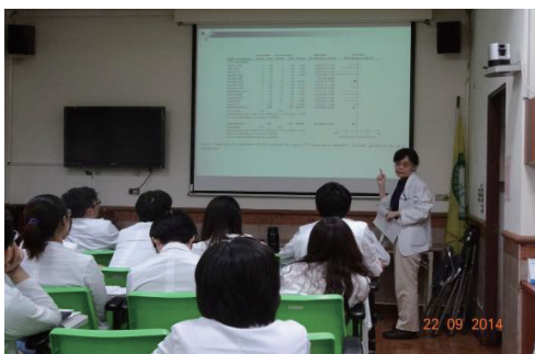
103年9月22日婦女醫學部月會