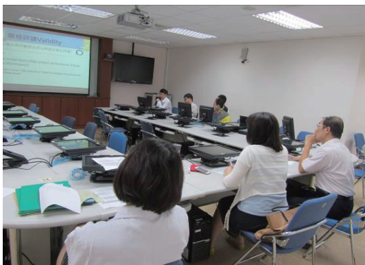
教師講評各組表現並給予回饋