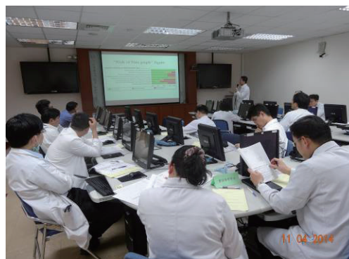
103 年 4 月 11 日 SR 工作坊