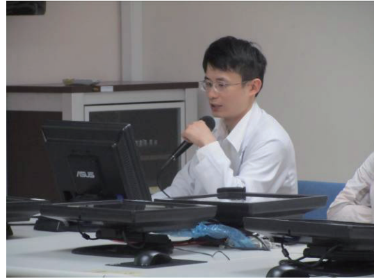
各組模擬競賽發表演練