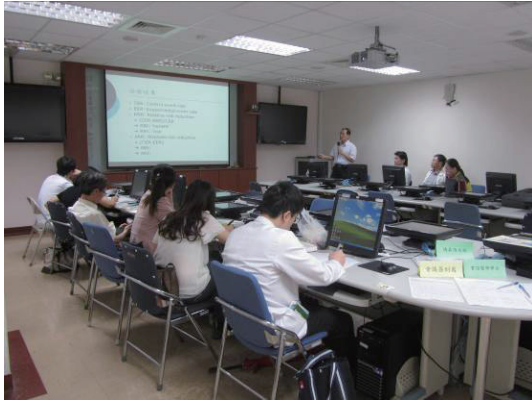
參賽經驗分享與技巧指導