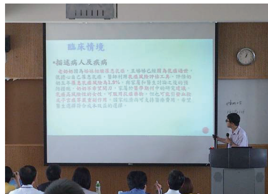
醫策會文獻查證進階組競賽發表