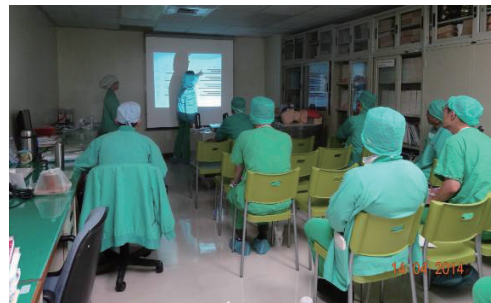
103年4月14日麻醉部月會