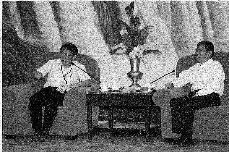
臺北市長柯文哲赴陸進行兩岸相關交流活動。

前面介紹了第一種類型 10 職等以下未涉密人員及第二種類型 11 職等以上未涉密人員，最後就來看第三種類型的人員，這一種類型的人員包括政務人員（含中央及地方）、涉密人員、直轄市長、上開三種身分人員退離職後尚在管制期間者、以及縣（市）長，這一種類型人員職務具有重要性或機敏性，因此，其赴陸程序與其他兩種類型人員有幾個面向的不同：