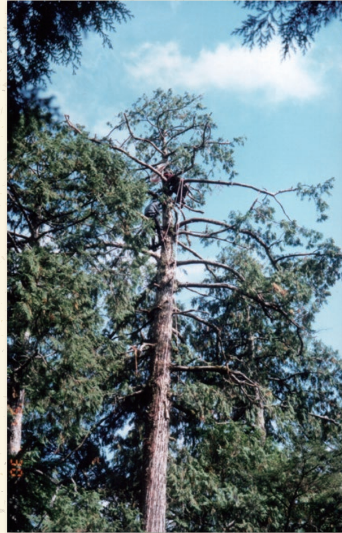
原住民在檜木枝梢進行採種作業

通常紅檜、扁柏是在六月份產生種子，十月份結果，每年的十一月至翌年一月可以進行採種，這時，眾多的原住民便受雇於開發處，身手矯捷的飛鼠在原始森林中。「我對他們的安全要求特別嚴格，雖然原住民同胞的身手都十分了得，但我還是