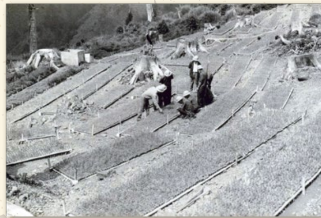
民國五十年代苗圃的播種作業