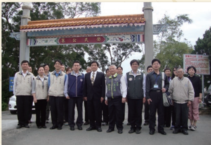
民國六十二年十一月三日宜蘭市公所撥交宜蘭市第二公墓（榮民公墓）由本處管理，直到九十四年三月一日歸還。圖為一〇三年四月三日輔導會宜蘭所屬單位聯合追思活動；後方牌樓為本處出資興建。