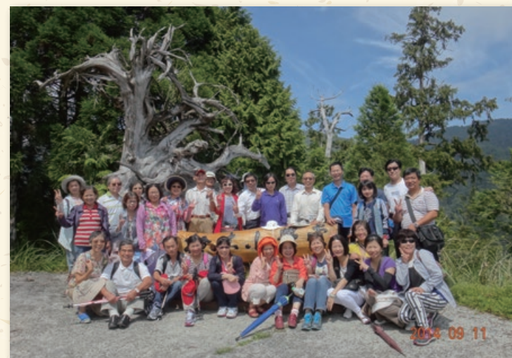
民國一〇三年九月十一日退休同仁回到棲蘭山林區，參觀 130 線檜木小學堂。