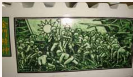
民國78年10月參加古寧頭大捷40週年慶祝活動獲贈紀念酒照片（反面）。