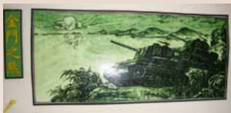
民國78年10月參加古寧頭大捷40週年慶祝活動獲贈紀念酒照片（正面）。