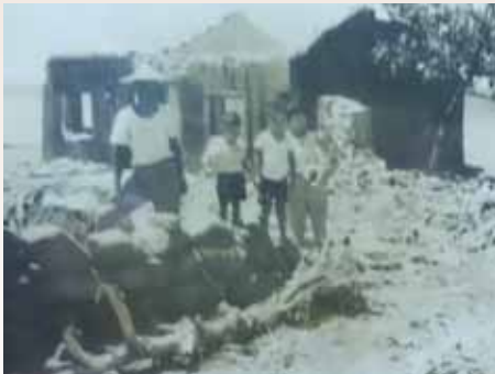
民國 59 年全家攝於枋寮遭海浪沖毀之海邊住家前（原照片翻拍）。