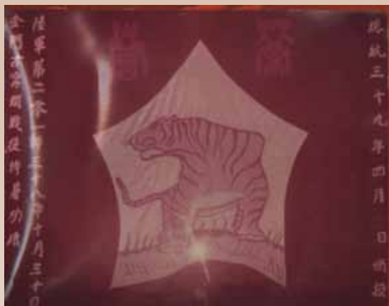
民國 39 年 4 月總統頒古寧頭戰役榮譽。

退伍後於私人公司當業務員，深獲公司的重視，負責屏東南部鄉鎮業務，期間曾獲得公司表揚及頒發獎狀，退休後在地方上熱心公益，協助成立枋寮鄉消防分隊，95 年並榮獲屏東縣枋寮鄉模範父親的表揚，我太太則榮獲 102 年枋寮鄉的模範母親。