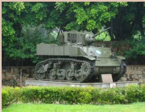
「古寧頭戰史館」館前展示參戰之戰車實體「金門之熊」。

適巧，因前一天舉行實兵演習，意外陷於溝渠的戰車，一開始擊中共軍船隻，引燃火光，頓時水際通亮，共軍行蹤曝露，受制於我軍沿岸之槍砲火網攻擊，傷亡慘重。