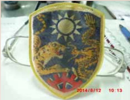
古寧頭戰役中龍虎部隊臂章。