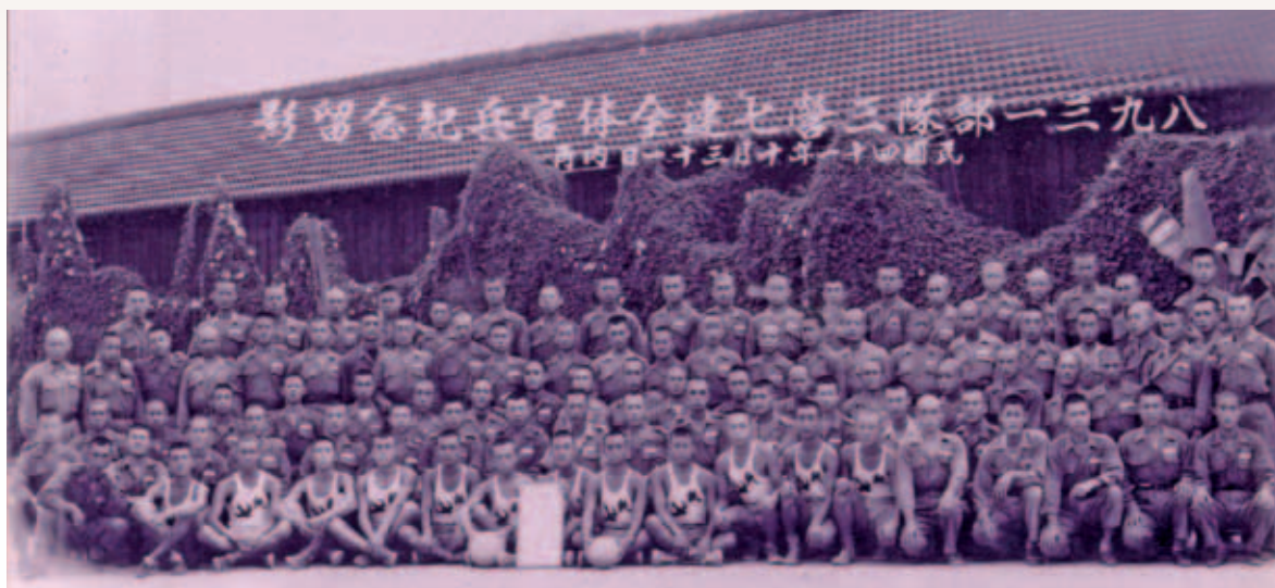
民國 41 年 10 月 31 日 8931 部隊 3 營 7 連全體官兵合影於嘉義內角營區。

我軍在此役能獲勝，應該是潮水幫了忙，加上地雷及阻絕工事，讓共軍無法順利接近、登陸；就算上來了，也被我們攻擊的火網給打散了。以當時俘虜來講，他們都是丟掉武器，無心作戰了，我們才能順利俘虜，否則，我們 3 人可能早就死在海邊了。回想起來，只能說戰爭是沒有人道的，不是你死就是我亡。戰後個人獲頒陸海空軍褒狀，我們 201 師也獲總統頒發古寧頭戰役榮譽狀。