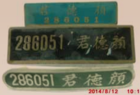
服役期間個人兵籍名牌。

在那戰亂年代，軍人的薪水很低，我偶然在枋寮參加友人喜宴，認識了太太的父親，願意將女兒嫁給我；我當時駐守在外島，同事知道後，大家湊了 5 千元，請了假回臺灣辦理結婚。結婚後，經常往返於外島及臺灣之間，在枋寮海邊的家因為海水的衝擊毀掉了，因我的孩子尚幼小，乏人幫忙照料，因此，毅然退伍。