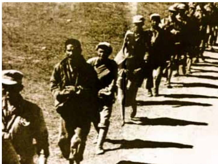
古寧頭戰役中國軍押解被俘共軍。

第18師一面炸船，一面沿海岸推進至古寧頭台地東端時，遇據守在西一點紅之共軍，利用我原設工事憑堅頑抗，國軍在步戰協同下，攻佔21高地，收復西一點紅。並續攻共軍佔據林厝東面之高碉堡，到15時，尹俊師長見情況十分危急，為鼓舞士氣，強化攻勢，乃親自率師部警衛營發起攻擊，警衛營長見師長親臨槍林彈雨的第一線，乃端著槍領頭在先，警衛營弟兄見師長、營長，親自衝鋒，士氣如虹，人人都爭先衝在最前頭，經過慘烈廝殺，雖將該碉堡攻克，但18師警衛營官兵傷亡殆盡，最後清點人數；全營竟僅剩指導員1人及士官兵57員。