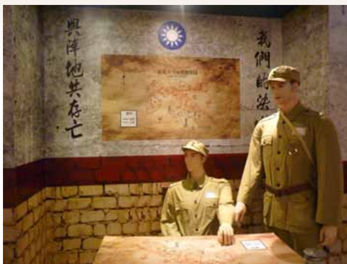
古寧頭戰役時國軍幹部討論作戰方針實體模擬。

國軍經一晝夜之激烈戰鬥，登陸之共軍雖已大部分被殲或被俘，但蟄集林厝、北山與南山之共軍，仍利用堅固家屋企圖頑抗；我軍不顧犧牲，前仆後繼。但整日未食，彈藥亦待補充，精神及體力已疲憊不堪。至聚踞古寧頭之殘餘共軍，尚有多少？特別是入夜後共軍是否尚有後續部隊來援？實為此