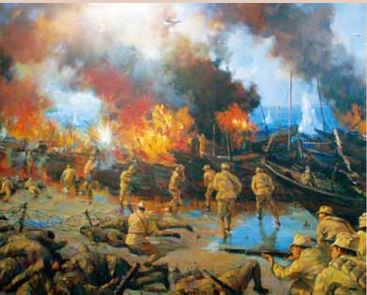
火燒船隻（局部）陳耀東畫。