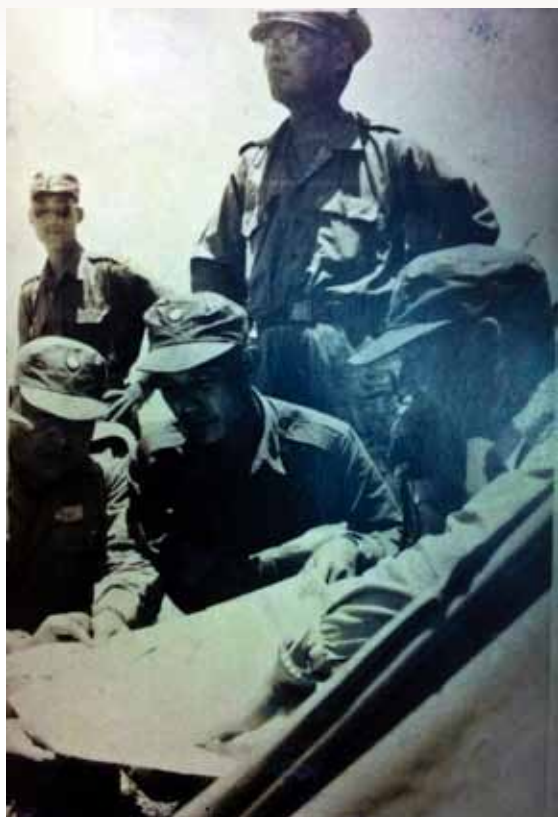
胡璉將軍接手指揮戰場並與部眾商議軍情。