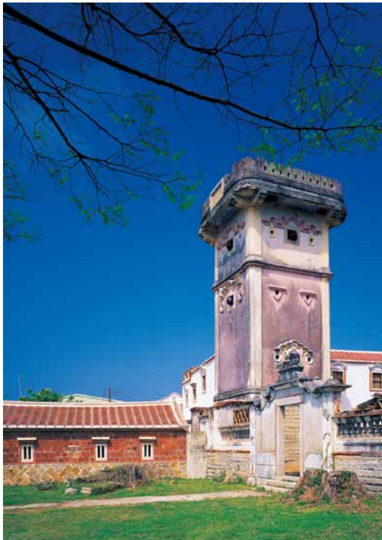
金城鎮水頭得月樓。