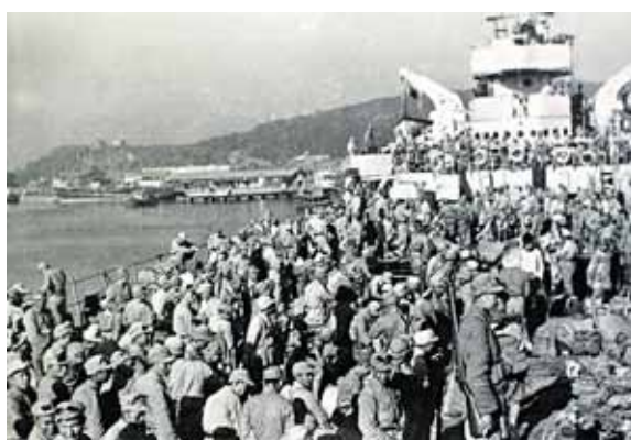
民國 38 年古寧頭戰役中立功陸軍第 18 軍 201 師凱旋返台整訓。

到此登陸共軍全部解決，鏖戰 56 小時之古寧頭戰役終於畫下句點，世稱「古寧頭大捷」。