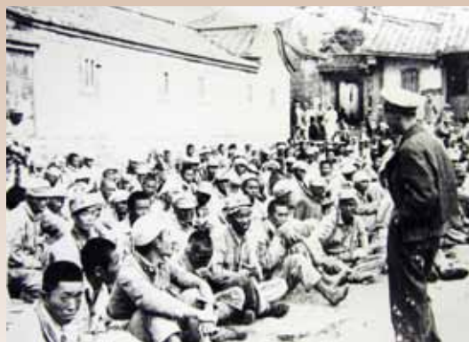
古寧頭戰役後胡璉將軍探視共軍戰俘。