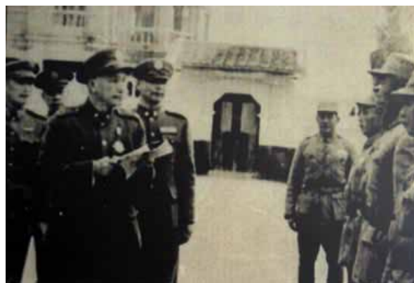
民國39年冬天，先總統 蔣公首次巡視金門點校古寧頭戰役作戰有功官兵。

方海域，以猛烈砲火截擊陸續到達之舟波及聚集灘頭之共軍。我大部海軍船艦，於作戰全期，在大、小金門間海域布防，徹夜枕戈，一面協助陸上國軍反擊，一面阻敵後續部隊由海上增援，擊毀敵船甚多，嚴密防範共軍渡海再犯，並不時向大嶼、澳頭等對岸共軍砲兵陣地實施壓制射擊，轟擊其船泊地，確保了陸上國軍戰場之優勢。一部海軍也充分發揮運補軍需物資及即時運送傷患的功能。