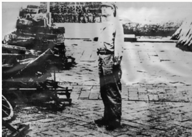
古寧頭大捷虜獲共軍各式輕重武器。