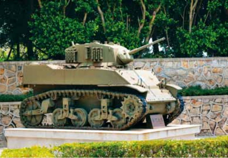
古寧頭戰史館前展示之 M5A1 戰車，於戰役中發揮強大戰力，胡璉將軍於戰役後，特贈「金門之熊」美譽。

此時國軍主力 118 師及第 14 師 41、42 團在戰車和砲兵協同掩護下，加速分別向安歧以北土堤及浦頭一帶前進，並與共軍短兵相接。8 時以後，從臺灣起飛的 P51 野馬式轟