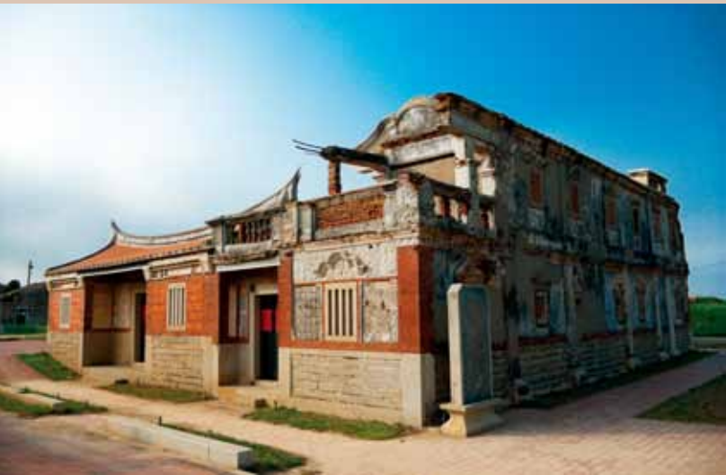
北山村古洋樓側面圖。