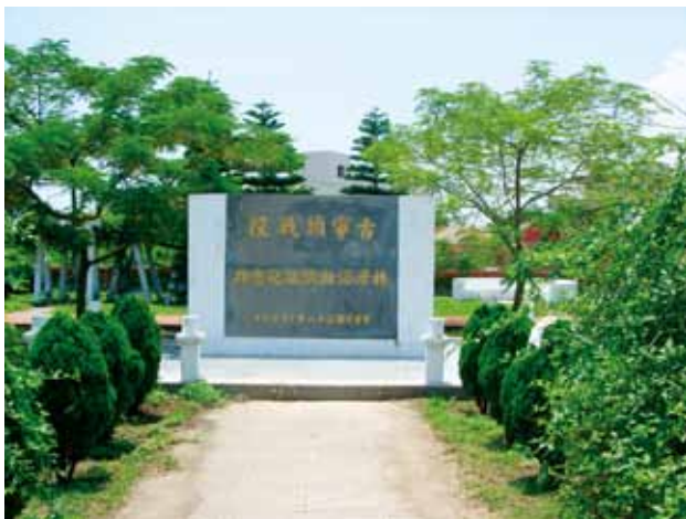
國軍與盤據林厝的共軍浴血奮戰（林厝浴血殲敵紀念誌）。

我中、南路軍在奪取埔頭後，稍事整頓。約15時許，我中路軍第118師352、353團向林厝正面共軍猛攻，因林厝道路因素，戰車只能自村外砲擊建築物。同時，南路軍第14師41、42兩團亦從埔頭向林厝之共軍圍攻，並於