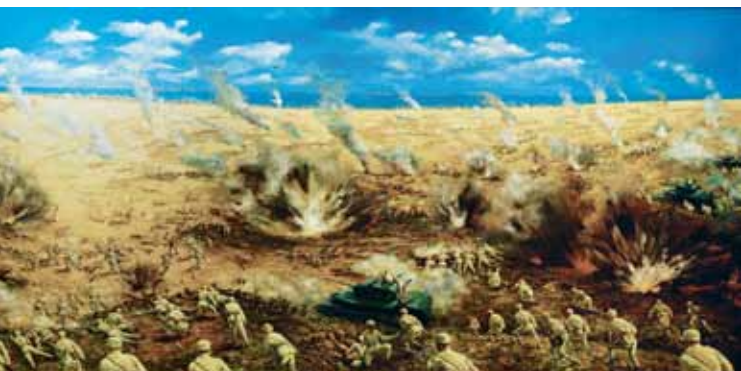
民國38年10月25日上午反擊部隊全面攻擊共軍 （局部）施並錫畫。