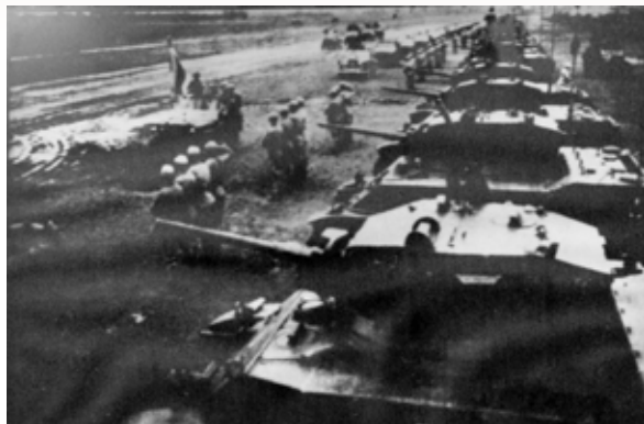
先總統 蔣公親校參加古寧頭戰役之裝甲部隊。