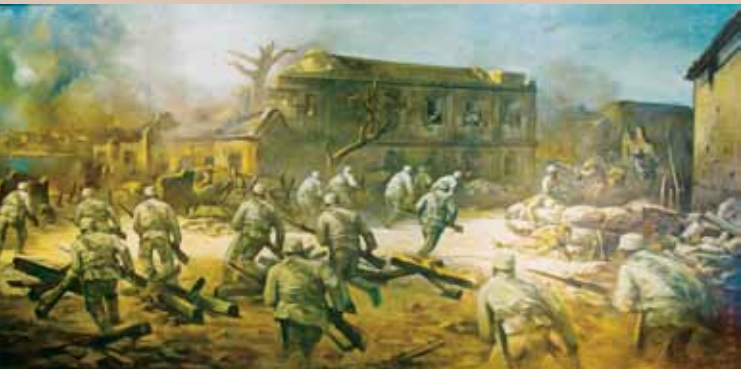
民國38年10月26日下午2點，反擊部隊攻入南山、北山與共軍巷戰（局部）陳慶煥畫。