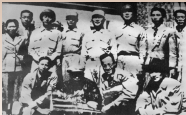
古寧頭大捷後，勞軍團慰勞金門前線，與參戰官兵們合影。