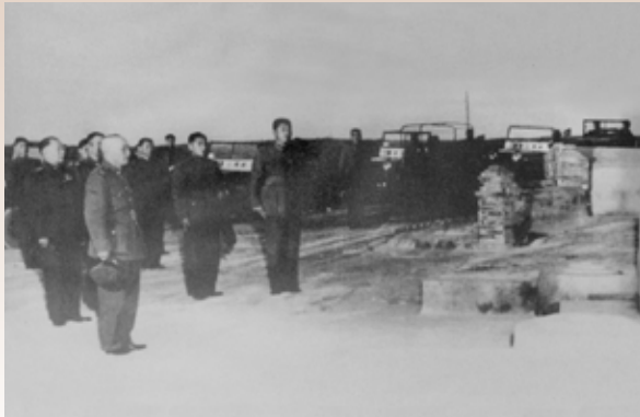
先總統 蔣公於金門太武山致敬古寧頭戰役陣亡將士。