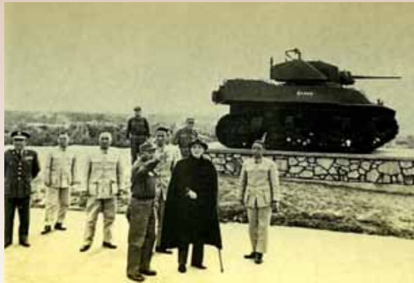
古寧頭大捷後先總統 蔣公至金門視察防務與「金門之熊」-M5A1戰車合影。

當年在金門國軍除作為作戰主力的兵團、軍、師，尚有支援作戰的特種兵部隊。包括前述之要塞總台、戰3團第1營、砲3團第7連、砲14團第1連。其餘尚有工兵第10團第1營、技術總隊第1大隊及聯勤第1分區司令部所轄之第56支部3個補給站與1個總倉庫等單位。這些支援作戰的幕後英雄們，雖然在硝煙彈雨的戰場上無殲敵之顯赫功勳，但如果少了他們，古寧頭戰役亦無法取得勝利。