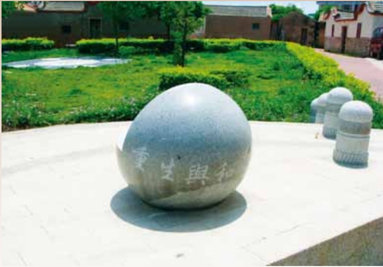
金寧鄉北山村口前紀念古寧頭戰役之石雕景觀。