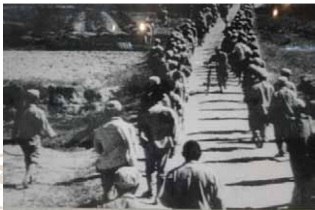
古寧頭戰役被俘共軍一部。

長官羅卓英將軍偕國軍第 12 兵團司令胡璉將軍抵水頭村，會晤湯恩伯將軍後，立即親赴前線，驅車至湖南高地第 18 軍指揮所，此時，李良榮將軍與各軍、師長等齊聚於湖南高地。胡璉將軍在觀察狀況後，將攻擊部署略為調整：「第 118 師及第 18 師 54 團統歸第 118 師李樹蘭師長指揮。另由第 19 軍軍長劉雲瀚於 132 高地迄壠口之線構成守備陣地，以防萬一。」各部隊聞司令胡璉將軍到達後，士氣益奮。