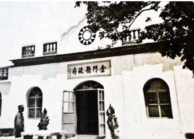
戰時的金門縣政府。

屍骨等工作。由於軍民一心、同舟共濟，使得我國軍無後顧之憂的，全力保衛金門，贏得勝利。所以金門民心一直是一股支持著我國軍打到最後，贏得這場戰爭的重要力量。