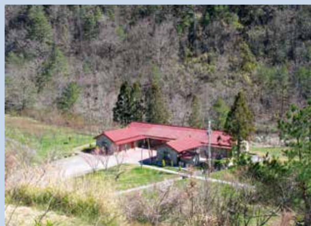
第6區農莊（攝於民國95年）。