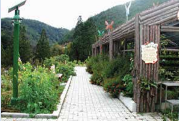
藥用植物園區（攝於民國95年）。

瞭解、欣賞、體驗及享受武陵地區的自然之美，藉以引導國人重視生態教育與環境保育的永續價值。