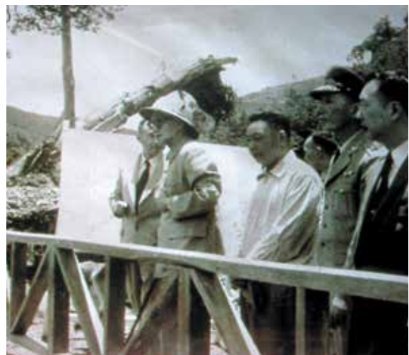
民國50年先總統蔣公及經國先生實地勘察原武陵墾區。

武陵農場自70年起，面對社會經濟環境變遷、配合政府生態旅遊及國土復育政策，以自然景觀與生物多樣性，結合豐富的農業資源相輔相成，逐步轉型為觀光休閒與生態旅遊。目前已朝生態旅遊發展定位，未來將持續向「營造國際保育形象」的生態旅遊目標邁進，以達永續經營。