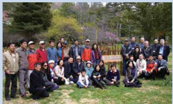
兩社與本場接待人員合影留念。