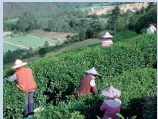
第4區高山茶園（攝於民國92年）。