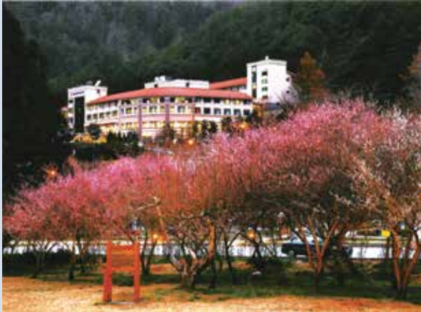
91年興建完成之武陵農場第二賓館。