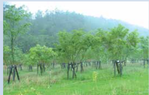
收回後執行植生造林成果。