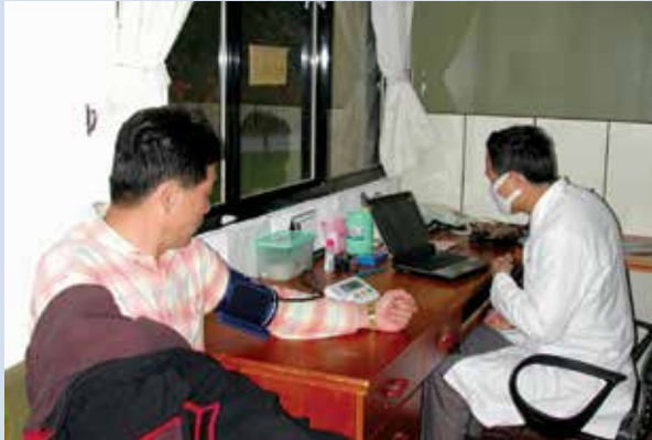
武陵醫療站看診情形（攝於民國94年12月）。

解說牌100餘面，以推展國際生態旅遊。推出夜間觀星活動，以室內解說搭配戶外觀星方式，每日於晚間21時30分至22時30分舉辦。生態導覽解說活動則每日於8時及14時30分分二梯次舉行。推出鮭魚號、蝴蝶號與獼猴號3部生態旅遊導覽解說巴士，以提供深度生態旅遊需要。另套裝非假日深度導覽旅遊活動，以非暑假期間每週一至週四，套裝食、宿、生態旅遊