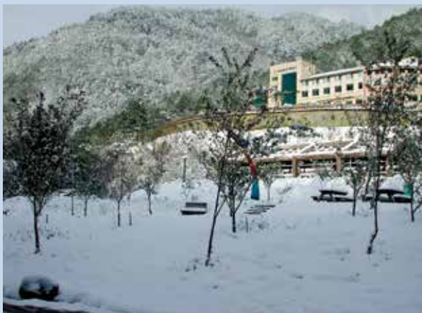
武陵第二賓館雪景（攝於民國93年3月）。