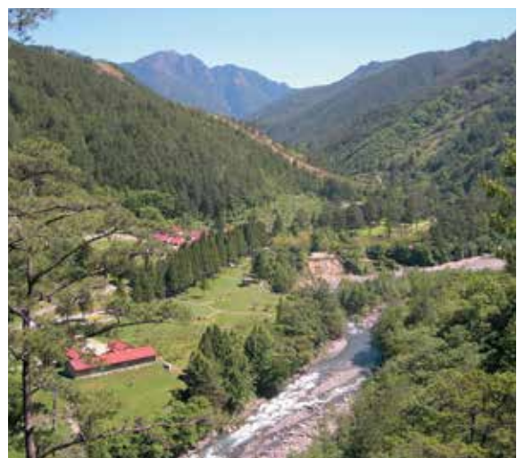
民國95年10月所攝之武陵農場南谷風光。