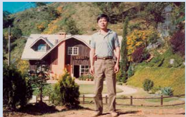
民國76年12月奉派至泰國，參與泰皇山地計畫（攝於泰國安康農場）。