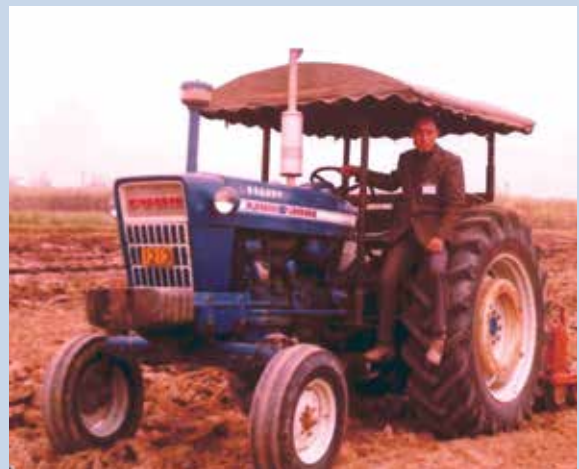
民國60年間採取機械化作業，提升農耕工作效率。