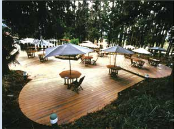
露營區管理中心旁的「森林咖啡吧」。

93年7月整建設立「農莊文物館」，爭取中華電信公司完成寬頻系統架設及場區網路系統整合。