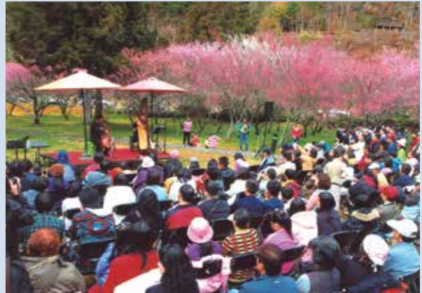
櫻花季舉辦之音樂會。