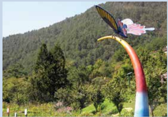
蝴蝶館（攝於民國90年）。

為推動生態旅遊產業，武陵農場已規劃出5條旅遊動線，包括南谷遊憩暨生態園區3條路線，路線自武陵賓館→迎賓橋→賞鳥步道→溪畔步道→櫻花鉤吻鮭復育中心→武陵農場行政中心→雪霸國家公園遊客中心，約4小時。中谷步道1條路線，路線自億年橋→第二區茶園→農莊文物館→兆豐橋→武陵製茶廠，約1.5小時。第四區露營區及高山植物園區1條，為大地體驗路線。並建置28個生態旅遊解說站，完整詳實的提供專業解說，使遊客