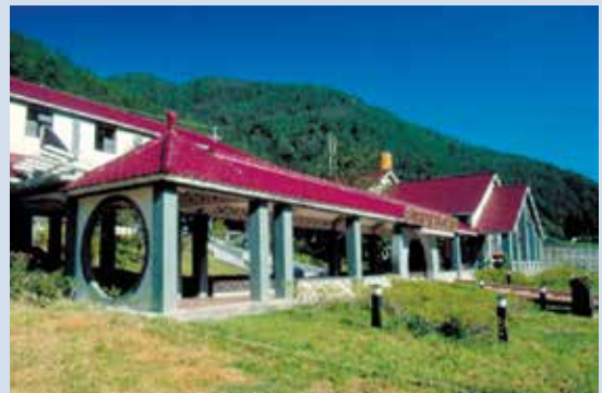
民國84年興建旅遊服務中心以服務遊客。

因應時代的變遷，於民國78年推動農場轉型經營，改善生產條件，加強水土保持，改善環境綠美化，積極擴充觀光休閒設施，逐年逐步推動觀光設施軟硬體建設；至88年起進入轉型觀光發展時期，積極推動觀光旅遊、生態保育，使農場正式進入以生態觀光旅遊為主之轉型經營階段。