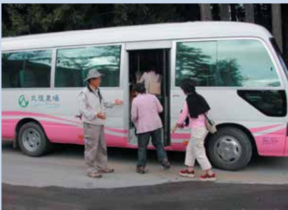
民國95年6月蝴蝶號生態旅遊導覽解說巴士開始營運。

武陵農場在建置生態旅遊的環境教育與解說方面，除編撰中英文導覽手冊及導覽圖摺頁外，亦豎立花卉、鳥類、楓葉、蝴蝶、草花、文物等中英文