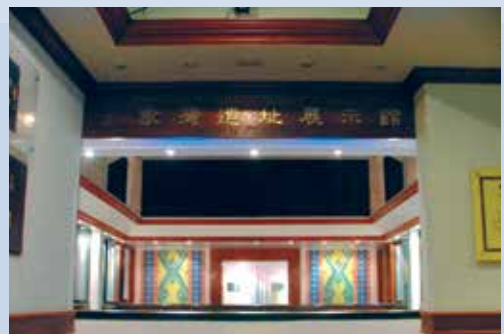
七家灣遺址展示館（攝於民國95年12月）。