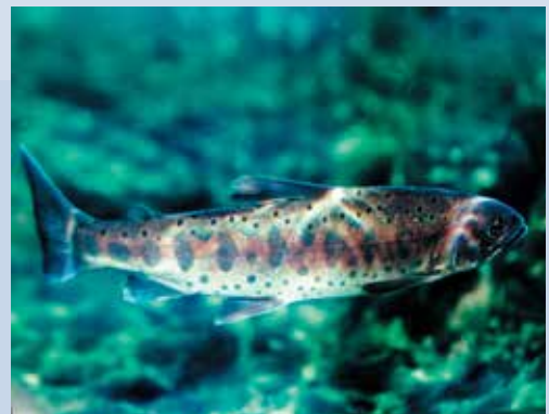
民國73年農委會公告櫻花鉤吻鮭為珍貴稀有動物並命名為國寶魚。