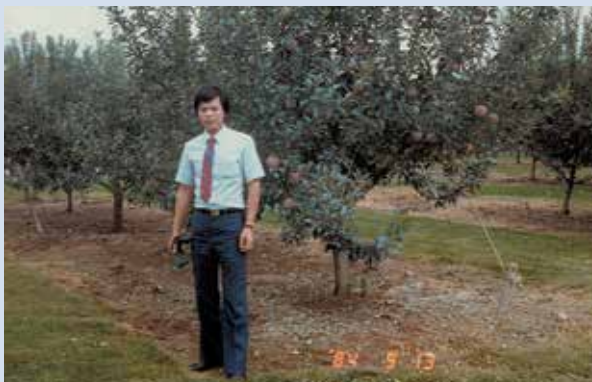
民國73年8月奉派至日本，考察農業（攝於日本岩手縣蘋果試驗場）。

81年陞任技師、調休閒農業組服務，86年代理休閒農業組長，88年擔任休閒農業組長，並依輔導會之政策指導積極辦理農場轉型發展休閒農業。任內透過本場第1、2期發展觀光整體規劃，分年逐次完成環境保護措施與發展觀