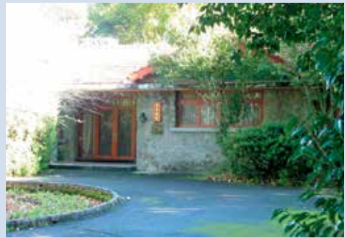
蔣公行館（攝於民國95年10月）。

武陵農場位於臺中縣和平鄉，東西橫貫公路宜蘭支線上，距離臺中135公里、宜蘭95公里、梨山25公里。為雪山山脈所圍繞而成的狹長形山谷，大甲溪上游七家灣溪穿流其中。在海拔1,740~2,500公尺之間，全年最高氣溫攝氏29度，最低氣溫攝氏零下12.5度，年平均溫度約攝氏20度。日夜溫差大，每年冬季累計低溫攝氏7度以下超過1,000小時。雨量分配不均，以7、8月份