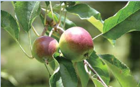
牛頓蘋果結果照片。