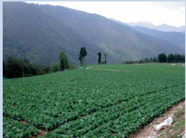
高麗菜園（攝於民國93年）。