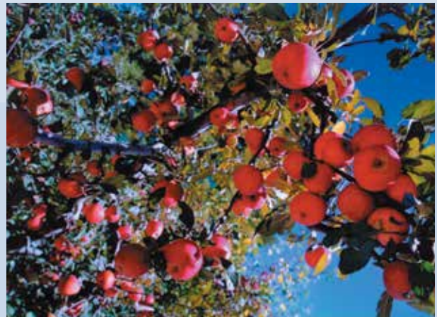
第6區矮性蘋果園結果情形（攝於民國86年）。

民國58年為鼓勵並提升生產效率，訂定農場生產績效獎勵辦法，並興建完成農場果品包裝廠及興建完成文康福利中心及園藝工作隊宿舍，大大改善員工生活品質。59年完成場區內灌溉系統，以利農業生產，並規劃完成北谷蔬菜地，三合院石頭屋之農莊，分誠、善、親、民4莊及就地安置之忠莊計5個莊，輔導場員種植、生產。繼之於60年間推行農業機械化作業，有效提升效率，節省人工。訂定銷售辦法，配合榮民供銷中心作業，統一標售