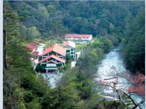
民國70年武陵第一賓館加入農場營運。

在生態保育方面，鑑於七家灣溪流域櫻花鉤吻鮭這項珍貴的自然資產恐有滅絕危機，政府主管機關與相關學術單位，遂自70年起，積極推動一連串保育措施。農委會特於73年依文化資產保存法，公告櫻花鉤吻鮭為珍貴的稀有動物，並命名為「國寶魚」；74年農委會積極推動對櫻花鉤吻鮭的人工復育以及放流工作，以增加族群數量；78年又依當時通過之野生動物保育法，將櫻花鉤吻鮭列為瀕臨絕種保育類野生動物；81年雪霸國家公園成立，七家灣溪集水區劃入國家公園生態保護區內，由國家公