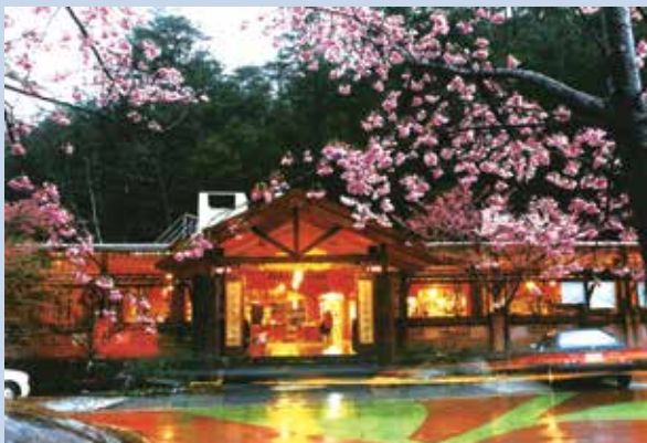
武陵農場內農特產品中心—茶莊。

92年7月辦理露營區第2期擴建工程，並於92年8月1日成功將武陵第二國民賓館委外經營。