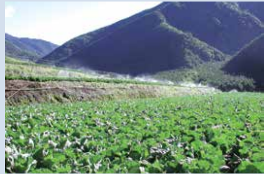
收回前菜地種植狀況。

依據行政院民國94年9月核定之國土復育計畫，武陵農場已自93年起逐年收回農耕地，於95年底全面停止菜地農業經營。果樹、茶園於96年底完成停耕作業。其中菜地種植原生觀賞樹種，使其兼具造林與景觀美化之作用，果、茶園部分則作為生態教學及品種觀察區，轉型為教育生態農園，農場整體規劃已將場區範圍區分為南谷遊憩區、中谷景觀林帶、北谷農業景觀區、自然保育區、原野遊憩區，執行國土復育計畫後，廣續規劃高山植物生態園區及休閒農業區，第4區高山植物園區於94年10月14日開工，95年3月初完工，於同年7月21日舉行盛大開幕儀式，並加強導覽解說之功能，期許國人對武陵地區有進一步之認識，滋生對環境保護之認同感。並配合臺中市政府、雪霸國家公園管理處執行國寶魚櫻花鉤吻鮭護育計畫，以落實生態保育及環境維護工作，確保資源永續利用。