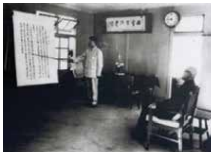
民國48年先總統 蔣公(右)視察西寶榮民農場，聽取邵場長子煌業務簡報之珍貴歷史照片。