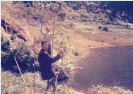
老主任委員經國先生譽為天下第一奇景－蓮花池，早年魚類資源豐富，可供場員蛋白質食物來源。