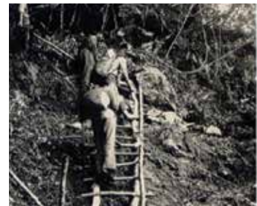
西寶農場場員早年運補糧食之艱辛作業情景。