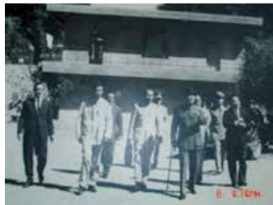
民國51年間老主任委員(右1)陪侍先總統蔣公巡視西寶榮民農場之珍貴歷史照片。