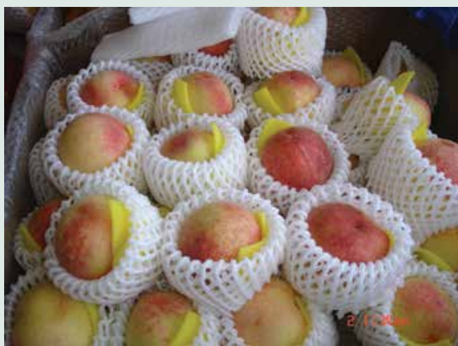
西寶農場場員種植碩大甜美的水蜜桃。

20年的場員生活，稍縱即逝，回憶栽種水蜜桃的日子，全盛時期西寶地區種植面積超過百公頃。近年因為入山開墾的老榮