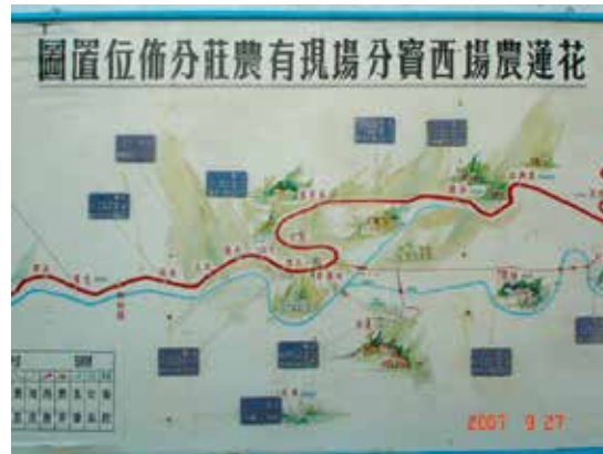
西寶分場早年農莊分佈位置圖。

民國46年9月間輔導會為供應東西橫貫公路築路員工新鮮蔬菜之需，於花蓮縣秀林鄉天祥地區成立西寶榮民農場，48年3月擴大梅園、蓮池、文山等墾區範圍及安置人數，51年再擴充竹村墾區，奉行政院正式核定成立西寶榮民農場，安置開闢中部東西橫貫公路參加築路之榮民，初期計在立霧、合流、綠水、文山、谷園、蘭苑、蓮池、竹村、松岡及洛韶等地點成立11個農莊，種植蔬菜、飼養禽畜，供應開路人員食用為主。場員在這些農莊開山闢地備極辛苦，山區交通不便，生活條件極端不佳，但我榮民袍澤不畏艱辛，將千萬年來之蠻荒地區，開闢為田園，並逐步建設成為人間仙境，58年2月1日撥入花蓮農場改稱西寶分場。