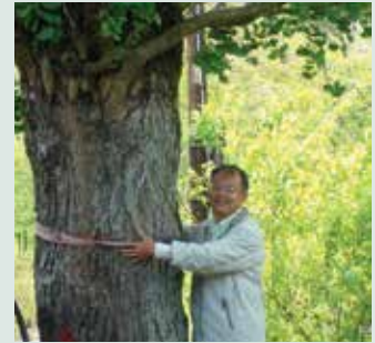
見證竹村發展史之百年臺灣第一巨大珍貴銀杏樹。