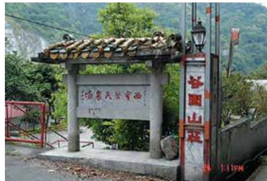
西寶分場谷園山莊之「西寶榮民農場」名銜，係民國48年由黨國大老書法名家于右任所書墨寶。