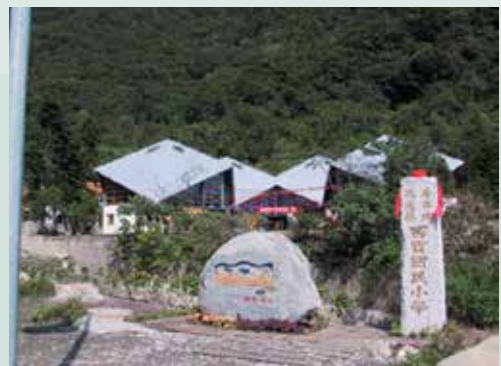
聞名中外森林實驗小學—西寶國小美麗的大門景觀。

民國56年前老主任委員經國先生為協助西寶榮民、場員改善生活環境，每戶贈送60棵水蜜桃及二十世紀梨樹苗，總計有6,000棵樹苗及每1平台1具石磨供榮民種植大豆磨豆漿、玉米食用，來增加營養，增強體力。也由於經國先生的先知卓見，開啟竹村地區溫帶果樹：水蜜桃、蘋果、二十世紀梨及加州李等溫帶水果的盛名。竹村農民更在70年間在第4梯台推廣高經濟的高冷果菜如梅、青梗白菜、紫色甘藍、球莖甘藍、結球白菜、甜椒、四季豆、蠶豆種植及蔬菜種子採種等農業生產，這些產品品種優良，因種在高山寒冷區，不需噴洒農藥，所有產品鮮美都可生食，深受消費大眾歡迎，既能增加收入又能滿足老饕的嘴與胃，至今西寶農場水蜜桃與高山蔬菜之美名「榮民生產、品質保證」仍留存在花蓮當地民眾心目中，據71年本場西寶分場資料顯示：西寶地區榮民平均每戶每月收入約13,000元，是所有退除役官兵輔導委員會所屬農場