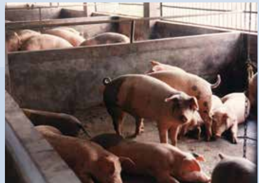
農漁牧綜合經營養豬情形。