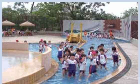
民國89年間整建後增加之遊憩設施。

隨著時代變遷社會進步，傳統農業已不敷經營需求，為求突破困境，增進農業經營收益，朝休閒農業發展是經營的趨勢。蒙輔導會政策指導及鼎力支持下，於民國87年度起分4年期投資金額6,300萬元，歷經2年修建，將高雄分場整建為觀光休閒農場，轉型經營休閒遊憩事業。