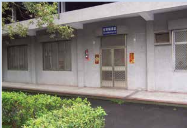
原場部會議室（現為綜合辦公室）。