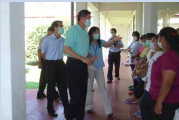
98年9月2日陳場長（左1）陪同高前主委（左2）訪視那瑪夏鄉民生國小全體師生。