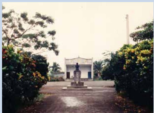
民國53年完工之榮華堂全貌。