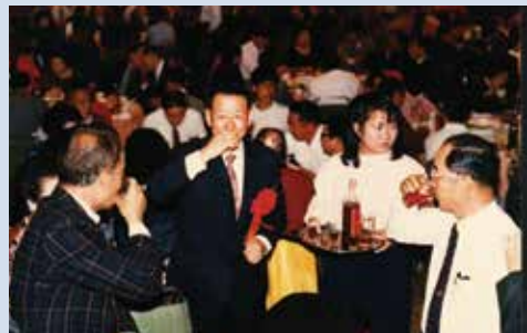
柏場長(左2)參加場員結婚喜宴。

柏場長湖南省陽縣人，陸軍官校17期、陸軍參軍大學正10期、三軍聯大戰爭學院65將官班，歷任團長、師長、副司令。任內倡導突破生產造福榮民，開辦魚池9公頃養殖尼羅紅魚及泰國蝦、培植由泰國引進之石斛蘭花0.5公頃、葡萄5公頃、牧草100公頃等直營生產事業，興建場部及各農莊活動中心6處，裝設自來水設施，提供自來水飲用，倡導以場為家的管理觀念。