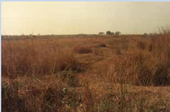
民國57年農場土地原均為荒蕪之砂礫河床地。