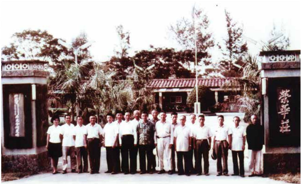
前主任委員經國先生命名場部為「榮華莊」。

本場成立於民國43年11月1日，前身為國防部所屬隘寮、竹田大同合作農場，主要任務是「安置解甲歸田之退除役官兵，開墾荒地，從事農業生產，以期安居樂業，繁榮社會，裨益國家經濟建設之發展」。51年7月1日將「隘寮大同合作農場」及「竹田大同合作農場」合併，更名為「屏東大同合作農場」，第1任場長由葉藹青先生擔任，場本部設置於屏東縣長治鄉隘寮。51年11月蔣前主任委員經國先生巡視農場時，將場部所在地「隘寮」，命名為「榮華莊」。52年3月20日農場更名為「行政院國軍退除役官兵輔導委員會屏東合作農場」；並於58年11月1日正式定名為「行政院國軍退除役官兵輔導委員會屏東農場」沿用至今。場本部新建辦公室於59年1月8日落成啟用，設場至今已有51個年頭，並於87年7月奉命簡併高雄農場（高雄農場成立於44年3月場部設於高雄市楠梓區）。於102年11月1日整併至彰化農場，成為屏東分場。