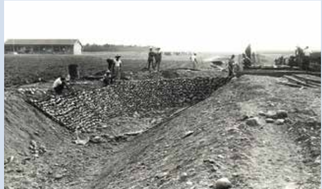
民國60年修築農路及灌溉排水溝施工情形。

助下，進行水利設施的建設。民國57年10月至73年間土地改良484公頃，新鑿灌溉用深水井14口及農水路之配合興建，完成土地開墾、改良之艱鉅任務。在農場幹部們積極協助，長期辛勤耕耘的開墾下，使滿佈砂礫的土地轉變成有生產效益的良田，奠定農場經營發展之良好基礎。