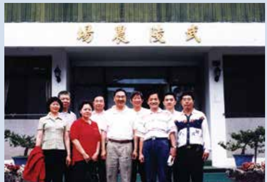
李副場長（右3）率員工赴武陵農場觀摩合影。

「人生如戲，戲如人生」，李副場長表示：進入輔導會農場，即抱定服務的人生觀，服務30餘年的公職生涯中，在輔導會農場，擔任服務的角色，在每個工作崗位上，均能全力以赴，戮力從公，內心時常自我吶喊著：「為輔導會農場工作，是一項榮幸，也是一份責任」，不斷自我激勵，希望在人生的舞臺上所付出的苦心及努力，沒有辜負長官們的期望，如此才敢輕輕地說，沒有白白地虛度此生。