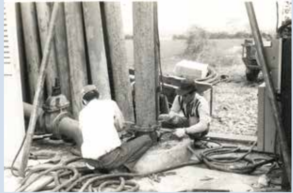
專業技術人員指導安裝灌溉水井設施。

早年農場大部分的土地都是河川沖積所形成之荒蕪砂礫河床地，因砂石多、土壤少，水土保持困難。場員們從雙手搬石頭、修築灌溉排水溝渠做起，初期以畜力耕作，到後來的農作機械化，都在本會積極規劃及資助，以及農業復興發展委員會、水利局等其他各單位的經費補助與技術協