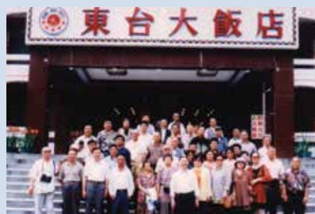
來場長（前中立）率員工自強活動。

來場長河南省安陽縣人，民國30年6月29日生，空軍官校46期、德國基森大學博士畢業，歷任農業顧問、副場長、副處長、場長。任內有效開發利用閒置土地，積極擴大辦理直、合營事業，大幅提升營收，自給自足率由59%提升至71%，力行行政革新、勤政、速捷、確實及教導員工電腦，提升工作效率。