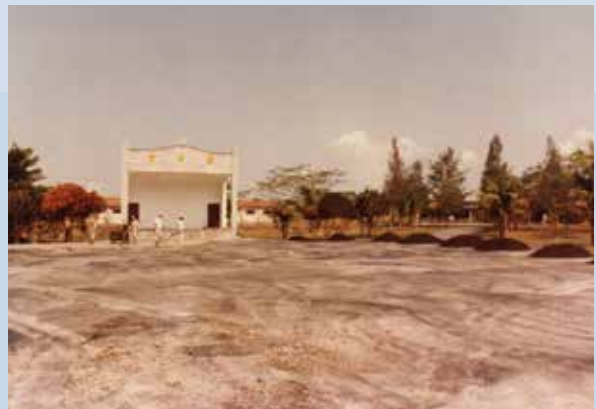
新建榮華堂廣場施工情形。