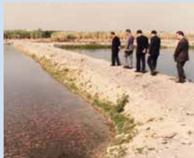
直營生產養殖尼羅紅魚情形。