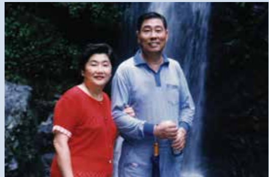
李場長偕夫人合影。

李場長山東省沂水縣人，民國28年6月12日生，陸軍官校33期、陸軍參軍大學、革命實踐研究院，歷任參謀長、副師長、師長、副軍長、處長、場長。任內貫徹輔導會農場簡併、人員精簡政策；積極改善高雄分場休閒設施，改善景觀，開發多項休閒遊憩設施，大幅提升業績，促使觀光休閒事業向前大步邁進並爭取整體規劃，奠定日後營運良基；加強場員配墾地放領工作，突破瓶頸，解決困難，使放領工作加速進行。