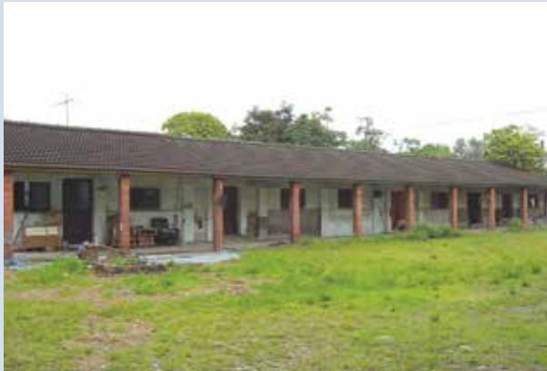
單身場員宿舍（磚造瓦屋）。