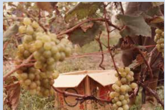
民國73年葡萄栽培結果情形。

為加強直營生產，於72至73年間場部完成開闢魚池9公頃。種植葡萄5公頃、培植蘭花0.5公頃、牧草100公頃等，開始辦理直營生產，並探求技術經驗，有成效之項目推介場員作生產參考。當時直營生產以水產養殖成效較佳，推介場員輔導生產，餘3項成效未臻理想。