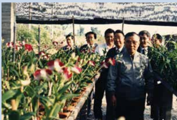
民國73年輔導會許前主委歷農先生視察秋石斛生長情形。