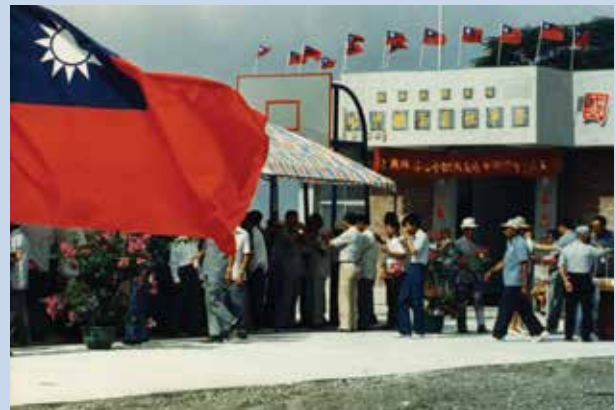
榮華社區活動中心於民國74年10月落成啓用。

69年間擴大推展農業機械化，新購曳引機、插秧機、聯合收割機、烘乾機、噴射霧機、動力脫谷機各