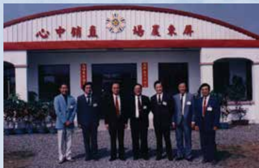
張場長（左3）與組室主管於農產品直銷中心。

張場長福建省東山縣人，陸軍官校31期、陸軍參軍大學62年班、三軍聯大戰爭學院70年班，歷任副師長、國防部處長、指揮官。任內辦理場員配耕地放領、興建場史館、農產品直銷中心、執行團結致富專案、籌辦休閒農場，後因本區經主管機關劃定為水源保護區，不符開發條件，本案因而停辦。