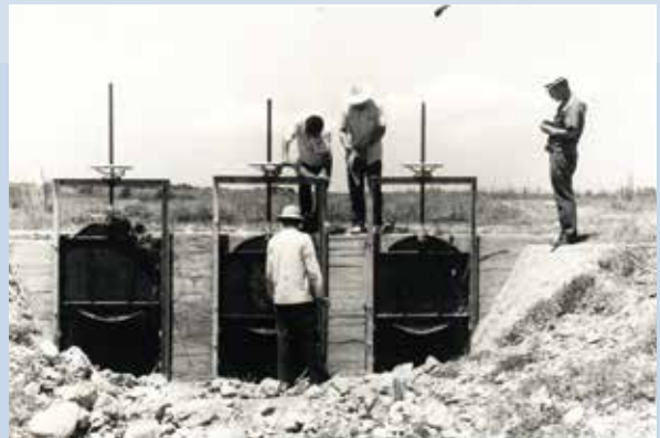
專家指導興建灌溉設施。