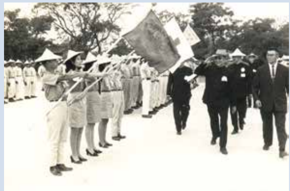
諶場長（右3）陪同輔導會長官視察永安演習。