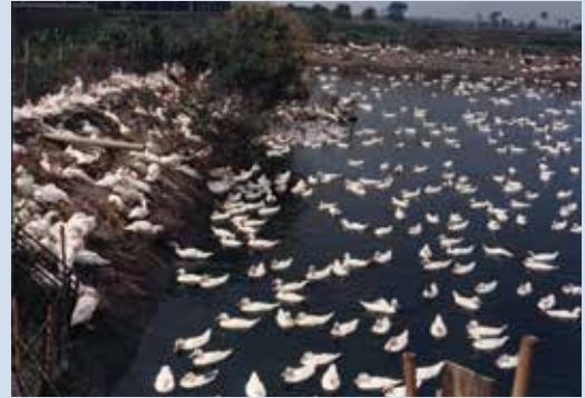
民國70年間推廣農漁牧綜合經營養鴨情形。

70年間政府推廣漁牧綜合經營政策，輔導會為輔導榮民提高生產收益，經政策輔導本場成立漁牧綜合經營區，面積8.4公頃，興建豬舍14棟（每棟飼養種豬8頭、肉豬60頭），搭配每口6分地之魚池經營漁牧生產。