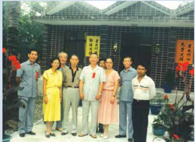
民國77年場史館新建完成啓用。

本場奉命於87年7月16日簡併高雄農場，並辦理人員精簡，簡併後高雄分場由輔導會投資6,300餘萬元整建，以經營休閒農場為主，爾後農場正式邁入觀光休閒與農業生產兩大主體之經營。