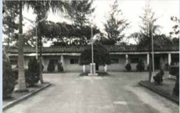
民國43年11月設立場部辦公室。