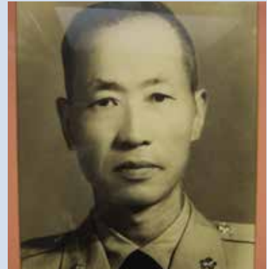
許場長著戎裝時英姿。

許場長湖南省永興縣人，民國9年2月9日生，陸軍官校16期、陸軍參軍大學正6期、三軍聯大戰爭學院正15期，歷任團長、處長、師長。任內繼續推展農業機械化，更新農業機具。與農林廳種苗改良場合作種植採種玉米50公頃及直營種植銀合歡10公頃。