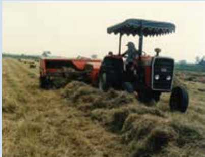
大面積牧草栽培機械採收情形。