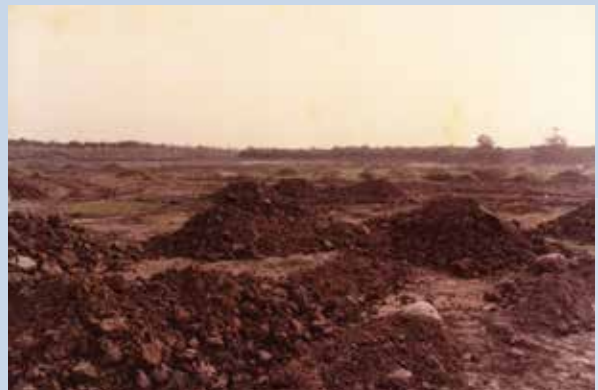
民國58年土地開墾後客土改良情形。