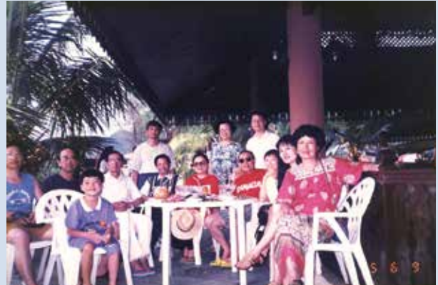
李副場長（左5）獲選民國84年模範公務人員接受行政院招待至馬來西亞遊玩時留影。

補助250萬元，建設汾陽社區排水溝，柏油路、路燈、社區活動中心設備等公共設施，在榮華莊爭取設置自來水，改善飲水衛生績效卓著。