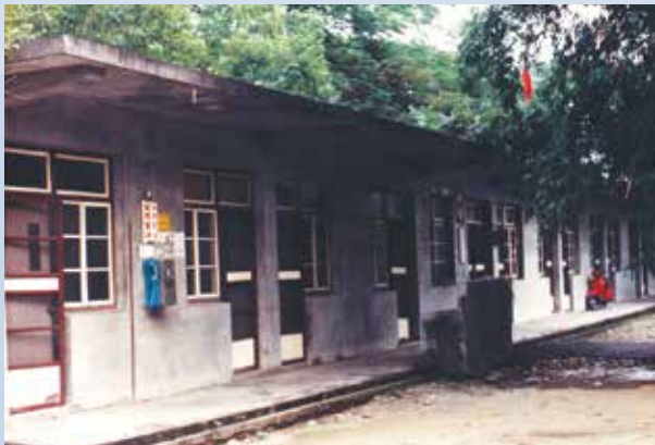
民國69年單身場員宿舍（鋼筋水泥宿舍）。