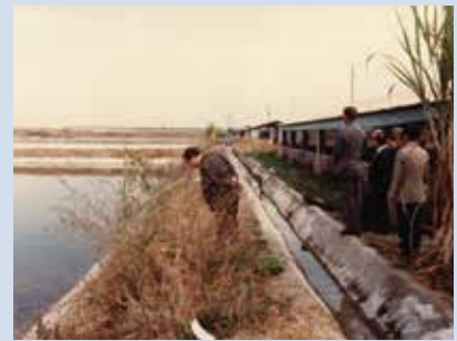
農漁牧綜合經營全貌。

為加強直營生產，於72至73年間場部完成開闢魚池9公頃。種植葡萄5公頃、培植蘭花0.5公頃、牧草100公頃等，開始辦理直營生產，並探求技術經驗，有成效之項目推介場員作生產參考。當時直營生產以水產養殖成效較佳，推介場員輔導生產，餘3項成效未臻理想。