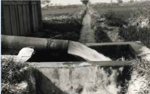
灌溉水井抽水情形。