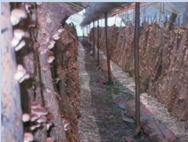
民國50年間本場輔導場員種植香菇情形。