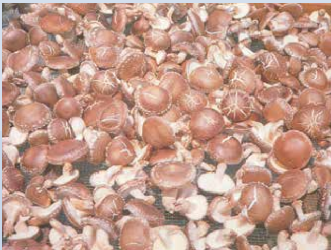
民國50年間本場場員種植香菇收成情形。