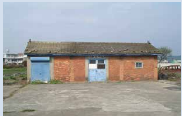
民國60年間興建的場員住家及曬穀場。