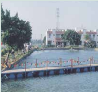
魚殖管理處設立之釣魚場。