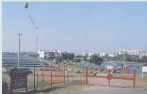
魚殖管理處設立釣魚場之入口。