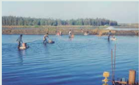
魚殖管理處彰化分場養蝦情形。

史葳林處長，曾任憲兵中將副司令。任內自港澳引進鰻線，於彰化分場由鰻線—幼鰻—成鰻至自行外銷一貫作業，減少中間商之剝削，間接照顧榮民生活。並且積極從事蛤蜊場高經濟價值之開發。