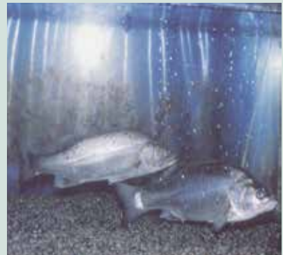
七星鱸魚在魚箱養殖之情形。