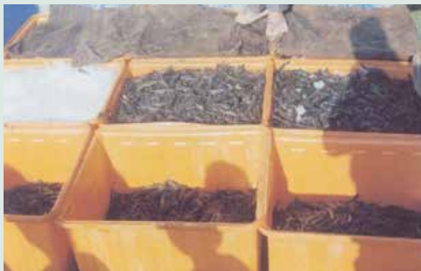
魚殖管理處彰化分場養蝦收成之情形。