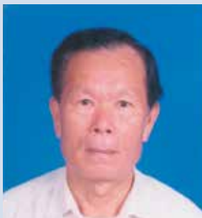
榮技術員的個人照。

談及在農場服務時最難忘的事，是當農場在中壢成立花卉中心時，榮技術員以本身在花卉栽培上的學問與專業知識，對花卉種子之培育、幼苗之栽培無不竭盡所能貢獻心力與技能，將花卉栽種得非常漂亮，花卉銷售的成果也非常的好。除了花卉的栽種外，印象最深刻的事就是拓土挖石、開渠引水之事，當時的農場土地大都是接收來自於日據時代的軍用飛機場，土層下面都是一層一層的大石頭，場員們非常辛苦的在自己所屬的耕地上一扁擔一扁擔的將地表下的大石頭挖除抬走，每一寸土地都是流血流汗換來的，挖除了石頭、石礫雜物後還要在堅硬的土地上建造數條能引水灌溉阡陌良田的溝渠，當時的場員真的是非常的辛苦。