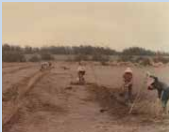
民國48年場員於新竹海埔新生地場員圍墾實景。