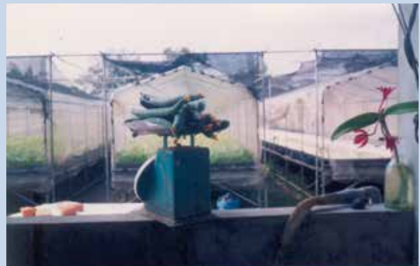
民國80年間本場種植之水耕蔬果碩大甜美。