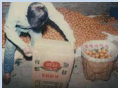
民國60年—70年間場員種植柑橘收成情形。