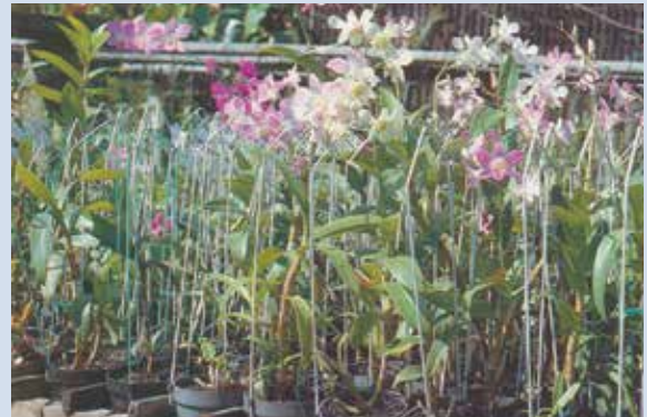
民國70年間本場花卉中心蘭花盆栽培情形。