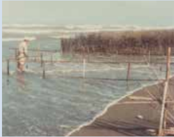
民國47年場員以攔淤法使海水流經時速減低，讓泥沙沉澱下來，使灘地漸漸變高。