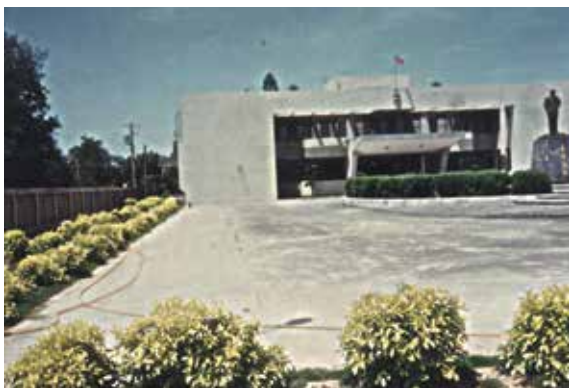
民國74年6月建造完成的新竹農場辦公室。

58年11月1日本場與「苗栗合作農場」合併改組，場銜改為「行政院國軍退除役官兵輔導委員會新竹農場」，場址位於新竹縣新豐鄉青埔子，轄區範圍北從基隆，南至苗栗。