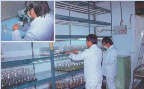
民國70年間中壢花卉中心工作實景。

本場中壢花卉中心成立於民國69年8月，隸屬於生產組，為直營事業，派有副技師1人，負責全中心之花木繁殖、培養、銷售等工作，另技術員、技