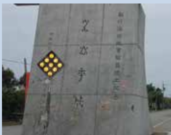
民國50年設立之海埔新生地開發紀念碑。

料用，以節省人力及時間。64年經向臺灣省政府農林廳申請補助新臺幣32萬餘元，興建育苗室（40坪）1棟，有育苗箱8,000個，此後不僅本場育苗工作方便，同時尚可代鄉民育苗。65年1月奉輔導會核定補助新臺幣28萬餘元興建農具倉庫1棟（20坪），並購置各項農機保養工具。68年奉輔導會核定補助新臺幣20萬元，改善竹南574公尺圳路工程及完成開鑿第12莊之水井工程。82年辦理中壢22莊自來水設施改善工程，動用經費439,000元。