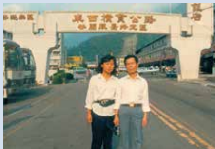
榮技術員於橫貫公路夫妻合照。