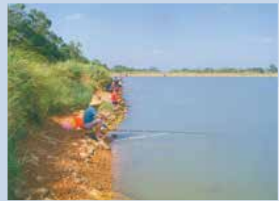
民國70年本場為發展水利及副業於青埔子興建大蓄水池（兼釣魚池）。