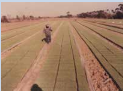
民國60年場員在水稻耕作區施肥情形。