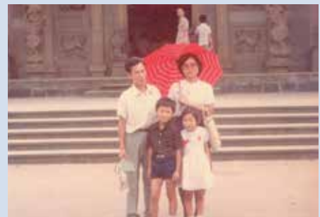
榮技術員全家福照。