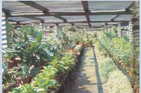
民國70年—80年間本場經營花卉有蘭花類、木本花、草本花、庭園花、蔓葉植物、蔓藤類、椰子類等各式大小花卉數百種。

工、工友各1人，協助副技師發展業務以及栽培管理工作。花卉中心位於中壢市榮民南路750號，距中壢市區4公里交通方便，全中心土地面積1公頃。