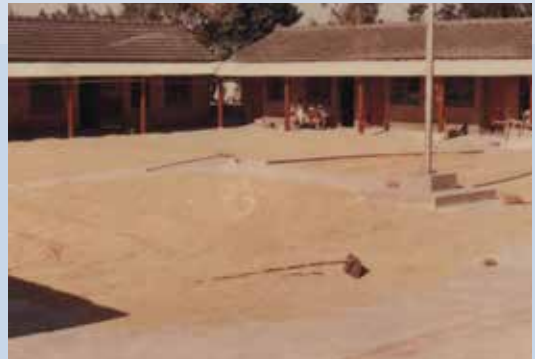
民國50年代本場建造的四合院式農莊，農莊的中央為曬穀場，農莊為本場的生產單位亦是場員居家安定生活的地方。

在增加場員生產能力、改善生活方面，61年邀請新竹改良場、新豐鄉公所、農會各主管、技術人員，及農莊代表等，召開機械墾植水稻一貫作業協調會，62年策劃水稻生產以機械代替人力實施一貫作業，節省人力，提高產量。62年3月水稻生產機械化一貫作業開始，共出動插秧機6臺，完成青埔區、竹南區插秧工作，作業面積共計達53.5公頃。63年為場員購置碾米機、碎石機各1台，供碾米及碾飼