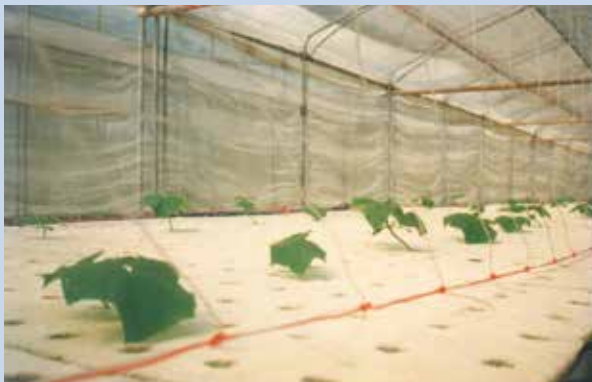
民國80年間本場發展水耕蔬菜種植情形。

為照顧場員生活，本場於59年完成青埔區整體計畫，並設立17至22莊為單身場員農莊，23、24兩莊為有眷場員農莊。60年完成青埔子社區之各項建設，