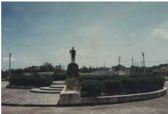
民國74年6月建造完成的新竹農場場區。

本場於51年7月1日奉令由臺灣省合作事業管理處改隸輔導會復管，場銜改稱為「臺灣桃園合作農場」，主要任務為安置國軍退除役官兵就業農墾，使其達成自給自足、改善生活、立業成家、安定社會之目標。