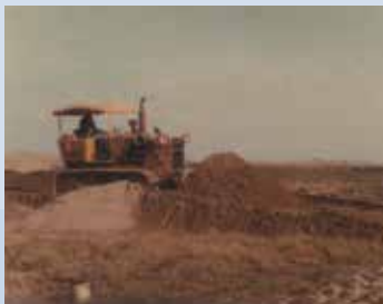
民國48年新竹海埔新生地開發情形。