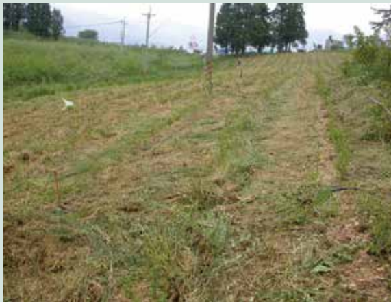
植草覆蓋後之一隅（攝於民國95年）。