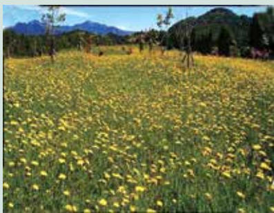
國土復育區另行撒播種子，花季時花海錦簇，非常熱鬧。