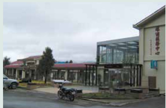
現代感十足的旅遊服務中心（攝於民國94年）。