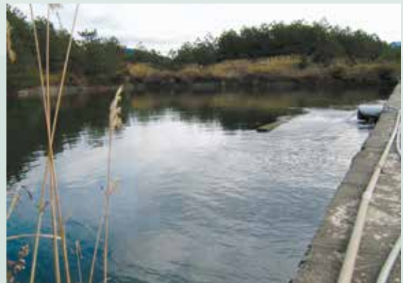
引自合歡山水源頭之儲水池（攝於民國75年）。

道路維修方面（產品之運出及材料之運進）為保持進出之暢通，方便旅行，本場除將主幹道拓寬鋪設柏油，並配合觀光將原主幹道拓寬為雙線道，並爭取地方政府補助將通往各莊之產業道路興建級配料道路（AC路面道）。