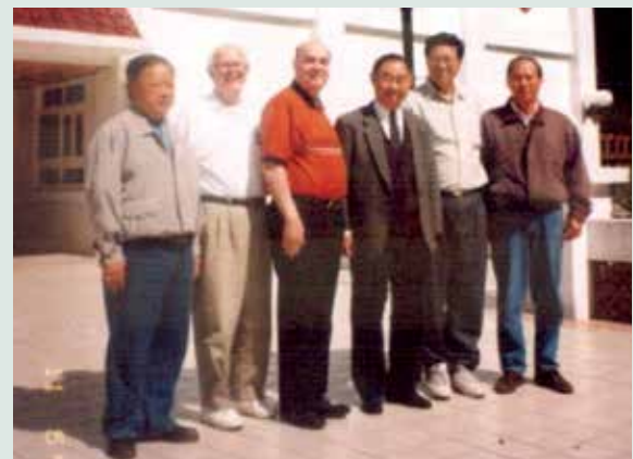
民國88年來勻德場長（右3）與外賓合影。

喜愛敦親睦鄰和梨山各單位及外界的互動良好，對場員（遺眷）關係及當地居民亦常保持聯繫。