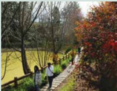
鴛鴦湖現已為遊客來場必定造訪之景點。