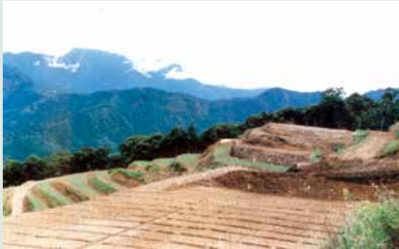
水土保持之平台階段（攝於民國74年）。