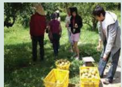
果樹認養活動已成為高山農業結合觀光體驗之成功典範。