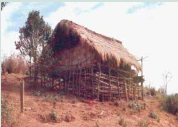
草創時期（民國47年）之茅草屋。

農場成立以來即依據輔導會安置條例，於場本部及華崗分場安置場員，至78年止，共安置場員361戶，有眷場員配耕0.75公頃，無眷場員0.5公頃，為使場員進場後即可從事生產，場員進墾前均先完成土地規劃、構築道路興建莊舍、灌溉設備及飲用水等，並供給必要之生產與生活設備，以及無息貸款，場員生產之所得悉歸榮民所有，政府及農場並無收取任何服務費用，83年奉令辦理場員土地放領，經歷數年於91年結束，共計放領357戶，面積266.7公頃。