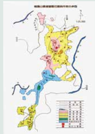
場區轄地及作物分布。

本場地理環境位處東西橫貫公路中點梨山之後山，距臺中、宜蘭、太魯閣等皆為110公里左右，由林務局國有林班草生地撥借，場部距梨山7公里，土地橫跨臺中、南投兩縣，總面積800餘公頃；標高自1,450公尺至2,570公尺之間，場部所在地2,240公尺。大多數土地在2,200公尺至2,400公尺之間；氣溫夏季最高溫攝氏27度，冬季最低溫攝氏零下8度，全年平均溫度攝氏12度，4至10月作物生長期平均溫度攝氏16度；年平均雨量為2,000公釐左右。