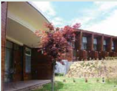
楓林雅築小木屋工程完成現況。

民國84年本場正式發展觀光休閒，短短數年本場在軟硬體設施上已興建成完成旅遊中心、小木屋、宋莊、露營區及整修松廬、唐莊等住宿區，雖然觀光休閒起步較晚，但因自然資源豐富，有果園茶園、遍地野生之貓兒葉菊、具歐美景色之露營區草原、具芬多精之森林步道及茶廠大波斯菊花海等暨歷史古蹟—先總統 蔣公生前之休憩地福壽山莊、天池達觀亭等。在休閒旅遊方面發展果樹認養之活動，建立獨立網站，供民眾上網查詢及訂房，並依季節提供具特色之餐飲且舉辦各項活動及提供特別之農產品—如福壽長春茶、茶包、蜜蘋果、水蜜桃、蘋果乾、梨乾等，配合宅配送貨到家；本場又於93年完成松廬、宋莊、福壽館之整修，94年完成鴛鴦湖、旅遊中心之整建；為配合國土復育政策，94年在天池地區廣植景觀樹種（槭樹及櫻花）。