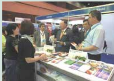
積極參加國內外大型旅展活動，開拓廣大旅遊市場。