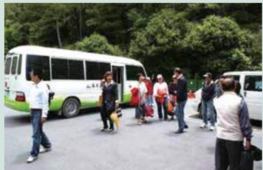
推出蘋果號套裝專案，提供遊客更加便利及放鬆的旅遊行程。