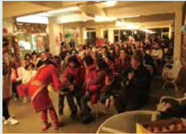
每年定期舉辦各類具特色之精彩活動，吸引遊客來場。

考量本場位處偏僻高山地區，為擴大服務範圍並方便遊客來場，98年度開始推出蘋果號團體專車接送服務，有效縮短遊客到場交通時間，102年度總計出車332趟，服務人數總計達6,640人次，收益達2,876萬2,001元，大幅拓展旅遊事業經營績效，每年為清境及武陵帶入遊客各約4,000~5,000人，並達成友場間之策略聯盟。另本場利用高山壯麗景觀、宜人氣候及人文特色，推出1至2週、1個月等優惠long stay住宿案，推出後反應熱烈，客源逐漸增加，滿足各類族群旅遊需求。102年度long stay房數總計達576間，收益達92萬1,119元，業績持續穩