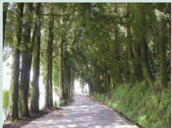
青蔥蔭鬱主幹道（攝於民國95年）。