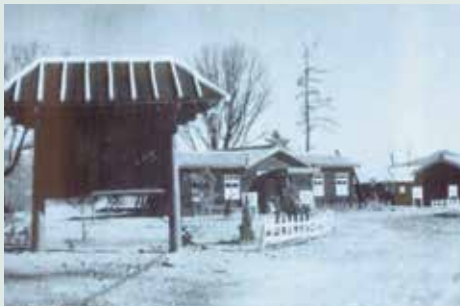
草創時期（民國50年）之場本部。