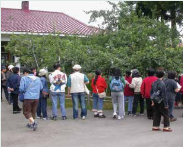
蘋果王門庭若市之盛況。