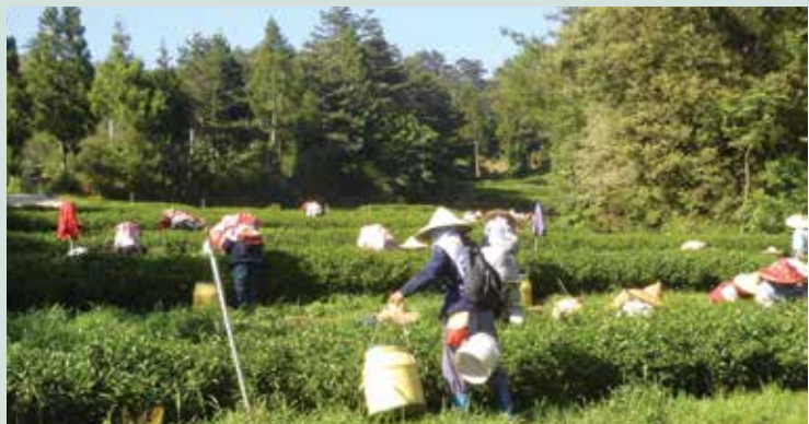
採茶之盛況（攝於民國94年）。