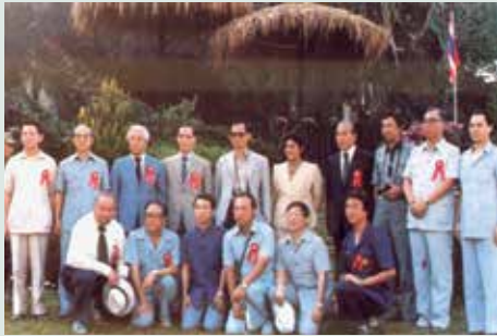
民國73年鄭主任委員（後排左4）與泰王（後左5）及詩玲公主（後排右5）合影。