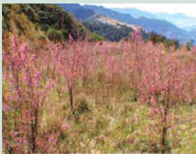
國土復育區種植櫻花，已逐漸成林，花季期間，遍野綻放吸引遊客。

史古蹟—先總統 蔣公生前之休憩地福壽山莊、天池達觀亭等。在休閒旅遊方面發展果樹認養之活動，建立獨立網站，供民眾上網查詢及訂房，並依季節提供具特色之餐飲且舉辦各項活動及提供特別之農產品—如福壽長春茶、茶包、蜜蘋果、水蜜桃、蘋果乾、梨乾等，配合宅配送貨到家；本場又於93年完成松廬、宋莊、福壽館之整修，94年完成鴛鴦湖、旅遊中心之整建；為配合國土復育政策，94年在天池地區廣植景觀樹種（槭樹及櫻花）。