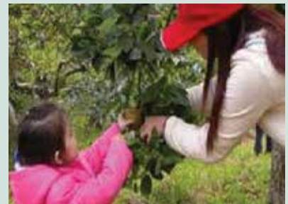
果樹認養活動兼具教育性及趣味性，吸引遊客攜家帶眷一同參加。

果樹認養活動兼具教育性及趣味性，舉辦10餘年來廣受好評，認養株數年年增加，從民國84年起研擬舉辦，由初期50株開始，每株3,000元，迄今開放蘋果670餘株，每株5,000元，為農場創造絕高收益（因為來場採收的認養者以一車5人計算，需住宿2間客房，至少使用中、晚餐一次並且繳交認養費），採果時期同時推出旅遊優惠措施成功提升住宿率，每逢採果季節一房難求，儼然已成為農場之招牌特色活動，有效達成高山農業結合觀光體驗活動之成功典範，提升生態農業產值及帶動旅遊事業之附加效益。101年旅遊服務中心配合果樹認養活動，同時推出非假日採果住宿優惠活動，認養期間憑認養證假日住宿85折，非假日65折優待。為避免往年預約採果遊客訂不到房間客訴事件之發生，102年起將預約採果措施全面改為現場採果方式辦理。