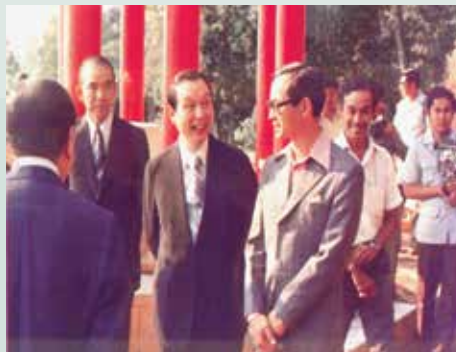
民國68年趙主任委員（左3）與泰王（右3）及畢沙迪親王（右2）合影。