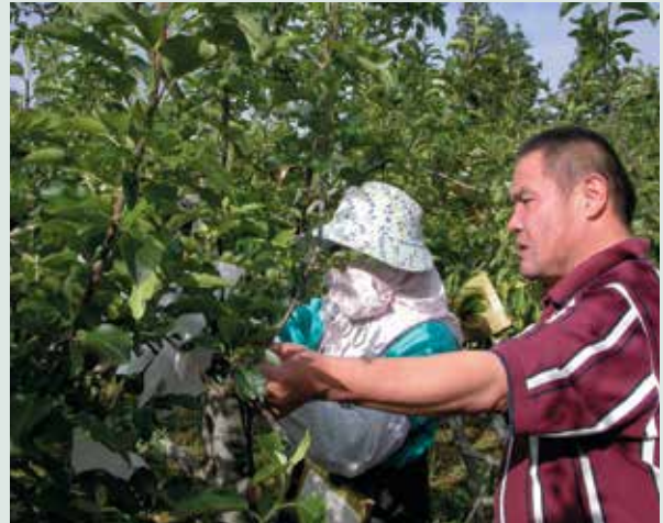
蘭組長（右）指導套袋。

現今全世界尚無一棵樹長滿數十種蘋果的紀錄，福壽山農場的蘋果王可稱為世界第一，亦顯現我國農業的高超技藝，值得國人的慶讚與肯定。蘋果王的嫁接與栽培管理是一項超級任務，嫁接過程中手指被刀削傷或從梯上摔下，是常發生的事，颱風造成接枝的斷裂，心血白費，次年又須重新嫁接，頗令人傷感；栽培管理作業從冬季落葉後的整枝修剪及果樹生育期的蔬果、施肥、病蟲害防治等等，都必須把蘋果王當成自己小孩般的細心呵護，