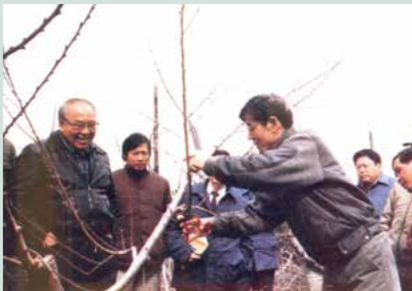
民國70年日本專家實地教導修剪果樹。

民國58年，前駐泰國大使沈昌煥陪同我國陸軍總司令于豪章將軍晉見泰王，泰王談及泰北山區少數民族生活困苦而多種植鴉片，為減少人民對鴉片的依賴，特成立「泰王北部山地計畫」並請我國在農業上支援該計畫，經政