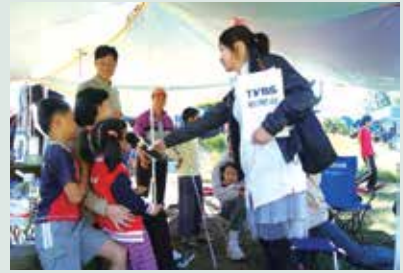
邀請各大媒體來場採訪，提高旅遊知名度。