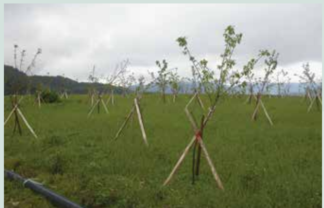
天池菜地於民國94年底完成景觀植生造林。