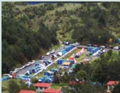
露營區以生態景觀吸引遊客前往，每逢假日人潮湧入，非常熱鬧。