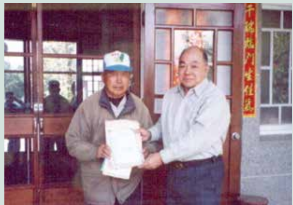
民國91年4月23日朱場長（右）頒發土地所有權狀。