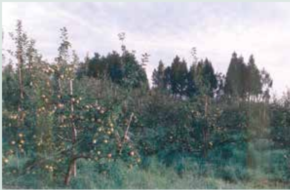
柳杉林屹立不搖捍衛蘋果樹（攝於民國80年）。