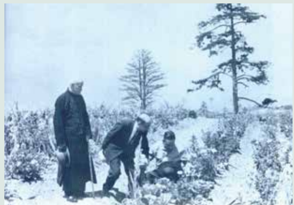
民國56年先總統蔣公與經國先生於果園中。