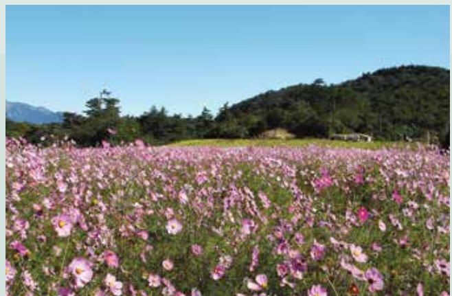
菜地於民國93年底收回，造林前的景緻。

民國93年7月2日至4日，本省下豪雨達725公釐，導致各地發生嚴重災害，本場直營農地由於水土保持設施良好，故七二水災本場並未有災害發生，惟為配合政府國土復育之政策，本場將菜地及果、茶園等合計76.0938公頃，已於96年底全部廢耕執行復育完畢，目前每年落實復育地撫育工作，持續補植山櫻花、楓樹、槭樹等具觀賞價值之樹木，提高視覺景觀及土壤涵養功效，兼具生態復育及景觀美學，營造本場成為農、林並貌之生態遊憩農場。