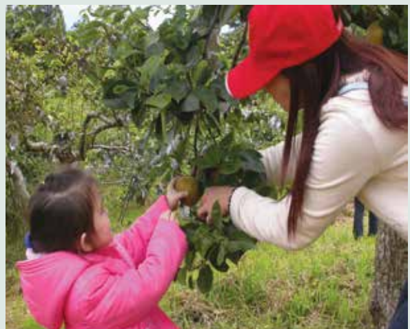
果樹認養活動-親子採果樂。