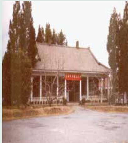
現今之場本部（攝於民國64年）。