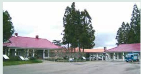
復古風的場部辦公室（攝於民國90年）。

本場現有直營農地計有菜地30公頃、果地73公頃、茶園14公頃，共計117公頃，為配合國土復育政策現僅保留29公頃之果園、14公頃之茶園。