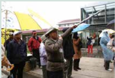
辦理行銷志工講習訓練，逐區逐點拉攏旅遊業績。