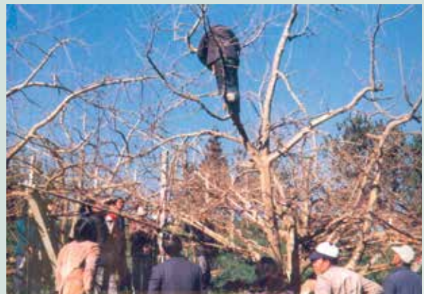
民國70年學員們實地觀摩修剪。