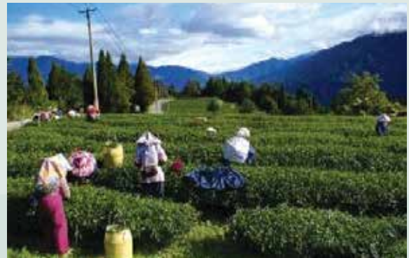
生產高品質之福壽長春茶，名聲享譽海內外，近年來產量已供不應求。

98年度起已先後完成茶區灌溉設施、茶區風扇防霜設備、第三製茶廠及萎凋室等各項工程之興設改善，提升茶葉製作品質。近年來直營生態農園持續朝向有機方向精進生產技術，以安全、無毒管理方式生產高品質農特產品。除目前已完成之茶葉履歷驗證以外，並將持續辦理果品等其他產品之履歷驗證工作，常態性辦理農藥檢測及營養成份，以強化本場產品品牌形象，確保食用品質及安全。