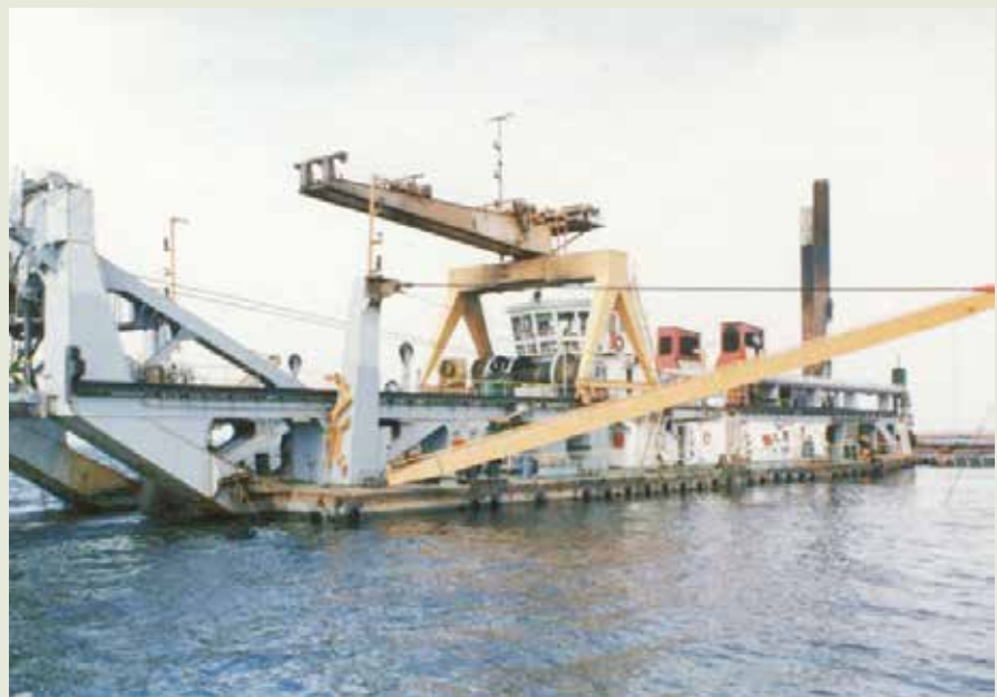
海事工程隊之主力船之一-10,000匹馬力的大興號挖泥船。

62年榮工處為承辦臺中港一期工程，由臺中港務局（原臺中港工程局）借貸3億5,800百萬元，向國外租購建港工程工作機36艘，另向國內購置72艘，由臺中港施工處成立船舶隊統一調派，另將挖泥造地部分交由浚渫工程隊辦理。