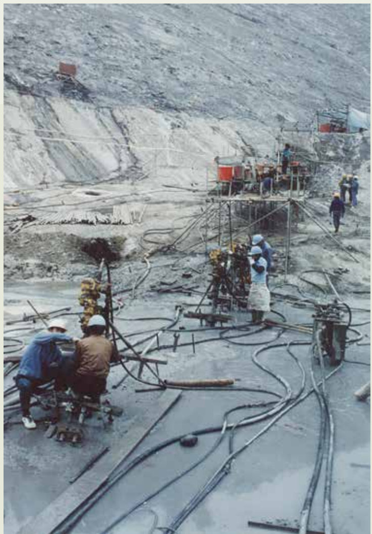
基礎工程隊的大壩壩基灌漿作業。

基礎工程隊繼承了曾文水庫大壩灌漿隊的精神，從艱困中不斷的求新、求變，成立的初期，施工機具仍然缺乏，嗣後因十大建設大鋼廠的鋼管樁打設，購買了打樁用的震動樁錘，隨後進行臺中港的打樁工