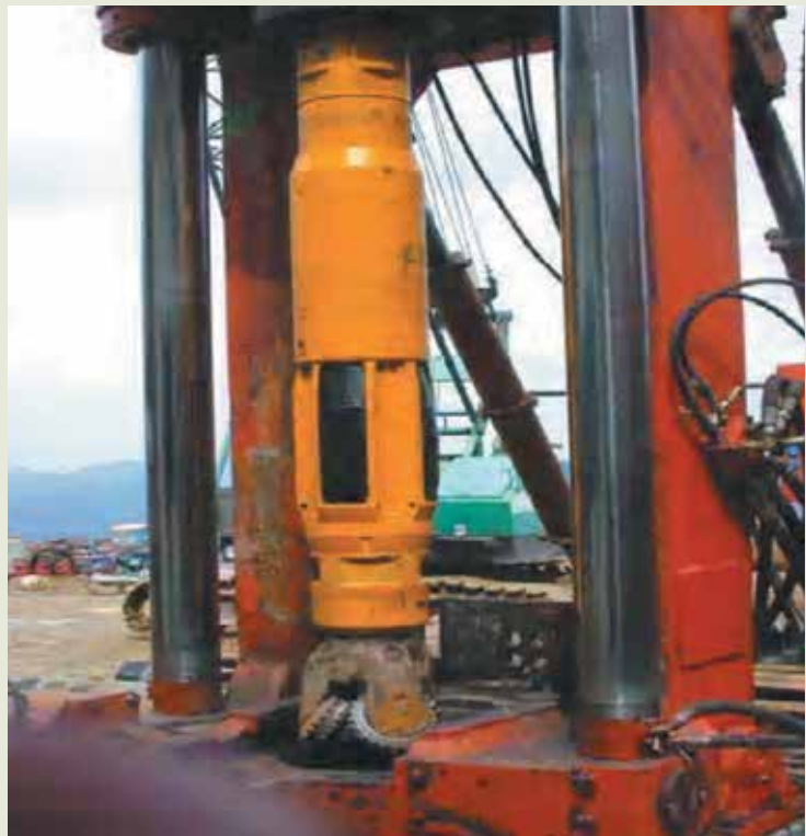
雪山隧道第1號豎井工程由榮工引進的昇井工法導向鑽孔系統。

有鑑於事業與技術的不斷發展，榮工處於67年在總工程司成立研究發展組，並結合國內各工程單位及顧問公司之力量發展更精進的技術。例如70年5月與國立臺灣大學及國立