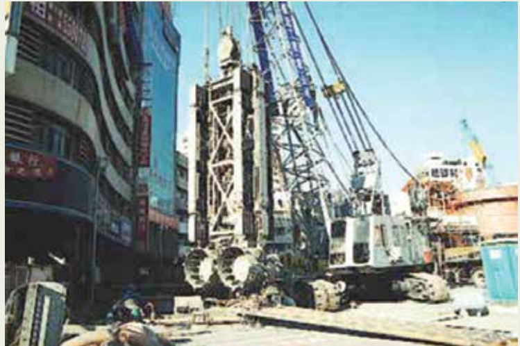
地下連續壁為榮工60年代引進之工法，上圖為榮工在高雄捷運首次以EMX-150鑽機做1.8公尺厚之地下連續壁。

先進工法、預鑄節塊懸吊工法等新進的技術，公司特別利用承接新式橋樑工程的機會，成立「橋樑施工技術移轉小組」，培養訓練專業人力，提升橋樑施工設計自主能力。這段期間，榮工完成的臺北市區鐵路地下化萬華板橋專案（含新店溪河底隧道）、東部鐵路改善新觀音隧道、雪山隧道、臺北101大樓及施工中的核四循環水出水道工程、高雄捷運工程、臺北捷運新莊線工程、哥斯大黎加臺灣友誼大橋工程等，也都啟用許多新的工法，如雪山隧道的隧道全斷面鑽掘工法（TBM）、核四出水道、臺北捷運新莊線過河段的冷凍工法及高雄捷運大圓形連續壁，都是世界級頂尖的施工範例。