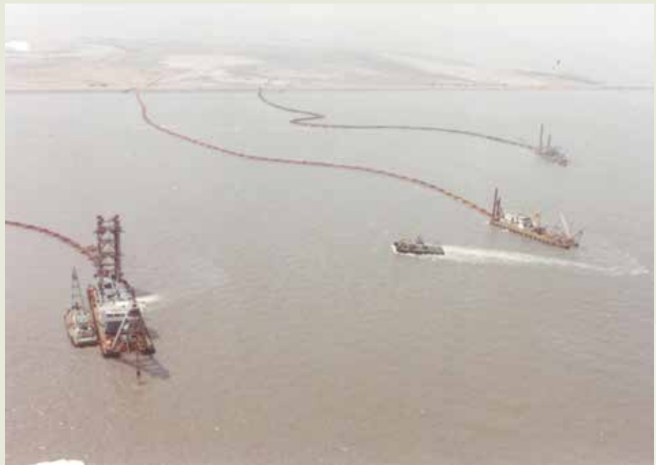
浚渫工程隊的挖泥船在彰濱工業區鹿港區進行抽砂填土作業。

榮工與香港阿羅札公司的合作，是擔任該公司的小包商，當時，阿羅札公司得標承辦越南金蘭灣浚渫工程，他們有設備、有船，卻沒有人力。他們聽說榮工處的浚渫隊完成了臺北基隆河改道工程，擁有大小5艘挖泥船，就主動來臺與榮工洽商，借用榮工的工作人員前往越南工作，也就是說，他們只商借人力而非設備，只是勞務與技術的輸出。當時談妥的施工費用是每挖泥一方付美金1角，總工作費才美金25萬元，折合新臺幣尚不足1千萬元。不過由於工作人員的驚人表現，在一年的合約期限內挖泥500萬方，超出合約1倍以上，工程費也增為美金50萬元。