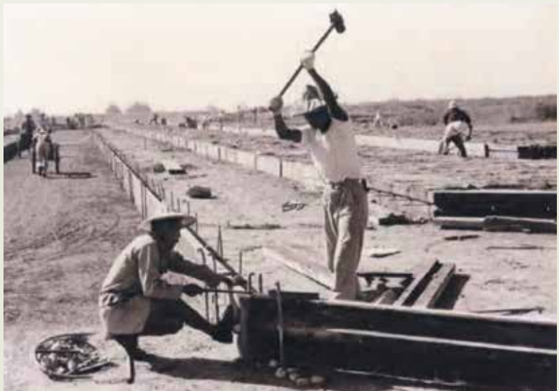
屏東機場擴建工程的人力施工。

工所承建的建築工程，多為獨棟3至5層的鋼筋混凝土構造物，結構單純，基礎不深，如臺北監獄、白河榮家、陽明山的森林賓館等。屏東機場擴建工程在開挖整地及澆置混凝土時，均使用大量的人力，僅有少量的手推機具。當時的施工技術以採用勞力密集的工法為主，輕型機具為輔。成立初期，大部