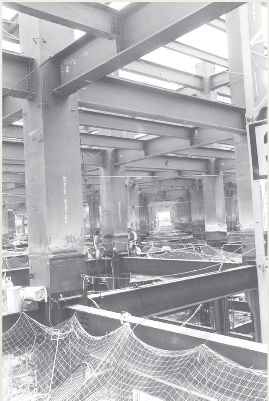
機電工程隊在臺北榮總更新計畫工程的鋼構作業。