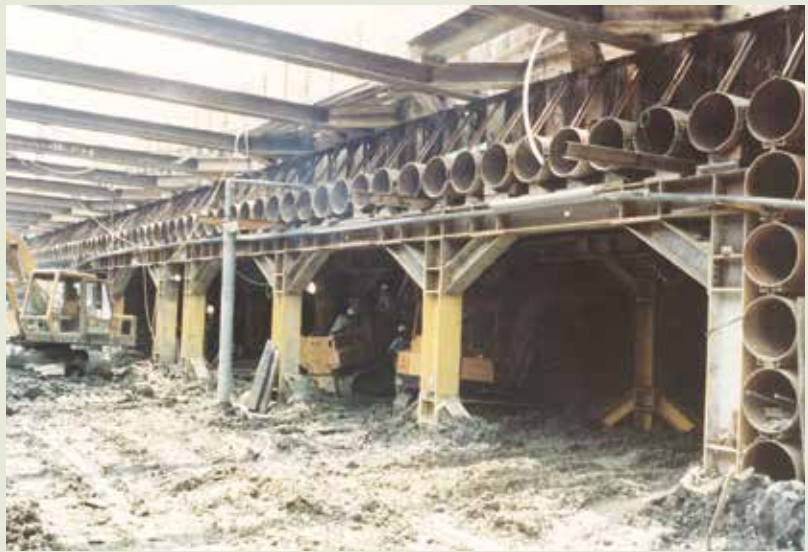
榮工引進、使用於高雄博愛地下道的管幕工法。

管幕工法係榮工處於76年自日本引進，開挖時以鋼管支撐，形成管幕，在不干擾或破壞地下物之情形下，進行地下開挖。榮工處承辦之高雄市博愛路地下道穿越火車站工程、縱貫鐵路山線三義一號隧道北口明挖段穿越中山高地下工程部分、東線鐵路新觀音隧道北口，即採用管幕工法施工。