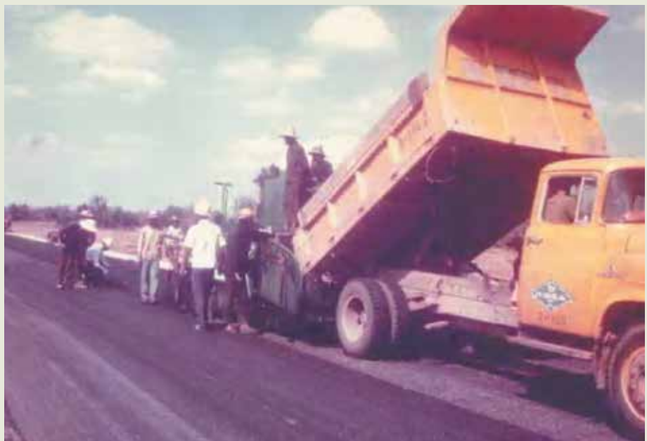
路面工程隊弟兄在國內學技術，也有機會到國外做工程，圖為泰國道路工程施工。

路面工程隊於61年12月撤銷，在短短的5年中，這支路面工程隊伍已經使臺北市的市區道路面目一新，同時使國內的路面施工全面走向機械化。59年，榮工處接受政府委託，派遣技術小組前往中非共和國擔任公路工程技術顧問，指導鋪築瀝青路面，同時路面隊培育的路面工程人員，也到海外承做道路工程。