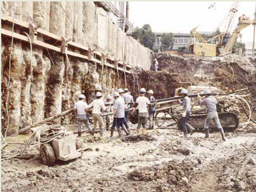
基礎工程隊的地錨施工。

到68年，由於中鋼第1期第2階段工程、臺電興達火力發電廠工程、蘇澳港建港工程等同時進行打樁，基礎隊又引進新式打樁機，使打樁的能力更形提高，設備也增加到成立初期的5倍以上。