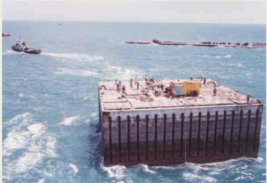
海事工程業務之一海上沉箱拖放。

到了66年7月，為了管理與業務上之需要，榮工處將浚渫工程隊與臺中港施工處船舶隊，合併改組為海事工程隊，除擁有8艘中型絞刀式挖泥船，總馬力為27,000匹（包括臺中港航道浚挖工程向荷蘭購置之6,600匹馬力大華號挖泥船），另擁有各型工作船機70餘艘，