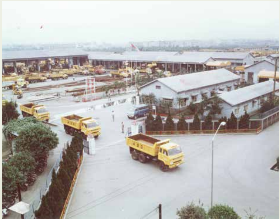
早年的機械工程隊後來發展為板橋機械修配總廠。

由於工作型態的變化，機械工程隊於63年6月撤銷，業務併入新成立的機械人員調配訓練中心。榮工的機具設備後來又在國家各項建設中持續運作，高