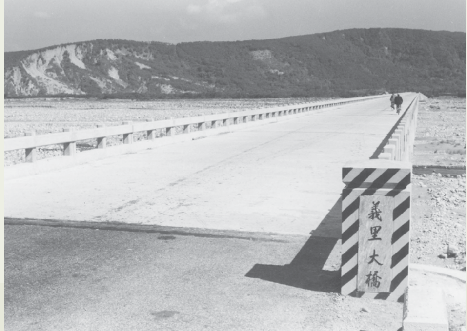
橋樑工程隊完成的第一座大橋—臺中義里大橋。

隨著時代的進步，國內營造水準的提高，橋樑工程隊在61年12月撤銷，橋工隊前後11年對榮民工程事業及國家社會都有很大的貢獻。