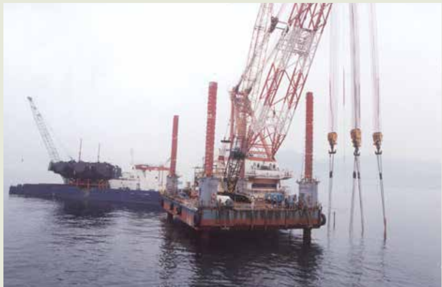
榮工承攬臺電核四循環冷卻水出水道工程，啓用多項新工法，圖為排水頭J型管海上吊裝作業。

這一時期，政府的各項公共工程，不但求實用，在設計上還要兼顧美化及文化內涵，工程施工方法隨著人類科技發展而不斷推陳出新，像橋樑就廣泛的採用新穎的鋼拱橋、斜張橋設計，而預力混凝土橋樑施工採用懸臂節塊工法、節塊推進工法、支撐