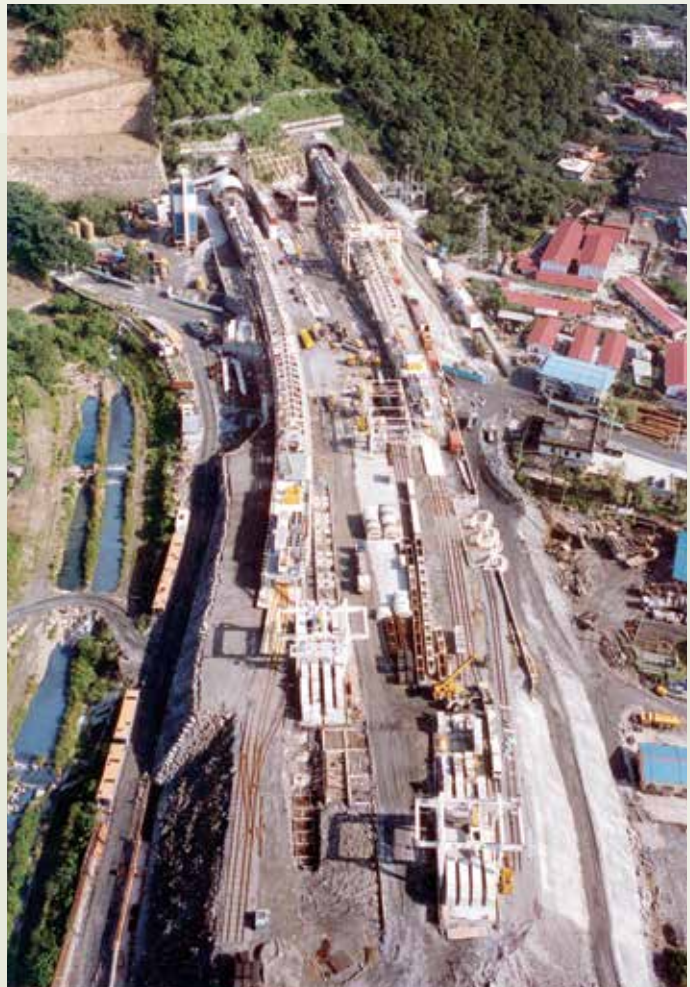
榮工引進隧道全斷面鑽掘 (TBM) 工法，進行雪山隧道施工。

從1954年於加拿大多倫多硬岩隧道以機械開挖成功以來，至今全球已近1,200座隧道工程，採用硬岩隧道鑽掘機TBM (Tunnel Boring Machine) 施工，這種施工工法，也即我們所指的隧道全斷面鑽掘工法。榮工處承辦亞洲最長公路隧道—高速公路雪山隧道 (長12.94公里) 工程，根據合約規定引進TBM，隧道全斷面鑽掘工法施工，創下主坑單月掘進238公尺及導坑400.8公尺之實績，雖然由於地質關係在雪山隧