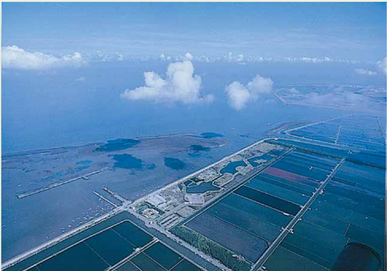
雲林離島工業區新興區。

近年來全球經濟波動劇烈，大陸挾廣大市場及便宜勞力，利用極優惠之條件吸引國內廠商前往投資，致國內工業區用地的需求停滯；另國內設廠用地尚有政府預算支援之科學園區及加工出口區，造成政府工業主管機關委辦開發之一般工業區嚴重滯銷，榮工公司在80年代以前配合政策參與工業區開發曾有榮