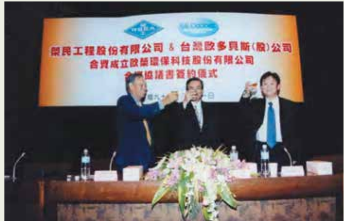
榮工公司環保水處理業務首先完成民營，與臺灣歐多貝斯公司合資成立歐榮環保科技公司，簽約儀式中雙方首長舉杯互祝。

公司改制成立後，加速調整投資方向及財務結構，以增加工程業務量及提高獲利率，如以BOT方式投資高雄捷運公司。同時，針對業務內容及性質差異，與民間企業合資成立新公司方式，完成公司相關業務的民營化目標，如分割環保、砂石、礦業業務，與民間企業合資成立之達榮環保公司等公司，效益顯著。直到98年11月1日，營建本業以轉投資方式與亞翔工程公司合資成立的榮工工程公司，公司進入清理階段後，仍持續推動其他相關業務民營化工作。