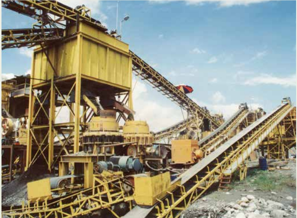
以機械化自動生產砂石料的高雄工場。

區設有10個場站，生產砂石各型機具共130餘部，並有各類重型車輛配合作業，每年生產砂石約175萬方，營業額達到每年新臺幣4億5千萬元，在國內是規模最大的砂石工廠之一。