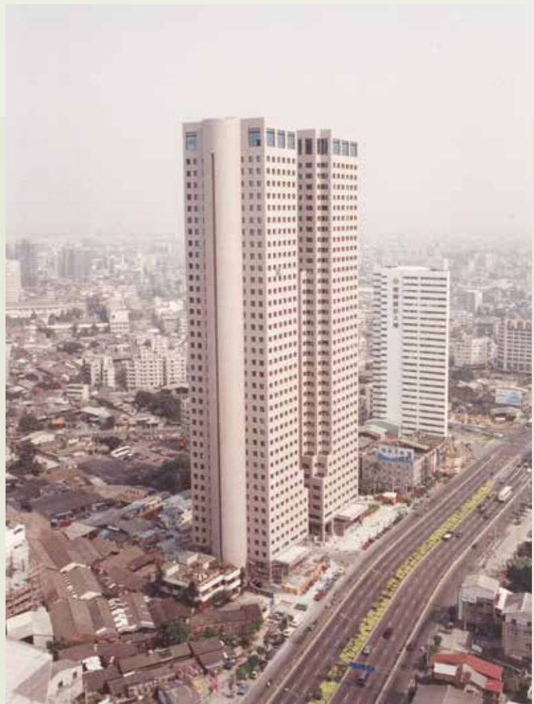
榮工完成外牆預鑄版製作吊裝的臺中世貿雙星大樓。