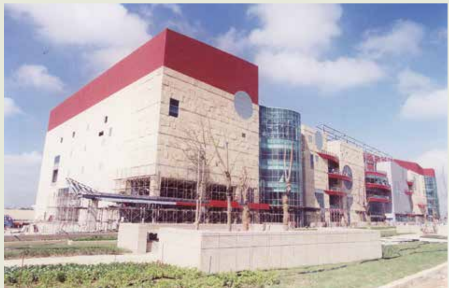
新建中壢家樂福購物中心之營建管理。