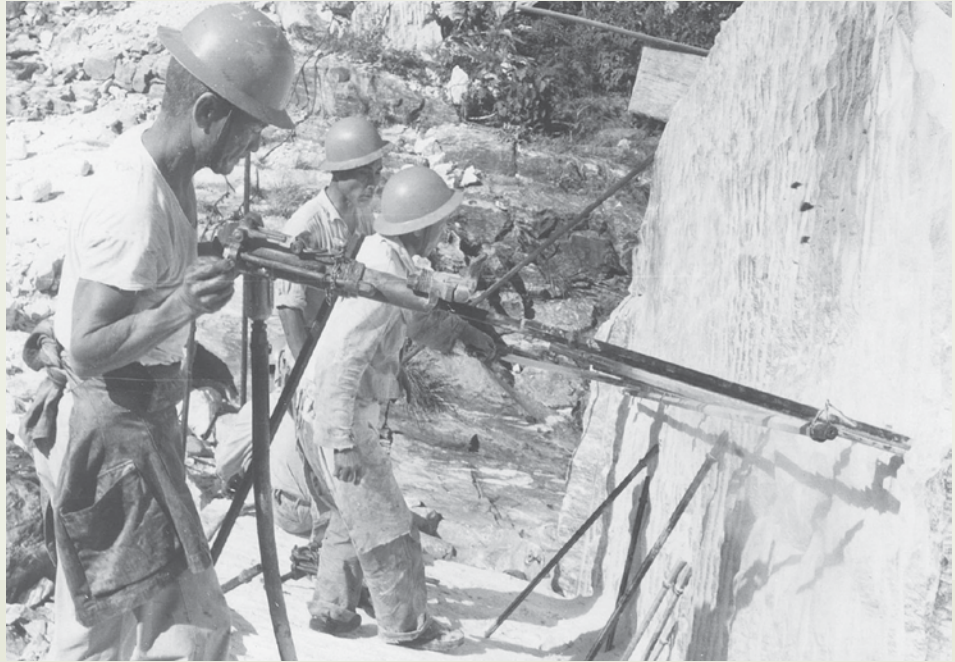
大理石工廠早期的石礦開採。

74年底，大理石工廠籌建花崗石加工設備，並於75年2月開工生產，為多角化經營邁向新里程。75年初臺北市中正紀念公園內的國家劇院及音樂廳大理石工程，又由大理石工廠承辦，從繪圖、加工、以至於安裝，採連貫而精密的