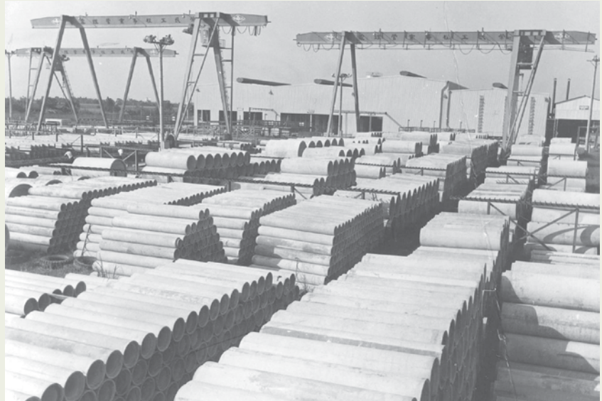
中壢預鑄工廠的預鑄產品。

置場、修配場等，共6棟廠房，佔地約2,000坪，專設全自動化的混凝土拌合場一座，預鑄房屋版片儲存場佔地約3,500坪，可容約1個月的成品儲存；另外還有預鑄水泥管儲存場、預鑄帷幕牆儲存場、辦公大樓、宿舍大樓，設施新穎齊全。