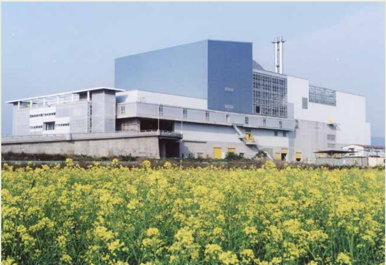
雲林縣焚化爐工程。

由於環保業務整體服務能力之提升，榮工也得標承辦了東引的海水淡化廠，並代為營運。進而配合政府公辦民營政策，榮工公司得標承辦「新竹工業區下水道系統營運」及「觀音工業區下水道系統營運中心一之委託經營案」。