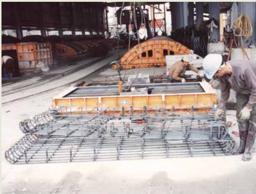
中壢預鑄工廠預鑄生產線。

開第1棟預鑄住宅工程。這1棟預鑄住宅位於中壢住宅社區內，為4層樓8戶雙併式建築，於同年8月19日完工。該棟預鑄房屋工程施工期，國內著名的學術機