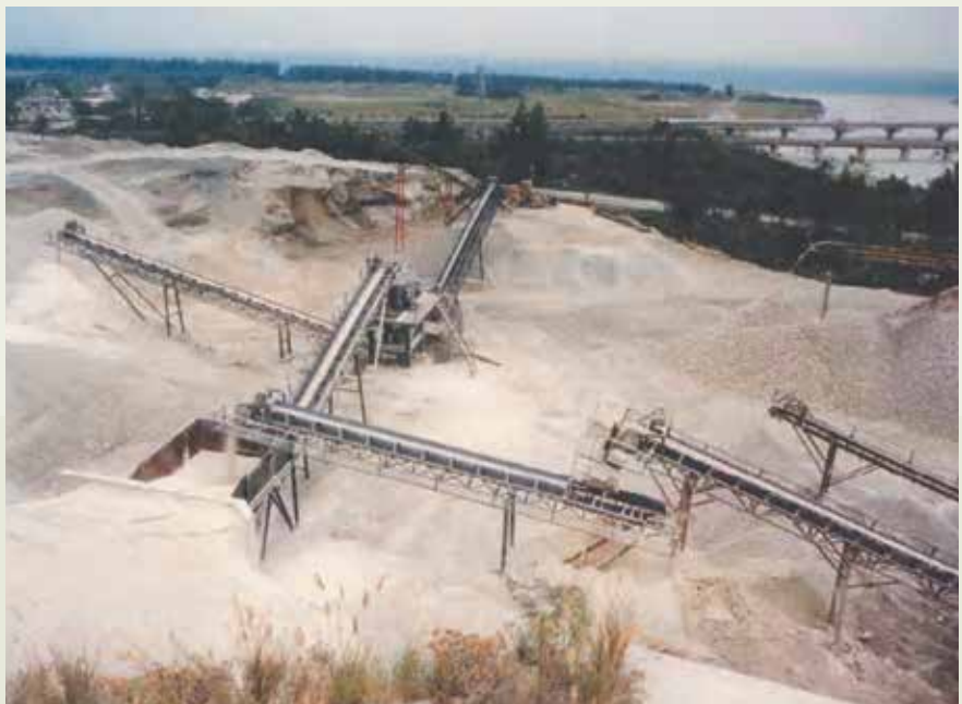
大理石工廠三棧礦區的石灰石開採。

54年因參加萬國博覽會而開發了日本市場。63年與業者協力經營中東的建材市場，70年開發了美國家用大理石市場。大理石工廠雖然以精良的技術，完美的品質向國際間開拓了臺灣大理石的產品，但都不以獨佔市場為成就，反與業者分享市場成果，以共同開發大理石市場為傲。