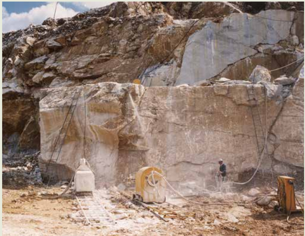
大理石工廠由義大利引進的索鋸工法，操作安全，省人省力。

75年4月引進義大利金鋼索鋸，替代傳統石材開採所用之鑽孔劈楔法，提高產能。工藝品圓材（粗胚）生產原是由手工打製，60年演變為鎢鋼套筒機，74年9月又發展為金鋼自動套筒機。毛板加工原使用傳統砂拉鋸，67年，大理石工廠自行研製金鋼拉鋸，不但節省大量外匯，且毛板品質隨之提高。地磚加工，由過去裁切正材毛板，自69年起演變為以自動切割機（俗稱十字