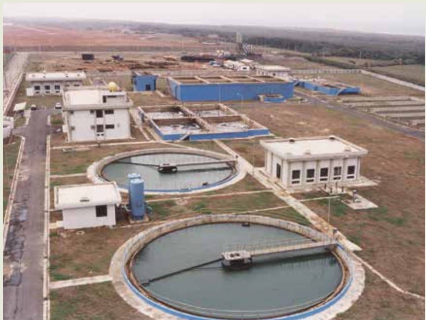
觀音工業區污水處理廠。

榮工也配合行政院衛生署、環保署及輔導會等單位所擬訂之規章制度，為臺北榮民總醫院、桃園榮民醫院等醫療機構，興建感染性廢棄物焚化爐設施，並增