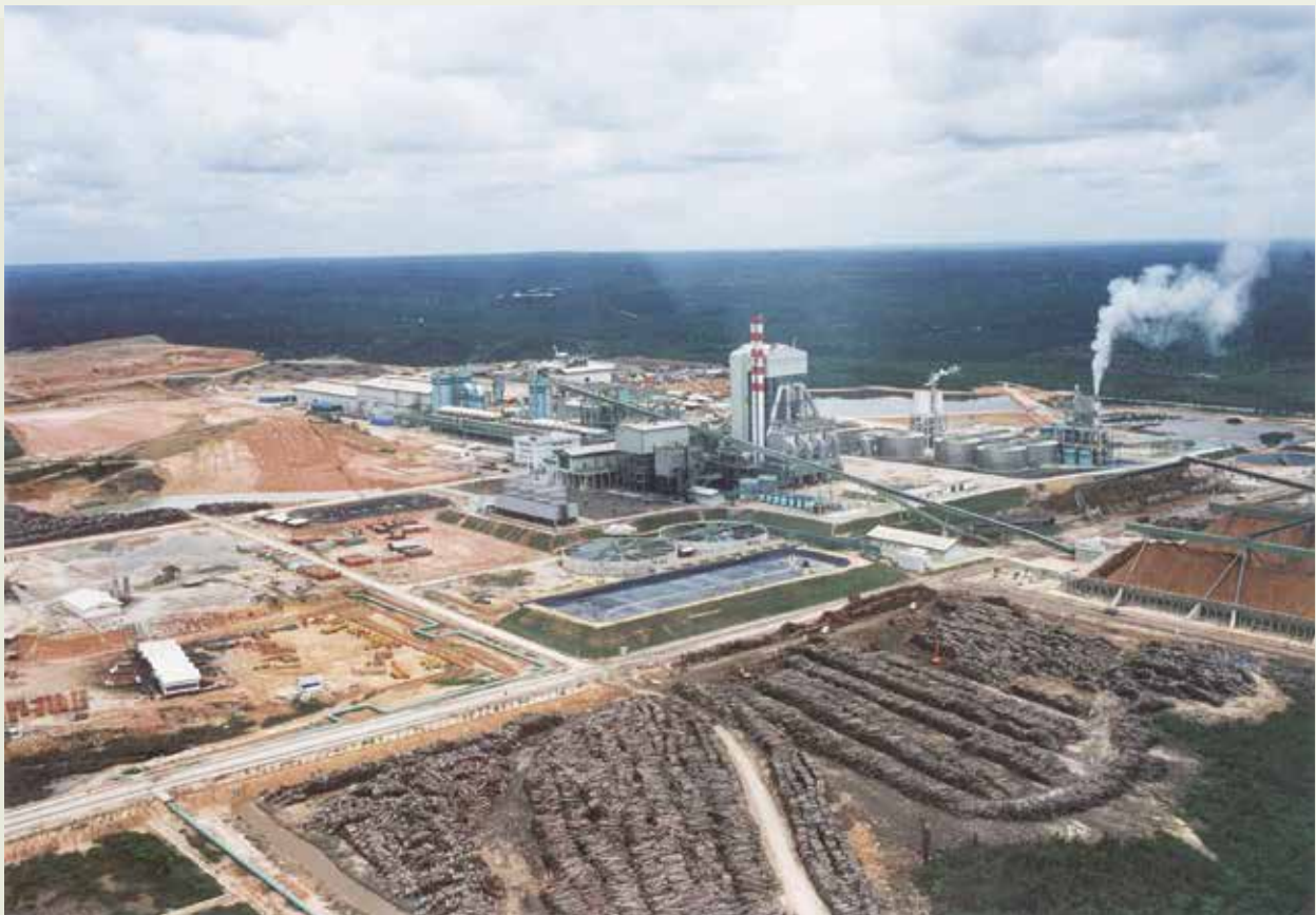
榮工擔任營建管理，在原始森林中的印尼蘇島北竿造紙廠。

80年5月，榮民工程在印尼拓展工程業務有新的突破，印尼第3大財團金光集團，有鑑於榮工在印尼具有良好的工作信譽，乃主動邀請參與該集團在爪哇東西部的集偉與石楠，分別興建兩座火力電廠工程，且以施工實際所需之成本