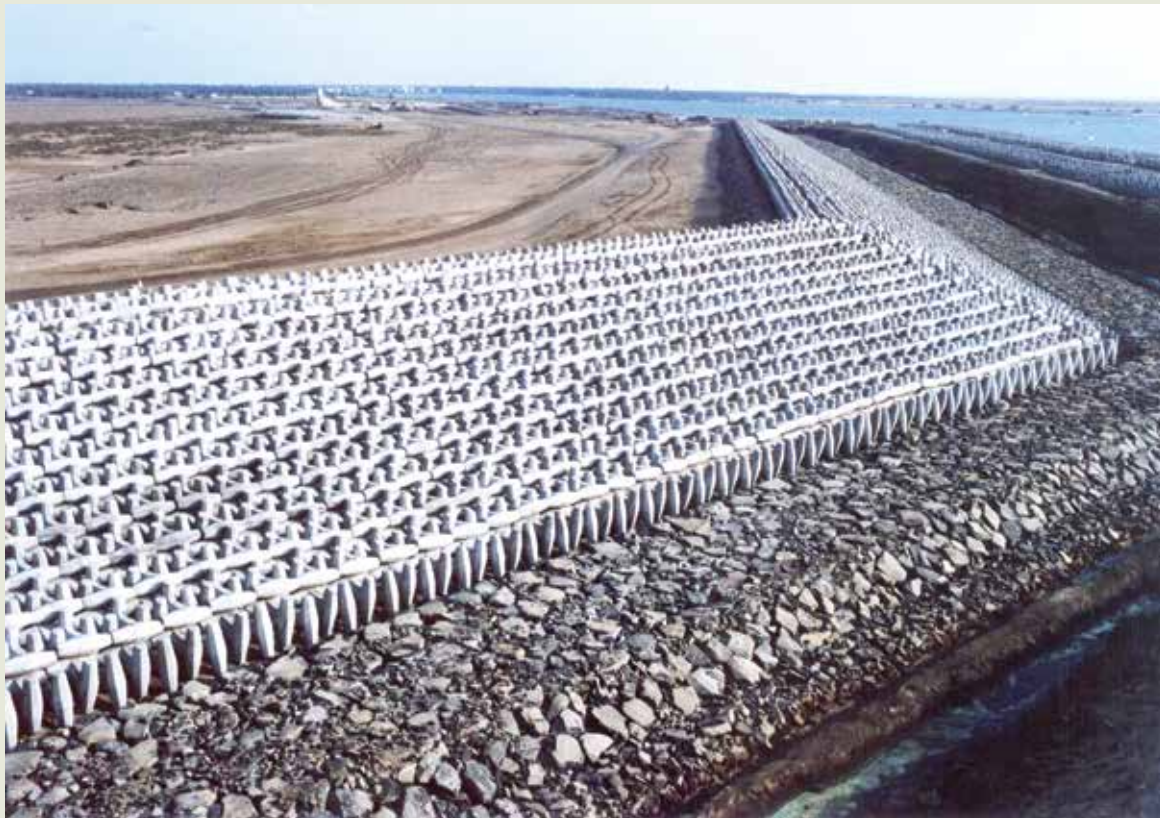
埃及羅西塔海堤工程。

愛爾巴碇海堤工程，位於尼羅河下游三角洲中間區域，施工內容含新建海堤1,100公尺，亦即在距海岸線約200餘公尺處闢建4座孤立海上的防波堤，其中1座長350公尺，其餘3座長各250公尺，堤底寬連坡腳計34公尺，高度自海床起約4.5公尺至5公尺。全部海堤工程於82年5月17日提前竣工，埃及政府於同年8月24日舉行慶典儀式，正式啟用，當時在埃及是樁大事，新聞媒體爭相報導，榮工RSEA招牌響譽非洲。