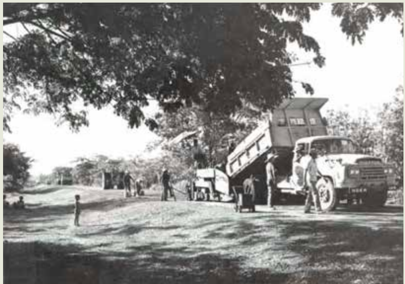
早期的泰國高級公路施工。