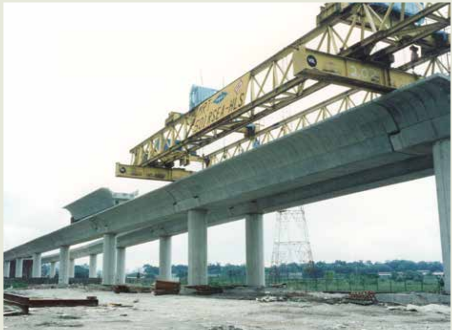
新加坡地鐵501標吊樑。