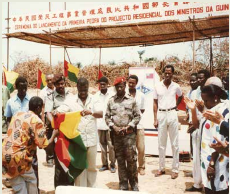
經援幾內亞比索工程開工儀式。

榮工在幾內亞比索施工，並教導當地雇工生產碎石骨材，混凝土磚塊，供應各建築工地之需，這一技術上的傳授，正符合政府「既