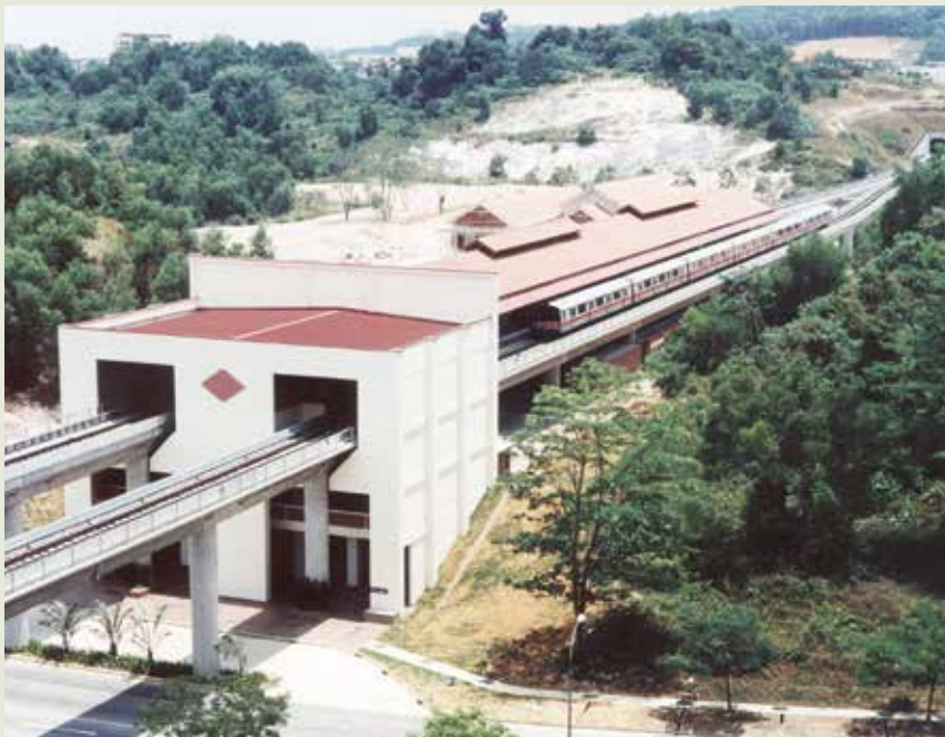
新加坡地鐵裕廊支線完工通車。

N5C11與N5C12兩項組屋工程，位於該島東部，捷運東線終點站附近，由建屋發展局所設計監造。11號計有4至17層不等之大樓8座，共560戶，以及1座6層之立體停車場；12號計興建9座樓，樓高13層，共420戶，以及1座5層之立體停車場，兩項組屋均附有若干公共設施與遊樂設施，分別於83年底完成交屋，該項組屋工程由於品質優良，均榮獲星政府選拔為觀摩示範住宅區。