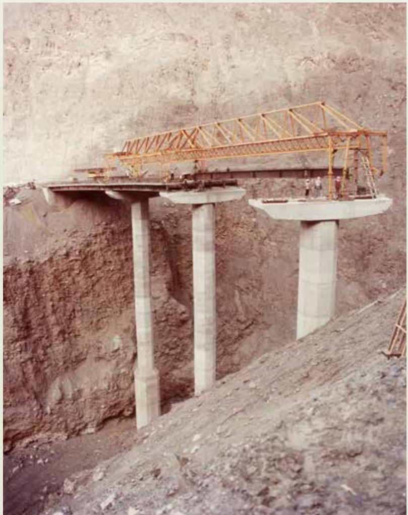
沙烏地夏爾降坡道路工程吊裝鋼樑，施工人員在懸崖山谷間作業，極其驚險。

迪拉降坡道路是沙國全長800公里的54號道路中最難施工的一段，長度10.87公里，計有橋樑38座，最高的橋墩45公尺，最大的跨距80公尺，就似一座由橋樑所構成的高架險峻山路，行車充滿驚險刺激，施工更是刺激驚險，這項工程70年10月開工，76年3月完工。