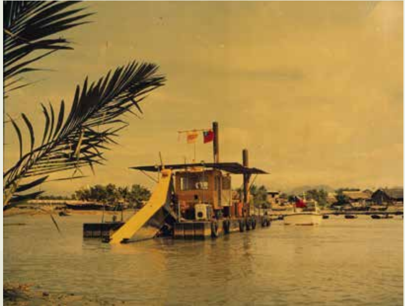
榮工挖泥船在越南進行湄公河三角洲挖泥工程。