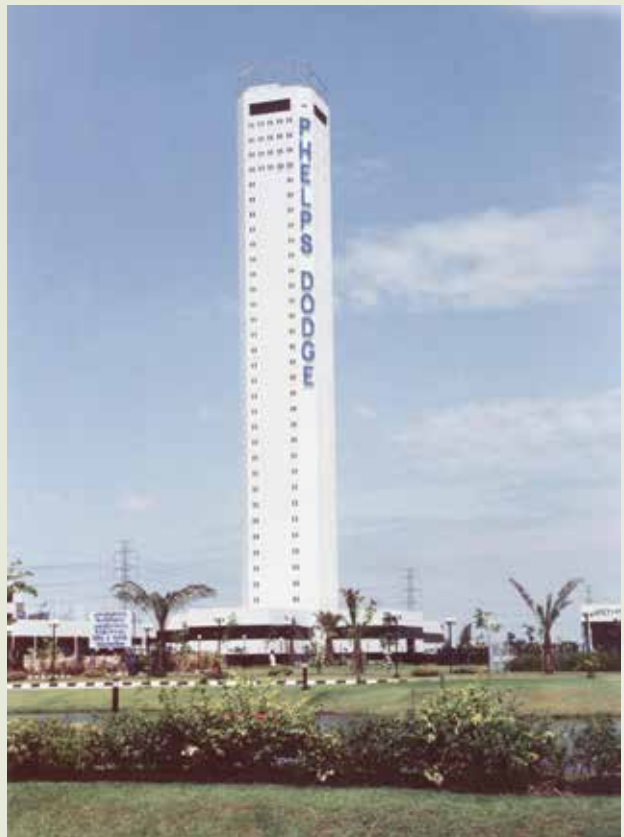
榮工完成的泰國挽披高塔。