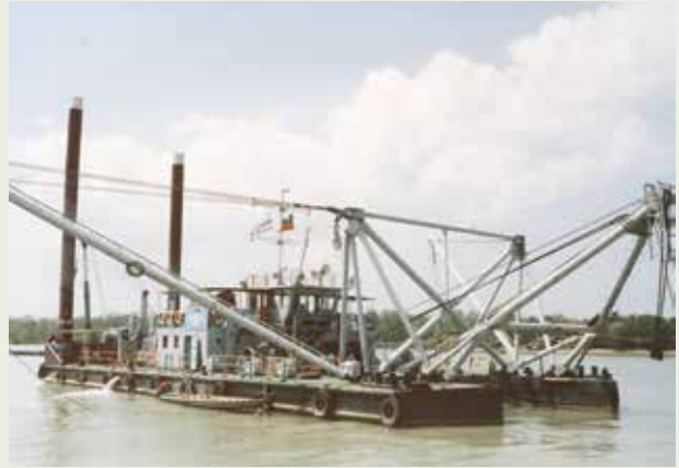
泰國南部北大年漁港挖泥工程。

73年7月，榮工得標承辦泰國萬隆漁港工程。萬隆漁港位於泰國南部，榮工之大漢、大武、大禹號等3艘挖泥船在此地完成為數288萬餘方的浚渫作業。北大年漁港也在泰南，施工項目為挖泥38萬方，航道共3公里。此項工程於74年9月完工。同年，再得標承辦宋卡港工程，該港位在泰南馬來半島東岸，施工項目包括