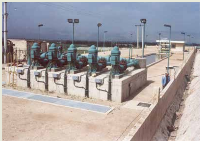
約旦河谷輸水系統。