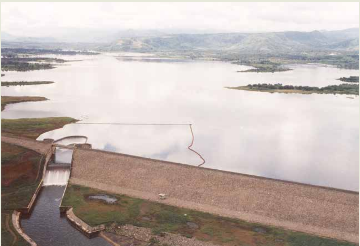
印尼蘇島拉漣水庫。

巴卡絡水力電廠工程，位於蘇拉維西島南部，是榮工在印尼承辦完成的一處能源工程，於76年4月15日正式開工，79年12月提前3個月完工，80年5月13日舉行竣工典禮。這座水力電廠為重力式混凝土壩，壩高16.5公尺，長92.5公