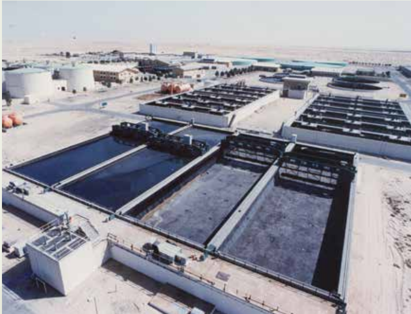
沙烏地朱拜污水廠工程。

榮工處在北部的烏乃沙新興工業區承辦了一項水處理及供水管線工程，並於74年10月開工，77年初完工。稍前，於73年10月，榮工處還承接了哈沙污水系統加壓站與管線工程，這項工程是阿美石油公司在沙國東部省哈沙社區從事十年開發計畫中公共設施之一部分，於75年3月竣工。