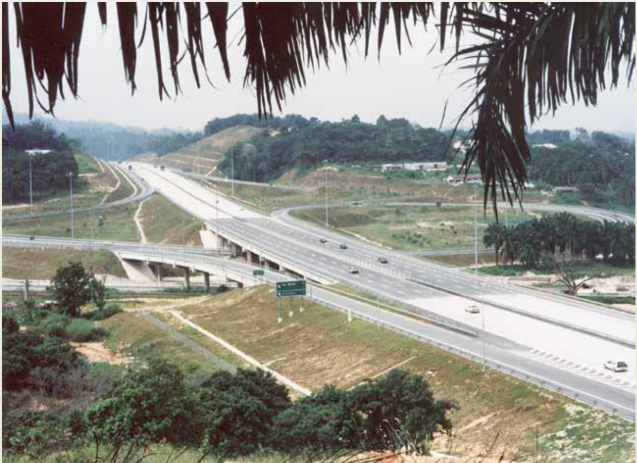
馬來西亞新巴生谷高速公路。

古隆快速道路工程，72年5月開工，這項工程的特殊處，一為約有二分之一的地段屬鬆軟地質，共打設基樁43萬4千餘支以改善地質，克服技術上的困難；一為應馬國政府的保護勞工政策要求，施工期間需引用當地勞工30%，在成本控制上增加變數，但最後都一一突破，歷經3年餘施工完成，75年11月11日開放通車。