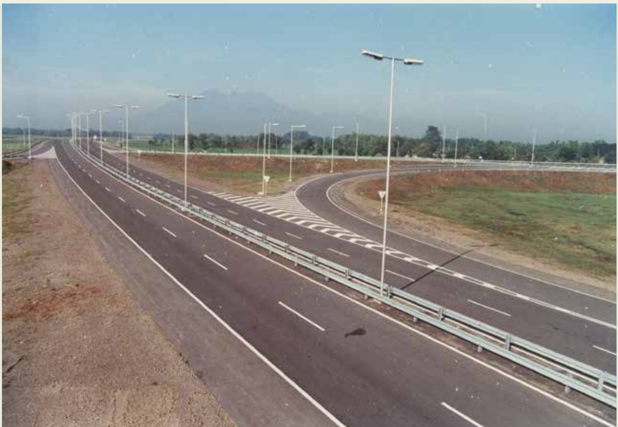
印尼泗水高速公路。

由於泗水與萬隆兩項高速公路做得非常成功，6家民營公司和1家與國營高速公路局合組的公司，主動找榮工辦理自雅加達至孔雀港的收費道路工程，其中，第1階段之第1、2段，全長44公里，於79年7月25日開工，經施工人員日以繼夜的趕趕，於82年完工，比預定工期提前了半年，讓道路提前開放通車，業方可提前收費，業方乃再將第2階段的第3、4、5段工程，繼續交由榮工承辦。這3段道路全長約43公里，榮工於82年7月8日無分晝夜、輪班作業趕工，終於