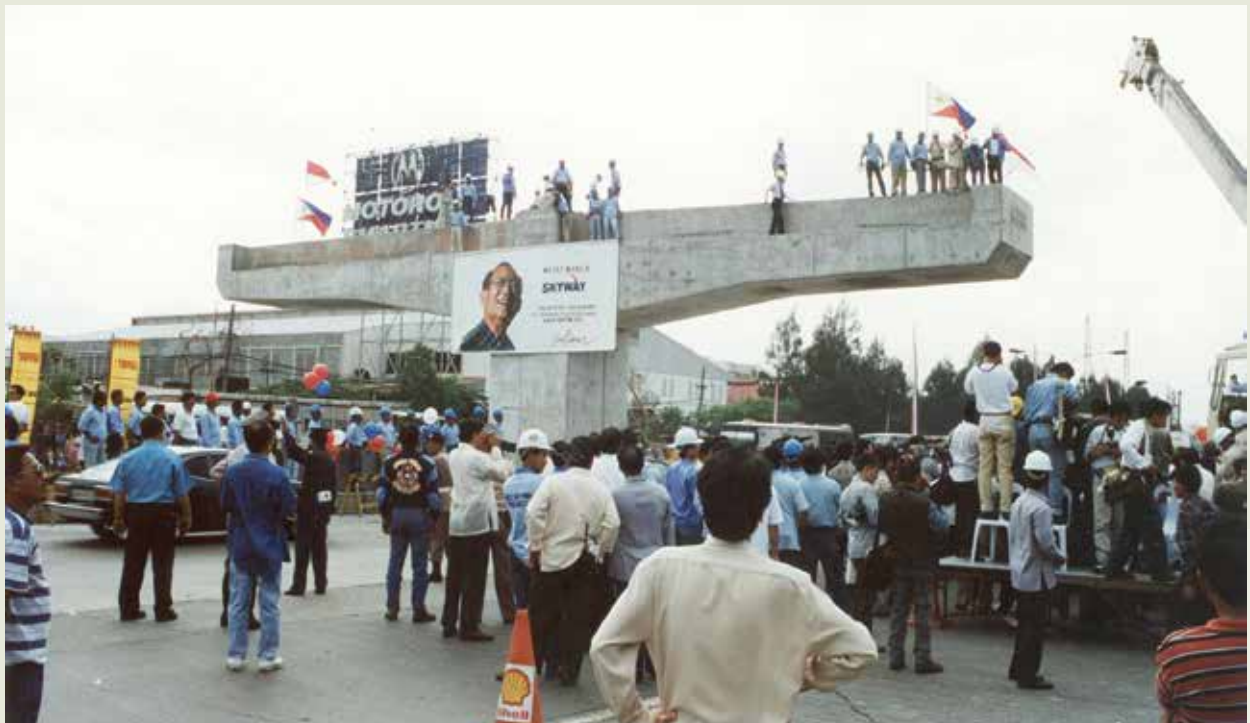
馬尼拉高架道路的施工特色是帽樑可旋轉，維護道路交通。

榮工於85年與印尼胡達馬公司合作，在菲律賓承辦馬尼拉高架道路工程，成立菲律賓辦事處及馬尼拉高架道路施工處，辦事處在87年7月後改稱菲律賓分公司。該工程於85年5月開工，88年5月完工，高架道路長10.5公里，承包金額美金3億7,600萬元，施工特色在於帽樑施工採專利旋轉帽樑工法，對交通的阻礙最小。