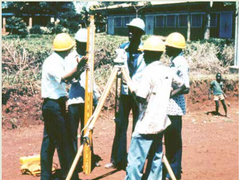
中非公路工程技術組指導當地技術人員進行測量作業。

援助中非共和國的榮工處技術組除協助訓練工程人員，使其能獨立作業外，直接或間接由該組指導與協助施工者包括：卜干達大道、古都古大道、班基市獨立紀念大道、版查威大道、尤寶士大道、國家運動場、班基市UDEAC大道、班基市總醫院道路、戴高樂大道、杜基大道、哥隆各大道、中非蒙宮巴觀光道路、波班基機場擴建、加薩依營區道路鋪面、班基市下水道施工、碎石場改善、熱拌柏油廠修復等工程建設，對中非共和國著有貢獻。