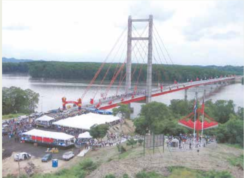
榮工公司在中南美哥斯大黎加完成的斜張橋—臺灣友誼大橋完工通車。

在馬來西亞吉打州投資開發的雙溪大年工業區，於79年4月開工，80年2月完成。開發土地面積205英畝，可售地約160英畝，業已全部售予35家廠商承購設廠，其中大部分為赴馬來西亞投資之臺商。