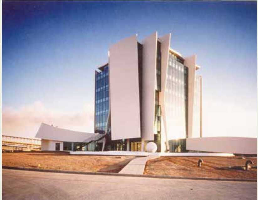
外形別緻、工法新穎的沙烏地肥料公司辦公大樓。

74年2月，榮工處標得利雅德電子學院工程，這項建築工程包括有技術教學大樓、學生宿舍、教學大樓、教職員宿舍、體育館、圖書館、教堂、電腦中心等，78年7月全部完成。