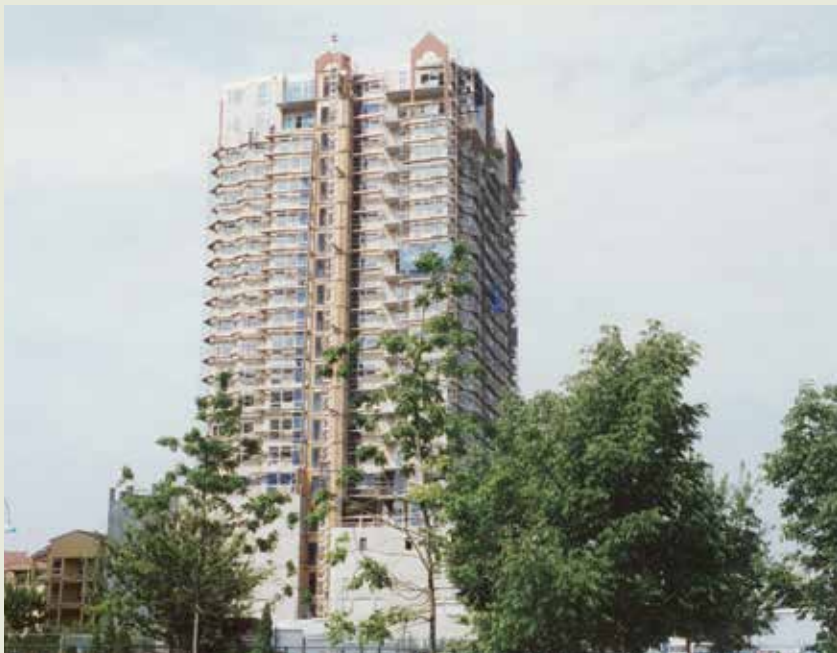
加拿大溫哥華新西敏大廈。

在美國亞特蘭大投資的橡園大廈開發案，為地上30層，地下3層之高聳建築，整個開發案佔地面積1.67英畝，自79年7月開工，至80年12月底完成，開