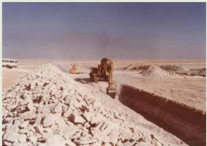
沙烏地亞德輸水管工程在黃沙滾滾的沙漠中作業。