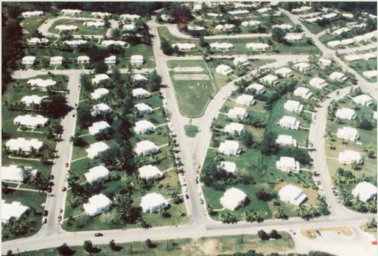
關島美軍眷舍鳥瞰圖。

59年至69年，榮工處在美國西太平洋關島地區拓展工程業務，完成美國海軍基地眷舍第2、3期工程以及海軍航空站房屋、空海軍基地作業設施復舊、海軍基地發報機房復建等工程。其中，眷舍工程共興建眷舍530戶，榮工處以統包方式承辦設計及施工，由於規劃設計與施工均能密切配合，曾獲得一國際性的工程設計優良獎。