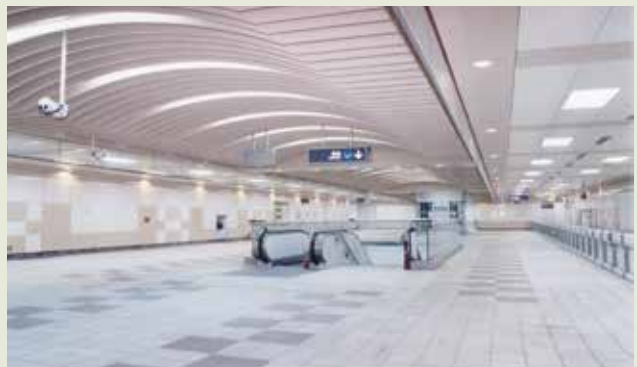
榮獲行政院公共工程金質獎特優獎的臺北捷運土城線CD551標工程。

榮工承辦的臺北捷運土城線、新莊線、蘆洲線、信義線、松山線等各線多標工程，除土城線外，都採JV聯合承攬方式辦理，目前蘆洲已通車，松山線區段標工程預定103年完工，其他均已陸續完成施工，辦理後續作業中。