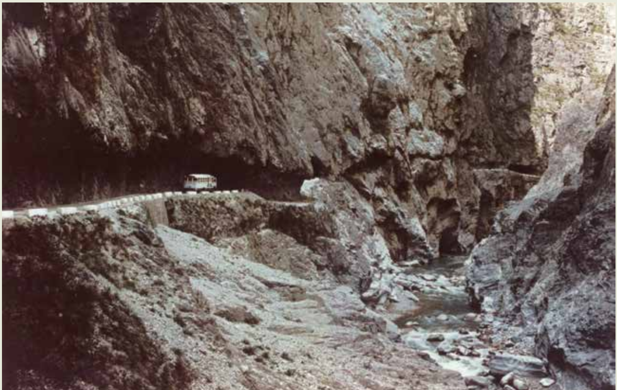
「吾心信其可行，雖移山填海之難，終有成功之日」，圖為東西橫貫公路早期通車路況。

東西橫貫公路主線係由臺中縣境東勢鎮為起點，沿大甲溪上行經達見、梨山、越合歡山垭口後，再循立霧溪東行經關原、碧綠、古白楊、合流，迄於太魯閣，與東部幹線的蘇花公路銜接，全長194.2公里；支線由主線的梨山北行，沿大甲溪上游，經環山、勝光、越思源垭口後，到達宜蘭，全長111.7公里，供應線則起自霧社，經梅峰、昆陽至大禹嶺與主線相銜接，全長計40.2公里。