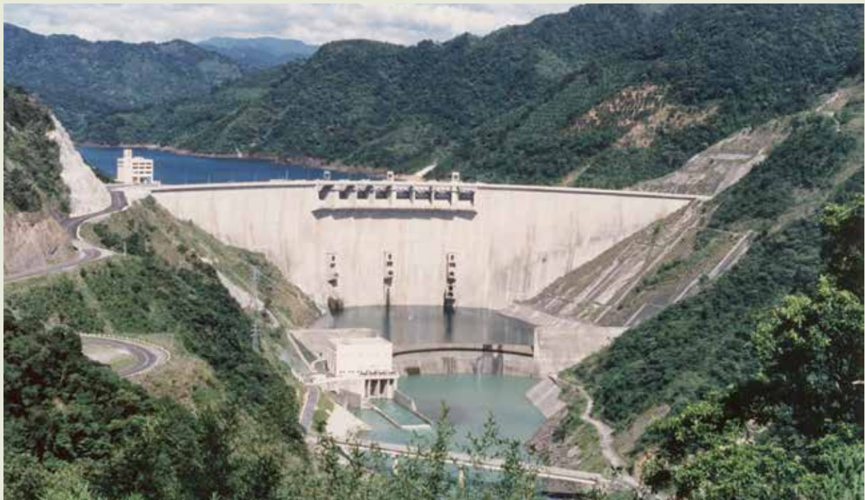
榮工完成的臺北翡翠水庫被美國墾務局評為世界特優級水庫之一。

翡翠水庫是經業方監工單位臺電公司聘請美國墾務局工程專家，作為興建水庫之諮詢顧問，經專家們多次所作實地評估結果，評定列為世界特優級的水庫之一。