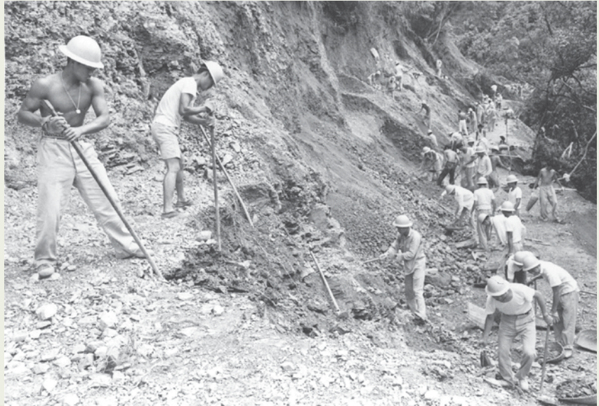
臺灣的產業道路和林道，絕大部分是早年由榮工弟兄們雙手開闢出來的。

52年2月，榮工分隊的弟兄們開上了大雪山山區，展開了大雪山林業公司交辦的大雪山林道工程的施工，大雪山海拔逾2,000公尺，是臺灣高寒地區，入秋後氣溫即逐漸降至攝氏零下，環境險峻與艱苦，工作最多時曾投入20餘個分隊，總人數達1,000餘人。一直到60年代，長達10餘