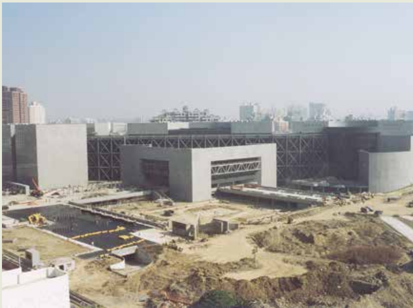
高雄國立科學工藝博物館工程施工。

承辦六年國建工程期間，榮工處尚完成了多項工程，比較重大的有：臺中大里溪整治、南部火力電廠、十八王公廟橋、鳳崗隧道、鯉魚潭景山溪橋、故宮博物院圖書館、臺北大橋、中興大橋、新臺五線公路、臺北市環南高架道路、市民大道、高雄中洲污水處理廠、高雄榮總、國立科博館、高雄港碼頭、新西螺大橋、經建會大樓、臺北近郊衛生下水道、救國團劍潭青年活動中心等。