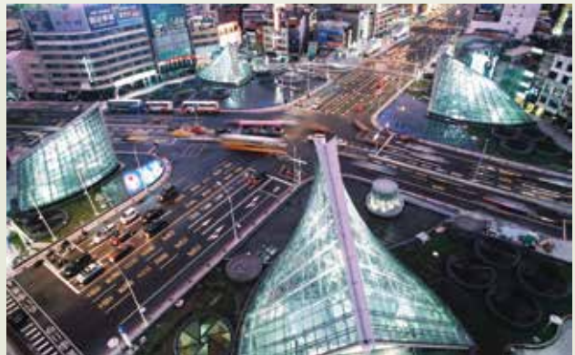
高雄捷運美麗島站4個地表出入口之夜間景致。