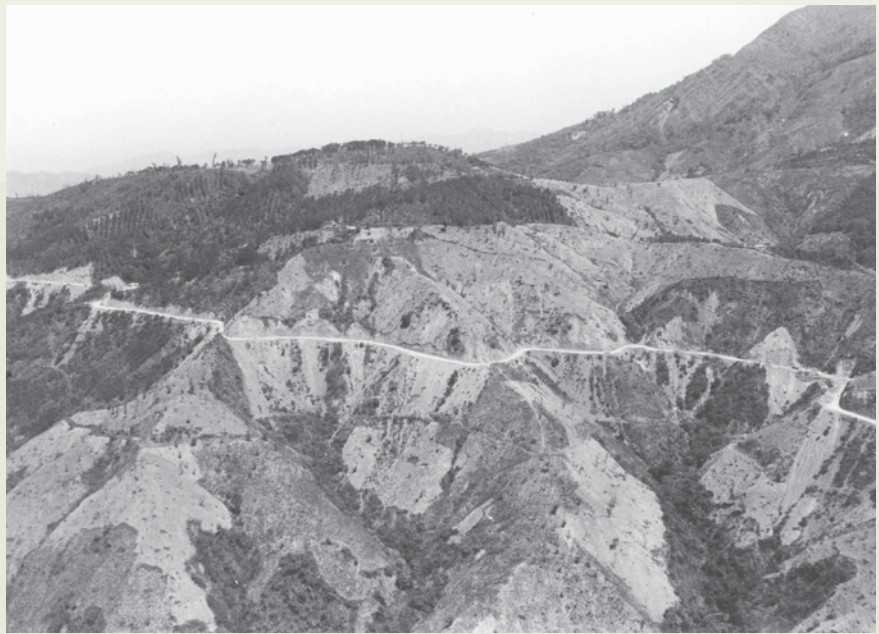
北部橫貫公路施工的艱鉅，不比中部東西橫貫公路遜色。

這條公路的開闢，相當艱險，尤其是進入北橫頂點的明池，不僅山勢險要，兩側峭壁對立，突兀崢嶸，且因山高谷深，常年濛霧籠罩，有時伸手不見五指，視線不清，施工機具很難進入蜿蜒曲折的山地，施工前的道路