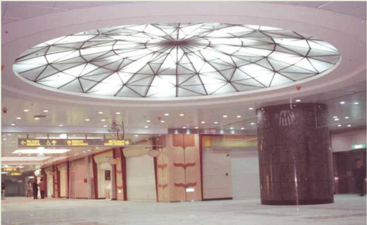
臺北市鄭州路地下街。

地下街工程係自塔城街口向東至火車站大廈前捷運行控中心公園路口，施工線824公尺，其間穿過延平北路、重慶北路、太原路、館前路與承德路，第1標的施工採地下連續壁結構，含擋土支撐和明挖覆蓋，地下連續壁厚度自60公分至1公尺又20公分不等，深達30公尺。另一標工程為地下兩層，底層為停車場，上層為商店，地下街上為平面車道，地面還有主體高架，地下街有通道連接臺北車站、捷運站及中華地下商場，成為臺北市現代化的地下商圈。