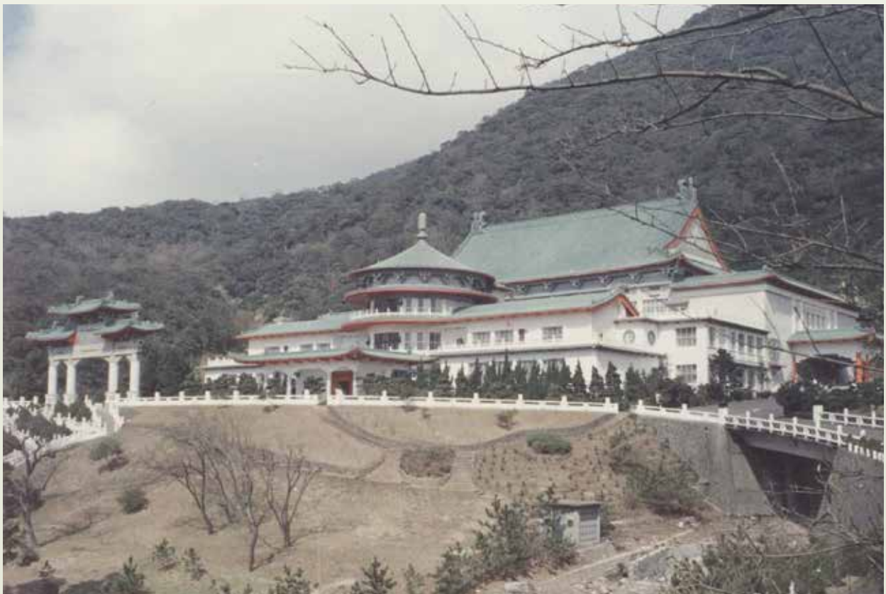
古色古香的陽明山中山樓是榮工弟兄們只用一年時間建造的古典建築。

55年11月12日，國父 孫中山先生百年誕辰紀念大會於陽明山中山樓隆重揭幕，這在當時確實是一樁盛事。