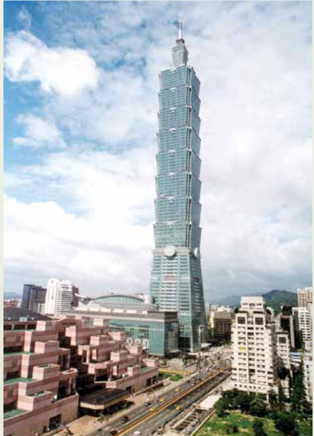
榮工以聯合承攬方式承建，高508公尺世界最高建築物-臺北101國際金融大樓。

位於新莊運動公園內的新莊體育館為一座小巨蛋，高29.55公尺，總樓板面積1萬8,260公尺，屋頂為