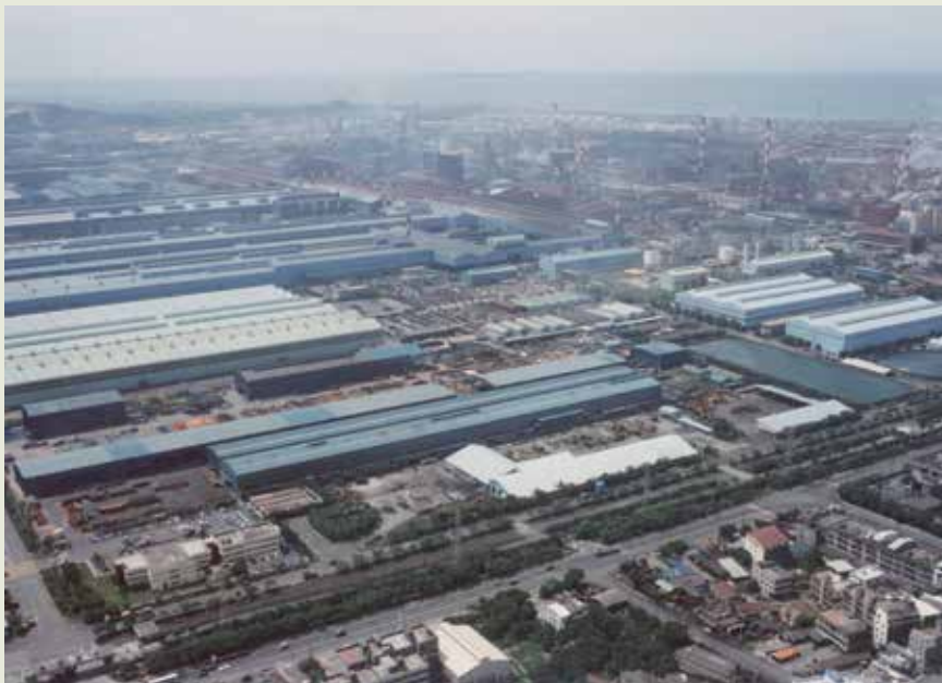
榮工承攬中鋼1期第3階段工程完工後，中鋼已成全球名列前茅之大鋼廠。

土木A標工程，74年8月1日開工，該標計分14個施工項目：含堆取料基礎、煉焦工場基礎、轉爐煉鋼工場基礎、扁鋼胚連鑄工場基礎、肩鋼精整工場基礎、熱軋鋼帶工場擴建基礎、連續配合工場基礎、東區水處理工場基礎、鐵水前處理設備基礎、外鋼胚精整工場廠房基礎、條鋼工場增設線材生產設備基礎、氧氣工廠基礎、原料碼頭擴建、預拌混凝土製造供應等項，於76年5月全部完工，使中鋼成為全球名列前茅之大鋼廠。