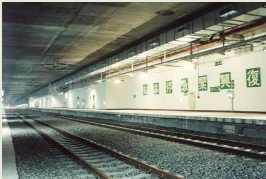
臺北地鐵松延案復興緊急停靠站。