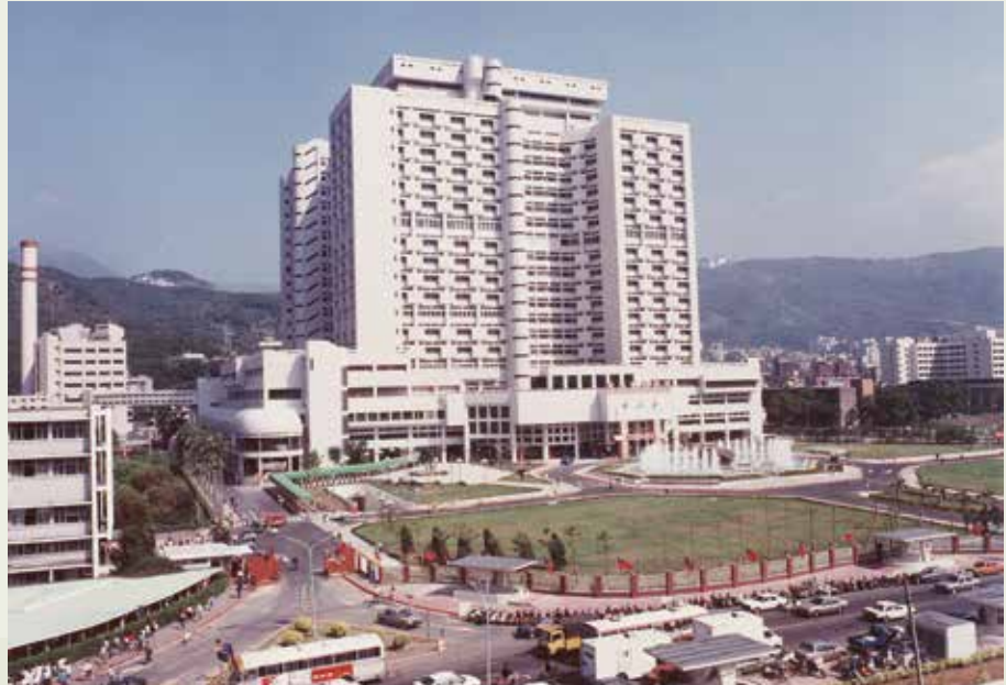
榮工完成的國內最大單幢建築—臺北榮總醫療大樓。

這座大樓設計高度為112公尺，總樓板面積為22萬9千餘平方公尺，地上各層共可容納1,824個病床，手術間26間及其他醫療單位；地下二、三層可供停車714部，以建築體積而言，是當時全國最大的建築物。