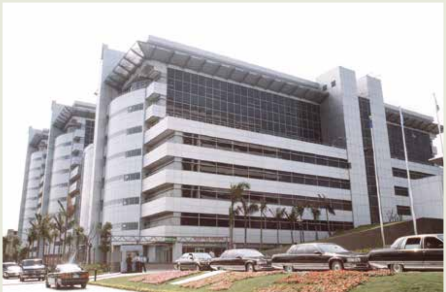
南港軟體工業區廠房。

榮工承辦臺北南港軟體工業園區工程從84年10月開始至91年元月，包含第1、2期工程，第1期工程為5棟大樓地下室結構及各棟相關裝修工程，第2期為基礎及3棟大樓結構工程，總工程費近20億元。