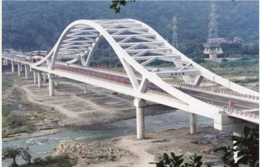
國內首座連續繫索鋼拱橋—桃園崁津大橋。

桃園大溪崁津大橋與花蓮太魯閣橋都是榮工90年代完成的新式橋樑工程，它與榮工早年完成的中部義里大橋及后豐大橋，在施工技術上當然不可同日而語。國內首座連續繫索鋼拱橋—崁津大橋，在臺四線公路上跨越大漢溪，長806公尺，中央最大跨距150公尺，上部結構採逐跨工法施工，工程於89年3月承辦，91年8月竣工。