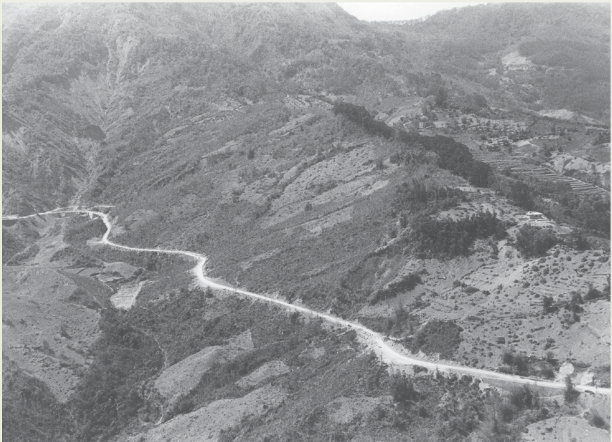
南部橫貫公路工程的施工使用大量機械，比起中橫與北橫的施工進步多了。

當年在南橫公路東西兩段，分設東段及西段兩工務所。這項公路原訂工期是4年，在61年6月完工，後來政府要求提前在60年10月完工。最後趕工的高潮是在海拔3,000多公尺的向陽至關山埡口一帶，此處氣候不良，地形艱險，榮工集中了19個分隊趕工，終比預定工期提前半年完工。