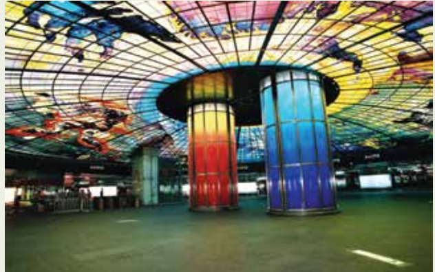
高雄捷運美麗島站大廳穿堂「光之穹頂」成為旅客矚目焦點。

除此之外，尚有許多分布在全省各地已完工或正在施工的工程，包括第二高速公路埔霧支線、忠勇及率真專案、東西向快速道路八里新店線、臺中和平新村、臺南影劇三村、臺北崇德及隆盛新村眷村改建工程、臺電碧海水力發電工程、臺北信義環球中心工程、苗栗縣府大樓、臺北捷運松山線CG590B、機場捷運CU02A標等工程，榮民工程雖已完成民營化，並進入清理階段，但仍將秉持一貫的信譽，如期、如質完成每一項工程。