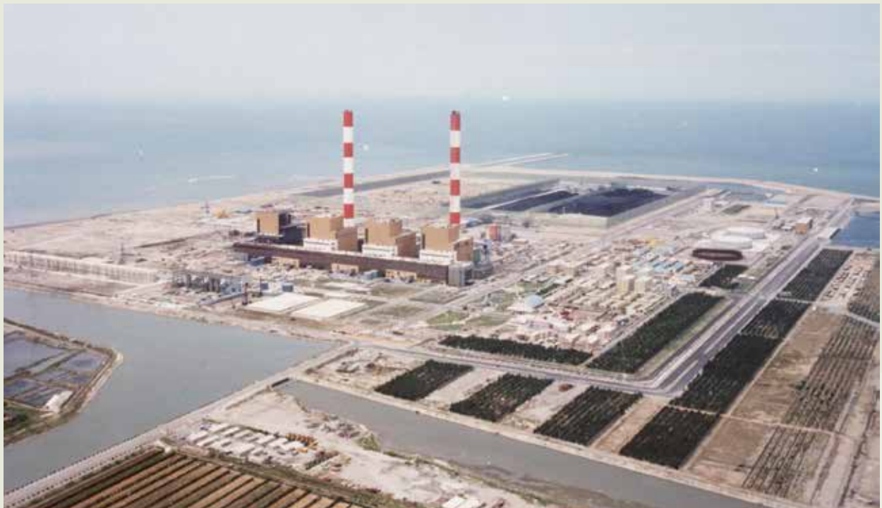
臺中火力發電廠完工初期鳥瞰。

抽水機房工程係電廠冷卻水暗渠進水口工程，電廠設10部機組，每兩部機組設一抽水機房，抽水機房進水口另建連絡橋。