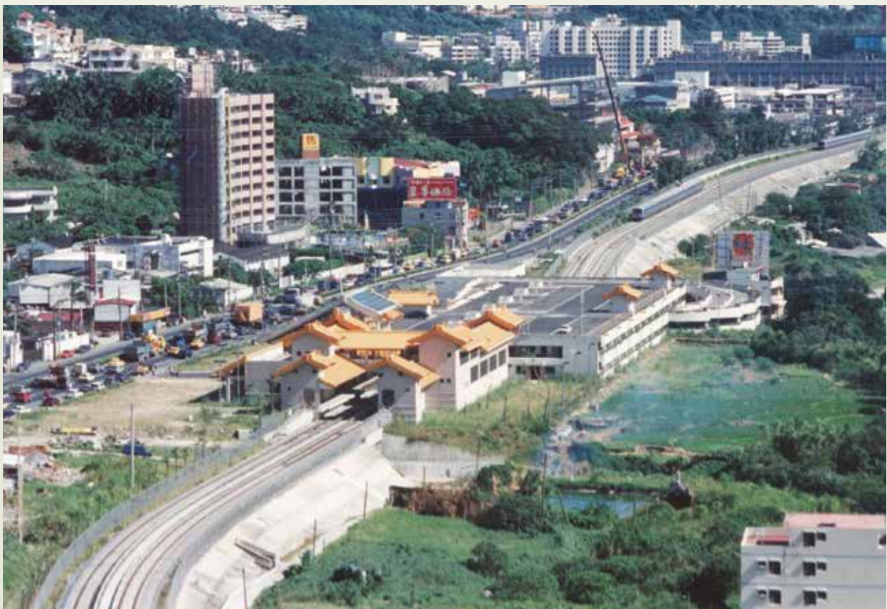
臺北捷運淡水線紅樹林站及路堤。

淡水線捷運系統工程，榮工處一共承辦了5標，其中3標為靠近臺北車站與鄭州路間的201G標、鄭州路以北的202A標及202C標，總長度約1.7公里，自78年6月開始沿舊有淡水線鐵路打連續壁，作深部開挖，最深的開挖達39公尺，最深的連續壁達52.9公尺，全部在83年3月完成。另兩標為CT208及CT209，是屬於地面段的工程，施工範圍包括興建復興崗、忠義、關渡、竹圍、紅樹林等5座車站及車站間長6.415公里的路堤工作，自79年3月5日開工，於83年元月完工。