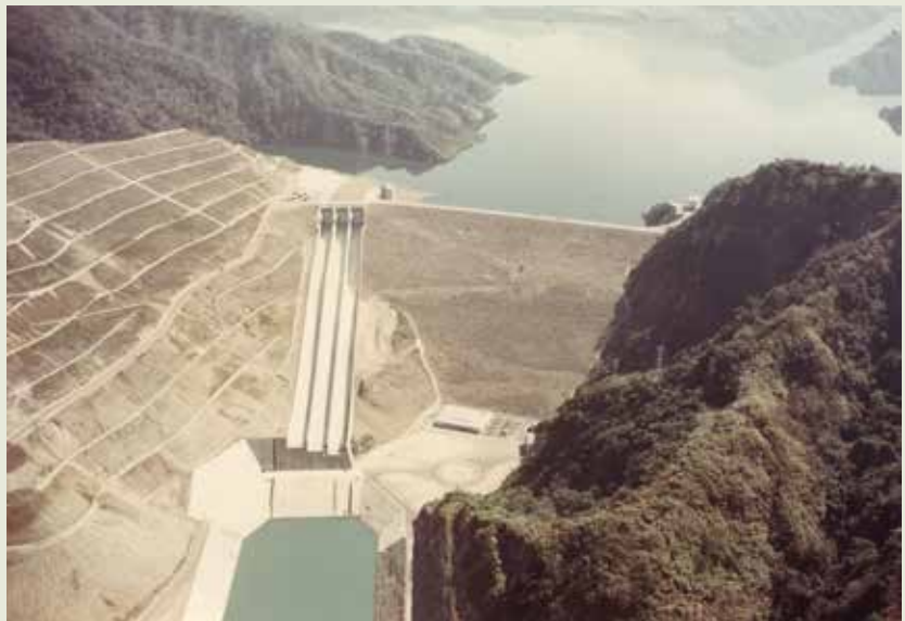
曾文水庫工程是榮民工程事業發展的里程碑。

另一項曾文水庫的先驅工程是擋水壩，其建造目的是為了將溪流改道，築壩以為阻擋，讓流水經由導水隧道宣洩，使主壩能在乾涸河床上及不受洪水威脅下安全施工，擋水壩高60公尺，需要填築土石材料137萬方，等於是一座小型的土石壩。這座擋水壩於58年12月底開工，業方要求在59年洪水季前完成，全部施工時間大約只有5個月，但在榮工處全力趕工下，提前10天完成。