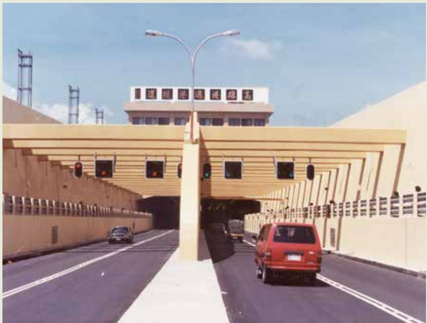
以沉埋管工法完成的高雄過港隧道，品質受到廣泛讚譽。