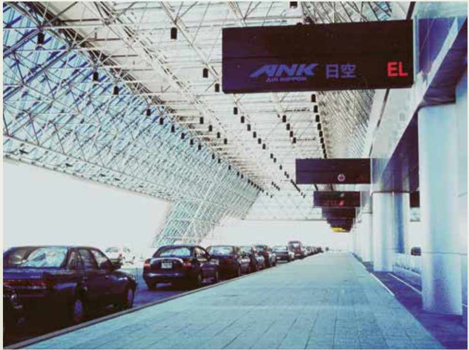
榮工完成裝修工程後啓用的中正國際機場二航站長廊。

本工程在中華工程公司完成結構後由榮工公司與開立公司聯合承攬後續裝修工程，其中機電項目由開立公司承辦，榮工公司則負責建築裝修項目部分，包括航站大廈主體建築、登機走道、連絡道段結構及建築等相關工程。工程於85年5月開工，至90年12月完工，並分別負責保固1至10年。