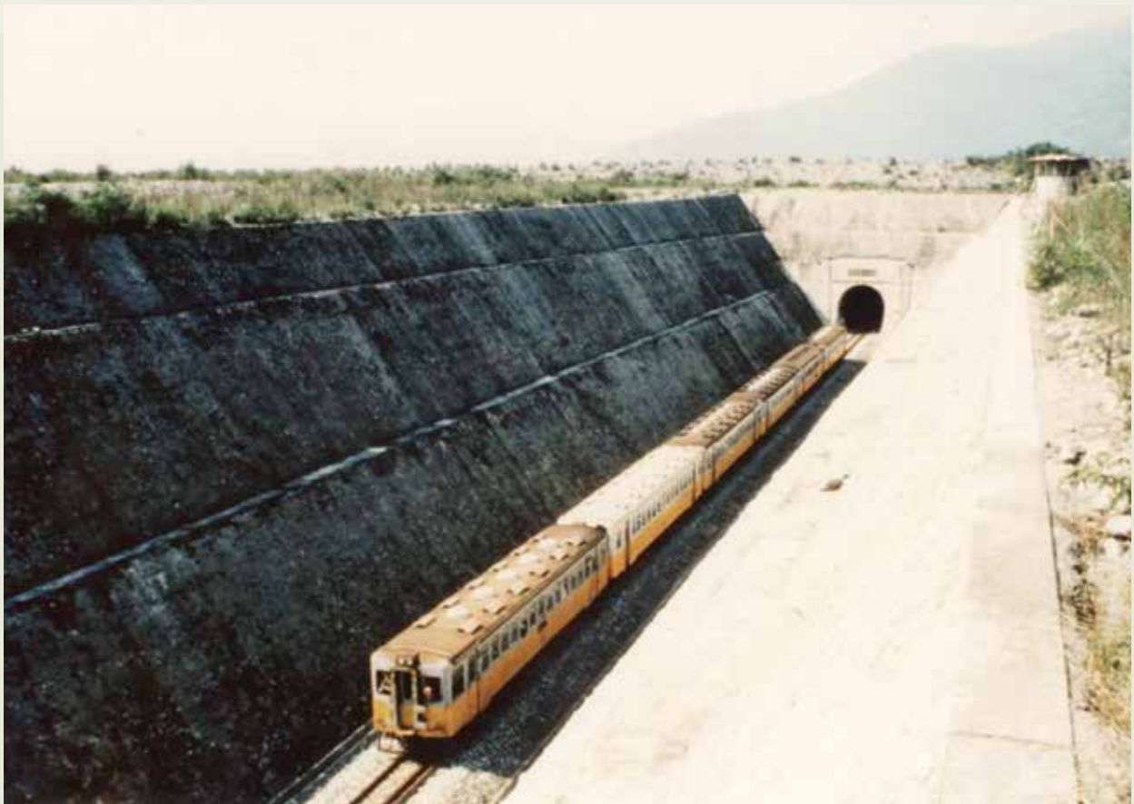
東線鐵路拓寬工程榮工完成溪口及光復河底隧道，杜絕鐵路橋因河床不斷淤高所產生之行車問題。