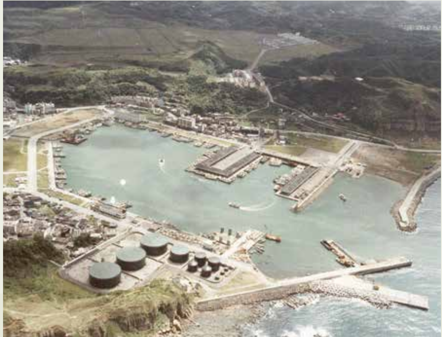
榮工分10年餘施工完成的八斗子漁港，成為臺灣最大的專業漁港。圖為初期工程完工啓用鳥瞰。

高雄過港隧道也是國內第1座海底隧道，是榮工處首次承辦的大型統包工程，自70年5月13日正式開工，至73年1月4日全線貫通，同年3月16日開放單線通車，5月18日舉行隆重竣