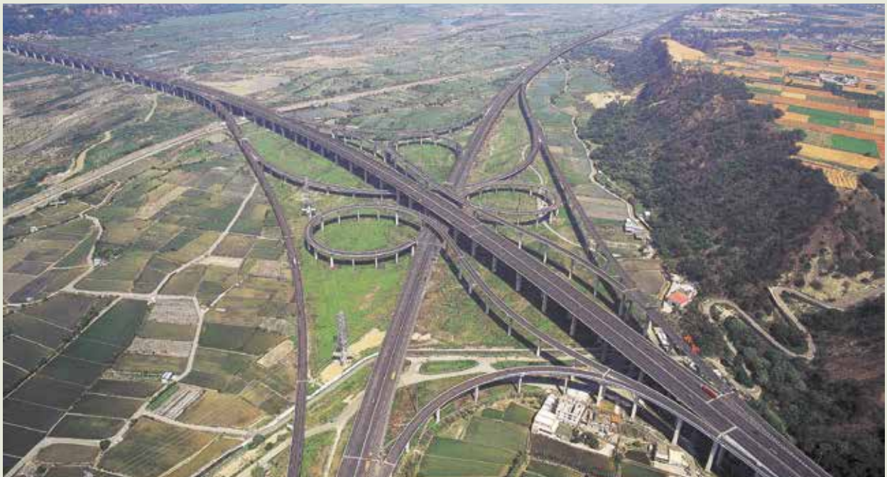
車道盤疊的中二高中港系統交流道。

南二高由榮工承辦的主要有南投草屯段、古坑段、燕巢段路工工程，關廟休息站工程等，全線於92年1月17日通車，疏解中山高交通之壅塞，提高國民交通服務品質。