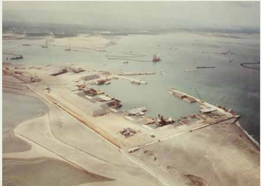
臺中港是榮民弟兄從一片沙灘中建設起來的人工港，圖為沉箱渠內的沉箱製作。

臺中港正式開港營運日，為數多達50萬的國人，從四面八方湧進新完工的港區，這是國內極為罕見的盛典，榮民員工有這種榮耀能看到自己親手完成的海港開始營運，實在無比安慰。