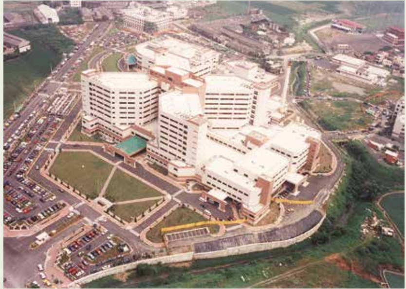
高雄榮民總醫院（原稱榮總高雄分院）。

主要包括建安三號兩個計畫，一為八二八工程，一為七三七工程，後者榮工處僅提供技術指導及拌合場供料支援。工程作業極具難度，但因業主瞭解榮工處曾完成艱鉅的臺電明湖、明潭地下電廠，也在國外完成類似工程，技術與經驗均無問題，故交由榮工處負責設計施工，施工內容包羅萬象，於74年3月開始施工，到82年全部完成。