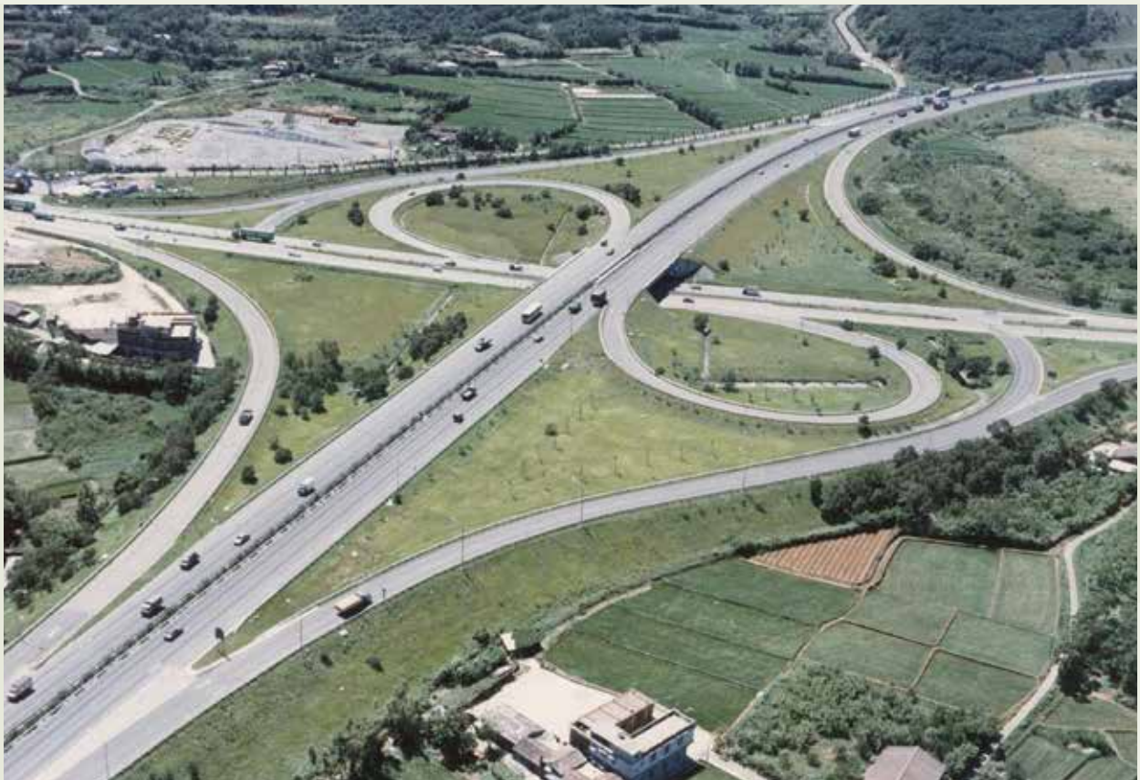
中山高速公路（國道1號）由榮工完成的路段接近一半。

中山高工程榮工共投入工程師、技術工、榮工隊員2,000餘人，承辦共計29標，原預定在67年12月完工，實際提前於同年8月完工。