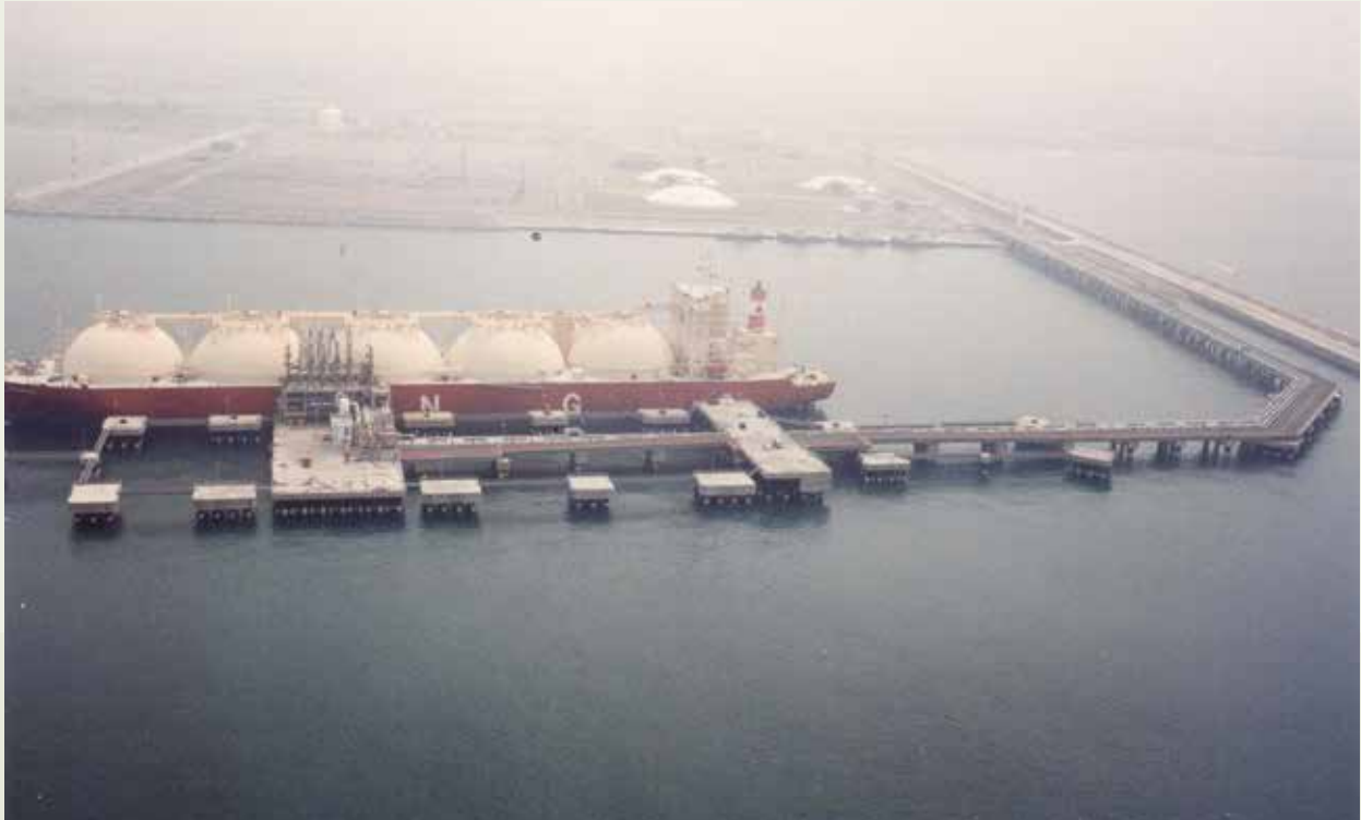
中油液化天然氣港油氣輪停靠卸載。

液化天然氣港卸氣碼頭採棧橋式設計，以打設鋼管樁斜樁來組成增強碼頭之承載負荷，是一項至為特殊而艱鉅之工程。鋼管樁總計757支，長度自45至55公尺不等，直徑自90至120公分不等，76年12月中旬即打設完成，比預定工期提前130天，碼頭海上吊樑亦採龍門端進法施工。