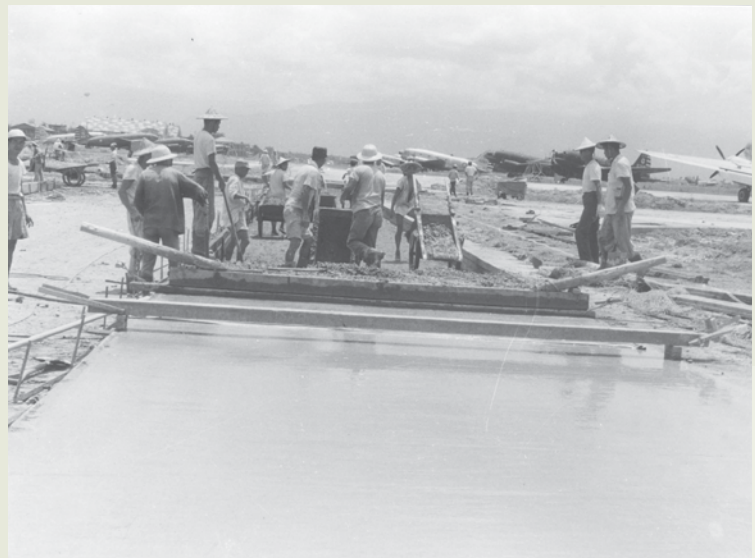
屏東機場擴建工程的人力施工。

榮工走出了勞力密集施工工程範疇後，逐漸以穩健的步伐向機械化邁進，其中也做了許多道路改善、漁港與機場工程，如有名的馬公漁港及臺東大武漁港，但最值得一提的屏東機場擴建工程，該一工程可以說是榮工使用重機械與人力配合施