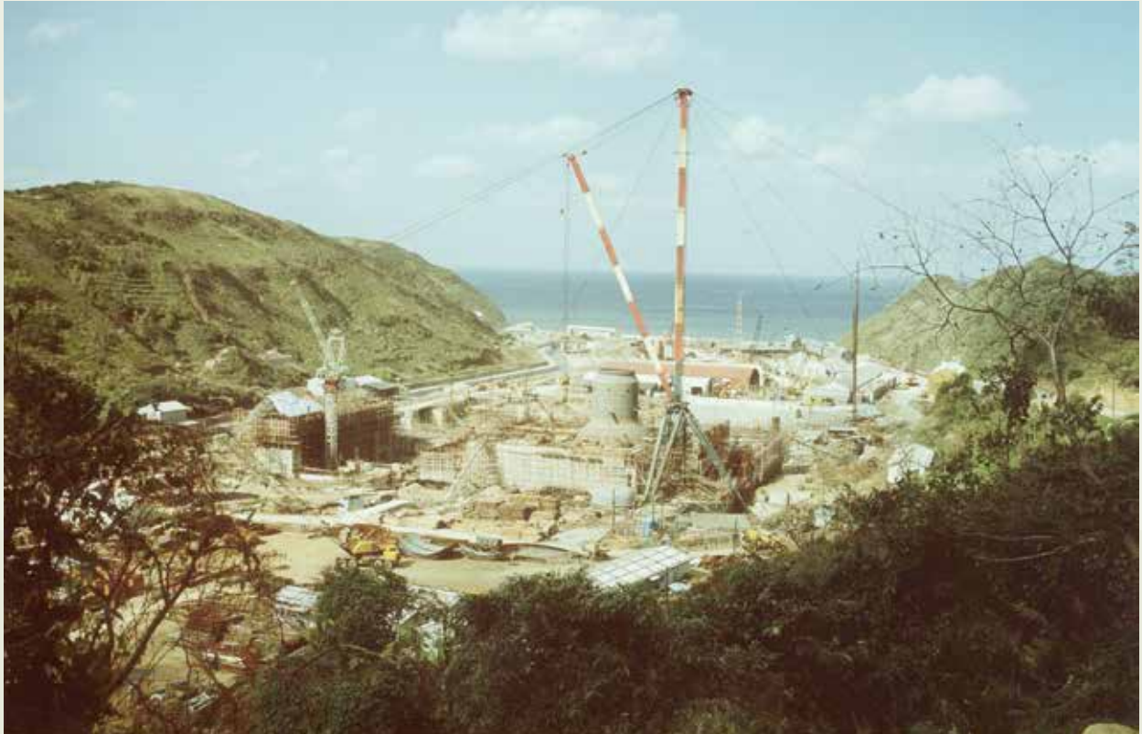
核能一廠是十大建設中政府投資最大、施工時間最長的一項工程。