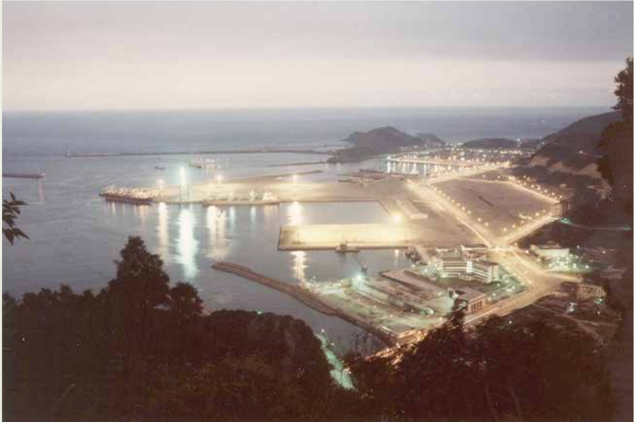
蘇澳港第2期工程完成後，港區璀璨的夜色。

蘇澳港第2期工程，自68年元月開工，至72年6月全部完工，至此蘇澳港建港計畫已全部如期達成預定目標。