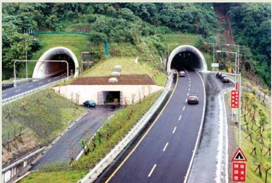
全長12.94公里的北宜高速公路（五號國道）雪山隧道，為亞洲最長、世界第5長的公路隧道。

穿越雪山山脈，施工艱鉅的亞洲最長、世界第5長公路隧道—北宜高速公路坪林（後改稱雪山）隧道工程，由榮工承辦東行線、西行線兩主坑及導坑等3大部分工作。該項隧道西起坪林，東至頭城與二城間之金盈瀑布附近出口，全長12.94公里。導坑用途旨在作為前導，調查東西行主坑沿線之地質構造，俾早期發現困難，預先處理，並提供主坑施工之補