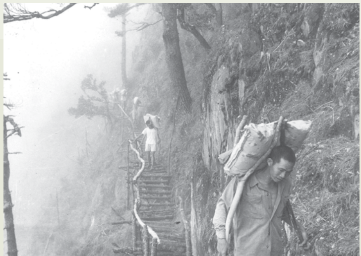
於今觀之，東西橫貫公路仍稱得上是「人定勝天」的浩大工程。

開鑿這條公路的最原始構想與規劃，應追溯到日據時代，當時因工程艱鉅，窒礙難行，終告放棄。輔導會成立後，經國先生主持會務，盱衡全局，當機立斷，將興建東西橫貫公路列為退除役官兵重要就業計畫之一並全力貫徹，所以在工程規劃期間，經國先生即曾多次率同工程人員，深入崇山峻嶺，斷崖深谷，進行踏勘工作，施工期間，亦曾經常視察工地，與榮民弟兄共同生活，