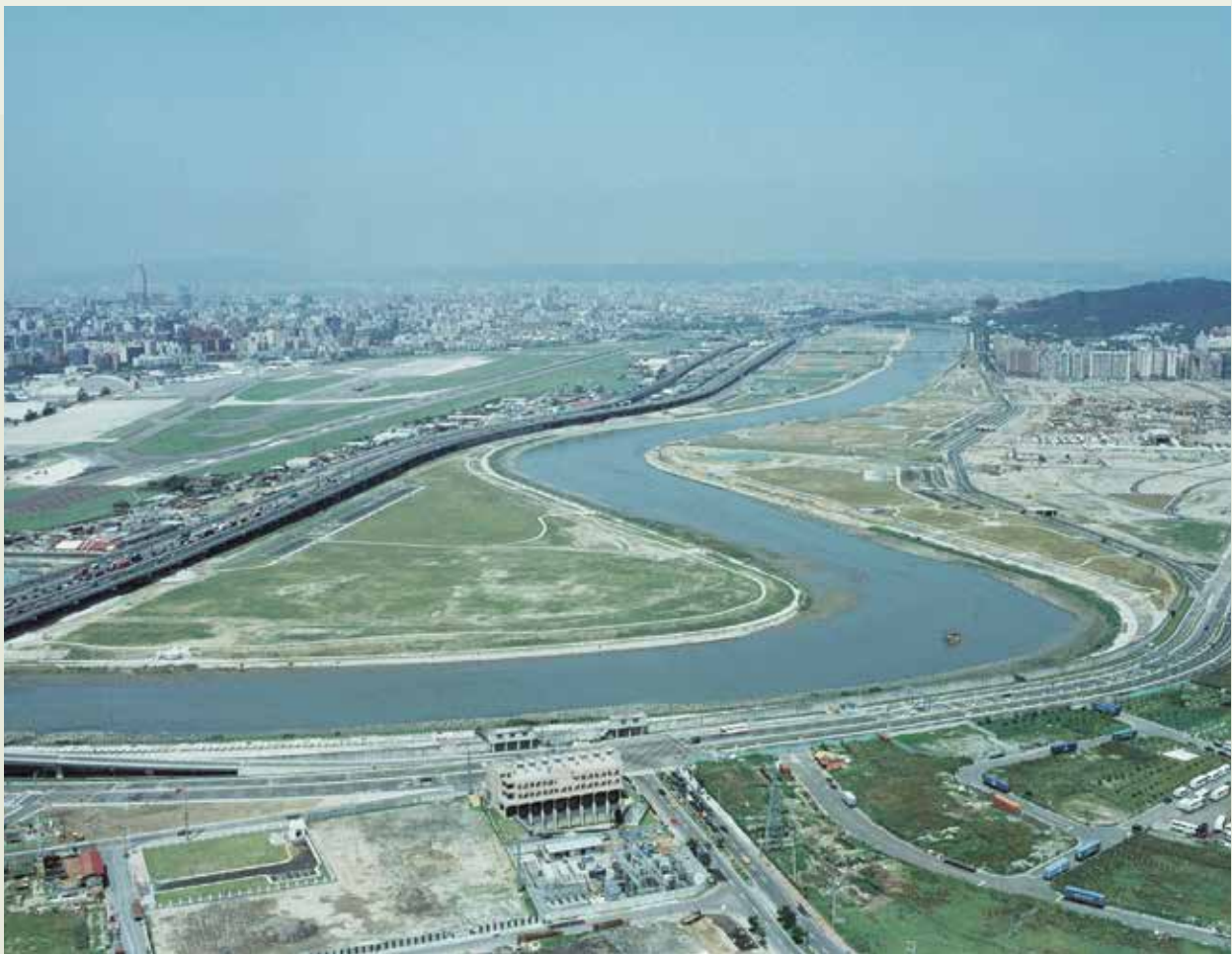
完成整治後之基隆河內湖大直段。

岸延長堤防約3,800公尺，此外尚有排水幹線保設，設立抽水站以及浮洲橋改建等工程。