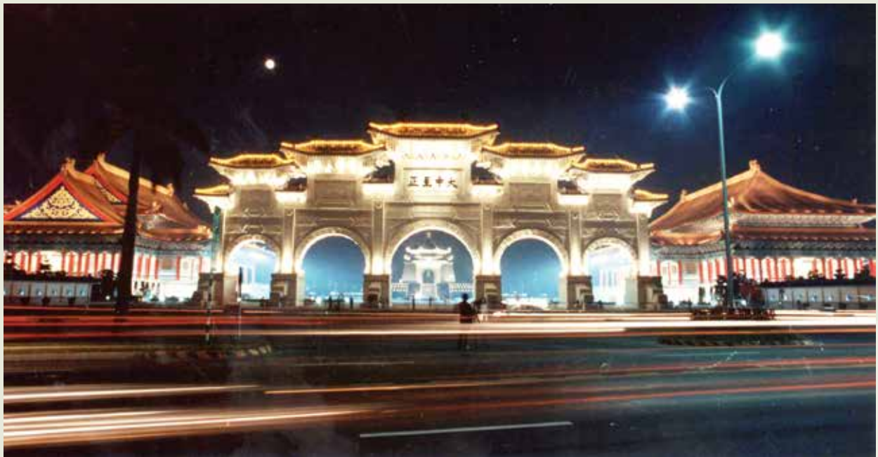
中正文化中心夜景。

由上述施工方面的諸多特色，就可以了解到中正紀念堂工程宏偉博大之所在。中正紀念堂的施工，自基礎工程開始到最後的內外牆及天花藻井之裝修，無論每一個分塊工作、或各個相關細節處都做得非常審慎，沒有瑕疵。中正紀