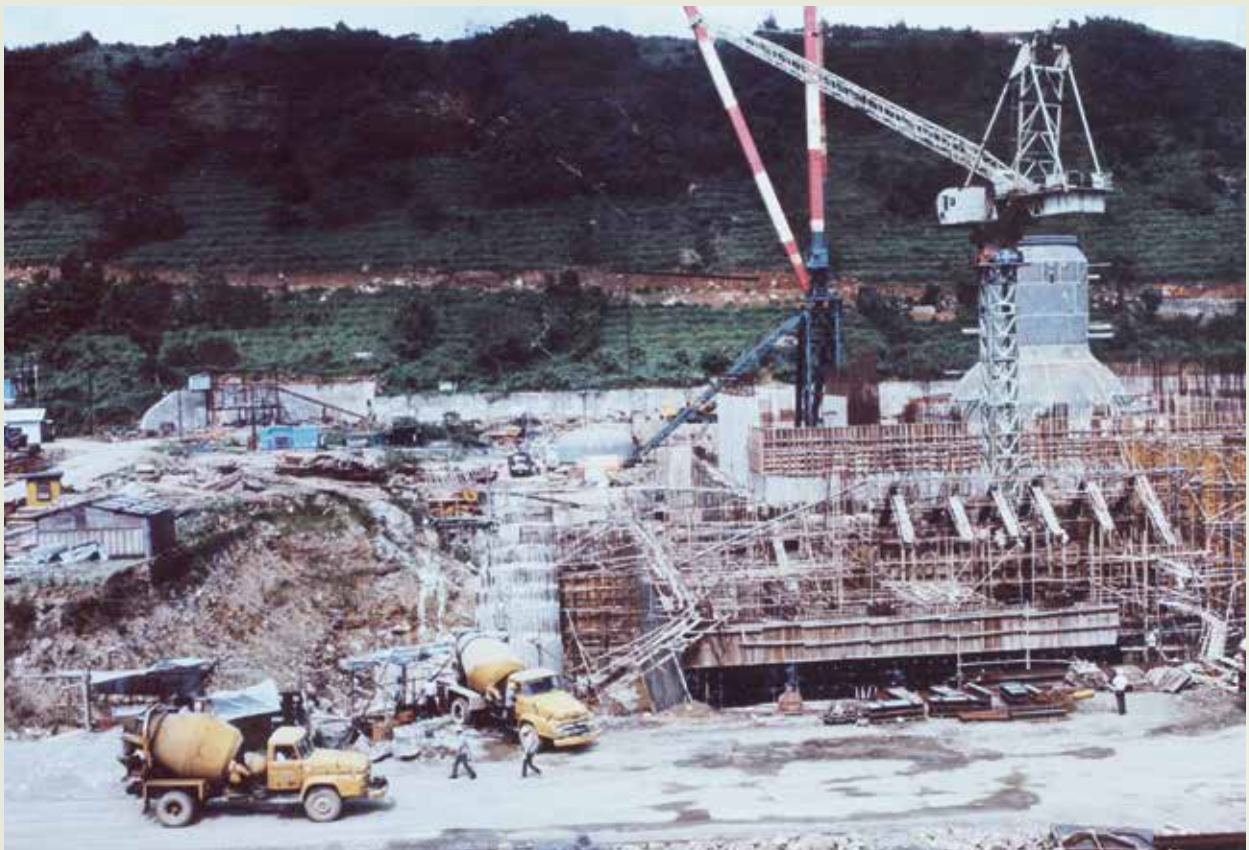
核能二廠土木施工。