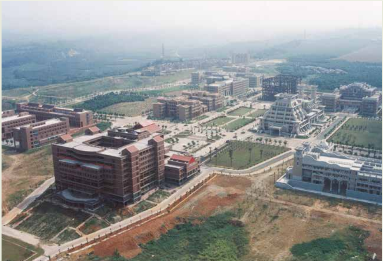
榮工完成的中正大學校舍位於斷層帶歷經地震考驗，有口皆碑。

榮工於75年接辦位於嘉義縣的國立中正大學工程，從荒蕪的一片山坡地開始施工，先後承建的大樓有行政大樓、教室大樓、教學研究大樓、圖書館大學部學生宿舍、活動中心禮堂等。該校區位於嘉義斷層帶，921地震及隨後的數次強震雖為嘉義地區帶來嚴重災害，但中正大學由榮工完成的各項建築，結構良好，損害極微，為工程品質最佳的考驗，工程界人士對該工程施工的堅固有口皆碑。