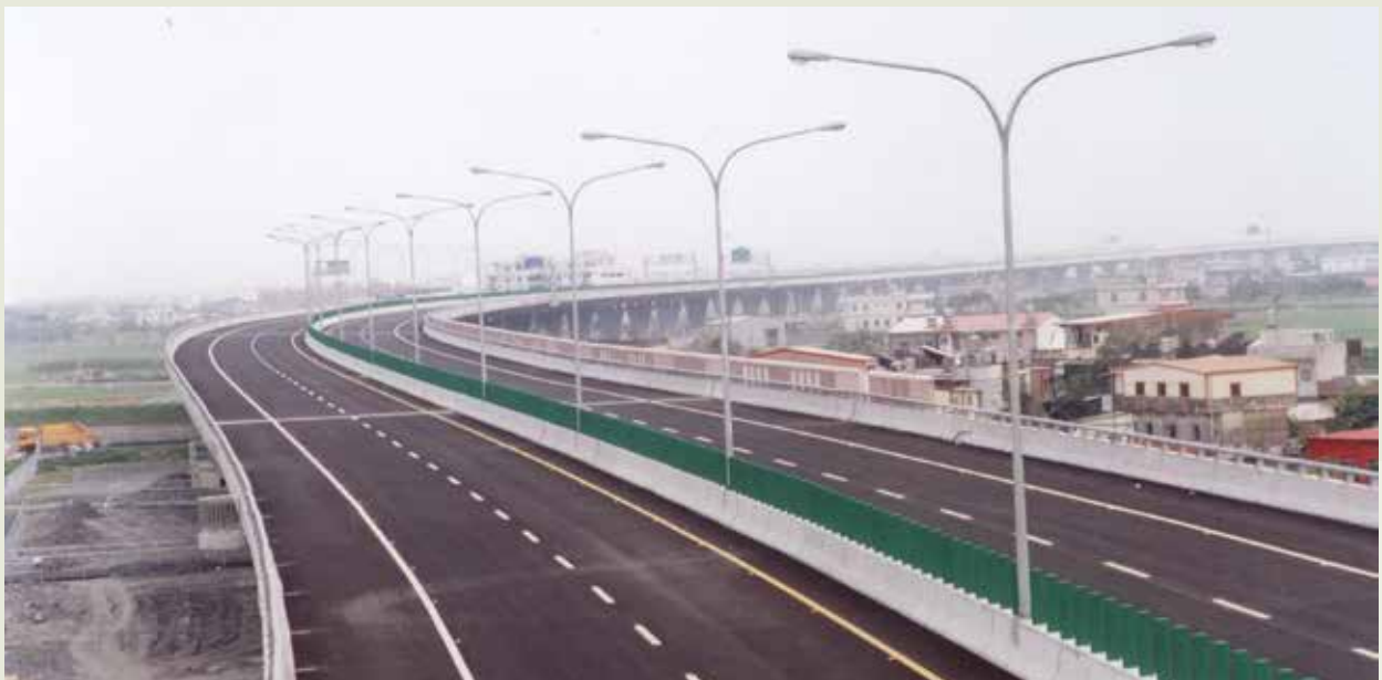
北宜高速公路頭城段蘇澳工程。

雪山隧道為亞洲第1、世界第5長之公路隧道，主要施工內容有2座主坑、1座導坑，3處豎井，36條聯絡道，工程於80年7月1日開工，94年10月31日完工，95年6月16日正式通車。施工期間，由於遭遇斷層剪裂帶惡劣地質及大量湧水困擾，被大英百科全書列為世界最困難的隧道工程之一。該隧道為臺灣北部東西交通走廊95年1月22日北宜高速公路完工通車後，對蘭陽平原的開發及北臺灣的繁榮、發展都有所助益。