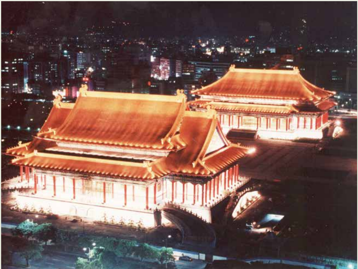
國家音樂廳（左）與國家戲劇院金碧輝煌的夜景。

中正紀念堂第1期工程如火如荼展開之時，第2期工程也一邊設計一邊付諸施工。第2期工程首先進行的是兩廳、院之間的地下停車場。該停車場長約186公尺，寬約166公尺，高約6公尺半，總面積3萬816平方公尺，採連續壁與地錨施工法來做擋土牆，可容大小車輛約616部，車輛可直駛入地下停車場，人員由停車場電梯分別進入兩廳院，設計新穎而有創意，於在73年4月底竣工。