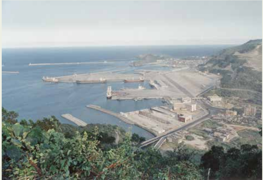
蘇澳港自始至終由國人設計、施工而成。

蘇澳港是一處天然港，早在61年榮工就在蘇澳承辦龍淵軍港工程，著有績效，乃能獲得政府信賴，63年春繼續負起闢建蘇澳港商港第1期工程重任，歷經4年多於67年12月底竣工，比預定工期提前半年。