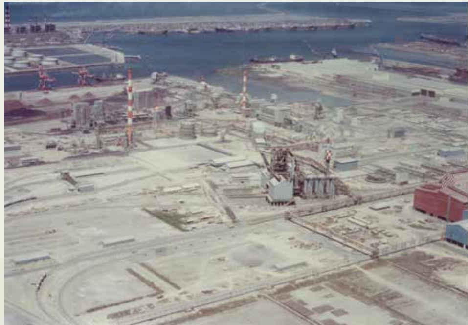
中鋼建廠工程變化萬端，為十大建設中另一特色。

中鋼建廠第1期工程共分多階段進行，榮工承辦十大建設之中鋼建廠為第1期第1階段工程，63