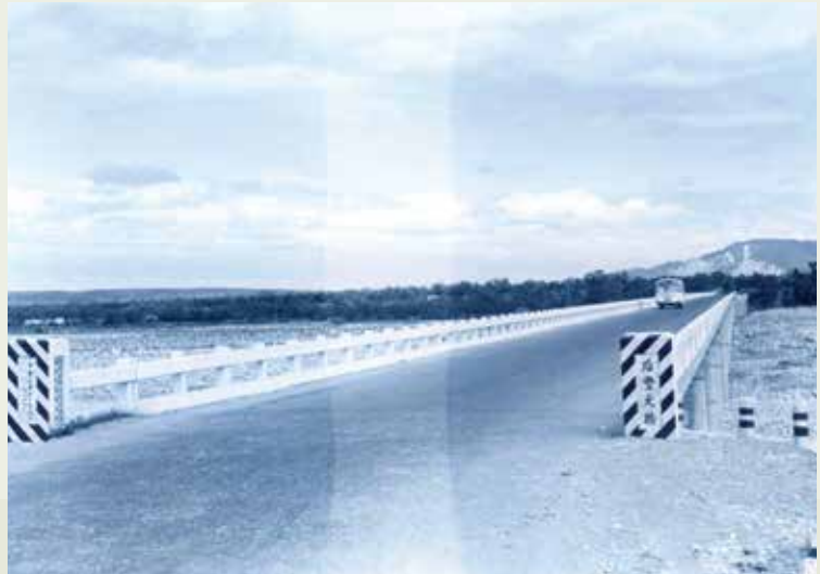
榮工早年施工完成的后豐大橋。

50年3月15日，義里大橋和后豐大橋同時舉行竣工和開工典禮，由當時臺灣省政府主席周至柔主持，輔導會老