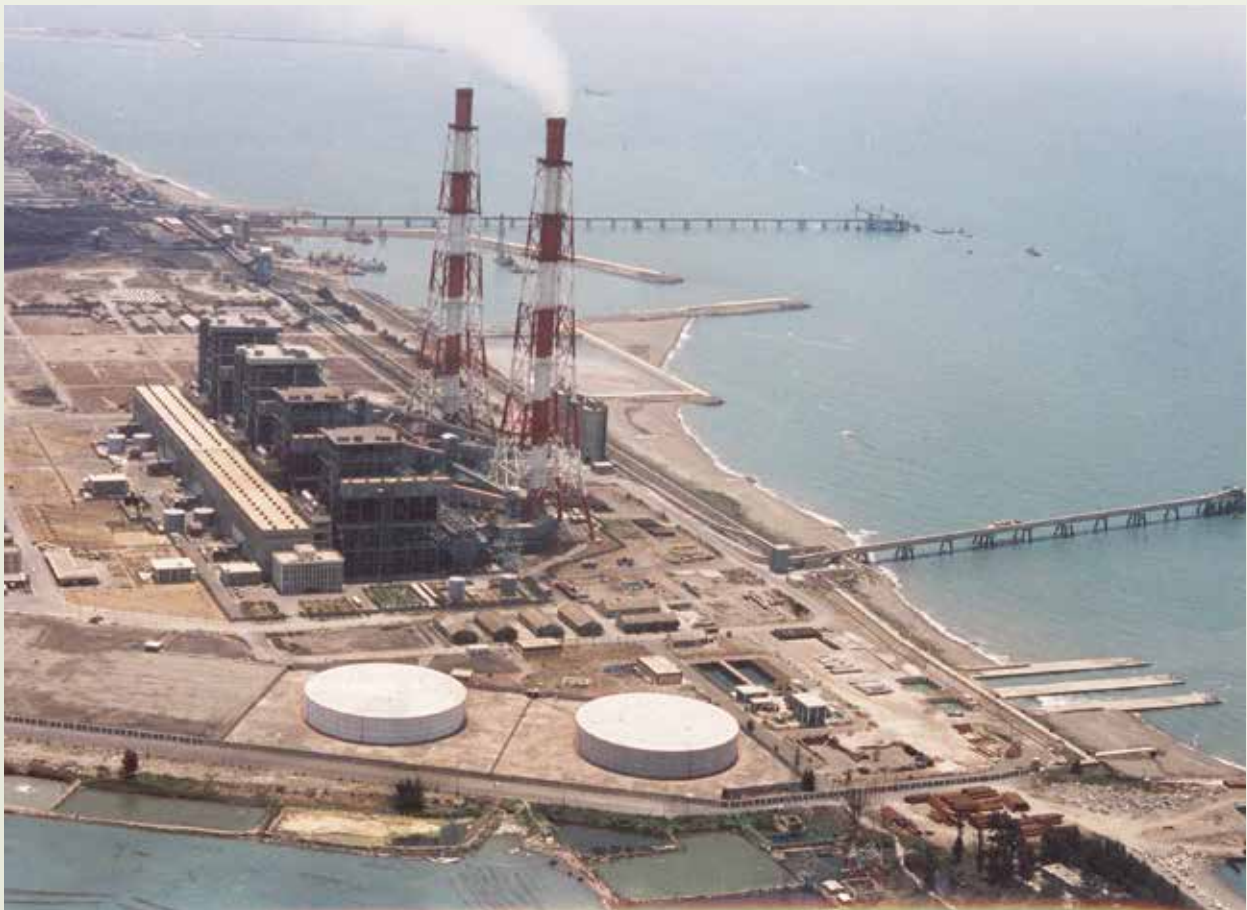
臺電興達電廠，榮工從填地開始，進行海上工程的營建。

興達電廠位於高雄縣永安鄉與茄定鄉毗連之海濱，工程自67年8月開始抽砂造地填築廠房用地，其造地120公頃，至76年7月完成1至4部機建廠基礎土木及海上工程，分別交由臺電裝機運轉，4部機組發電量為2百萬瓩。