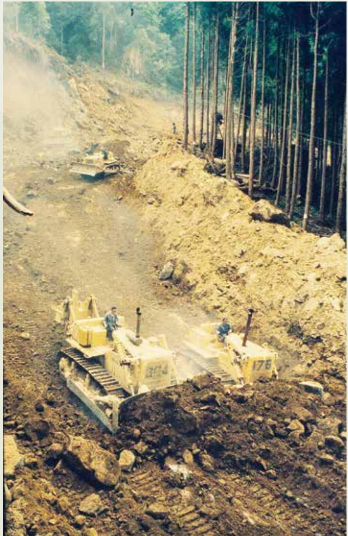
新中橫公路施工一景。

另玉里玉山線工程，榮工於74年5月17日完成始自玉里，至14.6公里處的南安路段，因顧慮八通關古道因恐被破壞，環保團體反對興建而暫停施工，因此計畫中的三條新中部橫貫公路實際僅完成兩條。榮工處於十二項建設期間所完成的工程無以勝數，除上述十二項外，瑩瑩大者尚有：臺北忠孝橋、臺北市萬芳社區、臺北市建國南北路高架、臺北市民權大橋、大漢橋、臺北市衛生下水道、臺北區防洪計畫初期工程、懷恩隧道、國軍松山醫院、聯勤固本計畫、陸軍八〇三醫院、中部自強大橋、大林電廠、仁義潭水庫、高雄市中洲污水處理廠、救國團墾丁青年活動中心等。