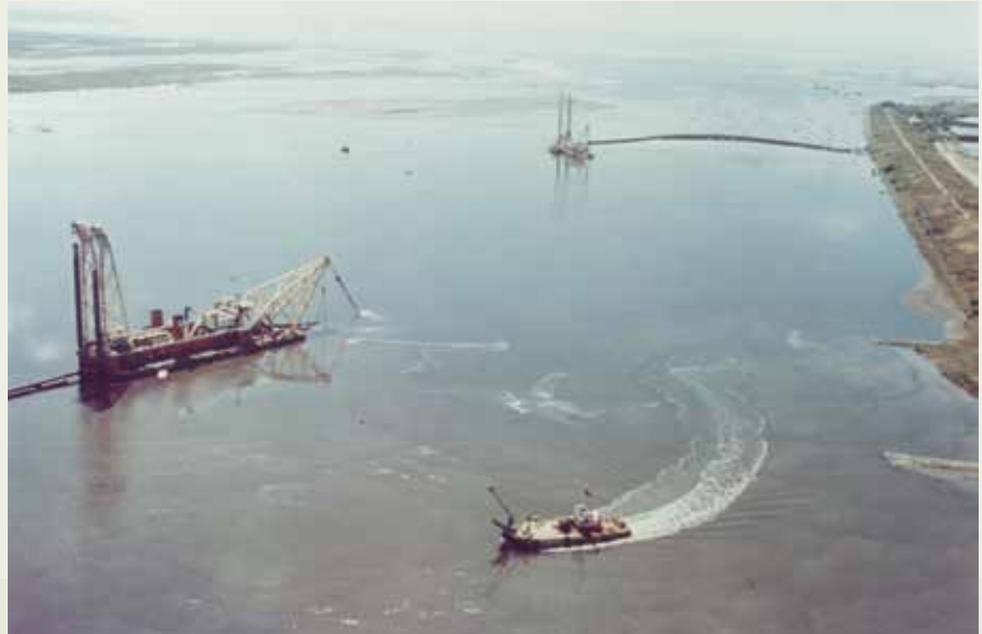
榮工挖泥船團分散在高屏溪出海口，填築林園石化工業區。