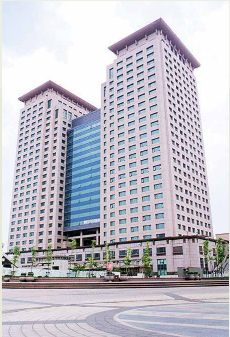
地下5層、地面25層的板橋新站，已成為新北市的一座新地標。

鐵路改建南港專案汐止段山岳隧道及引道工程，東起自臺北縣汐止市下寮溪西側，西至臺北市大坑溪東側，全長約2,522公尺，主隧道採新奧工法施工。由於施工品質優良，獲行政院頒給第4屆公共工程金質獎特優獎。該工程是於90年12月開工，97年9月20日松山南港段完工後，臺北市區再也看不到火車平交道，也是榮工歷經10年地下艱苦施工，再成就一項新紀錄。