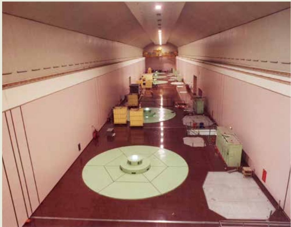
發電規模亞洲第1的臺電明潭抽蓄水力發電廠地下廠房。

明潭抽蓄水力發電計畫工程具多項特色，並引進多項施工新技術，值得一提的是：1.橫跨頭社溪過河段鋼鐵橋，其承載重量達6千公噸，號稱為世界最大承載力的壓力鋼管水路用混凝土拱橋，該橋位在921地震震央附近，地震後毫髮無傷，頗受工程界人士稱道。2.引用新奧隧道開挖工法，應變力大，對坍方之預防與處理有極佳效果。3.廠房及變壓器室深入地下300公尺，保護開挖面，使全期工程從未發生坍方災害，並採早強鋼纖維噴凝土襯砌工法。4.使用機械爬昇機於壓力鋼管傾斜段導坑施工，創國內爬昇斜長258公尺的新紀錄。5.埋設各種觀測儀器於主要結構施工位置，瞭解岩盤變化應力情形，以收預警之效。