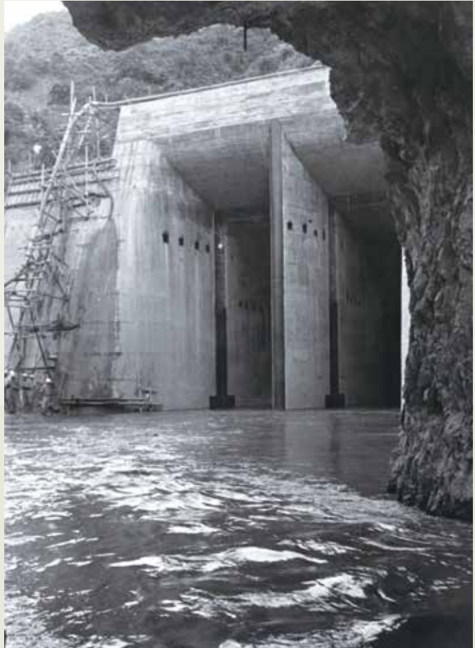
民國62年曾文水庫開始蓄水，供應嘉南地區之農水灌溉，正式發揮了功能與效益。

政府之所以信任榮工處，把這座國內最大的水庫交給榮工承辦，目的也在希望藉由此培養具規模，可長遠發展的建設力量。當時榮工處在經過十多年的人力培養與訓練，已具有相當的程度和自信，並在54年收購了石門水庫的剩餘機具器材，開始向國外發展；56年又買下了美商凡尼爾公司在臺灣的機具，更建立起了承辦大型工程的決心與勇氣。同時，榮工處的工程技術員工已經有4,200多人，主要的施工機具也有1,100多部，也已具備了承辦大規模工程的條件。因此，榮工處承辦曾文水庫工程，對於國家重大工程來說，既是一個新的開始，更是一個好的開始，後來政府的各項建設，都能由國人自己承辦，可以