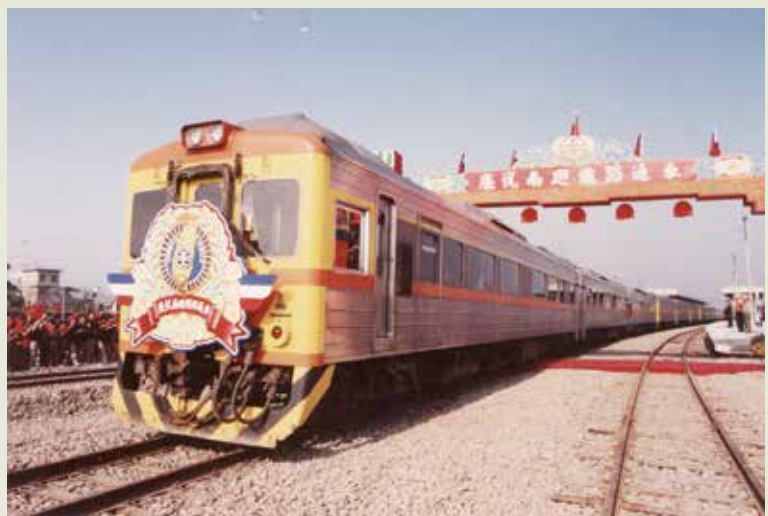
榮工完成11座長大隧道工程的南迴鐵路完工通車。

南迴鐵路起自屏東線枋寮站，向南經嘉祿、枋山，輾轉向東，穿越中央山脈至古莊，再向北經大武、大竹、金崙、知本與東線鐵路之卑南站相銜接，全長97公里，設計隧道31座，隧道總長37公里，其中1,000公尺以上的長隧道12座，共長3萬4,706公尺。