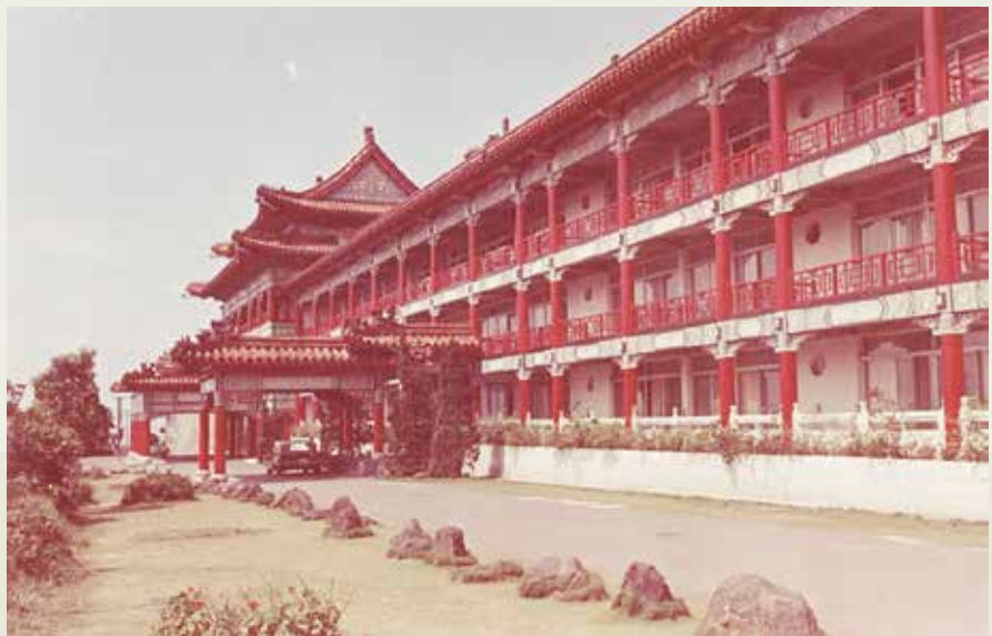
屬於中國傳統式建築的圓山飯店麒麟廳。

完成圓山飯店麒麟廳之後，榮工處後來又陸續承辦了很多項中國傳統式建築，像梨山賓館、陽明山中山樓等。