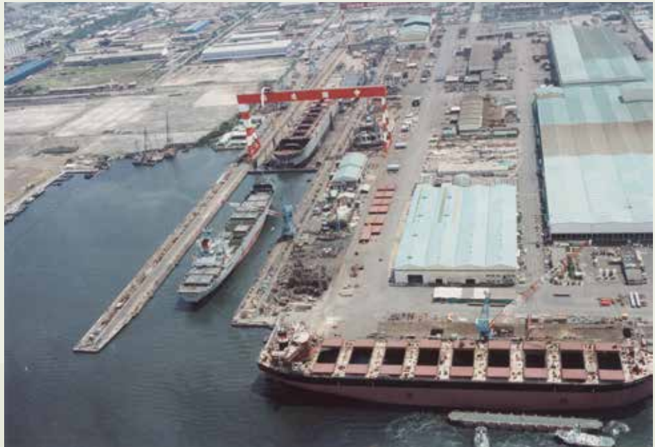
全球第2大的中船乾船塢在十大建設中最先完成，為國人打氣。

大造船廠就是中船公司建廠工程，當時稱「大造船廠工程」，榮工處是與日本鹿島公司合作承辦中船的百萬噸乾船塢工程，這座船塢是自63年3月開工，歷時兩年兩個月到65年6月1日完工，比預定工期提前3個月。