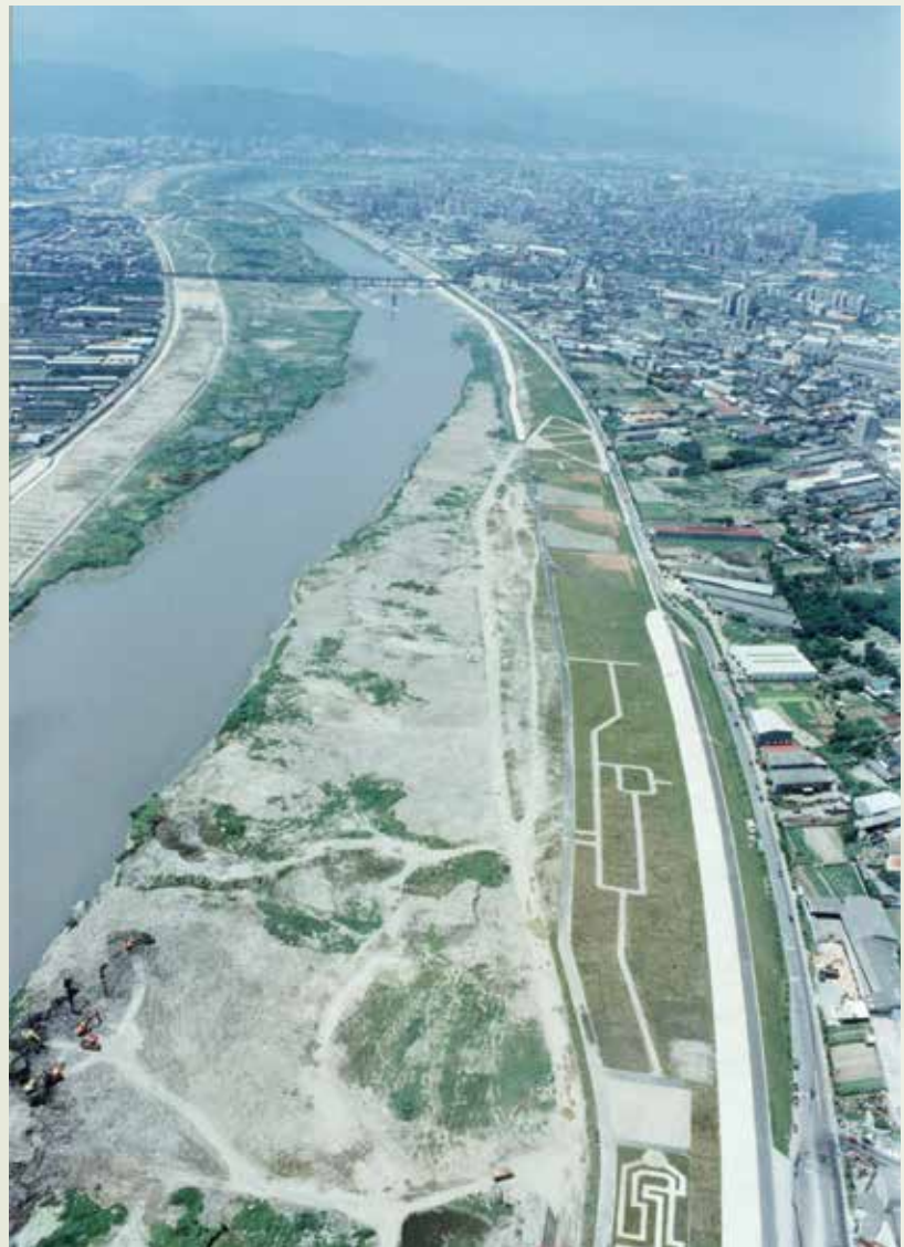
大臺北防洪計畫的樹林堤防。

十四項建設期間，榮工處另外還承辦了許多重要工程，包括基隆港碼頭、新瀨礁炸除；臺北市雙園與大稻埕堤防加高、臺北市衛生下水道、高雄成功污水下水道、臺北市木柵動物園、民權大橋、萬芳社區整地、中彰大橋、西濱大橋、臺中榮總、臺電通霄電廠造地、大肚溪與下大甲溪縱貫鐵路橋新建、中山高林口楊梅段拓寬、頭前溪與鳳山溪縱貫鐵路橋新建；