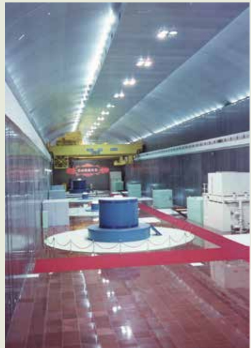
臺電明湖抽蓄水力發電工程是榮工歷年承辦最艱鉅的地下工程之一。

明湖抽蓄水力發電工程，共裝置4部發電機組，總發電量100萬瓩。榮工承辦最艱鉅的地下工程，含上池水中開挖、進水口露天結構、頭水隧道、平壓塔、壓力鋼管隧道、電纜隧道、通風直井、地下電廠、地下變壓器室、匯流排隧道以及尾水隧道等項。自進水口到尾水隧道，分由兩條平行管道所組成，均在深山腹地內迤邐4,000餘公尺，其施工之艱鉅，在國內發電工程首屈一指，其規模也是世界最大。該工程由榮工自68年開始施工，73年12月完成立體結構，74年7月5日，由業方臺電公司完成並聯發電，比原定工期提前100天。