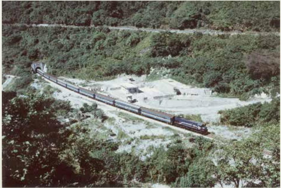
穿山越谷的北迴鐵路是十大建設中員工犧牲最多的一項工程。

全長88公里的北迴鐵路工程，幾與蘇花公路平行，穿山越谷，施工極為艱險，其中隧道16座全長31.29公