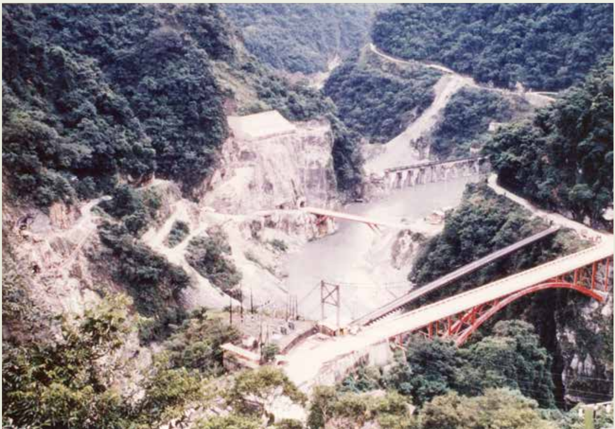
木瓜溪水力發電工程，榮工完成整個流域多座水力電廠。