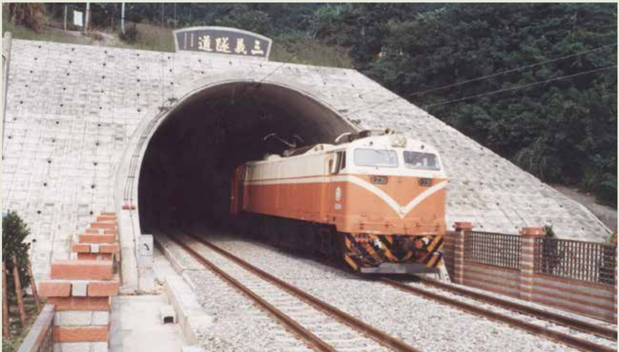
鐵路西部幹線三義隧道完工通車。

三義一號隧道新建工程是由臺灣鐵路管理局以統包方式交榮工承辦。該項隧道是因三義至后里段為改善曲線及坡度線所需新建的一項工程，也由於這座隧道須穿越中山高速公路及三處斷層地帶，施工至為困難。