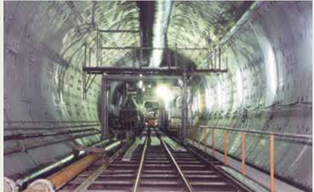
臺電龍門計畫循環冷卻水出水道海底潛盾隧道。

臺電龍門計畫（核四）工程循環冷卻水出水道，主要施工項目包括岸上、隧道及海上3大項。岸上工程包括連接暗渠與出發井，接暗渠為雙孔箱涵，兩座總長90公尺，每孔淨空4.35公尺見方。出發井2座為內徑17公尺形斷面之鋼筋混凝土構造物，開挖深度53公尺。隧道部分為施築內徑6.7公尺長的海底隧道