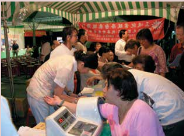
提供民眾健康諮詢、衛教宣導。