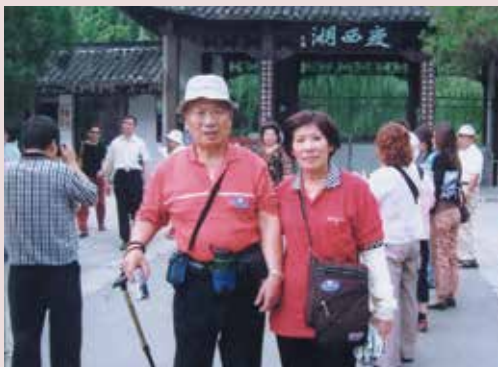
葉主任夫婦旅遊合影。