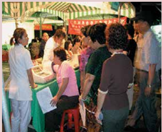
關心民眾健康由協助量血壓開始。