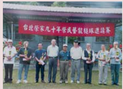
周主任（右5）頒發槌球賽優勝單位獎杯並合影。

任內完成養護榮舍一區工程，經行政院公共工程委員會評鑑，列為89年公共工程金質獎入圍單位，為本會爭光；另積極改善榮民生活設施，完成污水處理廠、衛生下水道、屋頂防熱板、新建槌球場等重大工程，績效卓著；91年1月16日退休，任期8年3個月。