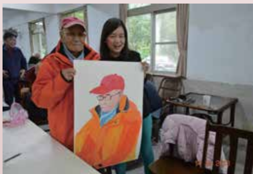
臺北藝術大學師生為義士們義畫。

臺北藝術大學的師生們經過與義士們的互動後，親自為每一位韓戰義士義畫，榮民伯伯們訴說著自己在韓戰中的艱辛，最後來到臺灣展開新的生活，帶著滿心歡喜參與活動，過程中充滿著愛、歡笑與祝福。