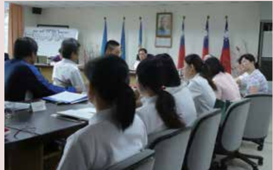
每週召開服務品質管制會議，研討實質內容及制定標準作業流程。