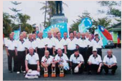
林主任（2排右4）與參加藝能競賽榮民合影。

任內除接受輔導會3年1次的評鑑外，並完成失智榮民養護專區的規劃及建設，為配合失智專區成立，先後完成監視系統工程、大門圍牆整修、房舍加設欄杆、鋪設止滑磚、水溝加蓋、坡度減緩、加裝遮雨棚、餐桌椅及會議室桌椅採購等；又奉輔導會指示，於95年10月，將榮靈祠骨灰罈1,094罈，順利遷厝至臺東縣軍人公墓；為建立榮家品質管理系統，自94年11月起，委託民間企管顧問公司，實施為期3個半月之ISO 9001榮民安養照顧及醫療救護服務之輔導訓練，95年2月16日通過國際品質認證，獲頒正式證書；任期內先後完成美國、韓國等國家外賓蒞家參訪接待任務，對敦睦邦誼，具有貢獻；95年7月15日退休，任期1年。