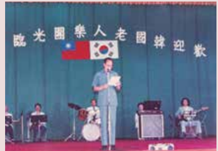
范主任（中立者）介紹韓國老人樂團蒞家演出致詞。

任內不斷改善供水設施，引接山泉，使水源充裕，千餘員工義士飲用無虞，另修建河堤北岸行人登山階梯及扶手，以方便義士登山散步，由於中心員工均外住臺北、板橋、桃園等地區，每日派交通車接送上、下班；為強化義士身體，構置復健器材計按摩機等20餘種，分於保健組及第四區設置，以利理療；另為尊重民俗，除建立榮靈祠外，並於每一輔導區設置佛堂1座，奉祀義士宗親神位，另於第四輔導區設置宗教活動中心，充實義士精神生活，使心靈有所慰藉；77年10月1日退休，任期5年1個月。