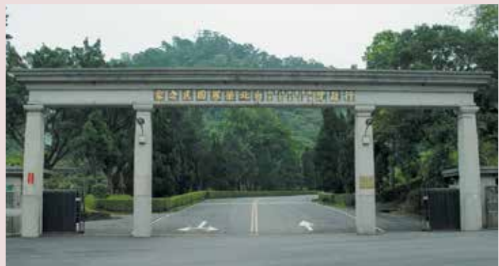
三峽白雞臺北榮家大門全景。