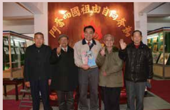
熊主任（中）展示紀念韓戰反共義士返臺60週年紀念專書「抉擇」。

韓戰反共義士返臺60週年紀念，熊主任特別發起舉辦慶祝活動，編輯紀念專冊「抉擇」。臺北市立景美女中儀隊、樂旗隊由校長親自帶隊到臺北榮家，以壯盛與整齊的陣容表演，臺北藝術大學師生也用畫筆為反共義士繪製了60多幅肖像，他們共同向1954年回臺的反共義士們致敬。