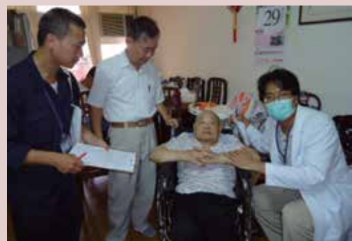
新進住民入住前做家庭訪問。

新進住民入住前，均由社工及醫護人員先期家訪，除評估入住類別（安養、養護、失智）並溝通入住後照顧（護）作法，與家屬簽訂「有眷榮民進住協同照護須知」建立照顧共識，協議照護作法。