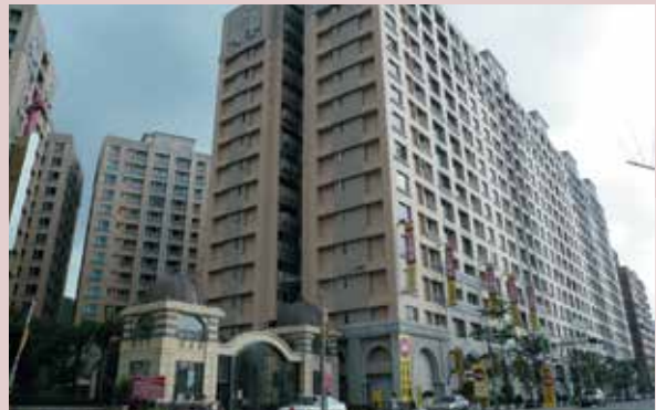
改建後之眷舍（更名為太陽城）外觀。