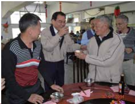
除夕與榮民圍爐吃年夜飯。