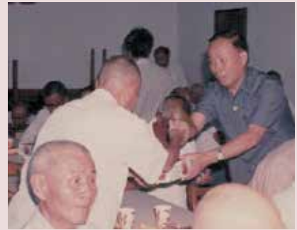
黃主任（右立者）主持慶生會並致贈榮民生日禮品。

任內為美化環境，於北家區內修建方角亭一座，南家區內自由人像附近增建水泥鋼筋花架一座，另培植一串紅、萬壽菊等花卉，以陶冶義士生活情趣；為有效利用農地，避免荒蕪，以達地盡其用，種植木瓜1萬餘棵，並鼓勵各堂自行種植蔬菜，由中心派人技術指導，能有效改善義士生活；79年2月1日調任花蓮榮家主任，任期6個半月。