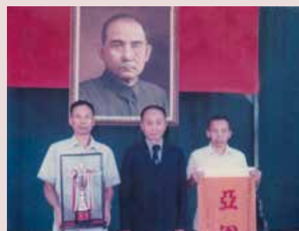
熊主任（中立者）頒發優勝單位獎杯錦旗。

熊主任湖北省鄂城縣人，民國前2年2月13日生，陸軍官校第11期畢業，56年1月1日以陸軍少將退伍，62年7月4日奉輔導會輔人字第7950號令由高雄市聯絡中心主任調任本中心主任，同月12日辦理交接，本中心三峽房舍新建工程，亦於同日正式開工，64年6月完成第一期工程，同月18日由桃園遷駐三峽新址，新址計有美輪美奐辦公大樓1棟，義士宿舍7棟，中山堂1棟（一樓為餐廳及廚房、二樓為紀念堂），義士接待中心1棟與大門、警衛室、會客室、自由鐘、自由人像等，以及柏油道路均興建完成，備極辛勞，67年3月16日奉准退休，任期4年8個月。