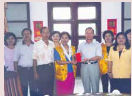
張主任（右4）接待民意代表蒞家慰問並賀佳節。

任內致力於改善榮民生活設施，如：增建榮舍殘障電梯、文康中心及家史館裝修、建立餐廳殘障坡道、榮舍生活設施改善、完成養護二區工程，闢建正義公園，舉辦「一二三自由日五十週年」慶祝活動，帶領義士返韓懷舊之旅，將伙食改成自助餐式供應等，績效卓著；94年7月16日奉調白河榮家主任，任期3年6個月。