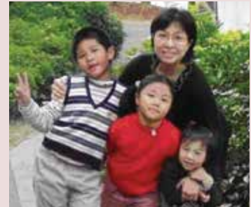
彭小姐（後立者）與三位子女合影。

作更懷抱著憧憬，因此，在父母的支持與認同下，雖然學費昂貴，仍投考護校並順利錄取，開始了她的護理生涯。