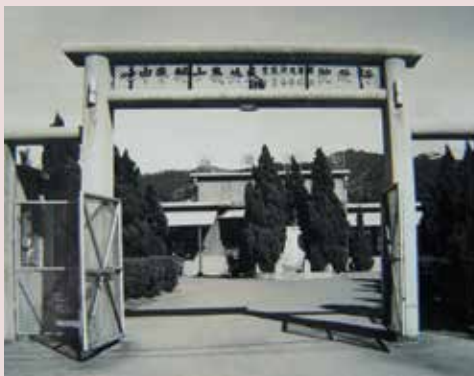
桃園虎頭山反共義士輔導中心大門全景。

83年8月31日輔導會輔人字第15440號函頒榮譽國民之家組織規程及編制表一「行政院國軍退除役官兵輔導委員會臺北榮譽國民之家」自83年9月1日正式成立。102年11月1日配合行政院組織改造更名為國軍退除役官兵輔導委員會臺北榮譽國民之家迄今。