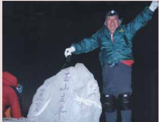
74歲高齡之葉主任登上玉山主峰英姿。

86年7月1日退休後，為不閒散無事，曾任大樓管理員及鶯歌高職警衛工作，70歲起才未工作，每週登山健行2~3次，最具代表性的一次是94年10月22日，以74高齡登上玉山主峰，目前生活悠閒，身體健康，家庭和樂幸福。