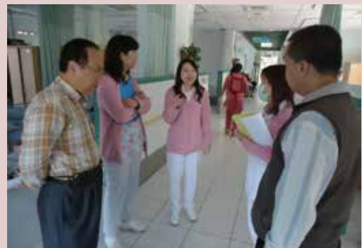
每日上午實施巡堂，瞭解堂隊狀況及需求。

依據自主檢查表，每日上午由輔導組組長、保健組組長、堂長，實施巡堂，瞭解堂隊服務人員與榮民之間互動狀況及需求。每月召開跨專業整合會議或個案討論會，針對特需個案專案輔導或提供各別化照顧（護）服務以改善其身心狀況。