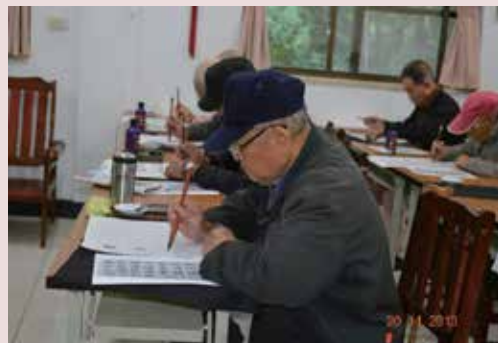
松年大學書法班榮民伯伯們聚精會神的練習書法字。