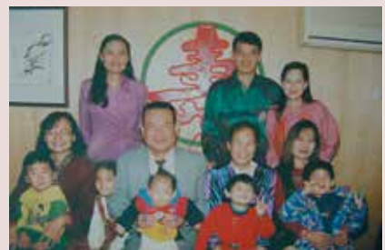
孫副主任（前排左2）全家福合照。