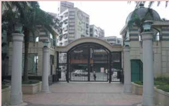
改建後之眷舍（更名為太陽城）大門。