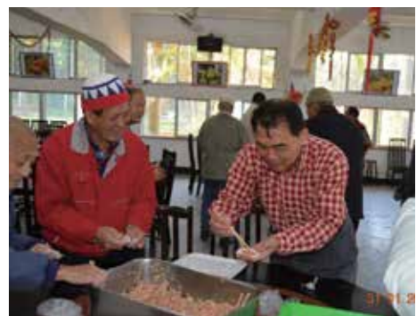
大年初一與榮民包水餃同樂。

然榮家之經營非僅止於文康、療護的規劃，更須投諸硬體設施的營建，本家位處坡度平緩的山坡地，景色優美、空氣清香、水質甘甜，惟房舍、設施老舊，復因受山開、水保及環境評估限制，重建困難，任內致力改善榮民生活設施，針對榮家之評鑑缺失，規劃103-106年家區整體設施整修（建）案，俾使此規模宏偉、歷史悠久的榮家，塑造成為本會優質服務、永續經營的標竿。