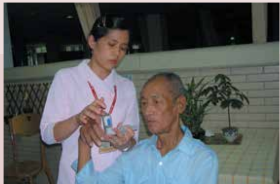
衛教師教導榮民定量吸入器之使用。

本榮家除關心榮民身心狀況，亦十分重視社區民眾之健康，乃擴大社區服務，與三峽鎮衛生所合作，辦理社區整合式健康篩檢、大腸癌篩檢，并參與社區活動，如臺北縣2007年三峽藍染節、龍舟錦標賽與綠茶、綠竹筍文化季等活動，提供民眾健康諮詢、衛教宣導，深獲民眾好評。