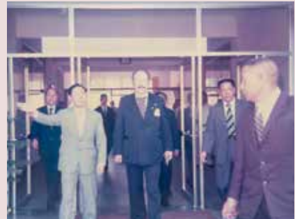
駱主任（左1）接待外賓參訪。

任內注重義士衛生教育，利用上課時間及月週會講解保健常識，對醫護人員尤著重進修，除督導閱讀醫學書刊外，並經常於小組會中提出心得報告，相互研討，以吸取醫學新知，另於「一二三」自由日與地方共同舉行慶祝大會，並辦理棋藝、球類競賽及登山、慶祝晚會等活動，同時成立文康中心，添購各類書刊雜誌；每月均舉辦慶生會，並辦理慶生晚會，共享家庭溫暖，69年5月1日調任中正紀念堂主任，任期2年1個月。