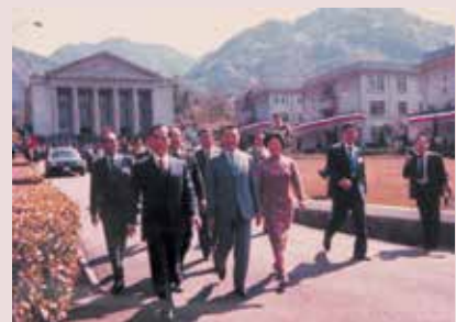
鄭主任（右4）陪同鄭前主任委員為元巡視中心。