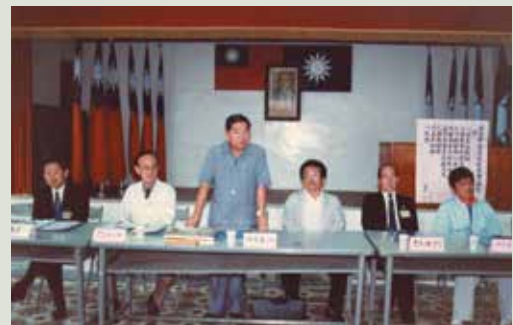
民國80年石主任（中立者）主持榮民座談會。