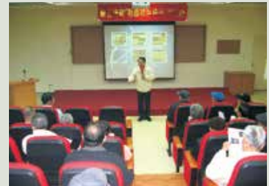
林主任主持勸導返家內住說明會。