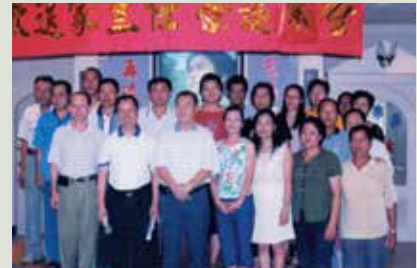
歡送韓主任（左前3）榮退茶會。