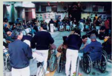
慈濟志工來家舉辦團康活動。