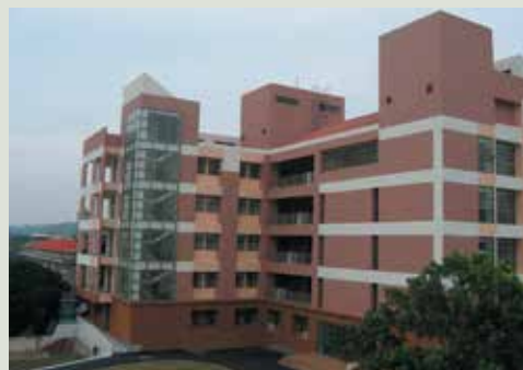
中正紀念堂拆除改建成安養大樓。