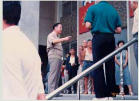
民國83年沈主任（中立者）主持消防演練。