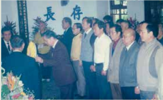
舊有之家祠公祭情形。