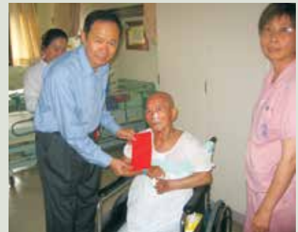
陳主任於端節前慰問住榮民並致贈慰問金。