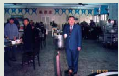
韓主任(右立者)主持榮民餐會。