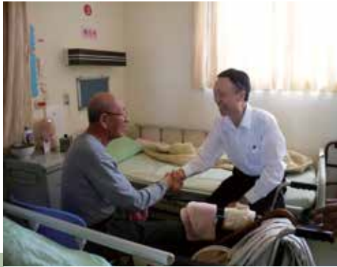
雷主任訪視養護堂榮民。