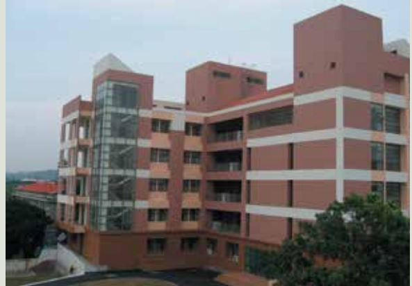
民國95年11月中程計畫第1棟榮舍完工啟用。