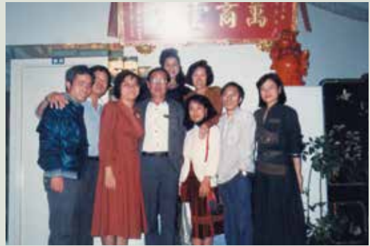
袁主任（左4）離職後與員工相聚。