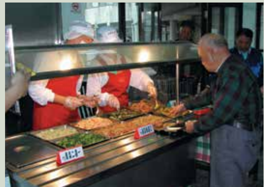
自助餐供餐時榮民自由選擇菜色情形。

早期為聯繫榮民袍澤如同家人的感情，用餐方式採用傳統桌餐，然而隨著年歲增長及衛生考量，老人不適宜再以桌餐方式用餐，本家排除萬難配合輔導會政策，於民國93年8月起改以自助餐方式用餐，菜餚均採8菜自選5菜，榮民在用餐的時候，可以自由選擇葷菜或素菜及自己喜愛的菜餚，打破以往單調的用餐方式，並能充份滿足榮民用餐的需求。