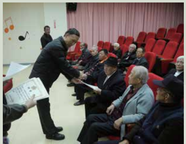
雷主任台青頒發榮管委員證書。

榮管會為建立安養榮民良好人際互動關係，透過相互扶持、互助照顧作法，增進袍澤情誼，培養互敬、互愛、互助風氣，消弭因榮民日常生活所導致之潛存問題，營造溫馨祥和友愛之頤養環境，提升住家榮民對其居住環境之參與感與強化團隊精神為宗旨。