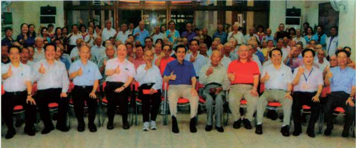
民國101年7月14日馬總統英九先生（中間）蒞家巡視與榮民大合照。