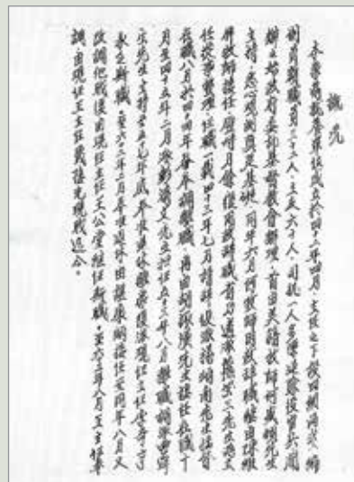
本榮家創始之原始手寫文書。