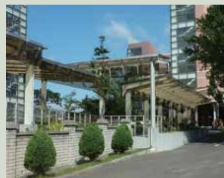
嵩德樓至嵩瑞樓間風雨走廊。

曾前主任委員金陵先生蒞家訪視榮民，體恤本榮家榮民於天雨時，影響行走安全及活動空間減少，提出建置風雨走廊，於100年9月1日開工，100年12月31日完成含嵩瑞樓大門風除室及嵩陽樓三樓陽臺遮雨工程驗收啟用，造福榮民。