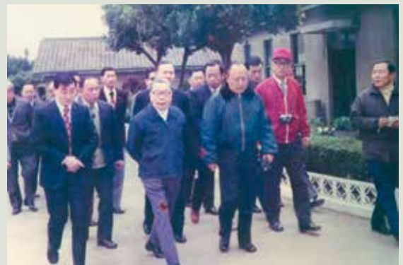
民國69年11月蔣故總統經國先生蒞臨訪慰榮民，王主任（右前3）引導陪同。

三、整體設計興建榮舍4棟及中正紀念堂等建築物，陸續於70年完工，使榮民居住環境大為提升，改善了住的品質，適時榮民年齡均已老邁，遂停止生產事業，設立「自由、平等、博愛、民主」等4個堂照顧榮民生活。