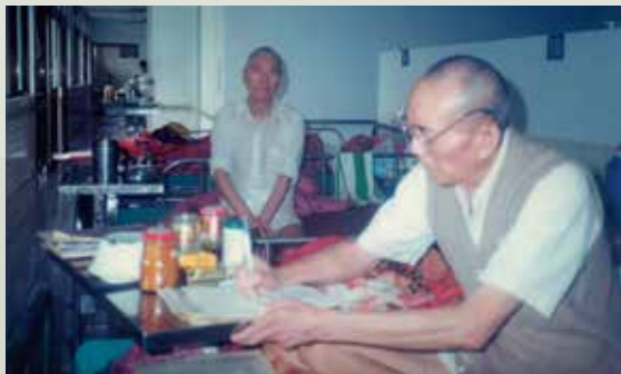
整修後養護堂之病房新貌。

本榮家於民國79年10月成立養護堂，養護床位84床。87年整建房舍，增加為102床，為增加養護榮民活動空間，規劃完成中庭設計，佈置並種植各類花草植物，提供養護榮民每日健身活動、休閒娛樂及辦理各項大型聯誼活動使用。92年又擴增為目前之130床，使本榮家養護服務更為周全。在歷任首長的支持及所有工作同仁的努力下，本榮家盡心盡力提供輕、中度失能榮民養護照顧服務。並於91年12月28日完成養護堂「護士呼叫及監視系統」，以加強養護榮民安全管理，提升照護品質。