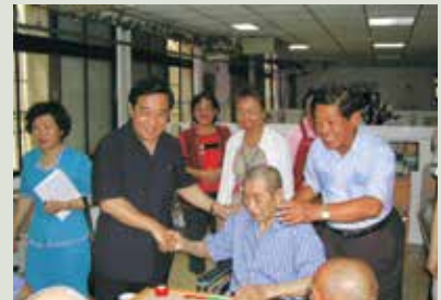
94年安養評鑑張主任（右1）陪同評鑑委員實況訪問。