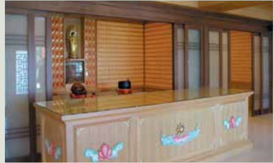
整建後莊嚴寬敞之榮靈祠