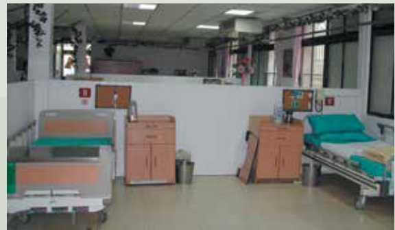
舊有之養護堂病房原貌。