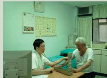
保健組醫師為榮民看診情形。

本榮家針對罹患憂鬱、失眠等症狀之榮民，於民國95年初採取最新光療機照射設備，使用照射治療法減緩榮民憂鬱、失眠等症狀，為輔導會安養機構之首創，迄今施作已超過40餘例，經評估監測，執行成效良好，深獲榮民好評。本榮家現有內科、眼科、精神科、復健科等四科門診醫療服務；其中精神科係由竹東榮民醫院精神科醫師定期來家開設門診，復健科與新竹市和平醫院簽訂支援協定為榮民實施復健治療，所有門診皆對內外住榮民及社區民眾提供醫療服務，並配合榮服處及新竹市曲溪里辦理相關醫療外展服務工作，以落實輔導會醫療外展服務政策。