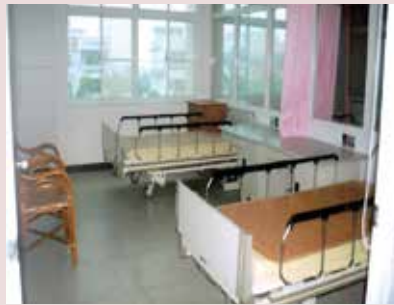
新建養護大樓榮舍2人1房現況。