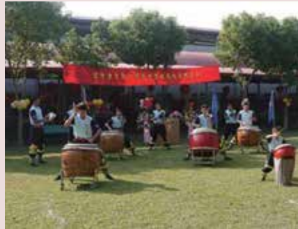
和平堂房舍啓用典禮。

設計上以符合安養老人體能狀況；注意各種設置、地坪及緊急求救裝置之安全。空間以無障礙設施、動線流暢、避免妨礙行動作規劃，講求私密性，並兼顧服務人員之照護便利性