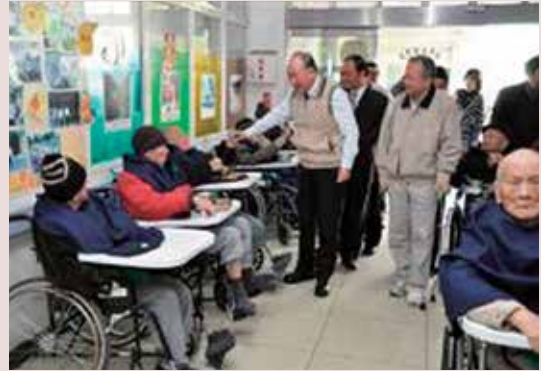
曾前主任委員來家探視自費養護住民。

民國83年3月1日以「部分供給制」方式開辦未公費就業榮民自費養護的服務，初期於忠孝堂舊有榮舍改建192床養護床位，87年9月配合行政院「擴大內需方案」於仁愛堂榮舍及舊保健組現址規劃興建3棟3層（400床）身心障礙榮舍，一切生活設施，空間規劃均依老人福利法規定建置並以老人安全與身心障礙者便捷舒適為首要考量。