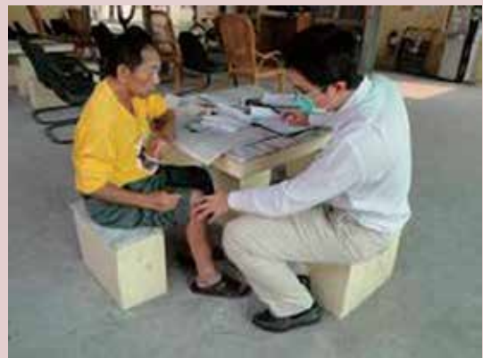
每週一至五上午復健理療服務。