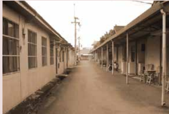
46年榮家成立初興建榮舍

本榮家係由行政院國軍退除役官兵輔導委員會運用美援經費依據「國軍退除役官兵輔導條例」第十六、十七條規定設置，目的在安置照顧功在國家年老無依榮民，提供榮民食、衣、住、行、育、樂、醫療保健、心理輔導與善後處理暨遺產繼承之服務，於民國45年7月17日開始興建，46年4月完成，5月2日舉行落成典禮，46年7月起隸屬臺灣省政府社會處，受輔導會督導，70年7月1日改隸行政院國軍退除役官兵輔導委員會，102年11月1日配合行政院組織改造更名為國軍退除役官兵輔導委員會雲林榮譽國民之家。