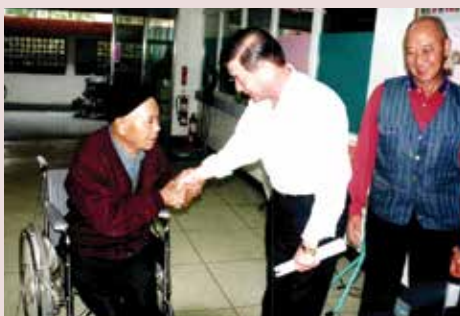
張主任（中）巡視家區探視榮民。

不論以榮民需求、安全、舒適的生活設施改善及與社區資源結合，強化醫療保健與多元豐富的文康活動以提升榮民身心協助與服務。