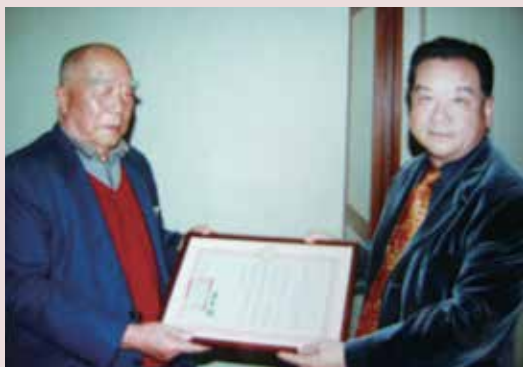
秦主任（右立者）頒獎模範榮民。