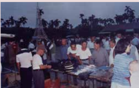
休閒廣場開放夜市榮民購物情形。