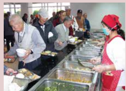
自助餐方式供應菜餚。