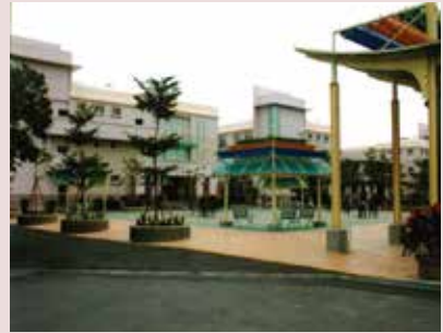
新建養護大樓及休閒廣場。