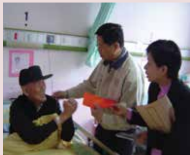
民國95年端節楊主任慰問住院榮民。