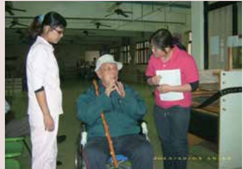
營養師辦理營養諮詢門診。

六、自99年1月起增設營養諮詢門診，每週四下午由營養師為住家榮民針對個人飲食方面實施營養諮詢，以改善榮民飲食習慣及均衡營養。