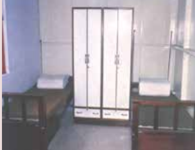
舊榮舍榮民寢室內部景況。