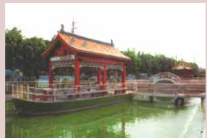
龍鳳池亭榭舟楫，觀賞休憩。

家區原舊榮舍林立，生活空間狹窄，榮民活動空間有限，民國88年間配合養護大樓興建，拆除老舊榮舍，建置停車場、廣場各乙座並裝置涼亭及休閒桌椅，供榮民納涼、休閒、戶外活動，另闢設苗圃，培育各種時令花卉，提供園藝種植，依季節美（綠）化家區，並運用養護大樓旁空地規劃公園、槌球場，擴大其空間，供榮民多樣化休憩活動場所，提升榮民生活品質。