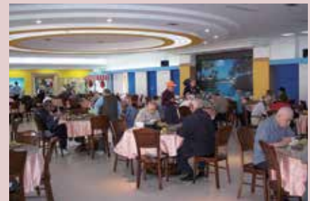
溫馨祥和、健康營養。

榮民飲食菜單均由專業營養師依榮民需求及均衡攝取六大類食物之前提下，依季節設計30天菜單，計675道菜色，每日主食固定供應乾飯、稀飯、饅頭、豆漿並搭配包子、水餃及麵包各式麵食供應，其主副食豐盛多樣，且另備6樣小菜供榮民自行取用，並設置自助煮麵專區，由服務人員烹煮供應，以達全方位之服務品質目標。