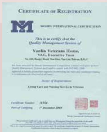
ISO 9001國際品質管理認證證書

本家為全面提升服務品質，藉由外部專業之輔導顧問公司，診斷服務過程是否具備品質管制系統作業流程，自94年9月15日正式與台新品保公司簽訂輔導合約，積極推動申請ISO 9001安養照顧及醫療救護服務國際品質管理系統認證事宜，為確保ISO工作推展之有效性，特編成專案推動小組，在各級主管負責督考、管制下推行執行相關業務，嚴格要求所屬承辦人員依進度完成各項管制工作。本案於94年12月1日由慕迪公司認證並獲得通過，另於99年1月20日認證通