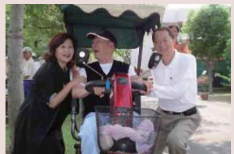
辦理99年度雲林縣長青槌球聯誼賽與縣長蘇治芬合影。