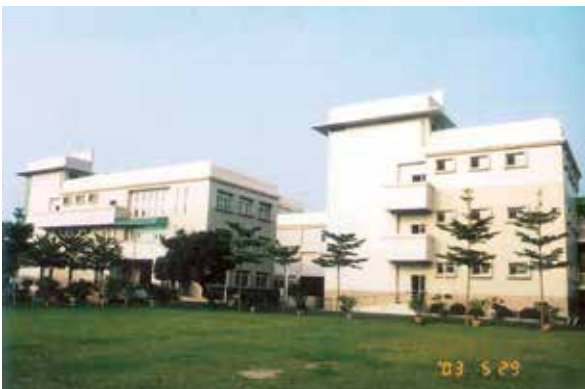
89年興建3棟3層（400床）養護大樓

75年至79年間分別增建松柏樓、復健中心及保健大樓，開設牙、眼、及家醫科門診以加強榮民醫療保（復）健作業及身心障礙榮民服務照顧，83年3月1日以「部分供給制」的方式，開辦支領退休俸榮民自費安養與養護的服務，87年9月配合行政院「擴大內需方案」辦理整建構置榮民養護設施