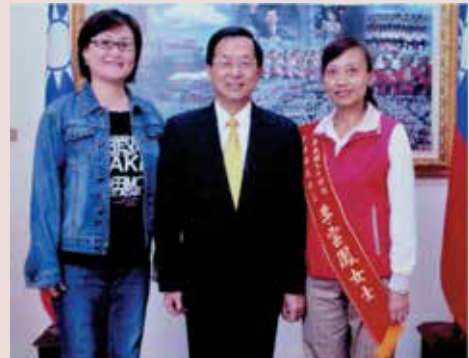
當選民國94年度全國模範勞工與陳前總統合影（右1）。

老人心靈的空虛，為豐富住家榮民精神生活，積極推動爭取社會資源，協調慈濟功德會、佛光山友愛服務隊、慈恩修心靜思會、威盛信望愛基金會、基督大連教會、天主教、鄰近各大專院校博愛社團等，來家居家關懷，帶來溫馨的活動與歡樂，讓榮民們心靈有所寄託，榮家現有500多位榮民，在臺舉目無親，早已把臺灣當成自己的家，這群離鄉背井的老人都經過歷史的苦難，每位都是很可愛的老人，他們需要更多的愛與關懷，也因此李女士誓言將投入全部心力繼續照顧這群無依的老人。一路走來她均本著慈濟「大愛」精神，以熱誠來服務照護長輩不遺餘力，深受長官嘉評及長輩們讚譽，88年當選輔導會員工楷模接受表揚、94年5月榮膺全國94年度模範勞工接受表揚。