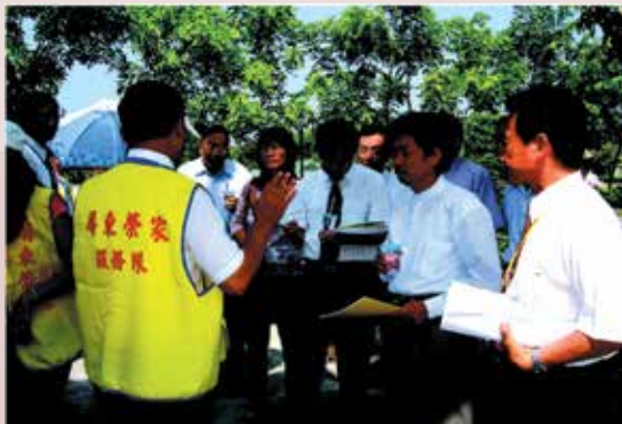
學者專家實地評鑑安養現況。

輔導會為加強安養機構之管理及對榮民之服務照顧，參照內政部對臺閩地區公私立安養機構評鑑方式邀請專家學者組成評鑑委員，對18所榮民安養機構實施評鑑，民國91年本榮家接受第一次安養機構制度化評鑑作業，經學者專家評鑑報告指出多項缺失與改革建議；本榮家為迎接94年度第二次機構制度化評鑑，全體同仁虛心檢討追蹤改革及克服困難追求卓越，在首長旺盛企圖心與正確領導及同仁們共同努力；經評鑑總成績榮獲榮家績優獎（第2名）及最佳進步獎。