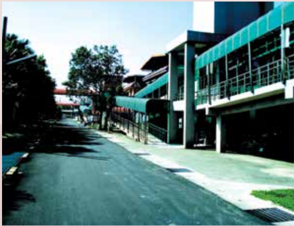
室外無障礙設施－斜坡道。

本榮家早期大部份為老舊建築，榮民年齡與體能尚屬中年老人，無障礙環境的建構在當時仍未被重視，80年代起，榮民年齡老邁體能衰退，為使家區之環境設施更能符合人性化，歷任主任皆積極貫徹輔導會政策，致力於無障礙生活設施改善，正是服務照顧具體實踐重要指標，以提供榮民長輩溫馨舒適的居家環境。