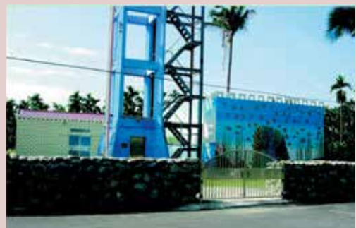
自來水製水供應系統。

本案主要工程有新建300噸儲水槽乙座、機房乙座，94年12月份竣工使用，每日造水最大容量480噸可滿足本榮家安養榮民飲用水之需求，使榮民先進能享有安全、健康、衛生無虞的飲用水品質。