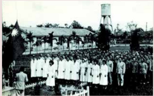
丁主任（前中）主持榮民及員工升旗典禮。

丁主任在任雖僅4個月餘，但其秉持堅定的信仰，除了為榮民帶來心靈上的滿足外，創立榮民識字班，協助不識字的榮民弟兄讀書習字，吸取知識，同時成立習藝班，教導一生戎馬的鐵錚漢子，充實其知識與技能。