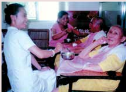
李小姐（左2）餵食失能榮民長輩。

為提升工作效率，她學習使用電腦，並拿到電腦軟體應用丙級技術士證照；為讓體弱多病的老人得到更好照顧，主動接受完成居家服務員及照顧員轉銜訓練，取得服務員證書；為陪老人做運動，取得槌球C級教練暨裁判證照，深諳機構