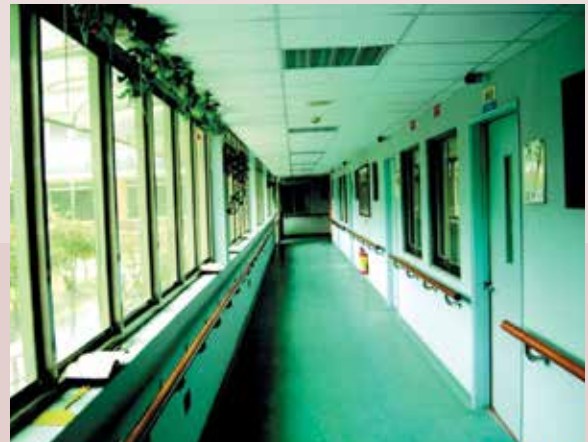
室內無障礙設施－扶手。