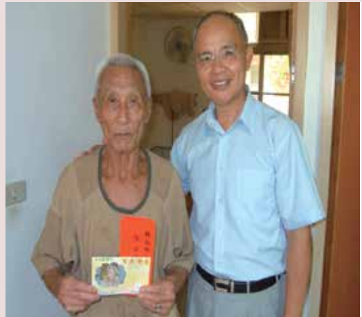
首長親臨為每一榮民慶生祝賀壽。

邱主任對本會政策及相關業務重點甚熟稔，學能優異，品操良好，處事謹慎細密，對所屬工作指導甚為細膩，不厭其煩，領導統御深得部屬向心；其每日抽空巡訪堂隊，探視榮民，深得榮民贊賞。