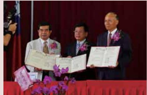
退輔會金副主委見證與美和科技大學簽署「策略聯盟」儀式。

與屏東縣政府簽署「資源共享」合作備忘錄，提供「忘我園區」6-12床，由縣政府委託65歲以上獨居失智且低（中低）收入戶接受照顧。102年9月4日收容照顧第一位女性民眾，「萬綠叢中一點紅」，使榮家有家的感覺，獲得報章與電視媒體的大幅報導，有效活化資源，輔導會已函請各榮家參照辦理資源共享。