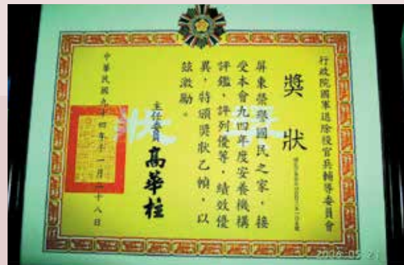
安養機構評鑑榮獲優等獎。