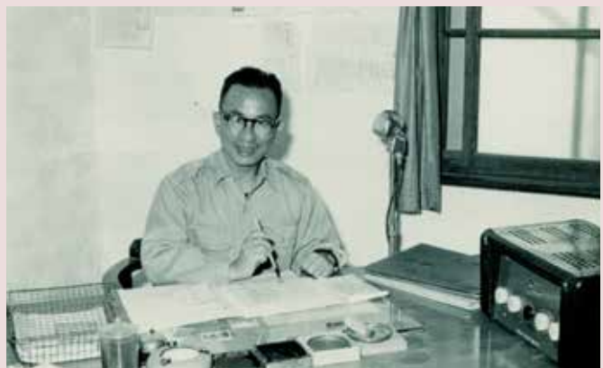
岳主任於辦公室內批閱公文。

岳主任對員工及榮民照顧不遺餘力，就任後首先成立福利社，以完善品質及服務對內營運，47年4月9日興建失能榮民宿舍乙棟，48年7月16日成立豆腐工廠，50年建職員眷舍3棟、癱瘓榮民宿舍3棟、廁所、廚房、車棚各乙棟，51年建職員眷舍、福利中