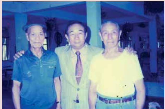
王主任（中立者）與榮民合影。

接任本榮家主任後，致力興利除弊，改善榮民生活品質及加強心理輔導，營造溫馨祥和頤養環境；為精進榮民伙食，籌組榮民伙食委員會，由員工輪流辦伙，榮民負責監督，嚴格控管伙食，要求精緻、營養、味美，多樣化，務使榮民吃得飽、吃得好。王主任更落實照顧榮民及遺眷，期間安置榮民眷屬10多人，解決榮眷就業問題，落實輔導會照顧榮民遺眷之政策。