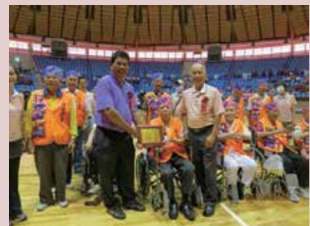
住民參加音律活化年齡倒著走活動。

為營造溫馨家園，連結引進佛光山紀念館、榮欣志工隊、松竹關懷協會、宏泰老人養護中心、大老師幼兒園，及榮華、泰安、新生國小等20餘個社會、宗教、慈善團體、學校等協助，辦理160場次多元性的大型文康活動，舒解榮民生活壓力，開闊個人的社會參與，增強人際關係，帶給住民41,096人次健康、樂趣及無限美好回憶。協調鐵改局南工處及屏東縣政府，免費運送土方回填廢魚池，擘劃為開心農場；獲屏東縣、內埔鄉、建興村協助，重修家區對面及圍牆外AC道路及排水系統；屏東林管處提供經費共辦「低碳世紀、森活做起、植樹養生、建康樂活」植樹活動；與鄰近社區辦理關懷據點、送餐服務與健康促進等回饋鄉里；協調屏東地檢署調派社會勞動人及協請軍事單位調派兵力協助整理家區及疏通排水設施。上述種種努力的成果，為榮家總體營造節約3千萬元的成本。