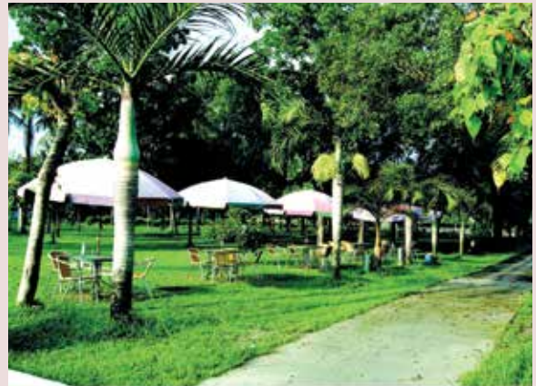
家區榮民休閒處所。