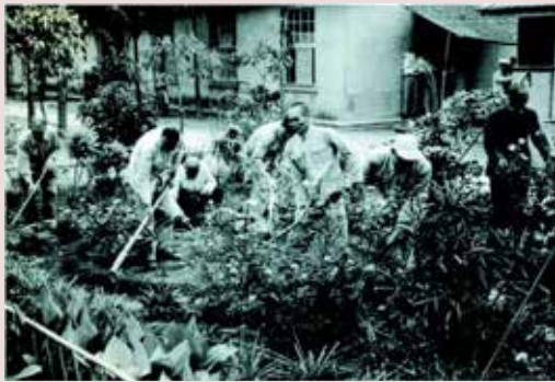
榮民辛勤工作美化家園。