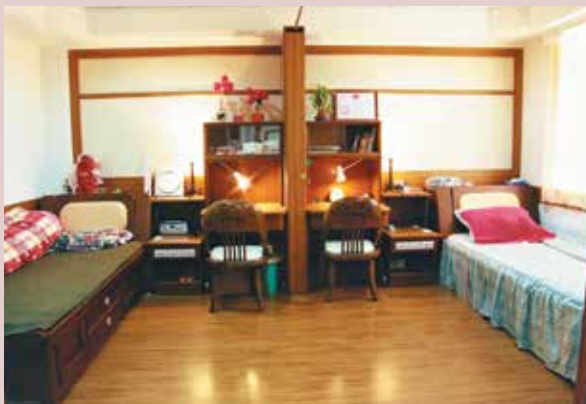
現代化起居設施之雙人套房。

民國92年4月整建和平堂舊榮舍為雙人套房，共21間42床，92年12月16日正式啟用，每層樓設有文康室，每間分設臥室及客廳，寢室內備有衣櫃、床組、書桌、床頭燈、電扇、美術燈組及床頭櫃等現代化起居設施，均採用符合老人適用材質的用具配備，充分考量高齡榮民生活所需。