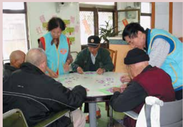
榮民藝能活動—拼圖遊戲。

針對行動不便榮民實施床邊關懷、餵食，並協助購物，就醫及陪同身障榮民復健，有助於孤寂心情之排解，對本榮家服務照顧榮民工作助益甚大。