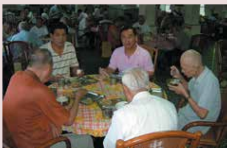
詹主任（右2）與榮民共餐。

一、本家自榮院開放、圍牆拆除後，已有宵小進入榮舍偷竊情事，榮民生活於恐懼中，加派夜間巡查人員，並協請馬蘭派出所夜間至家區巡查，強化防竊措施。