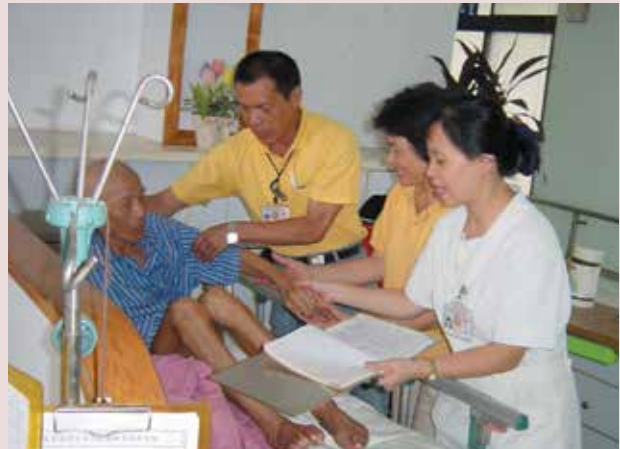
三合一聯合巡房走動式服務。

每日早上8時起由堂長、照服員及責任護士，實施三合一聯合巡房，向榮民噓寒問暖、量測血壓、用藥追蹤及衛教，提供更多服務項目，縮短彼此距離，期能儘早發掘問題，適時予以解決。