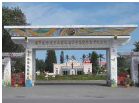
民國102年榮家組改後新大門。