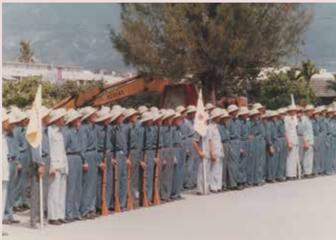
榮民編組自衛隊演練情形。