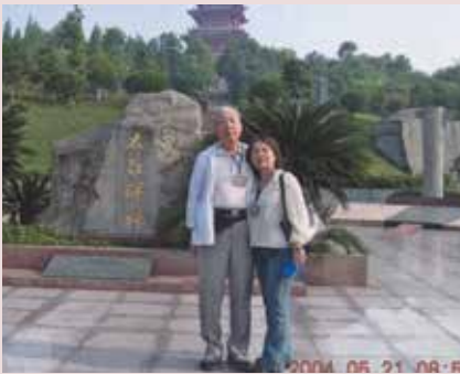
張主任夫婦生活照。

張主任民國17年1月7日生，河南省開封縣人，畢業於陸軍官校第22期，歷任連、營、旅、師長等職，77年10月12日陸軍少將外職停役，調任本榮家主任，任期3年7個月。重要政績如后：