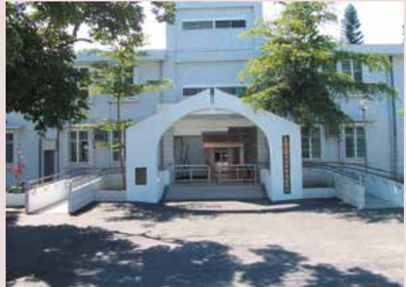
慎修養護中心大門。

以最完善的生活設施，最專業的服務團隊、高品質的醫療照顧及多樣的活動，營造溫馨、祥和的頤養環境，10年來成效深獲各界肯定；於94年1月1日依促參法委託民間經營。