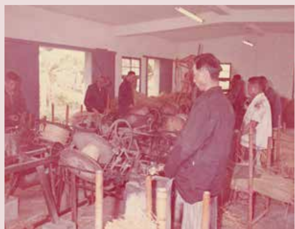
草繩工廠運作情形。