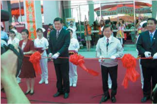
行政院謝前院長長廷（右2）主持臺東榮院落成啓用剪彩。

本榮家累積老人服務經驗與成效，以六星計畫中「社區安全」及「社福醫療」為主軸，結合臺東縣榮服處及臺東榮民醫院，共同推動「馬蘭健康社區」，結合南榮、新生及馬蘭3里，嘉惠社區民眾。行政院謝前院長長廷於民國94年6月21日蒞臨本榮家視導，聽取「營造馬蘭健康社區」計畫後，除表示肯定及嘉許外，期許能持續有效推動。