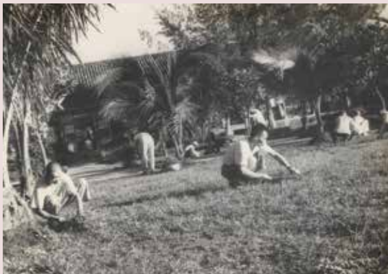
榮民整理環境情形。