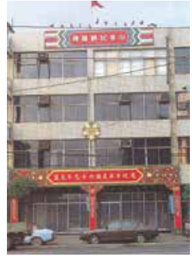
民國64年～74年位於南京東路榮民服務處的全貌 (69.6)。

85年12月組織修訂後，編組有處部、服務組、輔導組等，按臺北市12個行政區劃分責任區，執行榮民（眷）就學、就業、就養、就醫及服務照顧等工作，並辦理單身亡故榮民治喪善後作業及遺產管理人業務。