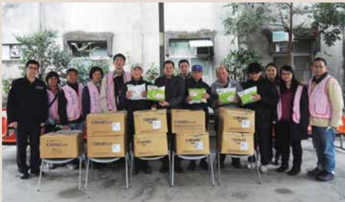
102年12月24日吳興街退舍寒冬送暖活動。

鄭處長除祝福榮民伯伯春節快樂外，特別提醒榮民長輩們注意身體保健，並進行防騙宣導，鼓勵單身年長獨居榮民進住榮家，以頤養天年。