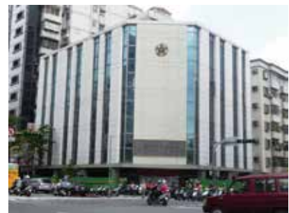
民國94年臺北榮民服務處外牆整建後全貌 (94.12)。