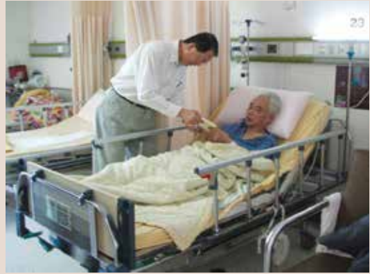
謝處長探視住院榮民。

謝處長本著服務照顧榮民的理念，鼓勵服務體系同仁要累積智慧、愛心和經驗，讓榮民（眷）在各項權益和福利上得到及時、貼心的照顧，並讓渠等受到尊重及感受到榮服處用心服務與關懷。