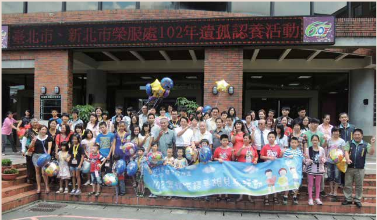
102年8月27日本處於臺北市劍潭活動中心舉辦102年相見歡活動。

鄭處長請榮民袍澤及民眾發揮慈愛精神，認養榮民遺孤，使渠等獲得良好的成長環境與妥善照顧，期盼榮民及更多企業團體、善心人士共同認養遺孤，讓遺孤順利成長，減少社會負擔。