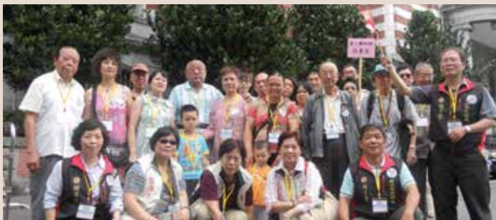
100年度外籍暨大陸配偶生活適應成長營聯誼活動參觀總統府。

民國100年6月辦理「希望臺灣—100年度外籍暨大陸配偶生活適應成長營聯誼活動」，期待藉由寓教於樂之方式，讓外籍暨大陸配偶認識臺灣文化，增進在臺生活適應能力，並結合資源關懷接納新移民家庭，共計有近120個家庭（240多人）參與，內容有各類新移民相關法令宣導、新移民中心關懷、認識臺灣文化—總統府、八里垃圾焚化廠的參觀學習等，當日參加人員滿意程度調查，高達98%以上均表示相當滿意參與此項活動，也感謝榮服處的用心及關懷。