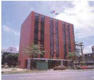
民國74年位於光復北路的榮民服務中心全貌 (74.6)。

榮民服務處成立之初，設籍臺北市16個行政區、臺北縣29個市、鄉、鎮之榮民，總計在10萬人以上，經將本處服務組同仁編組為臺北市、臺北縣、