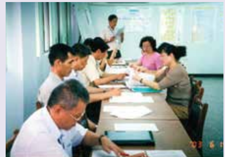
蕭前專員（左4）認真與同仁研討會議資料（91.5）。

蕭前專員於78年8月31日進入本會楠梓榮民醫院擔任輔導員職務，83年5月1日奉調本處擔任輔導員，並於85年7月調升專員，於94年7月16日因人生另有規劃，自請退休獲准。蕭前專員在本處任職期間工作主動積極，即使擔任多重業務角色，但其所投入之心血，並未因而有所差異，諸如辦理春節榮民聯歡活動、兼辦人事、總務負責採購、修繕工程等工作，均不遺餘力榮獲獎勵，是不可多得的優秀公務員。蕭前專員尤其自律自重，是位完美主義者，常有己達達人夢想，服務期間最值得記憶的是他完全出於自發性，於90年6月間，開始成立兒童美語班，並由自己親自教學，這種十年樹木、百年樹人的偉大情懷，確實難能可貴，誠屬蔚為風氣之先，從今爾後，應可做為各榮民服務處及會屬機構學習的典範人物。