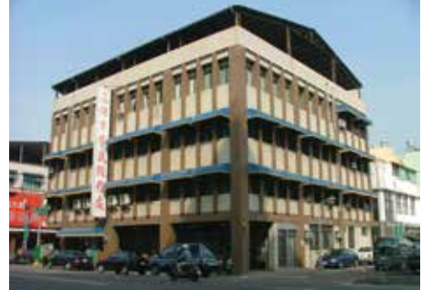
高雄市榮民服務處辦公大樓自強二路門面（94.11）。

整併後榮民服處將建構具有「高效能、負責任、應變力」新服務團隊，提供榮民（眷）優質且兼具方便性、時效性、地域性之服務照顧，彰顯永續服務照顧之功能。