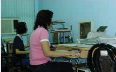
文書室執行檔案回溯及公文電傳作業(91.3)。

輔導會對落腳高雄市榮民（眷）之服務照顧需求極為關切。早在民國47年9月24日即成立「高雄地區輔導組」，當時業務由「楠梓榮民醫院」兼辦，辦公處所則先後設置於楠梓榮民醫院、鼓山三路108之34號、河北二路154號、鼓山一路139號、七賢一路17號、十全一路367號等處址。