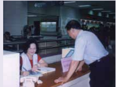
駐榮總服務台接待榮民，受理就醫相關問題（93.6）。

復於94年7月獲軍方支持，配合在左營國軍醫院設置服務台。經累計年度派出輪值服務員工、志工逾600餘人次，服務接待含榮民（眷）及一般民眾合計22,380人次，對象涵蓋南部各縣市，成效顯著，普獲榮民（眷）正面肯定及認同，除現場說明給予解決外，餘均取回本處交承辦人員簽處，並將辦理結果回覆當事人。