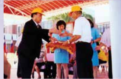
宋處長（左）於榮民節表揚模範榮民（87.10）。

宋處長就任新職後，即訂定培養團隊精神等多項工作重點，作為努力方向，並與全體員工共勉，積極為榮民袍澤爭取權益與應有尊榮。任職期間，以工作紀律提升員工同仁良好績效，以熱誠服務凝聚榮民（眷）向心，87年因辦理互助組長新春聯誼獲服務機構評比為優等單位，88年1月宋處長榮調岡山榮家主任並於90年退休。