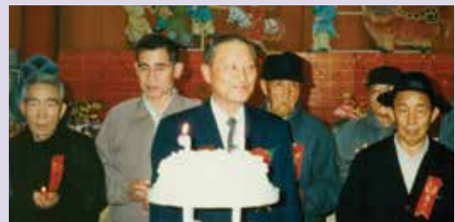
姜處長（中）在榮家主持慶生（83.5）。

80年推行為民服務工作成績列甲等；81年獲行政院郝院長頒發服務楷模獎表揚，其任內表現至為優異，83年3月1日復因任務需要，榮調白河榮家主任。