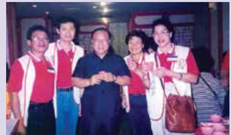
張處長（中）與志工合影（85.6）。

84年6月為因應本會調整政策：「外住就養榮民原由榮家負責，調整改由各榮服處服務照顧。」在張處長精心規劃下，將全市11個行政區依本市榮民分佈狀況，劃分為7個責任區、29個服務區，並編成1096個生活互助小組，以運用綿密之體系及榮欣志工人力，迎接新的任務與挑戰，其才幹與績效普獲肯定。86年7月外調本會魚殖管理處處長，任內躬親督導產銷，開拓周邊產業，全面提升業務績效，惟以推行民營化政策之故，復於單位裁撤後，調任花蓮自費安養中心主任，迄94年退休。