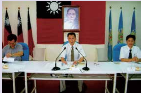
張處長指導舉辦榮民分區座談會(95.8)。

因應世界經濟景氣衰退，處長更致力於榮民(眷)就業媒合與各類型職業訓練班隊之開辦，服務期間推介就業人數1,631人次，間接照顧各個家庭，更辦理43個職訓班隊，完訓1,390人次，其中786人取得職業證照，成效卓著。