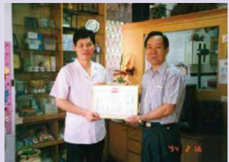
高處長（右）頒狀感謝支援義診醫師（94.2）。

高處長學養豐富、經歷完整、任事負責，不論服務軍旅或調任本會職務，均因績效卓著，深得各級長官肯定及部屬之愛戴。高處長任本職期間，積極改善硬體設施，營造良好之工作環境，並嚴格要求依法行政，尤以單身亡故榮民善後事宜必一絲不苟，89年1月1起建立檔案管理，落實文卷歸檔，勤訪基層足跡遍及高市每個角落，充分瞭解榮民（眷）之需求，及時協助解決，深獲榮民（眷）之讚揚。92年12月2日榮調楠梓榮民自費安養中心主任，94年即通過ISO服務品質驗證，領導與才能展現無遺。