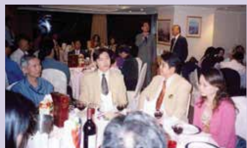
楠梓加工區陳副處長出席就業餐敘，代表貴賓致詞（95.9）。

95年度「榮民生涯輔導與就業媒合活動實施計畫」報准增開具競爭力之教育班次，將有限人力經費作充分發揮。由於地方政府、工商團體之配合，整體就業輔導績效均能勉力達成，以94年度為例，完訓榮民（眷）635位，推介榮民（眷）就業415位，達成率為102%，超越會訂目標，經評比就業總成績居22個服務機構之首。