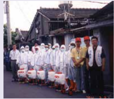
眷村全面防疫消毒—抗SARS總動員（92.5）。

93年4月24日SARS防疫狀況提升為A級，SARS防疫機制再度啟動，本處再度編組，服務人員進駐小港機場，針對入境榮民協助執行健康管理、安置、隔離等檢疫防疫工作，直至疫情獲得全面控制。