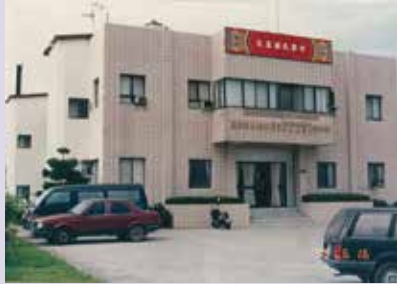
遷移改建後的宜蘭縣榮民服務處 (87.6)。