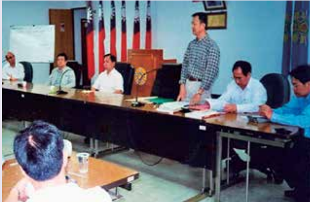
共同供應契約方式舉辦招標（91.4）。

嚴謹記錄資料，以重現會議與清點之現場狀況。經長期的教育與要求，使本處之善後服務達到標準化與制度化。另為了建立地區殯葬事務招標作業的合理、透明機制，主動與公共工程委員會、員山榮院、蘇澳榮院及地區殯葬公會等單位協調聯繫，秉公正、客觀與廉潔之態度，將地區相關會屬單位納入契約適用規範，採「共同供應契約」方式辦理91年度之殯葬招標，除節省龐大的行政資源外，更能杜絕弊端，獲輔導會指定參照學習之單位，成為組織學習的標竿。