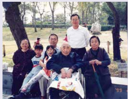
于公（中坐輪椅）全家福檔案（89.2）。

退休後，于公閱覽修習各類書典，擅書解經、文德兼備，經常為地方重大慶典撰題著稿，文采風揚，地方政要爭相競求墨寶，以顯德榮。另于公在宜蘭市地區廣邀熱心人士，定期排表訪視地區單身或住院榮民，遇有需要幫助之榮民弟兄，均不吝予以伸出援手，義行可表且數十年如一日，從未間斷。甚至在晚年時，亦常利用取藥或門診時機，探視長期住院的榮民弟兄，如此胸懷情操及同胞物與之精神，足為我後輩學習之楷模。