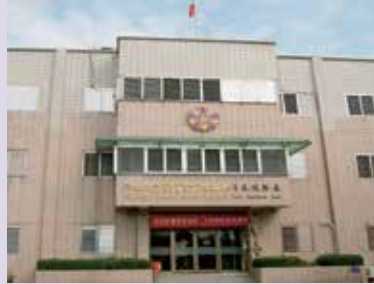
增建3樓之辦公大樓 (95.10)。