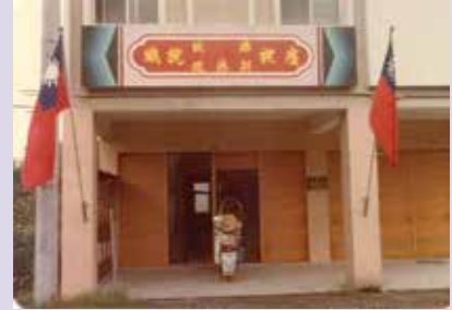
宜蘭縣聯絡中心舊址原貌 (51.3)。

輔導會為收容傷殘榮民及便於偏遠地區之榮民就醫，特於民國47年間陸續於宜蘭縣內成立蘇澳榮民醫院及員山榮民醫院；由於院區周遭榮民日益增加，自成一處生活機能區塊，對於地區榮民生活的照顧與權益的保障日益需要，為了提供地區榮民相關的服務，49年4月20日，輔導會特以（49）輔導字第1801號令當時的員山榮民醫院負責相關服務組織之籌設與規劃；49年6月1日在宜蘭縣各界的祝福下，於宜蘭市和睦路成立「行政院國軍退除役官兵就業輔導委員會宜蘭縣自謀生活榮民聯絡中心」，辦理相關榮民服務照顧工作。51年11月間因醫址與聯絡中心距離過於遙遠，造成行政支援不便，且適「森林開發處」安置大量榮民於木工廠、棲蘭山、太平山等林區工作，經奉退輔會核定改由「森林開發處」兼辦，並責由「森林開發處」處長彭令豐先生兼任聯絡中心主任，繼續指導辦理聯絡中心相關業務。