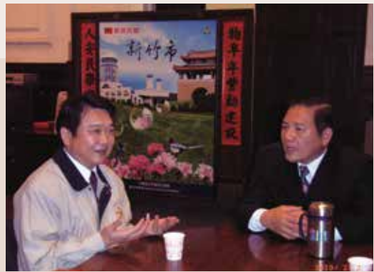
本處與新竹市政府協調說明會。

99年新竹市政府為改善財務缺口擬修改「安老津貼實施計畫」，原將新竹市領取半俸之遺眷改列為排除對象（新竹市65歲以上領取半俸之遺眷計有1,372人，每人3千元，全年約需5千萬元），經本處緊急協調並於市府3月26日辦理說明會中，竭力爭取領取半俸遺眷之權益，終獲新竹市政府同意將領取半俸之遺眷繼續列為安老津貼發放對象。