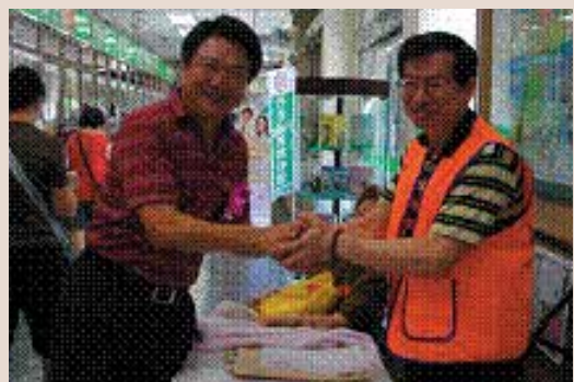
防詐騙專案服務隊組長與榮欣志工合影。

本處100年於1月及7月領俸期間，分別於新竹縣、市30個郵局支局開設防騙專案服務隊動員服務組長及榮欣志工提供現場服務並加蓋防騙戳記等措施，計提供2,900餘人次之服務。