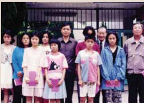
民國84年端節前甄處長（中）慰問袍澤遺孤。

處長陸軍官校37期工兵科畢業，少將退休，任內推動「榮民資料整合與校查」，透過地方政府社福部門、戶政單位、全民健保申請表等多重比對作業，建立了榮民資料的正確性與完整性。運用這些新穎正確的資料，發送一封封的問候信函，宣導輔導會近期的政策、目標；定期寄發生日卡、賀年片、榮民節活動邀請函，傳遞輔導會的關愛。