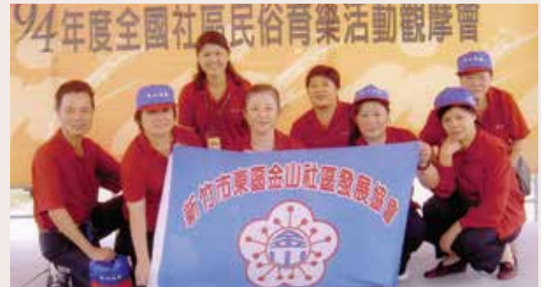
倍受鄉梓肯定、依賴的孝芳（左3），就像鄰家的女孩一般親切（94.6）。

當選市議員後的段議員仍然一本初衷的關懷轄區榮民（眷）生活，對於服務處舉辦的各項活動，亦熱心參與，對服務處服務榮民有關的事務不遺餘力，在議會問政不忘榮民（眷）的福祉，並且三不五時的回到服務處，主動提出任何服務榮民有關的事務，均全力協助解決。對於當年甄處長的知遇至今仍然感懷在心，有千里馬而後有伯樂，有伯樂而後千里馬得以展其長才，服務工作之最高要求，莫此為甚。