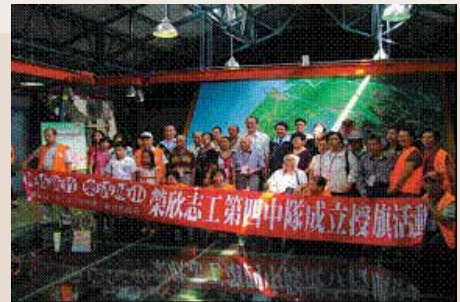
竹北及竹東區榮欣志工第四中隊成立。

本處為號召更多具愛心人士加入志工服務行列，俾綿密服務網絡、找回榮耀，100年本處積極籌組竹北及竹東地區之榮欣志工第四中隊成立，並於6月30日辦理授旗活動正式運作，目前已有志工158人加入服務行列。此外，並延攬社會賢達人士9位擔任志工顧問，以擴大實質服務照顧，發揮影響力。