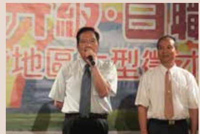
民國102年6月26日新竹市長許明財偕同本處處長親臨就業媒合會場為求職者打氣。

本處結合新竹市政府勞工處及勞委會新竹市就業站於102年6月26日共同辦理大場次就業媒合活動，現場邀請35家廠商提供超過3千個工作機會，更邀請榮民自行創業的布拉格古早味烘培蛋糕坊與赫曼咖啡館到現場設攤，不只希望求職榮民（眷）及市民找到心目中理想的工作，也有機會與創業人侃談成功轉換生涯跑道的歷程，本處並於現場設置性向諮商服務專區，為榮民（眷）勾勒最適合的生涯圖像。現場包括矽格、鍊德等科技業、豐譽營造等傳產業以及保全等多家服務業，提供求職人更多更好的工作選擇。處長林夏富鼓勵榮民（眷）把握機會，站穩工作的第一步，並積極充實自己的專業與實力，厚植自己與企業談判的籌碼，才是最實在的職場策略。本處年度內積極協助榮民（眷）就業媒合，計成功媒合191人順利就業，各項成果有目共睹，獲輔導會評比就業服務績優之殊榮。