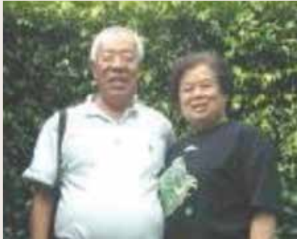
祿總幹事退休後家庭幸福美滿(94.9)。

先生早年自政工幹校畢業，後服務青年日報社多年，自軍中退休後轉行經營織布廠、經商多年，頗有所獲，後結束事業，於民國76年轉入輔導會第一處服務，負責亡故榮民善後處理工作，清查檔案，整理亡故榮民遺產，歷時三載，併研定管理辦法，績效優良。83年調任南投榮民服務處總幹事，86年調派本處服務，迄89年1月屆齡退休。