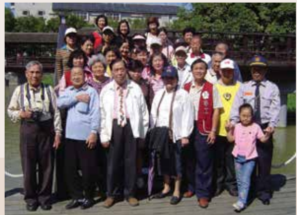
民國93年9月舉辦榮欣志工自強聯誼活動。

本處榮欣志工現有3個中隊，成員120餘人，平日分別輪值負責認養鄰近單身獨居之年邁榮民、遺眷，並利用假日進修社會服務之技能、知識，愛心與付出他（她）們唯一的信念。