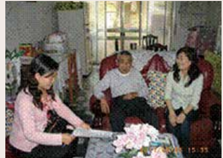
本處定期訪視關懷榮民、遺眷。

100年本處配合輔導會推動多元就業方案「長期照顧弱勢榮民（眷）、遺眷居家陪伴服務」計畫，本處獲配4名人力，提供有需求之個案家務服務、陪伴就醫、居家環境整理等各項服務，並適時反映榮民（眷）居家生活狀況。迄7月份計服務1124人次，獲榮民（眷）好評。