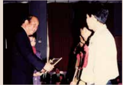
王處長（左）主持第15屆榮民節慶典活動。

長達3年6個月期間，跑遍了新竹縣、市大小鄉鎮、各地眷村、榮民居處，訪問及協助榮民不計其數，無論颱風、大雨、任何時間，只要榮民有需要幫助之處，必然有處長身形在該處出現。