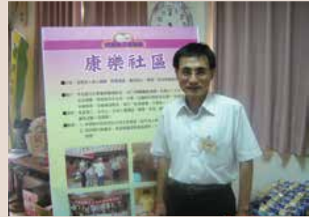
鄭處長指導同仁結合社區資源，辦理遺孤相見歡活動。

任內事事恭親，同時勉勵同仁，依法行政，遵守公務人員廉政倫理規範及貫徹節能減碳要求，以務實的態度，做好「榮民、榮眷」服務照顧工作，貫徹各級長官之要求外，並以「清廉、勤政、愛榮民」之理念與「反浪費、反腐敗及反貪污」內控機制，建立「忠貞、團結、關懷、誠樸、開創」的核心價值，追求並提升卓越服務。光榮傳統，承先啟後為轄區榮民、榮眷謀福利。