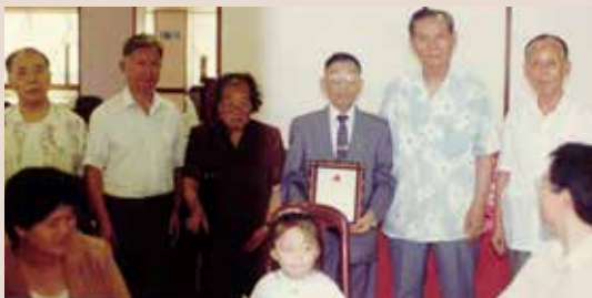
民國70年6月趙主任（右2）與同仁歡送退休員工。

主任回憶民國60年間，袍澤生活多為清苦。由於軍中所學鮮少能運用在社會工作上，僅有的是吃苦耐勞的堅毅和一身的力氣，退伍軍人普遍為外省籍鄉親，語言隔閡、生活習性相悖，造成與社會的疏離，境遇能差強人意的即算「好」了。猶記得一位黃埔3期的學長，隻身在臺，離開軍中數年間落得窮困潦倒、淪為游民，