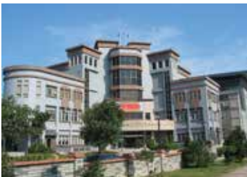
民國88年10月新建新竹榮民服務處辦公大樓。

40年代，由於追隨政府來臺退休老兵日增，遂奉令於民國49年6月1日成立「新竹縣自謀生活官兵聯絡中心」，51年12月改稱「新竹縣聯絡中心」，57年9月修正聯絡中心組織規程，74年2月16日成立「新竹縣市聯絡中心」縣市業務聯合辦理，76年8月6日更名為「新竹縣、市榮民服務處」，至84年縣市合併為「新竹榮民服務處」。88年5月本處辦公大樓竣工，10月21日自新竹市中央路舊址搬遷至新竹市建功二路61號現址，「新竹榮車中心」同時進駐，為榮民袍澤啟動全方位的服務。因應組織改造，自102年11月1日起，本處更銜為「國軍退除役官兵輔導委員會新竹榮民服務處」。