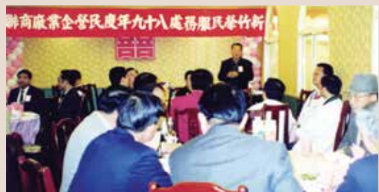
民國89年中秋節，皮處長主持廠商聯誼餐會。

輔導會因應經濟景氣低迷及產業外移的衝擊與變遷，於民國88年10月份秉持「給魚吃，不如給其一釣桿」之理念，特撥專款於各榮服處設置就業服務站，指派專人協助榮民就業服務工作，迄今五年餘，本處推介民營企業就業人數概為675人次，自辦榮民（眷）生涯輔導與就業