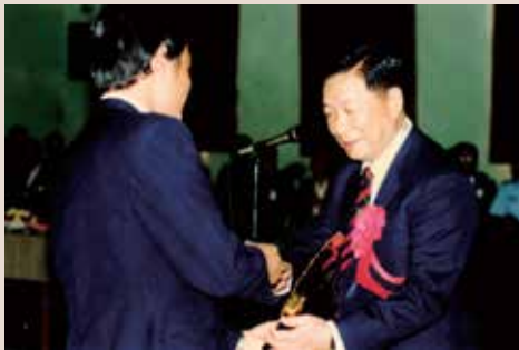
黃處長（右）於民國76年10月份第7屆榮民榮民節慶祝大會中頒贈獎牌感謝地方單位。

黃處長為陸軍政戰少將退伍，曾任國防部政戰部計畫委員，任期內以其多年軍中累積之經驗，對於新竹地方單位組織與運用最為圓融。配合輔導會資訊系統檔案建立，榮民服務處依輔導會發下電腦資料名冊，逐筆核對並存放服務處之紙卡檔案，整建工程完竣後，讓榮民個人資訊輸入電腦，縮短了工時，也為服務工作開創了新紀元。