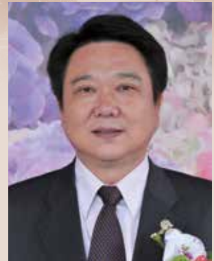
以傳承與關懷為服務工作本旨。

董處長到任後即鼓勵同仁要保持心情愉快，因為服務處以服務為工作主軸，沒有好的態度就沒有好的服務提供給榮民（眷），更以多一點鼓勵、少一分責難的領導方式，帶領全處穩健的成長，竭力整合多方社福資源、建構縝密服務網絡，自我期許要為榮民（眷）爭取最大福利及最好的服務照顧盡棉薄之力。