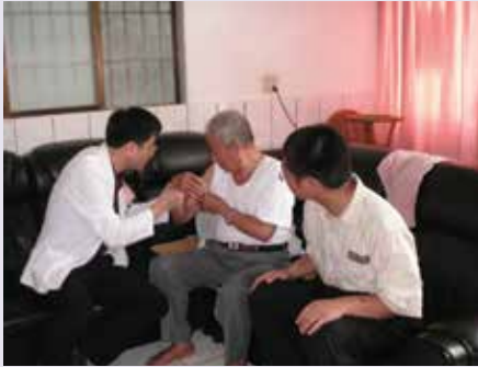
灣橋榮院實施居家護理實況之一(95.4)。