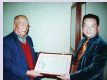
頒發榮民高魯惠服務績優獎狀（90.3）。