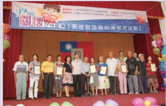
關懷外籍（含大陸）配偶。