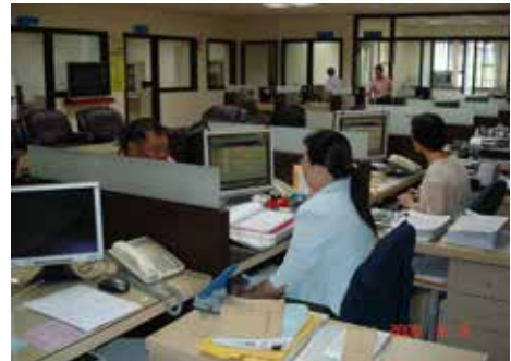
辦公處所改善後現況（95.6）。

去了家庭和鄰里社群的支持，而發生支持系統失靈的現象，於是，榮服處為穩定這些龐大的退伍軍人生計以滿足基本生活功能性建設為主；為彰顯政府關懷照顧退除役官兵之德政及決心，今後將廣續推展「就醫、就養、就學、就業」與服務照顧等工作，以嘉惠雲林地區榮民（眷）。