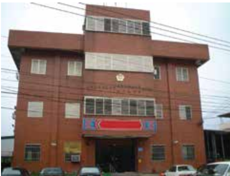
雲林縣榮民服務處—新辦公大樓（93.8）。

隨著榮民人數增加，服務需求提高，復於49年7月1日更名為「雲林縣自謀生活退除役榮民聯絡中心」，仍兼辦南投縣業務，51年8月23日續更名為「雲林縣自謀生活退除役官兵聯絡中心」，繼續兼辦南投縣業務；期後再因榮民人數及服務需求及兼顧7縣市服務品質，於57年8月26日第3次更名為「雲林縣聯絡中心」，76年8月16日最後一次更名「雲林縣榮民服務處」迄今。