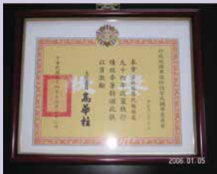
民國94年服務機構評比績優獎狀。

依本處史績資料及資深的服務人員轉述：自民國68年以來，服務處在全體同仁辛勤努力之下，陸續獲頒各項督考獎項，在當時服務機構丁級類型評比成效中，本服務處一直居於翹楚。更難能可貴的是，除了有員工獲得中央機關美展評比第1名外，更有榮譽亦得此殊榮；常於月會上，看到歷任首長滿意的微笑，這也無形中成為服務處光榮的史績紀錄。