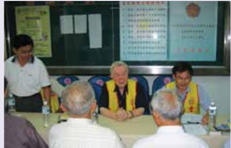
本處於成大醫院斗六分院設置之服務台（94.10）。

因應雲林地區狹長地形及遵奉高前主任委員服務理念，於臺西、四湖、東勢等鎮，設置服務點，除便利偏遠地區榮民洽辦事務外，更代表服務處服務工作深入基層的決心。再因本縣無會屬榮民醫院，使轄區榮民無法享受與其他縣市同等的醫療資源，經過本處不記名電話調查榮民就醫狀況，以前國軍斗六醫院（現為成大斗六分院）就醫人數最多，為能有效服務榮民，遂與該院協調並獲熱忱支持，於該院設置服務台，提供榮民即時之服務。