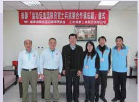
就業站與廠商簽署合作備忘錄（103.1）。

本處就業站平時極積開發廠商簽署合作備忘錄、招開職職班別及與地方就業站合作促進就業媒合外，為因應募兵制，造成退伍即失業之窘境，10年度起針對新退榮民，詢問求職需求並建立專業人才資料庫，定期將專業名單提供合作廠商，以解決廠商招募人才之即時需求，並促進榮民就業以達雙贏局面。