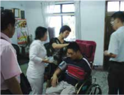
灣橋榮院實施居家護理實況之二(95.7)。