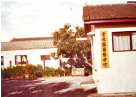
雲林縣聯絡中心—舊辦公室（75.6）。

民國47年輔導會有感於國軍袍澤捍衛疆土，為國一生戎馬沙場，退休後正值壯年，極需政府關懷照顧，遂於47年10月1日，假雲林榮家成立「中部地區自謀生活輔導組」，負責苗栗、南投、臺中（縣）市、彰化、嘉義、雲林等7縣市榮民輔導服務工作。