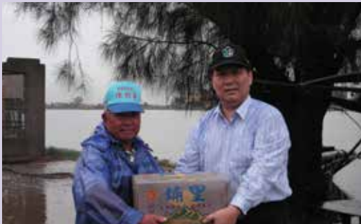
民國95年6月9日水災盧處長親自救災與賑災之一。