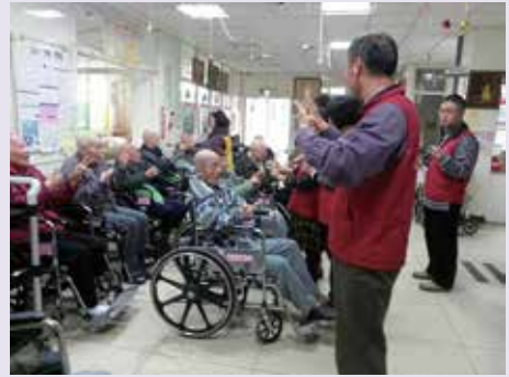
榮欣志工雲林榮家團康活動（102.8）。

本處榮欣志工除平時定期訪視榮民（眷），並結合青年學子對貧病榮民（眷）協助就醫、居家環境整理外，102-103年度起擴大至榮家服務內住榮民，與雲林榮家共同舉辦「榮欣情、志工愛」活動，每天由志工分別至雲林榮家實施推送服務、陪伴就醫、聊天與內務整理、團康活動及社區半日遊等，使內住榮民能融入社會走入社區，發揮「社區意識」之核心價值，另於平日更發揮資源連結功能，與地方社福團體保持密切連繫，募得物資，致贈縣內清寒榮民（眷），使之脫離生計難以維持之困境。