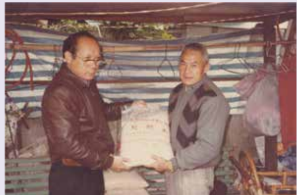
圖為賀先生為榮民（眷）爭取救濟物資，親自發送及與榮民合影留念（78.12）。

好景不常，賀先生晚年因身體狀況日漸衰退，89年更因操勞過度，中風臥病在床，家人原已不報任何痊癒的希望，但老天爺總會庇佑好人的！也許是不忍賀先生尚未享受天倫之樂及含飴弄孫的日子，加上妻賢子孝、積德庇蔭的緣故，在家人無微不至的照顧下，賀先生如同奇蹟般的復原。這證明了古人常講的一句話：「舉頭三尺有神明」，千萬不要「勿以惡小而為之，勿以善小而不為」，好心終究會得好報。