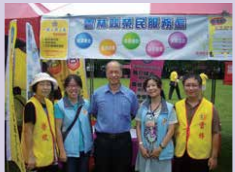
就業站舉辦就業媒合活動（103.7）。

針對縣內年長獨居貧病榮民（眷）假日無人送餐服務之窘境，於103年度起奉輔導會主委指示，假日由替代役及值日人員至榮民（眷）家中致送午、晚餐並寒暄問候，另本縣清寒榮民（眷）子女營養午餐於假日時，各政府及地方社福機構均無提供或補助，本處亦於103年4月份起至各界善心人士募得款項進行補助，以達服務連續不中斷，並期許為雲林地區榮民（眷）謀取最大福祉。