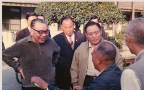
蔣經國先生由主任胡軼凡（左2）陪同訪視屏東榮民（66.11）。