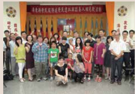
本處辦理遺孤相見歡(102.8)。