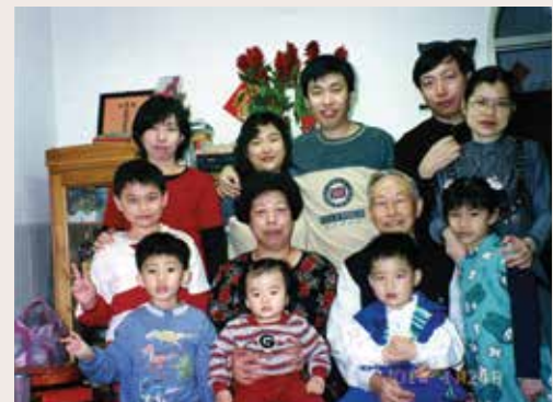
嚴先生全福家，洋溢著幸福和樂的氣息（90.1）。