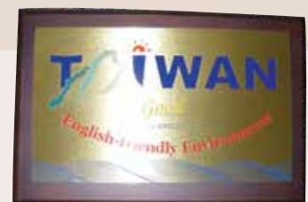
民國93年獲行政院研考會評比良好標章。