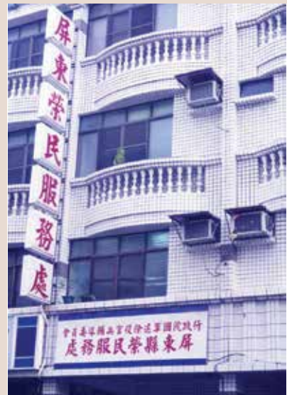
典租大武路67號的辦公室（87.10.5）。

趙華淼處長任內完成比圖，訂約、招標、開標到動土，程序繁雜，辛勞備至。88年12月4日由輔導會前主任委員李楨林主持新建辦公大樓動土典禮、屏東縣地方首長、民意代表及榮民代表等80餘人與會，盛況空前。