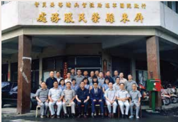
典租屏東市大同路59號的辦公室（80.5）。

屏東縣榮服處的前身為「南部地區自謀生活輔導組」從民國47年10月1日至65年設在屏東榮家舊址屏東市瑞光里民生路2號。65年奉兼主任胡軼凡先生指示遷往屏東市建國路98號的透天3層樓房，由於樓層面積不大，因此活動空間非常擁擠。