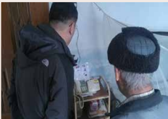
安裝遠距居家照顧系統提供年長榮民立即協助。

持續協助具高危險因子之年長榮民，勸導安裝遠距居家照顧系統（緊急救護系統），運用該系統，在發生緊急情況時，榮民即可求救或呼救，縱然只是單項的用途，就具極大之用處，因為緊急救援系統接獲求救時，回應中心即可予以妥處。安裝本系統後，使渠等遇有服務需要及事故發生時，都能立即獲得協助及救援，進而降低意外事故之發生。