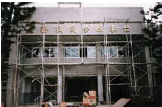
臺東縣榮民服務處辦公大樓整修 (90)。

後因退除役官兵人數激增，業務快速成長，遂於49年6月1日，更名為「臺東縣自謀生活榮民聯絡中心」，直隸輔導會，並由馬蘭榮家遷至臺東市更生路48號，58年更名為「臺東縣退除役官兵聯絡中心」，63年遷至臺東市中山路49號現址；76年8月，正式命名為「臺東縣榮民服務處」，98年輔導會為促使「醫養合一」功能更臻圓滿，將臺東縣榮民服務處於98年6月17日遷移至馬蘭榮家家區內，使外住榮民(眷)之就養、就醫、就業等服務工作，與榮院、榮家相結合，並以榮服處為平台，提供內外住榮民(眷)全方位之服務。