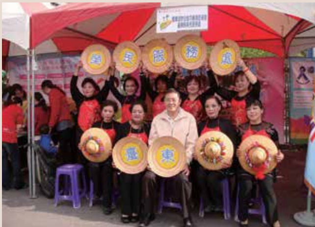
2013移民節－臺東樂活好幸福留影。

為關懷服務榮民（眷），本處積極爭取公、民營機構社福資源，加強中央與地方互動機制，除原參與縣政府長照推動小組委員外，並主動協調加入縣政府「老人福利促進委員會」、民間「外籍配偶關懷協會」、「多元移民關懷協會」委員，參加臺東縣政府身心障礙輔具資源與服務整合聯合會議，連結輔具資源網絡，並參加臺東縣政府聯合舉辦「2013移民節－臺東樂活好幸福」、「愛在五月天」－外籍配偶家庭教育成果觀摩會暨慈孝家庭楷模表揚等活動，展現新住民輔導成效，讓新住民深耕在地文化，實現