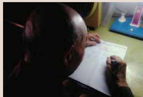
推動大陸來臺單身退除役官兵「預立遺囑」。

為規範本處推動宣導大陸來臺單身退除役官兵「預立遺囑」工作，鼓勵榮民做好百年後之財產、殯葬善後規劃，俾使本處依其遺願辦理，減少爭議事件發生。目前單身榮民85人，已勸預立遺囑33人，餘52人持續加強勸導，完成會頒政策。