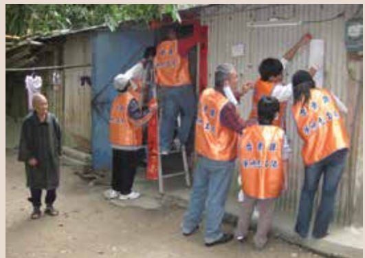
協助弱勢榮民房舍除舊佈新。

臺東地勢狹長，南北海岸線長達176公里，是全臺海岸線最長的縣份；全縣面積約3,515平方公里，佔臺灣總面積近十分之一，為第三大縣。為貫徹輔導會「榮民在哪裡，服務到哪裡」政策，彌補服務人力之不足，積極擴大招募志工，尤其是偏遠鄉鎮地區，使輔導會之服務照顧政策可以達到全縣每個角落。