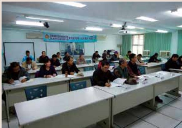
專業技能訓練班上課情形。

臺東縣由於交通不便，且無大型工業區、百貨公司，工商業較不發達，導致就業機會不佳而人口外移情形嚴重等惡性循環，但為貫徹本會推介榮民外介就業工作，除配合勞委會臺東就業服務站於本縣辦理多場次就業媒合活動外，並以強化榮民（眷）職場競爭力為方向，開設相關技職證照班、技能訓練班，並於新聞稿、多種大型集會場合加強宣導鼓勵榮民（眷）踴躍參加。此外，並持續與本地各類型公司保持綿密互動，除安排輔導會於轄區企業簽訂促進就業合作備忘錄外，並分別由處長或副處長及總幹事，不定期拜訪企業雇主，機關、學校團體，爭取更多就學、就業職業訓練辦班機會。本處102年全年，推介就業成果達會頒年度要求，達成率為103%，成效良好。