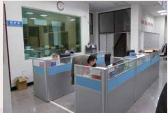
設備更新後提供民眾舒適洽公環境。

民國101年本處由借用之馬蘭榮家營舍遷至原國軍收支組大樓，經獲輔導會經費支援，將行政大樓相關老舊機電設備設施汰，並改建內部空間，為確實貫徹「節能減碳」政策，全面汰換老舊燈管，以省電、明亮之T5燈管取代；另為確保同仁及榮民（眷）身體健康，汰換多具老舊不勘使用之冷氣設備，並爭取預算新增OA辦公設備及強化資訊設備更新，汰換老舊影印設備、電腦，及屋頂防漏、防曬工程；強化為民服務效能，並在辦公大樓周邊大量種植向林務局爭取之400餘株植物、花卉，綠、美化大樓及周邊環境，營造舒適之辦公環境，提供洽公民眾愉悅之洽公環境，提升本處形象。