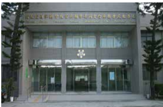
臺東縣榮民服務處現今辦公大樓 (95.10)。

政府遷臺後，將大部份參加作戰成殘人員，安置於前國軍臺東臨教院，46年該院撤銷，部份安置太平、馬蘭榮家，大部份則散居各鄉鎮市，由於該等人員身體傷殘、行動不便普遍面臨就醫服務之切需，加以臺東縣，地勢狹長依山臨海，境內為中央山脈及海岸山脈貫穿，主要地形多為高山、縱谷與海岸全縣面積3,515平方公里，為全島第3大縣。