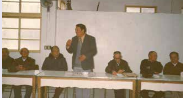
方先生（站立者）於玉里鎮舉行榮民分區座談會，答覆榮民提問時的留影（76.12）。

82年榮退後的先生，因對榮民服務的關心，而接任花蓮縣退伍軍人協會理事長繼續為榮民服務，在兩任的理事長任期，仍是以正直踏實從事待人，只要是榮民的事而且是對的事，必想盡辦法處理，也如此深獲部屬、榮民對其感佩與尊重。現在與其妻定居花蓮，過著平淡優雅的生活，談起過往，先生深深一笑，溢於言表。