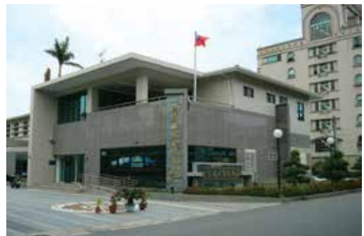
瞧瞧看！我們的新家很不賴（85.7）。

本處位於臺灣的美麗後山（花蓮市菁華街6之1號）。如果您曾經來過花蓮，您就應該知道花蓮有多美了。花蓮，原名叫「奇萊」或「岐萊」，是阿美族的地方「KIRAI」的音譯，在清朝以前又稱為「洄瀾」，原因是花蓮溪的水在入海之時經常有回轉頭的現象。洄瀾的音和花蓮相近，到了清朝便改名為花蓮。早先花蓮主要居民以原住民和漢人為主，臺灣光