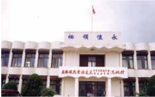
花蓮縣榮民服務處辦公舊址：民國76年8月～93年1月，我們都在這裡努力為榮民服務(85.7)。

復後，基於對退役軍人（榮民）的照顧與開拓東部荒地政策的需要，陸續安排許多榮民前來此地拓墾。因參與了花蓮的開墾，不斷在此地努力經營與生活，漸漸的，美麗後山花蓮便成了這些榮民的第2個故鄉，榮民文化也在此地生根，逐漸發展成為本地另一個特殊族群文化。