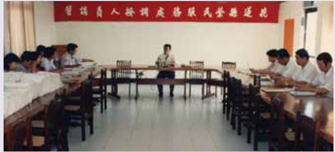
馬先生（中間者）主持本處調撥人員研習時的留影（83.8）。

先生在本處擔任本處總幹事、副處長時，積極作為的領導風格從過往舊照片即可見端倪。舉凡本處大大小小的活動總不難發現先生的身影，因為他對於榮民服務工作總是事必躬親、盡心盡力，對待同仁亦是以寬容的態度來教導，直到今日他的細心、認真、謹慎、寬容等特質仍是令榮民（眷）與同仁所感念與津津樂道的。