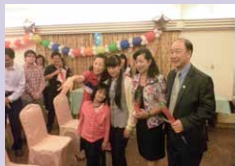
溫馨之愛－相見歡氣氛感人。

本處依輔導會推動榮民遺孤認養規定辦理認養遺孤作業，協助失怙、失恃的榮民遺孤，獲得良好的生長環境與妥善就學，在本處同仁及各界善心人士協助下，以感受到社會各界傳愛芬芳。本處每年均精心舉辦一場名為溫馨之愛－「相見歡」的活動，102年邀請榮民遺孤認養企業及個人與受助學童一起共度溫馨的饗宴，感受彼此間真摯情感，也讓榮民遺孤懂得分享與惜福。有關各界捐款情形，本處依規定將捐款情形報會，並定期上網公告徵信。對於遺孤之照顧，除定期提供認養金額外，本處制定個案管理機制，以個案方式進行訪視關懷，瞭解遺孤生活家庭生活，隨時掌握個案狀況，提供協助。103年4月本處協助受認養遺孤計有30位，捐贈認養人計40位。