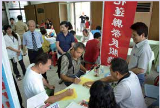
花蓮縣榮民就業服務說明會。

就業輔導原本就是輔導會重要項目，因為退除役官兵多屬青壯人力、心智圓熟，若能夠提供其就業、創業或再進修，可協助自軍中退役的官兵開創生涯的第二春。因應花蓮地方的特殊性，就業機會不多，產業發展主要是觀光、服務業為主。因此，要協助榮民（眷）順利就業不是件簡單的事。但本處每年仍積極向縣內各民營企業機構推介媒合榮民（眷）就業，為拓展就業管道，多次舉辦就業服務生涯規劃輔導講習，並持續辦理各項職業進修訓練，包括電腦基礎應用班、中餐烹調丙級考照班等8個班。各項職業訓練業務推展積極，本處更榮獲輔導會各榮民服務處「94年度榮民（眷）進修訓練執行成效評比」第3名。