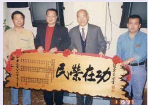
翟先生（右2）在退休餐會接受同仁致贈的「功在榮民」的匾額，表達對其貢獻的肯定（86.1）。