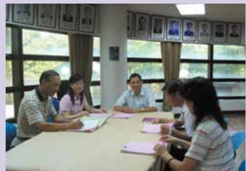
本處保管榮民重要財物稽核小組由組長召開定期保管榮民重要財物稽核會議（96.3）。

協助榮民處理問題與照顧是榮民服務處的重要工作，對於榮民權益的維護與保障亦是近年來重要的議題。過去對於因病或個人特殊原因，無法妥善處理與保管自己本身重要財物，如何協助處理經常是榮民服務處兩難的狀態，因若無完整的配套措施，易發生令人垢病的爭議。為解決此困境，本處積極研擬相關實施規定，以保障榮民權益。歷經幾次的修正保管榮民重要財物實施規定，民國94年本處終於完成全面性的作業要點，保管與稽核權責明確區分，減少過去公私模糊界線，落實保障榮民權益。95年再度依輔導會函頒實施作業規定修正，並將「委託」依此更改為「保管」，以更符合法理與實務，對於榮民重要財物的保管權益維護更是大跨一步。