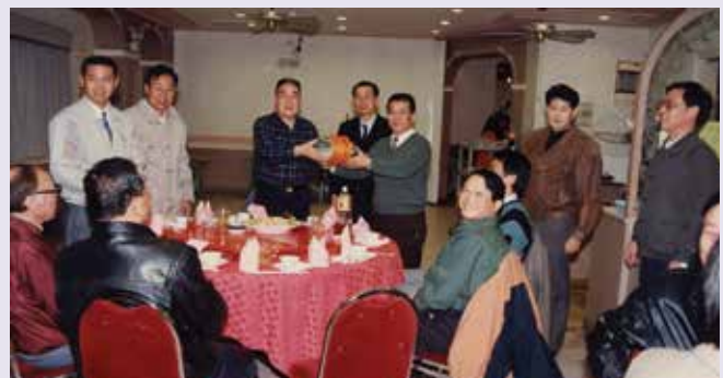
馬先生（右1站立者）代表本處同仁贈送紀念品給前于兼處長時的合影（84.12）。