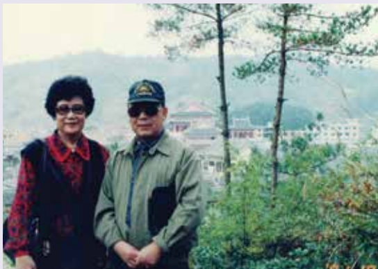
賢伉儷攝於橫店「清明上河圖」內（90.10）。