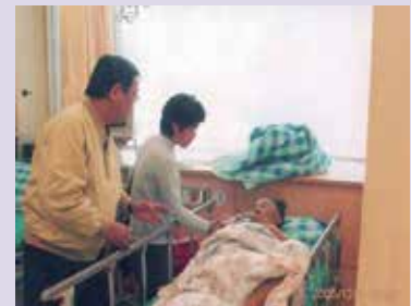
張處長關懷榮民病況與慰問。