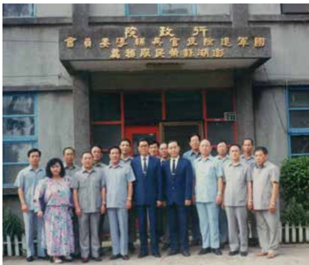
「榮民聯絡中心」原址（80.5）。

澎湖——一個星羅棋佈，綿延65個島嶼連貫而成的海上明珠，是守護臺、金的跳板，極具軍事價值，明末清初即開發，民國38年國軍隨政府播遷來臺，轉眼50餘載，當時的青壯國軍袍澤多已習慣澎湖生活，落地生根，成家立業。輔導會有感其當年捍衛疆土，為國盡忠，一生戎馬沙場，極需政府關懷照顧，於51年8月16日於馬公市樹德路31號成立「榮民聯絡中心」，初期以辦理退除役官兵輔導就業與職業訓練為輔導措施，並參與澎湖地方