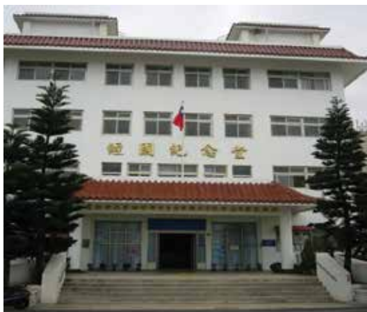
新建「榮民服務處」於民國80年落成（80.9）。

建設、發展經濟，歷經多年，青壯榮民、子女紛紛踏入社會，更需要服務與照顧，榮服處之業務亦日愈頻繁，為擴大服務照顧榮民（眷），強化榮民就醫、就養、就業、就學服務功能，80年5月15日輔導會與縣政府歐縣長堅壯先生協調爭取資源，籌建落成「經國紀念館」暨「澎湖縣榮民服務處」，更能廣泛結合地方資源與福利，提供舒適及便捷服務，造福榮民（眷），以贏得輔導會光榮形象與政府關懷榮民之德澤。102年11月，輔導會組織改造，本處配合更全銜「國軍退除役官兵輔導委員會澎湖縣榮民服務處」。