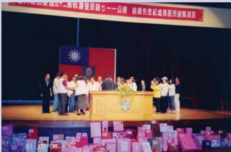
榮民節慶祝大會剪影（92.10）。

榮服處每年擴大舉辦「紀念先總統 蔣公誕辰暨慶祝榮民節」系列活動，自79年迄今，全面邀請各界首長、仕紳、媒體及縣轄榮民與遺眷與會，