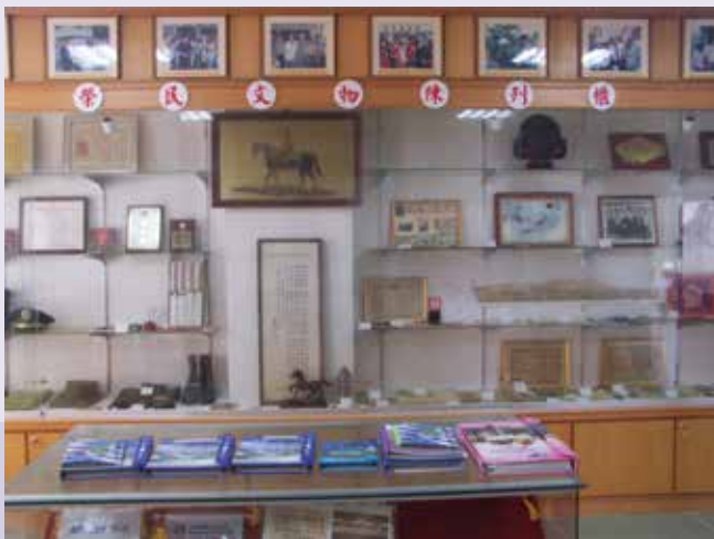
榮服處籌設榮民文物陳列館剪影（92.11）。

為蒐集縣轄榮民（眷）暨單身亡故榮民具有紀念價值之典藏作品及遺物，本處奉輔導會指示於民國92年11月間成立榮民文物陳列室，彙蒐陳列榮民書法字畫，紀念性文物、軍飾服裝、書籍、雅石等，以展現榮民個人豐功偉績暨歷史傳承見證；協助「本縣眷村青年普愛自強協進會」爭取「篤行十村」為日式古老眷舍保存與設置眷村文化園區計畫資源，以搶救澎湖古老眷村及歷史