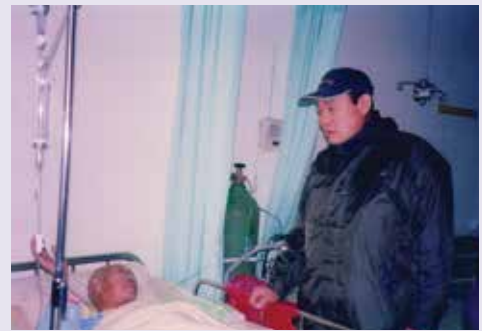
探訪住院榮民，視病如親（93.12）。