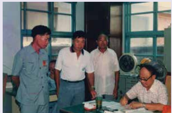
辦公室處理公務留念（78.8）。