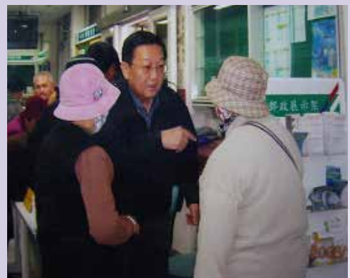
張處長於郵局防騙宣導剪影。

因應社會變遷異常，肖小遍佈，榮民受騙案例時有所聞，為維護榮民（眷）權益，平日勤於運用聯絡體系幹部與榮欣志工遍訪榮民（眷），尤對單身獨居榮民宣導防騙說帖，加強防騙措施為今後服務工作重要乙節，本處並於重點時間（每年1、7月退俸榮民驗放退俸金）深入郵局及金融單位，實地防杜，並協助年老榮民辦理退俸入帳作業，服務人員親切貼心的招呼，深獲肯定與好評，無形間亦杜絕有心人士不法覬覦。