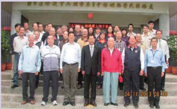
處長率全體同仁及觀禮者於揭牌儀式後合影。

配合輔導會組織改造，依輔導會指示進程，成立組織改造規劃小組，逐步推動本處組織改造工作。除因應銜名變更，更換本處大門、週邊標誌銜名牌為「國軍退除役官兵輔導委員會澎湖縣榮民服務處」外，執行關防、印信更換，信封、收發章銜名變更，及職員預擬編成名冊及職缺管制、員額移撥及人員派職等工作。於