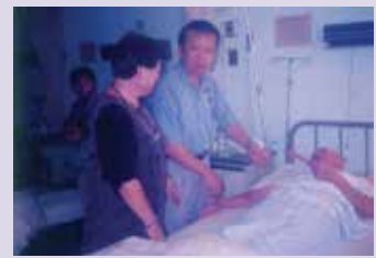
探視生病住院榮民（86.7）。