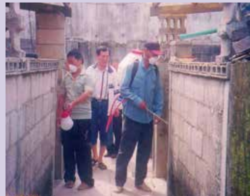
SARS期間眷村聚集戶消毒剪影（92.6）。

SARS期間深入6個眷村、單身退舍兩處、散（集）居388戶實施消毒，有效掌控疫情，並運用輔導會撥發專款迅速購買防護衣、口罩、消毒器具用品等廣面分發至每一位榮民家中，提供安全防護預防作為，茲因及早做好防範措施，以致未發生遺憾事件；平日協調地方政府社福單位及軍、憲、警、岸巡單位對駐地附近單身清寒獨居榮民提供送餐與居家服務，尤對年邁體弱單身獨居榮民除本處榮欣志工前往服務外，