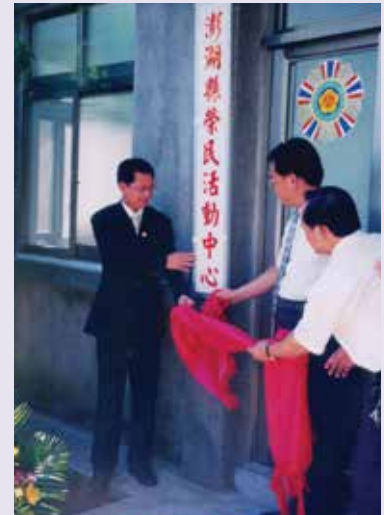
於聯絡中心舊址設置活動中心，服務榮民（88.9）。

88年9月份由澎湖縣議會贊助經費，將舊址服務處整飭為「榮民活動中心」，提供榮民平日休閒場所，內部配佈棋桌、健身器材、報章雜誌、服務文宣等休閒用品提供娛樂。另設諮詢服務台，每日派遣輔導員負責收辦證件服務及榮欣志工輪值擔任服務工作，提供便捷申辦各項業務需要，「榮民活動中心」因位於市中心，可免除榮民洽公、辦理事務舟車勞頓、徒勞不便，尤對年紀偏長榮民更為便利，提升榮民服務工作品質，執行成效甚佳。