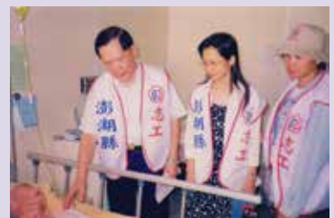
假日時探訪住院榮民 (93.7)。