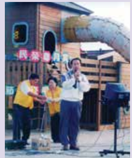
邀請單身榮民秋節聯誼 (89.9)。