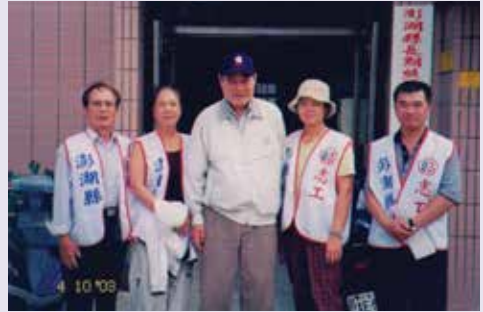
假日時偕榮欣志工探視榮民（92.4）。

二、民國92年間適逢SARS在各地蔓延肆虐，在輔導會防疫指導下，高副處長承擔起本縣防疫工作指揮官，立即成立「防疫應變小組」，對大陸探親返臺者居家隔离，散居榮民及集居榮民陸續編組防疫及消毒小組，並運用聯絡體系幹部偕同親訪榮民，宣導防疫事項，發放口罩、消毒用品提供應急之需，掌握榮民健康情形或提供生活必需品。另主動電洽輔導會，爭取專案經費，結合本縣各大醫療院所，建立防治聯絡網，及時陳報及掌握疫情，嚴格控管。此期間經常親率小組成員，分赴轄區內眷村、單身宿舍、榮民集居地或應榮民要求，展開全面性消毒作業，勞心勞力，犧牲奉獻，全力投入防SARS工作，其大無畏精神深植榮民（眷）心中，「凡走過必留痕跡」，防疫作為可圈可點。由於高副處長的躬親以身作則，為其有生之年留下美好而具挑戰性的回憶，不僅為公務部門建立優異執行績效，亦留給本縣榮民（眷）由衷感激與佩服；然因任務需要，高副處長於94年10月奉調金門縣榮服處副處長，延續服務照顧榮民（眷）工作，於民國98年7月16日退休。