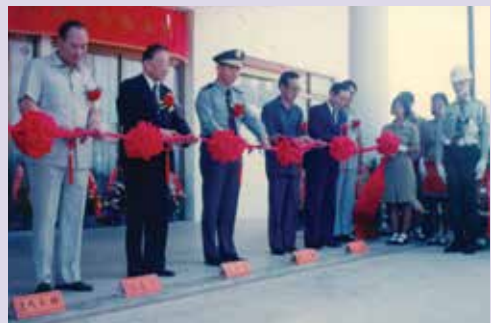
新建「榮民服務處」落成剪彩（80.9）。