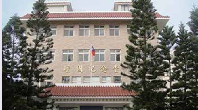
本處整修後之外觀（正面）。

自100年起，由輔導會挹注經費，陸續進行辦公大樓外觀整修、2樓大禮堂部分天花板更新、辦公廳舍冷氣機裝設、辦公室OA系統設施更新、防盜紗窗裝設、檔案室移動式檔案櫃添置、電子看板（跑馬燈）建置及榮民活動中心1樓環境改善等軟、硬體之設置。以提高同仁執行、推動業務積極性，提供榮民（眷）洽公及參與活動之舒適方便，增強辦公廳舍環境安全，並增加業務宣傳、推廣之功能。