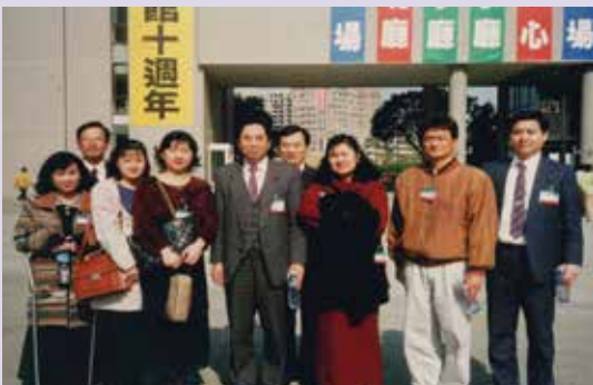
帶領榮欣聯誼會赴臺觀摩（86.11）。