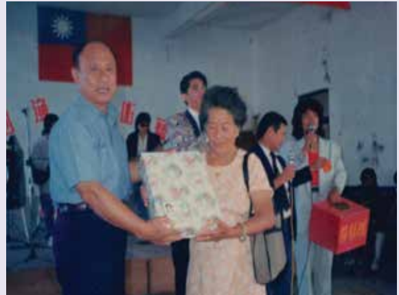
呂總幹事於榮民節活動頒獎剪影（78.9）。