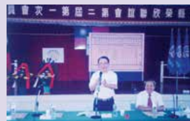
主持榮欣聯誼會第2次會員大會（93.9）。