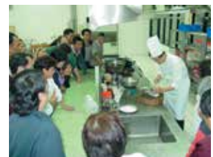
餐飲廚藝管理班中餐烹飪教學。