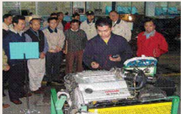
汽修班學員為來賓解說引擎校正 (94.12)。