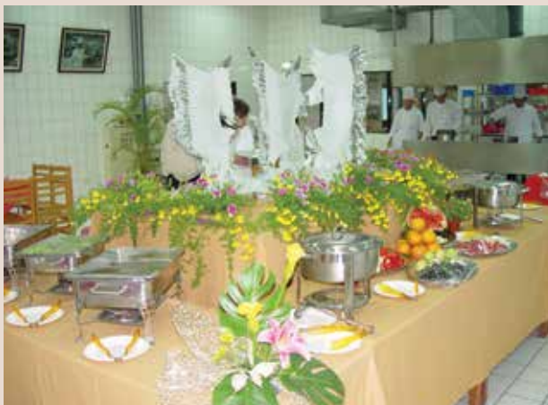
中餐班教學成果展 (94.6)。