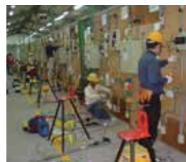
室內配線暨光電能源班上課情形。