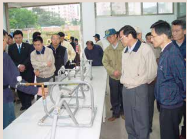
配管班學員作品展覽 (94.6)。