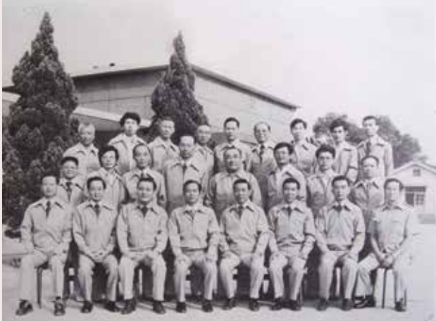
第2任陳主任重華與重要幹部合影（68.1）。