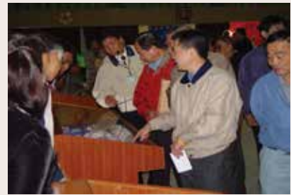
來賓參觀學員作品（94.12）。