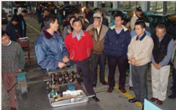
來賓參觀汽車修護實況 (94.12)。

最近3年來中心更獲得會本部大力更新實習車輛及修護儀器、設備，使學員學習標的與就業市場需求同步，提升汽車修護科的場地及設備，目前堪稱全國最佳場地。在各級長官指導下更規劃配合市場需求之汽車甲級及汽車美容證照，讓學員擁有更寬廣的職場選擇及競爭力。