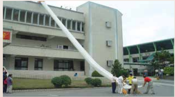
學員練習高樓逃生 (94.11)。