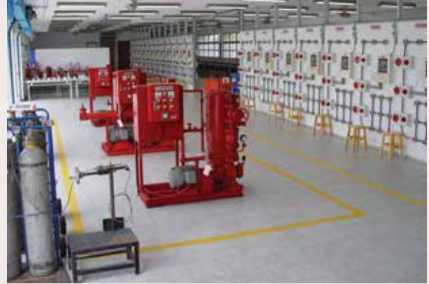
消防安全設備實習場 (94.11)。