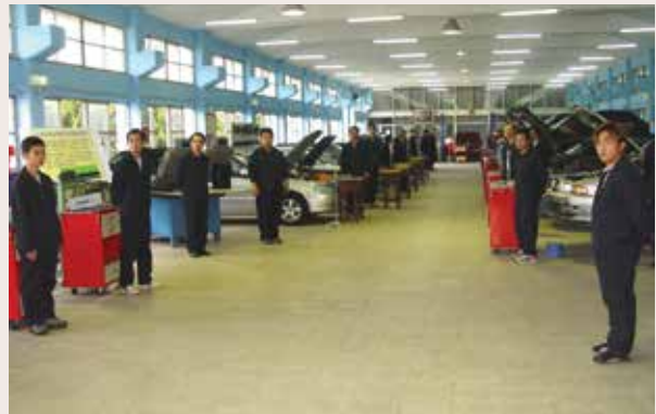
汽修班辦理專案技能檢定 (94.12)。