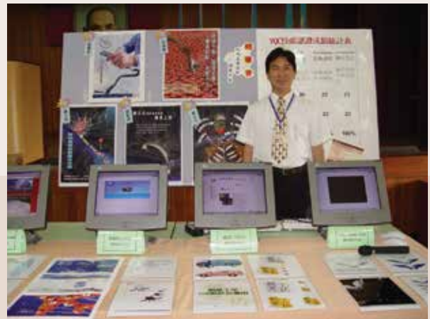
多媒體網頁設計班教學成果展 (94.6)。