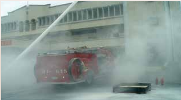
與桃園市消防隊共同舉行防災演習 (94.11)。