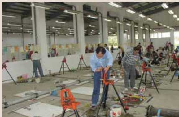
自來水管配管技能檢定。