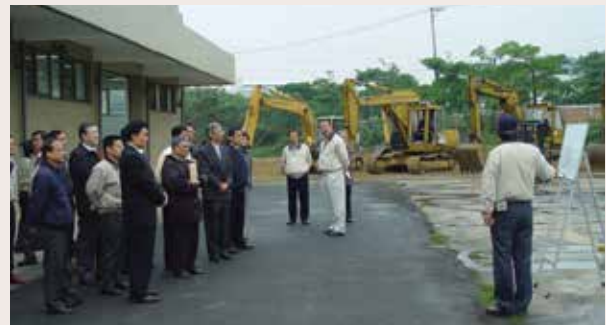
王老師為來賓班務簡報（94.4）。