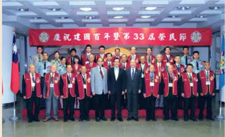
馬總統與榮民節楷模合影留念。

就業成效優良企業代表、國軍暨家屬扶助基金會張鑄勳理事長、李永然律師及王月蘭慈善基金會副執行長等430人與會，會中並向先總統蔣公、故總統經國先生、國軍陣亡將士暨亡故榮靈致敬，與會貴賓並一同觀賞「向永遠的英雄—榮民致敬」專輯影片。