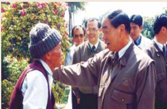
羅處長（後左2）陪同李主委訪視榮民。

羅處長民國32年3月7日出生，政戰學校11期畢業，86年3月1日於國防部總政戰部少將退伍。羅處長服務期間，積極協調本會（主管機關）透過立法程序，依據兩岸關係條例第68條第4項規定，捐助82年9月17日前亡故榮民遺產，籌設「財團法人榮民榮眷基金會」，於86年7月18日完成設立登記，同年7月29日