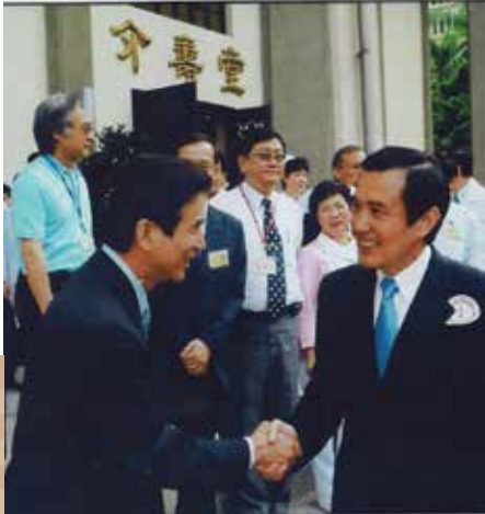
劉處長（左）於第32屆榮民節慶祝大會場外，與馬英九總統握手致意。