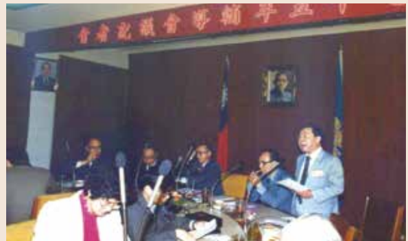
劉處長（右1）參加民國75年輔導會議記者會。

劉處長民國16年2月9日出生，陸軍補給管理學校（聯勤軍需講習會8期）畢業，71年1月1日於國防部部長辦公室上校副處長退伍。劉處長服務期間，積極執行榮光大樓興建計畫與流程等相關作業，終使興建工程於74年下半年正式開工，76年下半年次第遷入；而在國會聯絡組尚未組成前，在有限的資源下，負責立、監兩院相關事務之協調聯繫，對於本會政務推展、預算爭取等卓具貢獻，另於媒體公關工作，亦汲汲營營，不遺餘力，使得本會各項施政與績效，均得以及時、正向報導，對於本會形象塑建甚有助益。