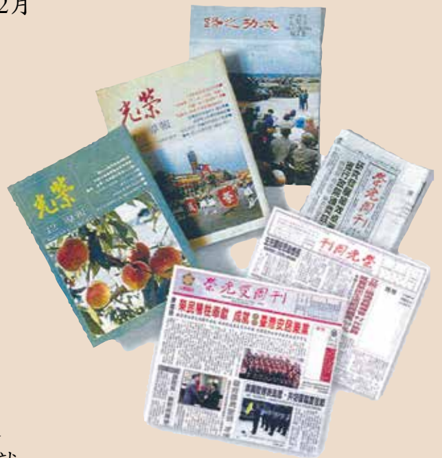
由華欣文化中心編印之成功之路、榮光報導、榮光周刊、榮光雙周刊等刊物。