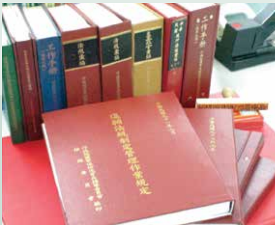
為因應行政程序法，法規會編訂退輔法規制定管理作業規定以供同仁參考。

行前，行政機關依中央法規標準法第7條訂定之命令，須以法律規定或以法律明列其授權依據者，應於本法施行後一年內，以法律規定或以法律明列其授權依據後修正或訂定；逾期失效。」其立法目的係在督促行政機關通盤檢視未具法律授權之職權命令是否有限制人民權利義務等情，以避免違反法律保留原則。