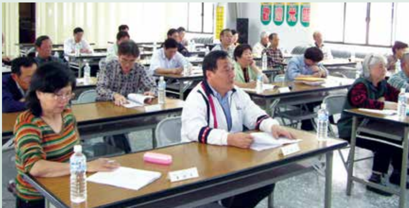
民國95年行政救濟實務講習實況。

為因應民國94年12月30日修正發布之國軍退除役官兵就養安置辦法將就養審核權限下授各榮服處、榮家後，各榮服處、榮家須立於處分機關之地位，辦理訴願、行政訴訟答辯等行政救濟事宜，屆時恐因承辦人員未嫻熟相關行政救濟事務，致影響人民權益及本會依法行政之形象。