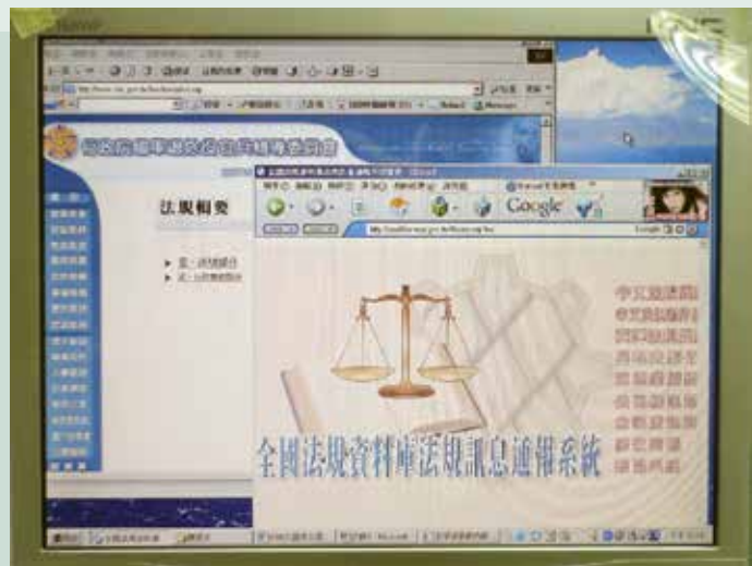
本會法規輯要網站及通報全國法規資料庫系統。

有關全國法規資料庫通報系統之作業部分，本會係由業管處擇定專責人員負責辦理，每月法規異動結報之月報部分則由法規會負責。因月報係依據業管處當月通報成果加以統計，如業管處未依規定確實通報，法規會即難有正確之資料加以綜整，且因部分單位未依規定於法規發布3日內及行政規則發布或下達5日內辦理通報，以致本會法規異動通報及月報數目未臻確實。法務部全國法規資料庫工作小組於民國93年3月25日蒞會進行實地查核工作，針對本會法規通報工作提出查核意見。為檢討作業缺失，自93年5月1日起法規通報作業改由法規會主政，惠請業管處發布或下達（含訂定、修正、廢止及停止適用）法規命令或行政規則時，均應將發布令、下達函連同法規或行政規則條文通知法規會，俾利辦理通報作業。