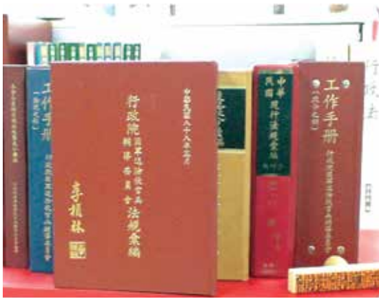
法規會負責本會相關法規案件之審查。

法規會前身為依民國61年7月24日（61）輔人字第10769號令所訂定之本會法規審議委員會組織規程所成立之「法規審議委員會」，負責本會相關法規案件之審查並逐步落實相關法制工作，69年9月24日首次以委員會形式，召開法規審議會，由當時韋副秘書長德懋任法規審議委員會召集委員，審議之內容為國軍退除役官兵輔導條例第17條修正草案。