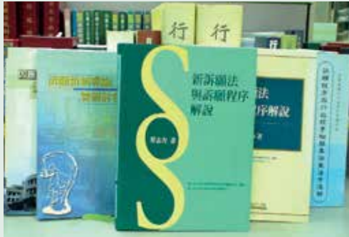
民國89年7月1日新訴願法之施行。

為因應法制作業之革新及依法行政之需要，有關本會業管之法規命令及行政規則，法制人員應主動參與並提供意見，以求研擬之法令適法、妥當、可行。有鑑於此，法規會自整合成立專責單位以來，逐步落實本會法規命令之研擬、審議（查）及彙整程序，使業管單位能依照程序發布法令，提升法制品質，確保榮民權益。有關各單位所擬之行政規則，法規會更積極參與研提意見，發現行政規則中可能遭遇之法律上爭議及業務執行之困擾，協助業管處解決疑難，以提升行政行為之適法性及妥當性。