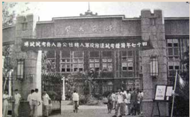
民國47年退除役官兵轉任公務人員特種考試首度舉行。

為使退除役官兵取得公務人員任用資格，順利轉任政府機關服務，經洽請考試院同意，於民國47年2月20日訂定「特種考試退除役軍人轉任公務人員考試規則」，並於同年辦理第1次考試。本項考試初期為資格考試，47年、51年、54年所辦理之前3次考試，均未能分發任用；至59年以