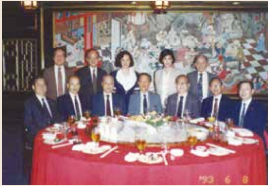
前排右3為吳會計長。

任職本會會計長職務近20年，對本會辦理榮民輔導工作，貢獻良多，因績效卓著，於71年10月榮陞本會副秘書長，75年轉任欣欣大眾市場股份有限公司董事長。