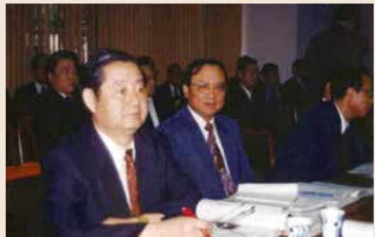
裴會計長（左前1）出席立法院預算審查。

裴會計長民國24年11月3日生，自38年從軍，從二等幼年兵做起，先後完成了高中、專科及軍官養成教育，81年8月由警備總部主計處少將處長外調本會會計長，任職期間積極爭取榮民生活給與，由82年度6,928元調增到85年度8,552元，並配合「兩岸人民關係條例」之修正，將在臺亡故單身榮民未繼承的遺產，捐助「財團法人榮民榮眷基金會」以保留渠等大陸法定繼承人之權益，並辦理榮民（眷）災害救助等照顧服務工作，對榮民奉獻心力，貢獻良多，85年3月榮調榮僑投資公司總經理。