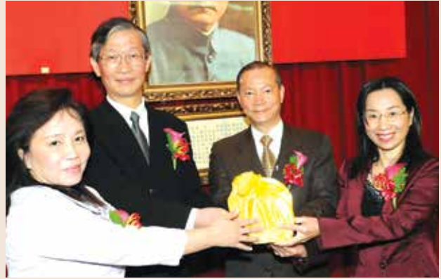
呂會計長秋香女士(右1)就職交接(民國98年12月31日)。

呂會計長以洞燭機先之睿智與遠見，戮力建構各項制度，績效卓著，充分發揮主計人員協助業務推動角色，於101年11月16日榮陞行政院主計總處主任秘書職務。