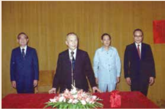
原任吳會計長（左1）、新任高會計長（右1）交接典禮。

會計長任期，貢獻良多，由於工作績效卓著，75年1月榮陞本會副秘書長，77年12月榮調欣隆天然氣股份有限公司董事長。