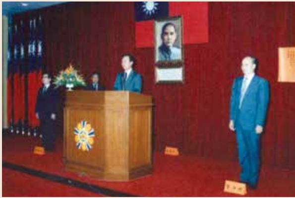
孫會計長（右1）到任就職典禮。

孫會計長民國18年2月18日生，高中畢業後投筆從戎，先後進入財務學校初級班、高級班、三軍大學陸軍學院深造。75年3月由國防部主計局少將處長軍職外調本會擔任專門委員兼任副會計長，78年4月榮調行政院主計處會計主任，78年8月調升本會會計長。任職會計長3年期間，本會單位預算由695億餘元，增為1,013億餘元，另配合研訂「就養榮民申