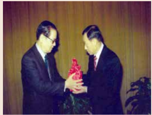
段會計長（右1）接受印信。

段會計長任職期間，積極爭取調整安養榮民生活給與，由76年度每人每月2,878元至78年度調增為每人每月5,078元，值得一提的是每半年調整一次，77和78二個年度共調整4次，並配合政府開放大陸探親政策，籌募旅費5億餘元，協助2萬多位榮民達成返鄉探親心願。