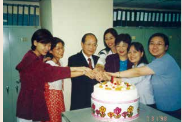
周會計長（左3）生日與同仁合影留念。

周會計長民國30年6月9日生，高中畢業後，於48年投考聯勤財務學校學生班，85年3月由國防部主計局少將副局長軍職外調本會會計長，任職期間，適逢全民健康保險之實施，將「榮民醫院附設民眾診療作業基金」於86年度更名為「榮民醫院醫療作業基金」，並於87年度與臺北、臺中、高雄三所榮總作業基金合併為「榮民醫療作業基金」。另因應預算法第12條，將會計年度由七月制調整為曆年制，一次編列88年下半年及89年度一年半預算。復對爭取榮民生活給與調整不遺餘力，由85年度8,552元，至90年度調增為13,100元，對改善榮民生活，嘉惠良多，90年1月榮調榮僑投資公司總經理。