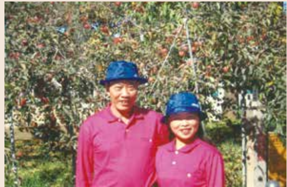
蔡專門委員伉儷攝於本會福壽山農場蘋果王果樹前。

蔡專門委員平日喜愛慢跑運動，曾參加2006年太魯閣國際馬拉松路跑賽，以1小時55分跑完21公里半程賽，展現無比的耐力。在本會任職期間，一向就是本著跑馬拉松的工作態度，辛勤的耕耘，無論是負責公務預算或基金預算，均能適時適切的支援本會服務榮民的四大主要工作－就學、就業、就養、就醫。其所累積的成果，就像上圖所示：福壽山農場的蘋果王－結果累累。