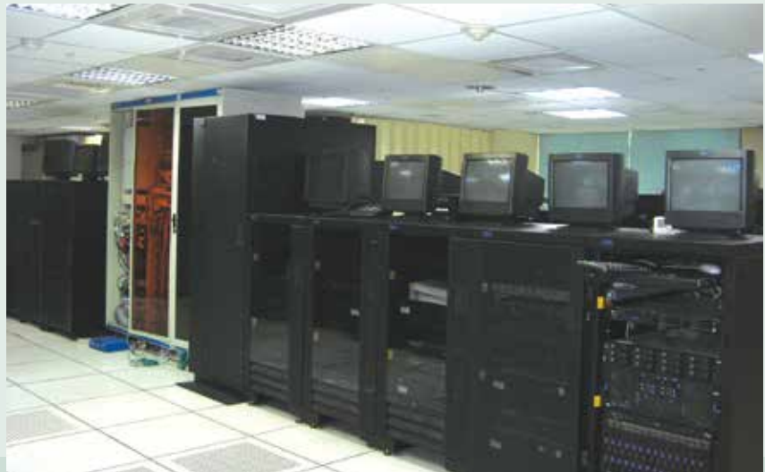
本會電腦機房，圖中左側白色高櫃為本會網路控管中心。

本會資訊作業始自民國71年，初期使用王安VS 90電腦執行資料處理業務。為應本會日增之電腦化業務需求，於74年租賃容量較大之HDS電腦系統、75年進行原王安系統之程式及資料轉換作業；本會運用HDS電腦強大之處理能力，加速發展各項應用系統，並引進日益普及之個人電腦推動辦公室自動化作業。其後奉行政院核定，83年起，率先由封閉系統大型主機換裝開放性電腦系統，並執行原專屬系統中應用程式之轉換作業，於84年7月1日起正式啟用新系統作業，本案之完成，不但節省維護及管理人力，也為本會在面對網際網路環境興起順利轉型，後續於90年更新資料庫主機，94年於內湖建置異地備援機房，並於98年遷移至臺中文心機房，提升本會電腦可用性及安全性。為了降低人員訓練成本及建置標準化操作準則，87年起將應用系統改寫為視窗作業模式（瀏覽器），90年完成輔導會全部榮民（眷）資料管理系統改版作業，同時配合電子化政府政策，積極建立各項網路運用系統。