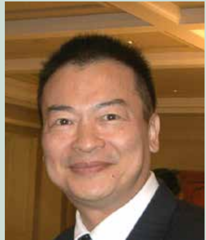
韋博士亦師亦長，經常不辭勞怨，躬親向同仁傳授專業知能。

韋統計長是美國南卡羅萊納大學（USC）的統計博士，前服務於中科院從事彈道散布的研究長達五年，同時也是中山大學創校教授，並兼任計算機中心主任。韋統計長在「統計」與「資訊」兩個領域均學有專精，所以在籌組統計處時，即確立了兩項業務必須互為經緯的組織方針，「由統計分析需求建立資訊處理能量」的系統思維不但在當時別樹一格，直至今日，輔導會在各部會中，仍是極少數能將統計與資訊結合在單一建制內的機關，而此一饒具特色的組織架構多年來證明成效斐然。