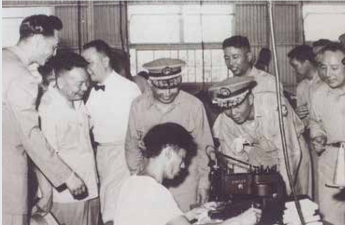
劉沁廠長（左1）向蔣經國主任委員（左2）說明研發作品。