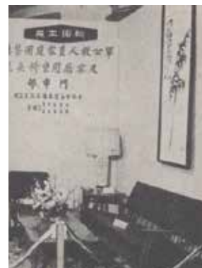
展出之軍公教家庭用傢具。