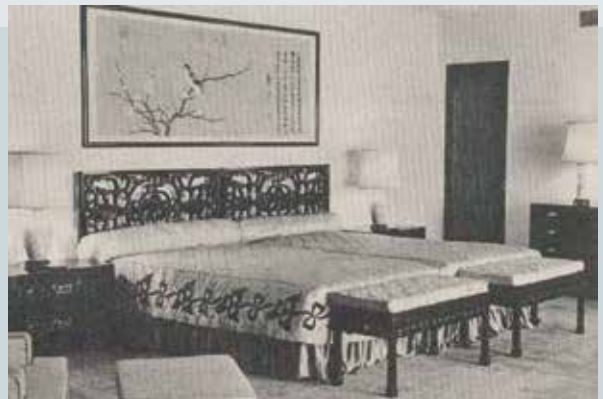
臺北圓山大飯店麒麟廳國賓臥房傢具（民國52年）。

該廠最後完成之1項重大工程，係「國防醫學中心固定式實驗櫃及特殊工程」，於86年3月28日開始承製；本案品項繁雜且大部分必須專業分工，經同心協力，克服諸多困難，終能在88年底順利如期、如質完工。