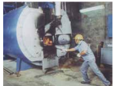
廢木料為燃料之蒸汽鍋爐提供木材乾燥熱源。