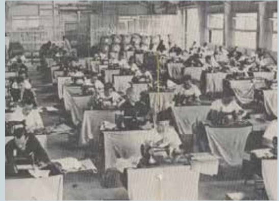
榮民員工於被服工場在職訓練。