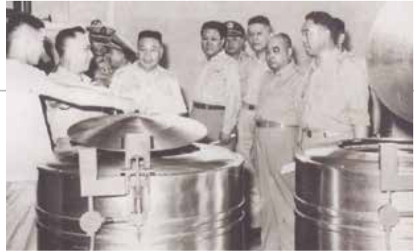
蔣經國主任委員（左3）巡視，軍方人士陪同參觀。