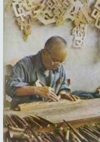
聚精會神地創新雕刻作品。