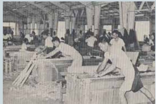
榮民員工於木工場手工刨木在職訓練。