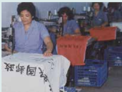
郵局訂製之帆布袋。