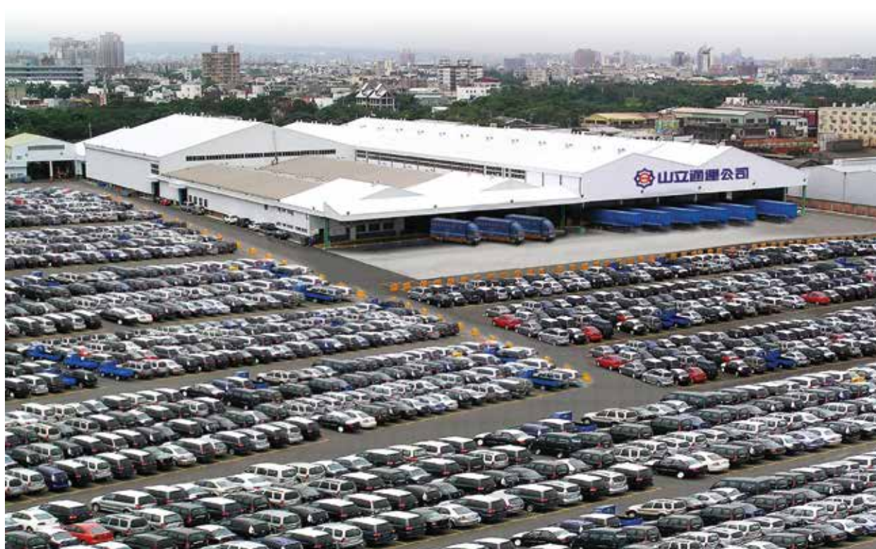
結束營業後廠區改以促參案（ROT）興、整建完成之大型綜合物流中心（民國95年）。