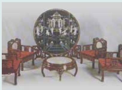
屏風及桌椅傢具組合。