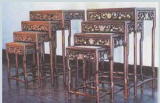
精緻的曲腳雕花套几。