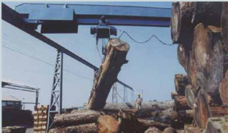
原木製材吊車設備。