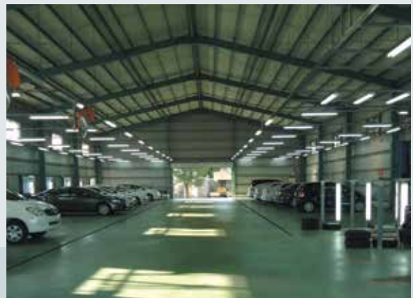
促參案興建之汽車檢驗廠房。