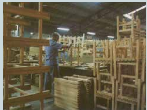
國民小學課桌椅製作情形。

國民義務教育自民國57年延長為9年，學校之學生課桌椅需求大增，另因該廠成立了新型傢具工廠，設備完善，自57年起約30年期間，產製無數的全省各高中至小學學校課桌椅，國內之中小學校學生課桌椅大多數係由該廠製作，該廠於57年開始生產時，即遵當時趙主任委員之指示：「國民義務教育延長為9年是遵奉 總統之指示辦理，承製國中之課桌椅等辦公設備，必須做到牢固精美，必須降低成本，以最低廉價格供應」。