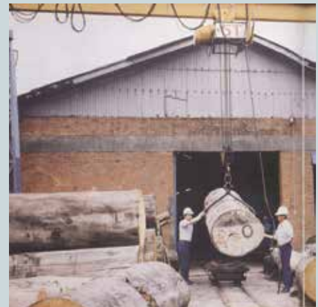
原木吊運室外作業。