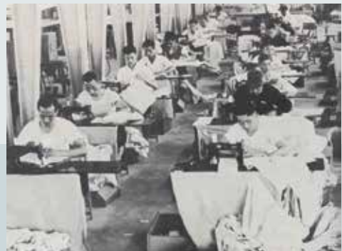
被服工場榮民員工縫紉作業（民國53年）。

民國50年代，被服產品即以物美價廉、品質保證，奠定了內外銷良好基礎，在不景氣情況下，仍能維持正常營運，客戶除本會各會屬機構外，尚有鐵路局、菸酒公賣局、郵局、各大專院校等公營機構學校，外銷產品有美軍帳棚及皮夾克等。