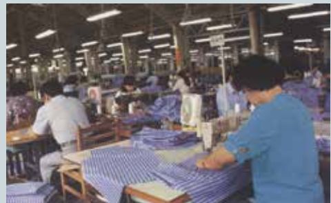
被服工場員工縫紉作業。