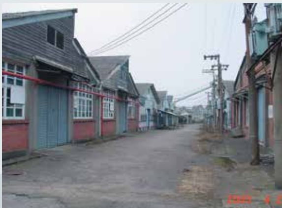
前桃園工廠促參前廠房（已拆除）。