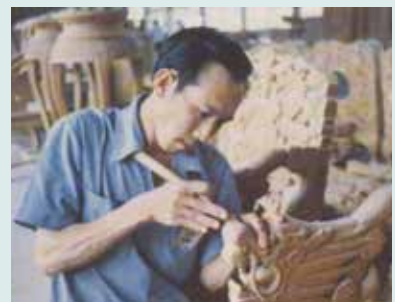
精緻典雅之紅木龍椅雕刻。