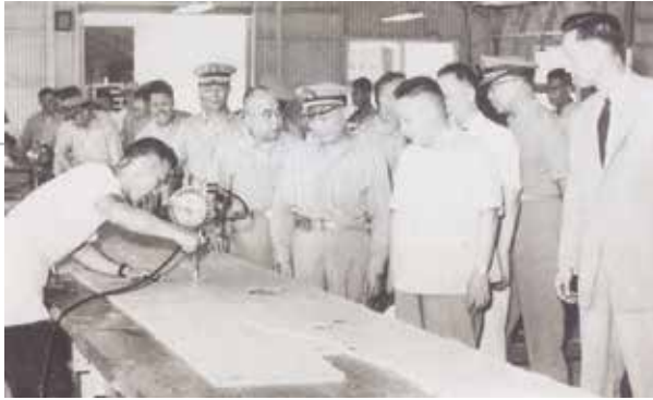
蔣經國主任委員（右4）巡視，軍方人士陪同參觀。