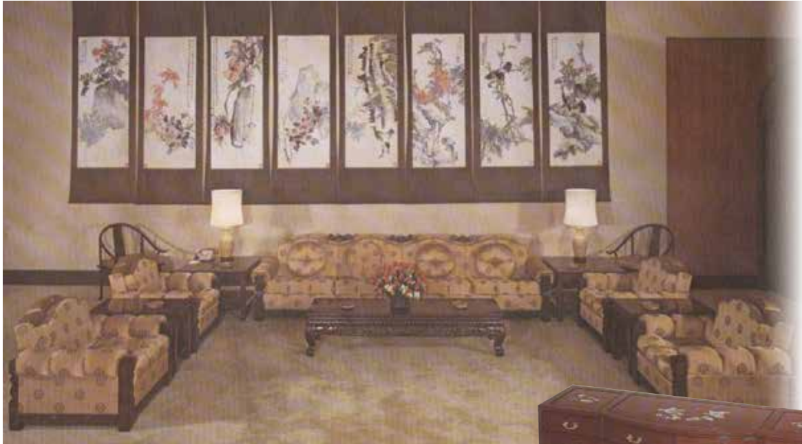
中國彫刻配合歐美傢具所設計之客廳傢具。