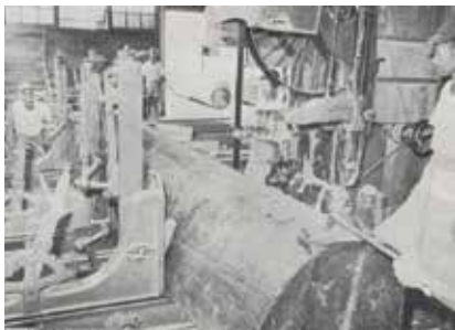
原木切割作業（民國53年）。