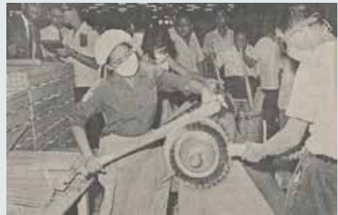
棒球棒打磨製程（民國58年）。

棒球棒的製作，共分為採材、乾燥、切割、砂光及上漆等5個主要製程，在40秒可把一根3吋四方、長度35吋的原木，磨成球棒輪廓，再上漆砂後即為球棒，每月產能為5千支；價格方面，當時每根棒球棒的價格，日本製為200多元，美國製為300多元，然該廠不超過100元，品質完全不遜於外國貨。