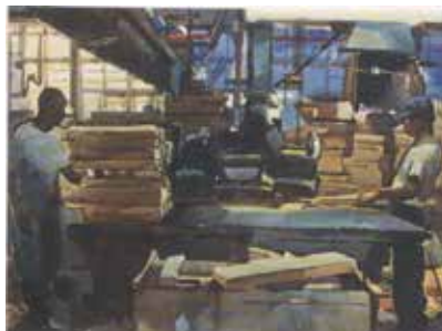
木料切材作業寫生圖。