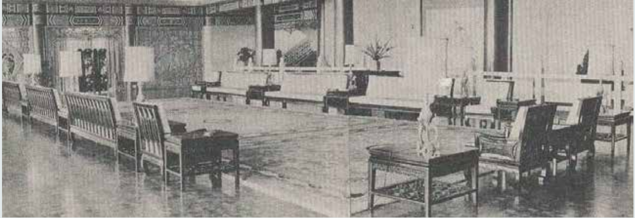
臺北圓山大飯店麒麟廳豪華古雅傢具（民國52年）。

承製，尤以民國55年下半年完成了富有歷史價值的中山樓全部傢具，其品質精良，式樣新穎，集中西藝術之大成，榮獲中外佳賓的一致讚譽。