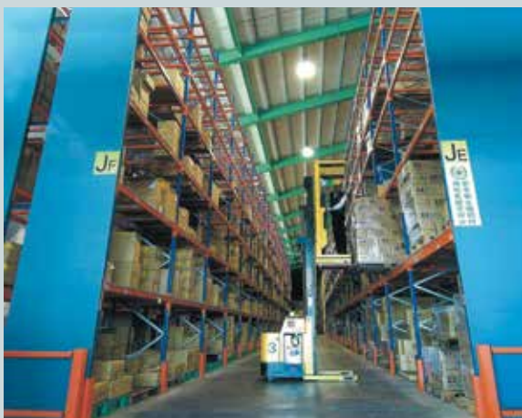
促參案興建之零件庫庫儲作業。