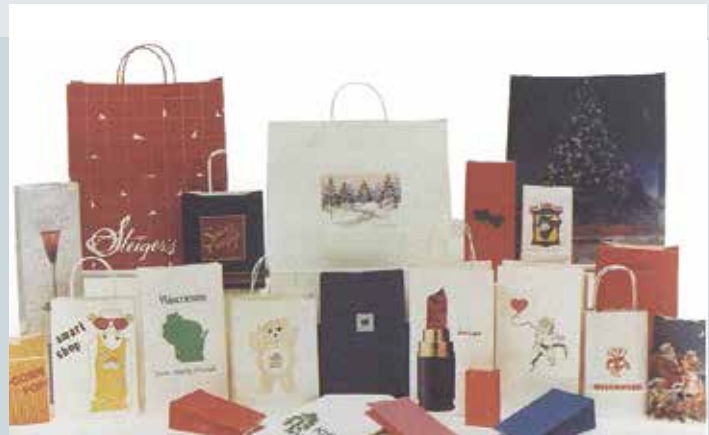
生產之各式百貨服飾業之購物袋。

於民國85年仍因受制於公務機構法令約束、市場競爭激烈、紙漿原料高漲、人事成本較同業高等因素，營運無法自給自足，為避免持續虧損，奉核定予以結束營業。