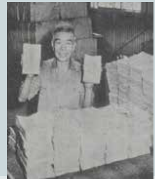
手工包裝草紙（衛生紙）（民國50年）。