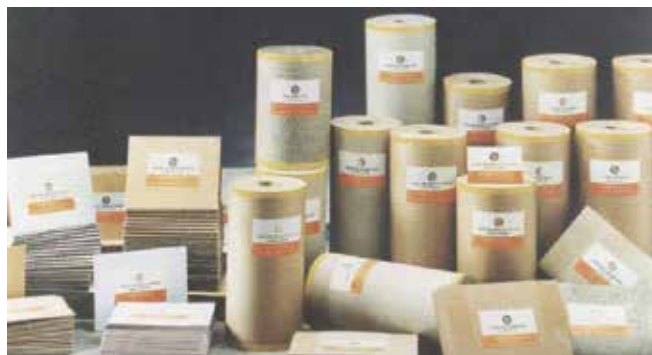
各式高級牛皮紙板等產品。