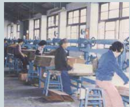
紙箱製造作業（民國68年）。