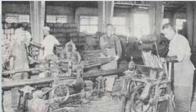
破竹機作業情形（民國53年）。