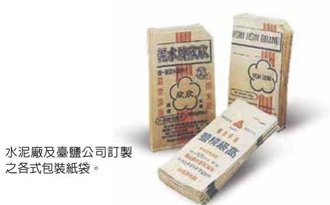
水泥廠及臺鹽公司訂製之各式包裝紙袋。