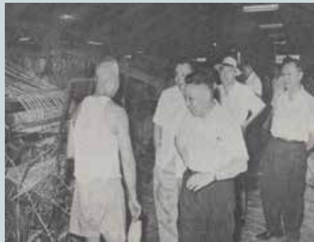
蔣經國主委（中）及趙聚鈺副主委（右1）視察草袋工場（民國50年）。