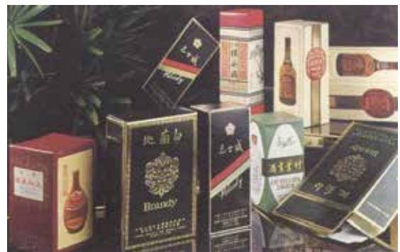
臺灣菸酒公賣局訂製之各式酒品包裝盒。