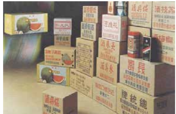
包裝菸酒紙箱產品。