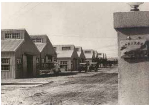
「臺灣榮民工業中心彰化榮民工廠」大門廠景。