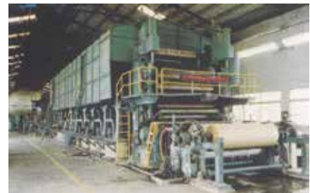
多烘缸長網抄紙機。