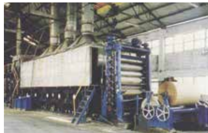
多烘缸六圓網抄紙機。