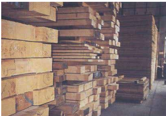
由原木鋸成之木材。