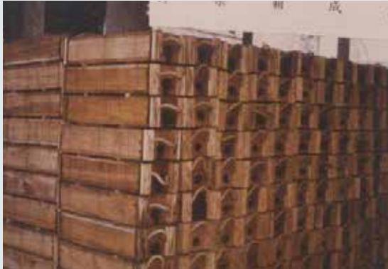
軍方訂製之彈藥箱。

軍方市場總銷售90%，惟自83年後改採公開招標，業務大量流失；民間市場則以木材乾燥、防腐加工等為主。