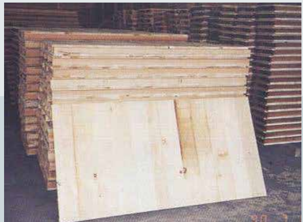
利用零廢木料生產之模板建材。