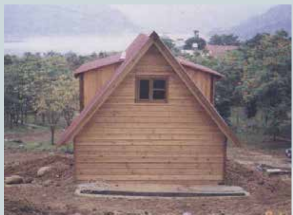
嘉義農場休閒木屋。

國內禁止原木砍伐，國外多採管制出口，木材價格上漲，國內製材外移，反銷之木材甚至較原木價格低，該廠原木加工無利可圖，另受限公務機構法令束縛等因素，競爭條件較同業差，軍方業務大量流失，營運無法自給自足且難以改善，又逾移轉民營辦理期限，因而結束營業。