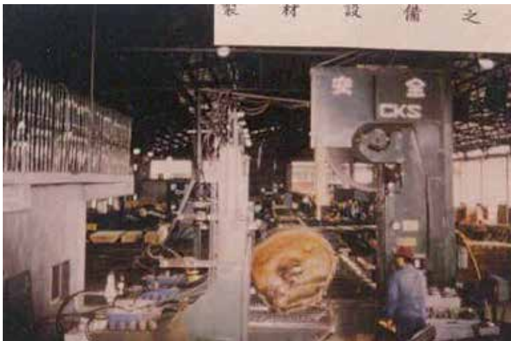
原木剖材機製材作業。