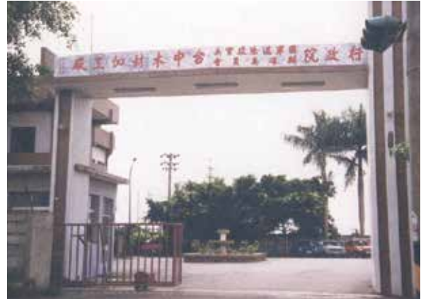
位於豐原市豐勢路新廠門景。