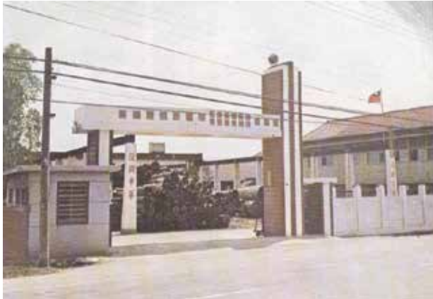
位於豐原市中正路舊廠門景。