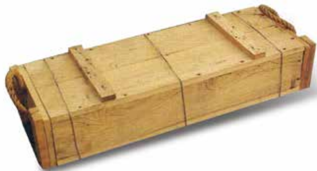
軍方訂製之彈藥木箱。