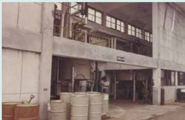
有機磷產品廠房設備。