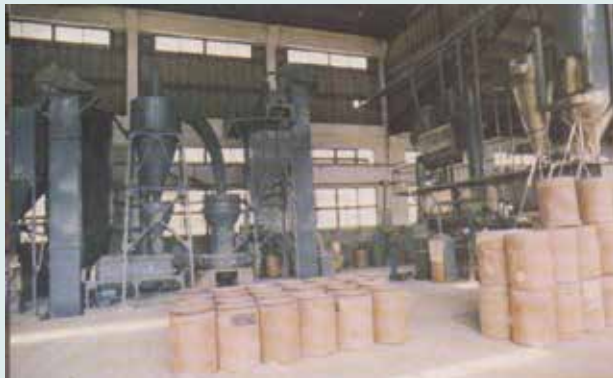
粉劑工場磨粉設備。