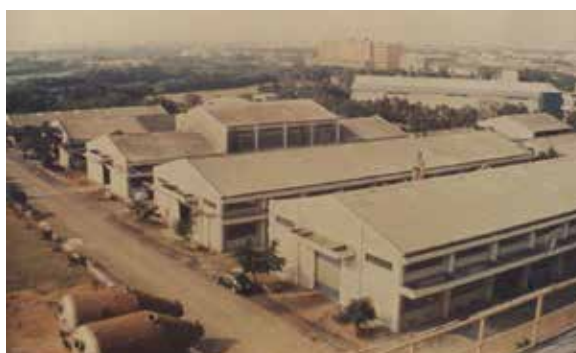
成藥工場廠房鳥瞰