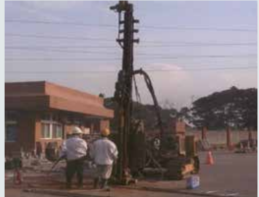
鑽井取地下水檢驗。

民國87年9月委託專業公司進行全廠土壤及地下水調查，並提出「榮化廠結束營業事業廢棄物清除處理計畫書」，復於90年9月報桃園縣環保局「K區整治計畫」及「土壤及地下水補充調查計畫」，於91年12月完成執行。92年2月再向桃園縣環保局提報「全廠土壤整治計畫」，並委請榮工公司代為處理，外包專業公司於95年完成該廠污染土壤整治工作，於96年再持續辦理地下水監測等環境管理一年。