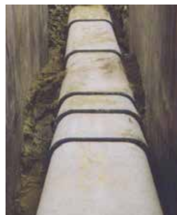
堆設預鑄電纜管之工地現場。