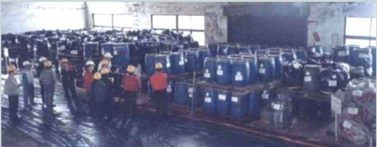
待處理廢農藥存置於符合環保規定之容器及場地。