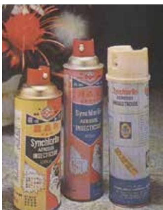
罐裝殺虫靈等環境衛生藥劑。