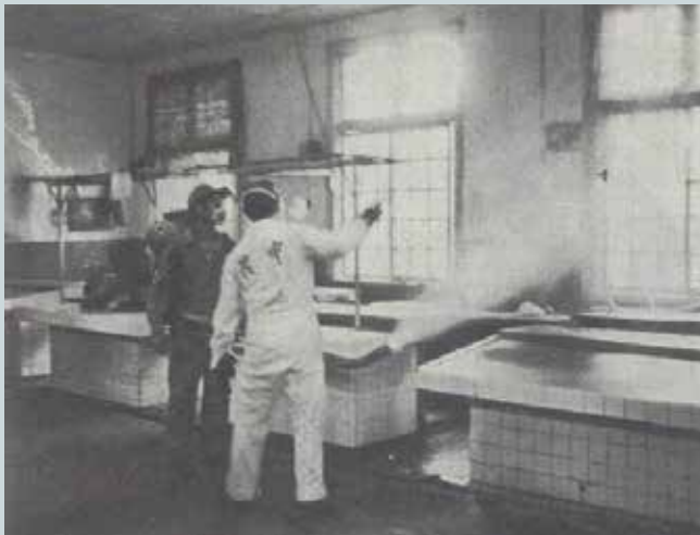
中農化工廠至臺北市各市場義務消毒。

該廠訓練榮民弟兄從事化學工業技術的製造、研發，並編組員工成立噴洒消毒工作小組，採取機動作業，小組人員平時參與產銷工作，可隨時接受客戶之委託，辦理環境除蟲消毒工作，歷年曾接受甚多政府機構及民間之委託，是1支名副其實的「環保隊伍」；例如曾受臺北市政府委託辦理46個市場及公共場所的消毒，獲該府衛生局之頒獎表揚，配合政府機構、民間企業及地方社區改善環境衛生，不惜成本提供完善服務的事蹟不勝枚舉。