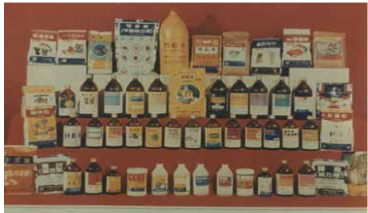
農藥成品、農藥原體、環衛藥、劑界面活性劑等產品。