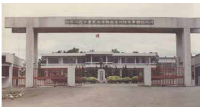
榮民化工廠於桃園楊梅幼獅工業區之門景