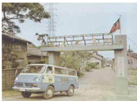
中農化工廠臺北景美廠區之門景