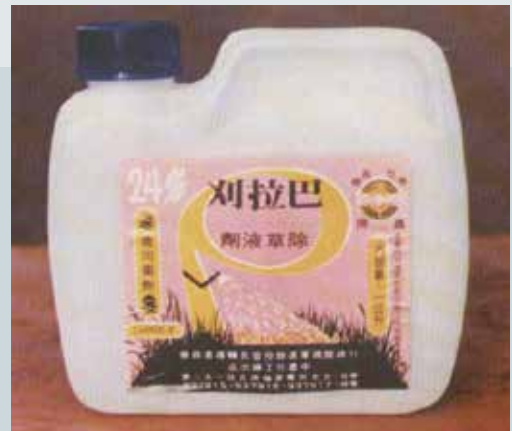
巴拉刈除草乳劑農藥。