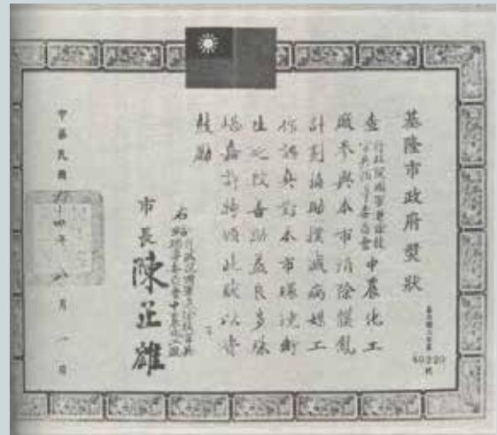
基隆市頒發協助消除穢亂計畫之獎狀。