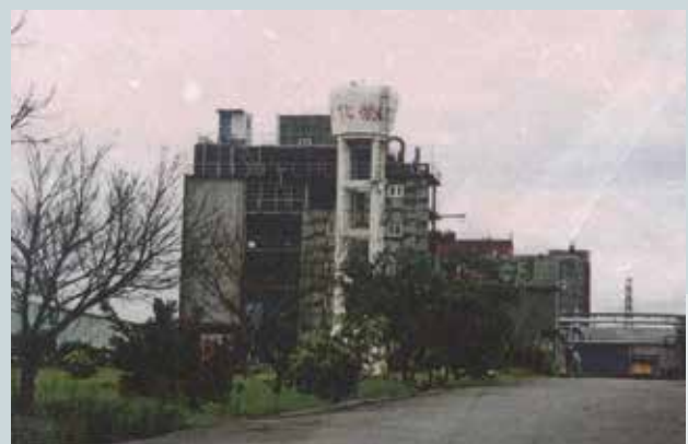
生產四氯異苯月青農藥之廠房。