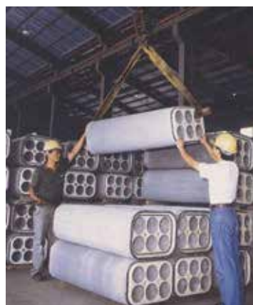
與民間合作生產之電纜導管。