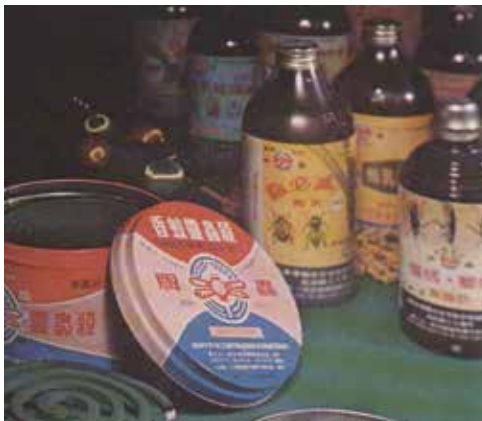
殺虫靈蚊香等環境衛生藥劑。