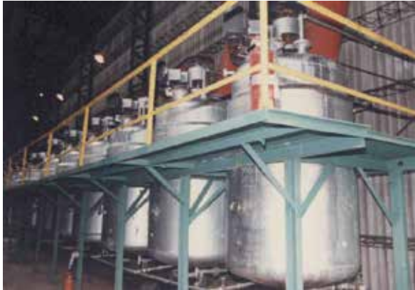
巴拉刈農藥生產設備。