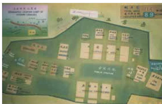
榮民化工廠廠區佈置圖