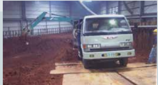
整治之土壤先隔離再開挖及運送焚燒處理。