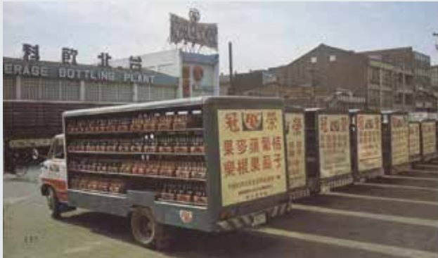
供應市場之飲料運送車。