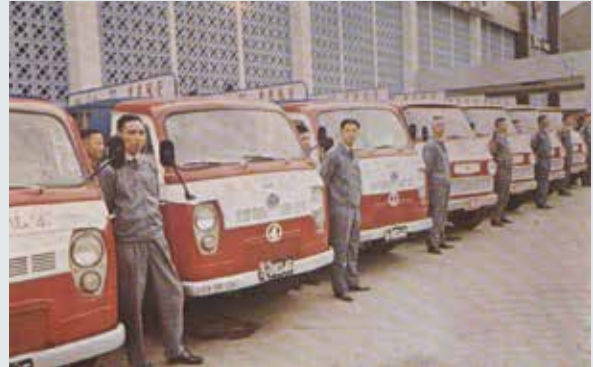
運銷各地之運貨車車隊。