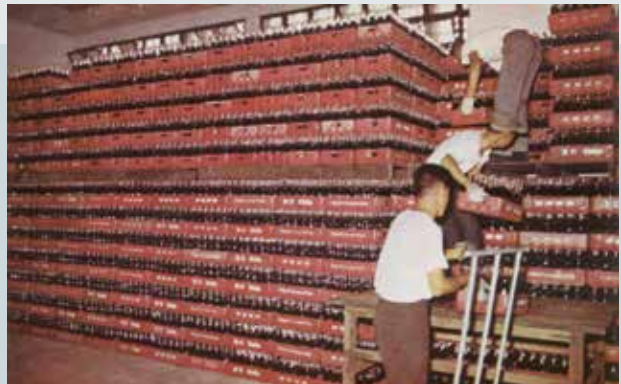
待運銷的飲料成品。