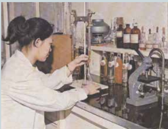
化驗室原物料及成品品質檢查。