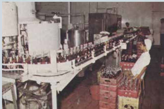
果樂生產成品目視檢驗。