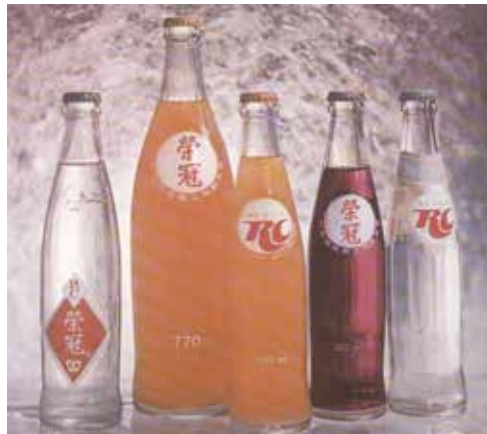
產品—榮冠蘋果、果樂、檸檬、汽水、沙士。 產品—榮冠奎寧、橘子、香檳、葡萄、蘇打水。