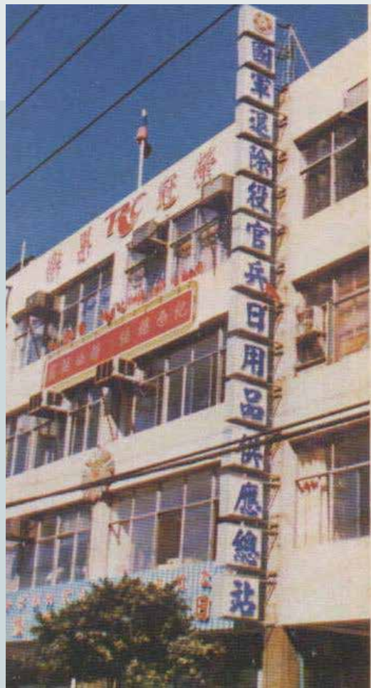
臺北市日用品供應總站有「榮冠果樂」廣告標誌。