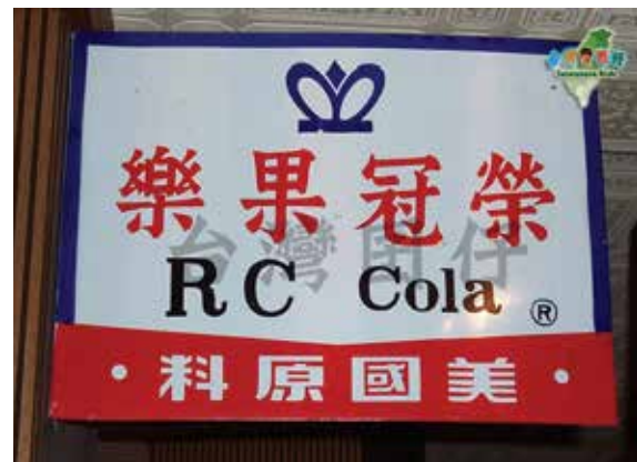
全省市場銷售場所使用之鐵招牌。