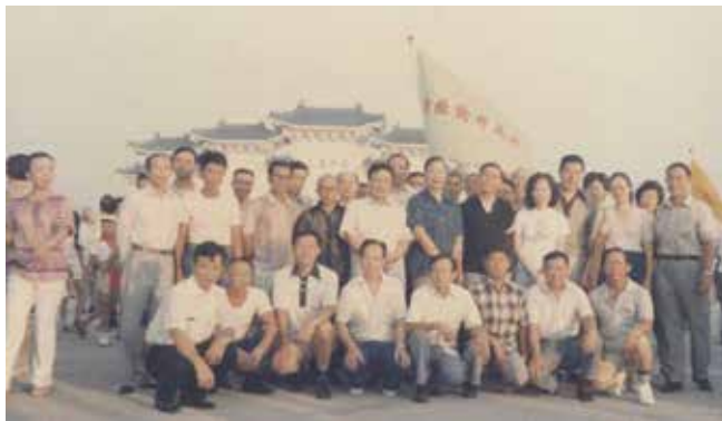
員工至中正紀念堂參加活動合影。