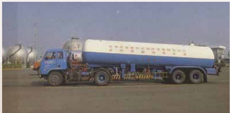
液化石油氣供應處之運送設備。

左廠長在簡報中提到，高雄廠在營運之始，每月液化石油氣銷售量約270餘公噸，經歷年之擴充設備與配合市場消費成長，72年每月灌裝量，已達3萬餘公噸，肩負供應臺、澎、金、馬地區液化石油氣總量達