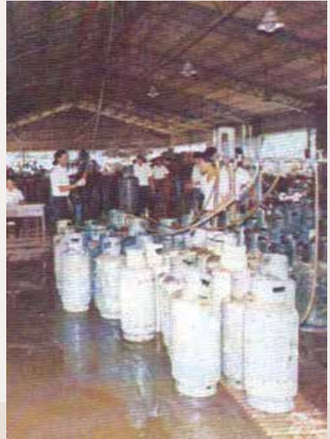
液化石油氣驗瓶作業。

趙主任委員指出該（70）年是我輔導事業的新興年，新興年的行動準則是「眼光遠大，胸襟開闊；活力充沛，朝氣蓬勃；和諧團結，徹底改革；大力擴充，創