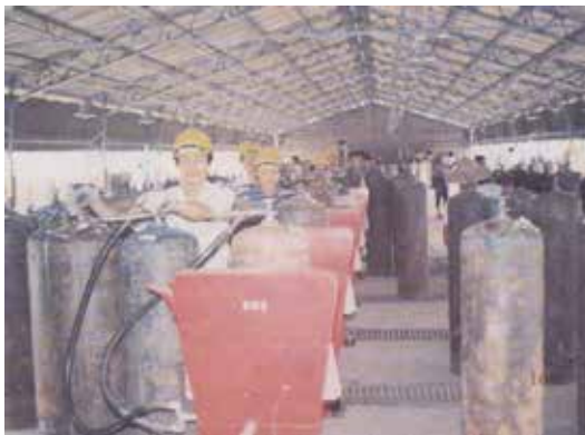
液化石油氣灌裝工業用氣（民國68年）。