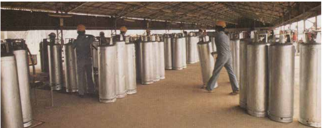
罐裝液化石油氣運送作業。