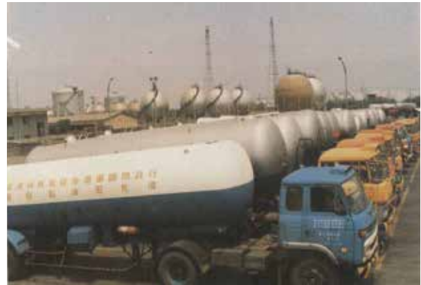
運送液化石油氣車隊。