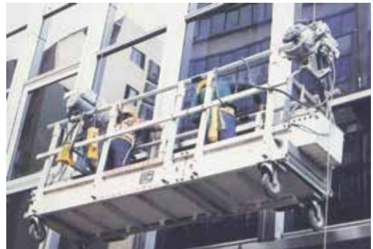
大樓外窗清潔作業。