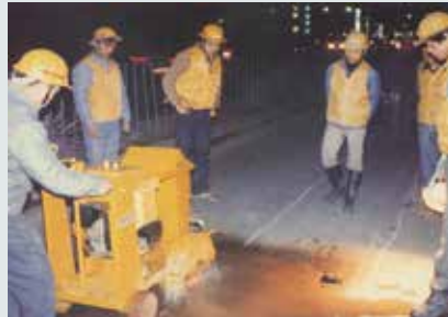
鋪設管線柏油路面切割。

隘，車輛增多以致形成壅塞，且易發生車禍，故各鄉市鎮公所乃積極規劃市容整建。技術一隊因而獲得多項都市計畫工程。