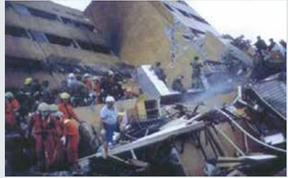
救災行動：瓦礫中搜尋生還者。

中心奉本會指示以部分人力投入救災工作，除對駐地附近受災民眾及眷舍，派遣小組人力實施搶救及復原工作外，並於奉命後立即編組救災隊，迅速投入參加救災行動。