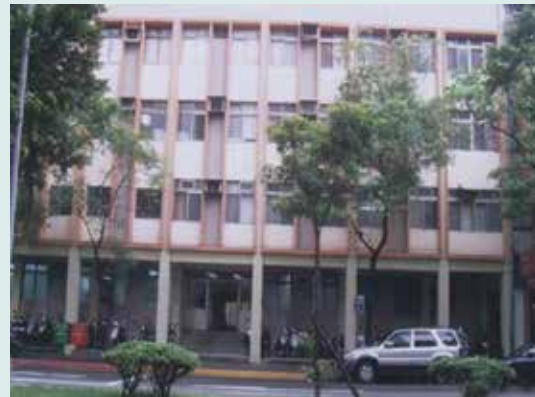
中心辦公室大門（新址）。