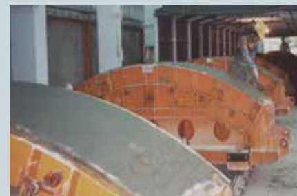
生產之臺北捷運工程隧道環片。