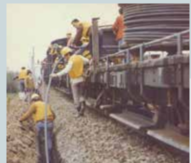
十大建設鐵路電氣化工程電力線鋪設（2）。