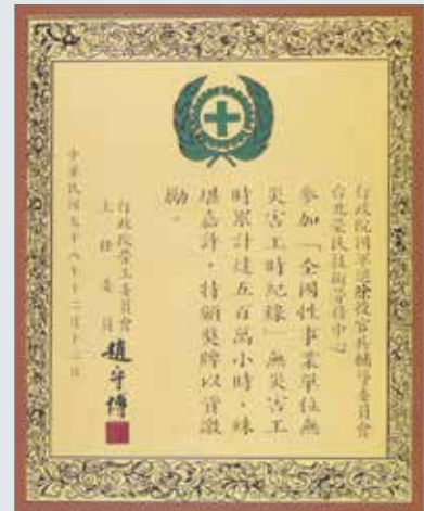
重視工安榮獲勞委會趙主委獎牌。