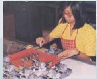
臺電公司之家用電錶檢修維護。

因應各地區科學工業園區開發案、高速公路之興建，需要大量混凝土原料，技術二隊乃奉命視地區需要設置「拌合廠」。如「臺南拌合廠」產製之預拌混凝土，供臺