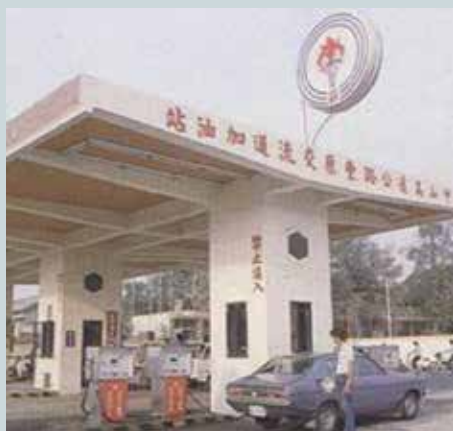
中山高速公路加油站加油一般勞務。