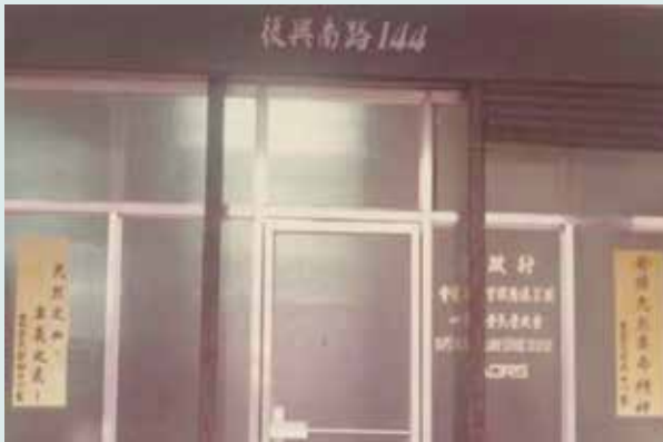
中心辦公室大門（舊址）。