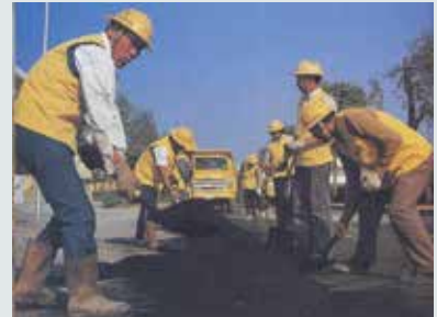
鋪設管線後柏油路面恢復。