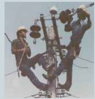
承攬臺電公司電力線路架設工程。