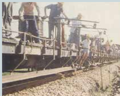
十大建設鐵路電氣化工程電力線鋪設（1）。