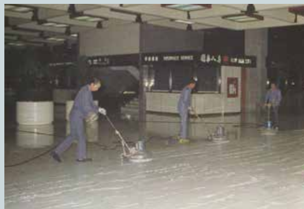
公共場所清潔打蠟。