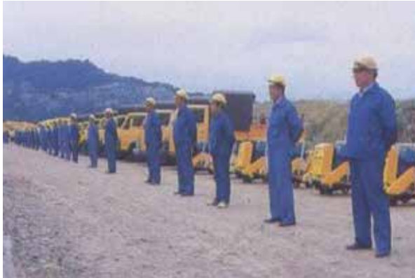
施工技術人員及裝備。