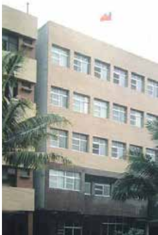
高雄市河北一路辦公大樓。