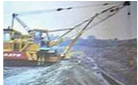
液化石油氣管路埋設工程。