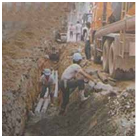
電信管路埋設工程。