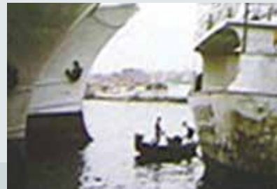
高雄港水面油污清除。