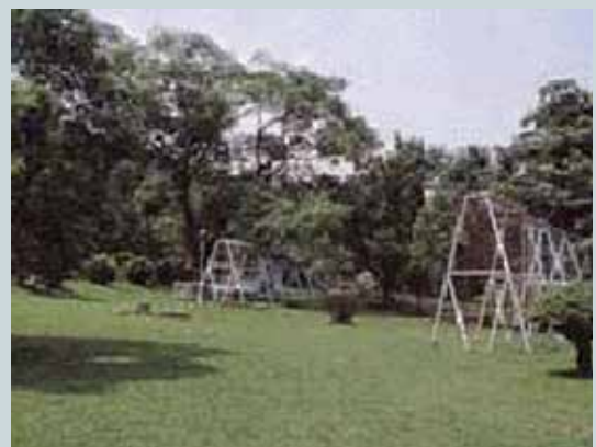
高雄市庭園綠化工程。

高雄地區綠化工程工案，包括公園美化、村落美化、校園美化及庭園綠化等。通常中心僅負責施工部分，而由政府負責規劃及設計。經中心數個技術勞務隊的努力，使高雄縣市多了許多民眾休閒、娛樂的好去處，也使百姓們