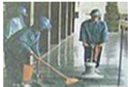
清潔打腊一般勞務。