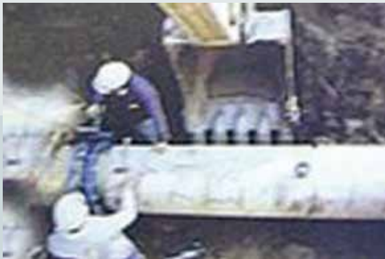
液化石油氣管路埋設。

工程，因而累積了甚多挖埋管技術，使中心業務蓬勃發展，對促進國內社會安定、經濟穩定，貢獻良多。不論電力公司、電信局、中國石油公司或瓦斯公司等之地下涵管管線埋管工程，作業程序大同小異，步驟如下：涵管加工組裝待埋→挖管路→埋管→接裝→覆土。