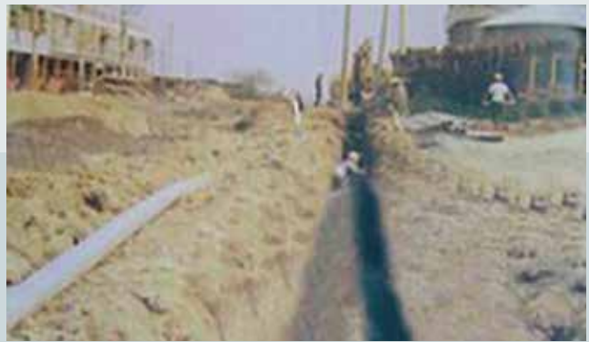
電信局電信線管路埋設。