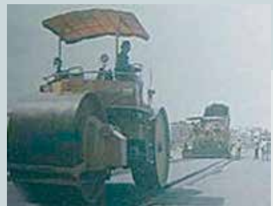
松山機場滑行道整修(2)。