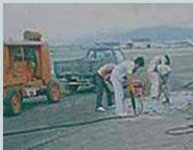
松山機場滑行道整修(1)。