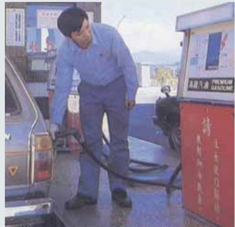
為加油站加油服務。

船舶需要經常之換漆以保護其船體避免快速的腐蝕，因此中心承做高雄港船舶油漆工程；另中心亦承接中國化學之橋樑鋼架油漆工作。