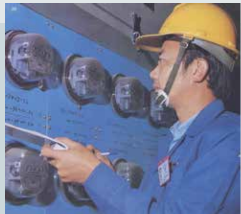
為臺電公司抄錶服務。