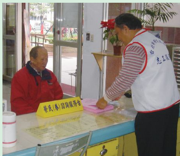
▲台北縣榮服處永和服務台服務榮民。