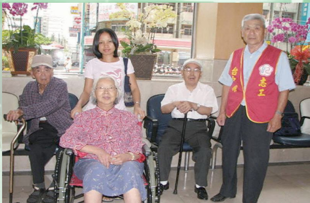
▲台中縣榮服處大里志工隊接送榮民榮譽就醫。