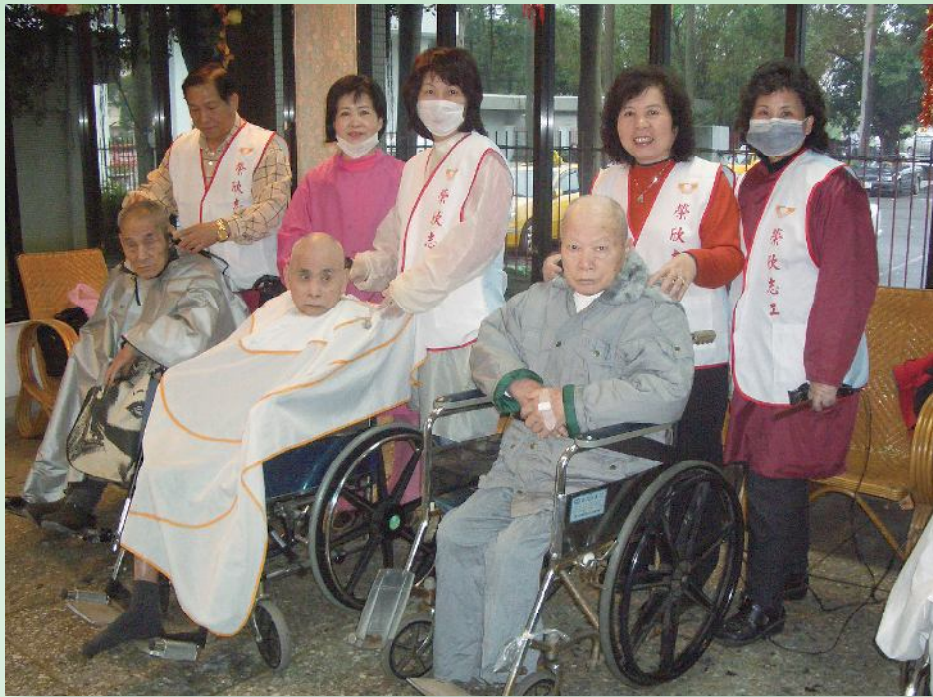
▲桃園縣榮服處榮欣志工為榮民義剪。