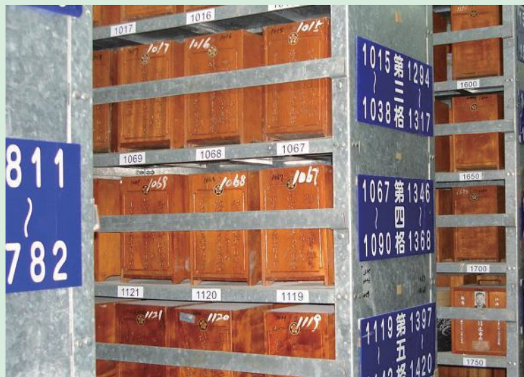
▲台東縣軍人公墓早期龕位。