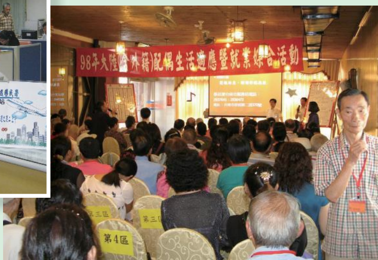
▲台南市榮服處舉辦98年度大陸(含外籍)配偶生活適應暨就業媒合活動。