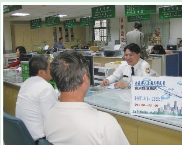
▲內政部入出國及移民署於台東縣榮服處設置服務台服務榮民。