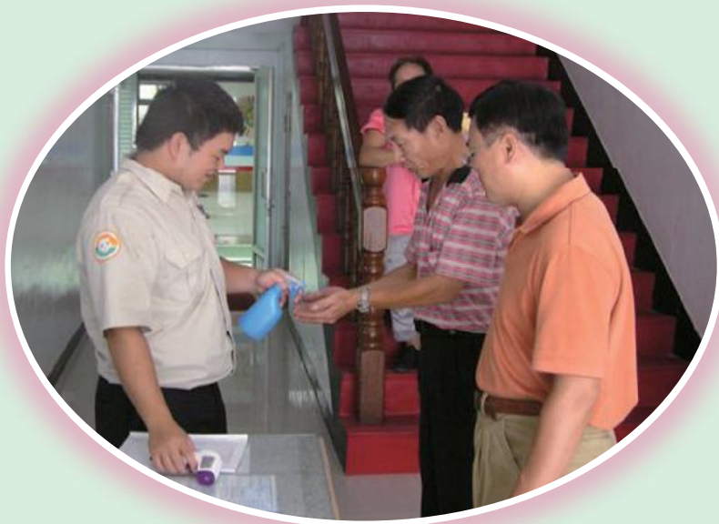
▲台中縣榮服處為洽公榮民榮譽消毒雙手防疫。