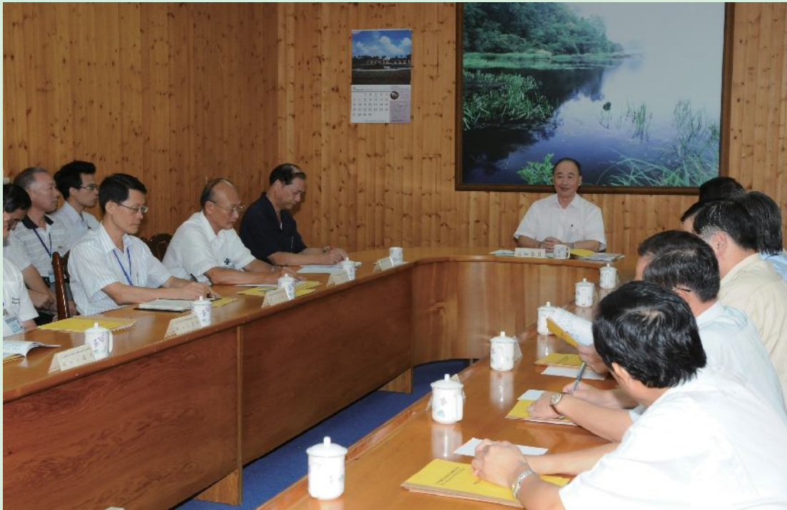
▲曾主任委員視察森保處。