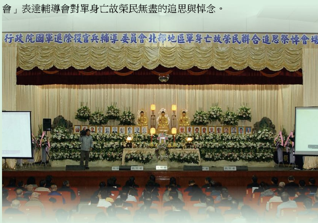
▲單身亡故榮民聯合追思祭悼會會場。

6. 96年12月份起輔導會為緬懷榮民袍澤昔日為國犧牲奉獻精神，規劃每月區分北、中、南、花蓮、台東地區舉行「單身亡故榮民聯合追思祭悼會」表達輔導會對單身亡故榮民無盡的追思與悼念。