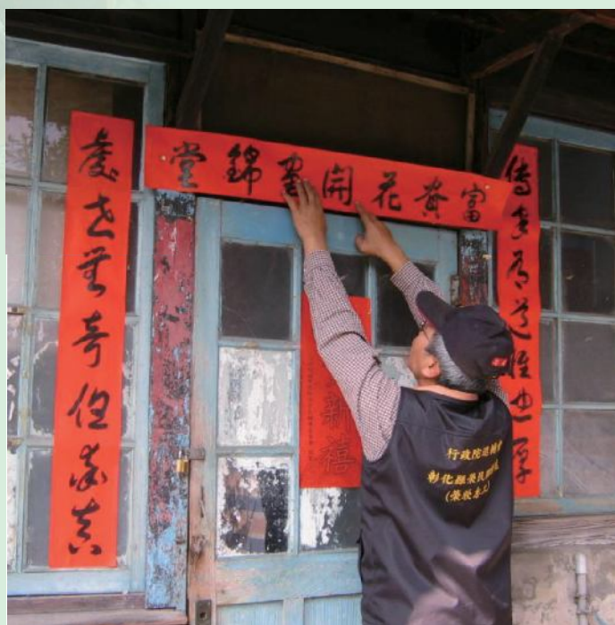
▲彰化縣榮服處榮欣志工協助張貼春聯。