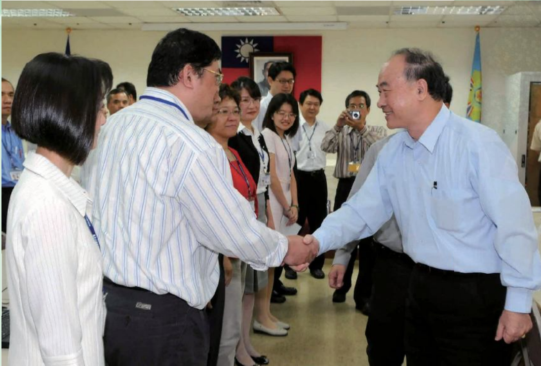
▲曾主任委員（右）視察台北市榮服處，慰勉工作同仁辛勞。