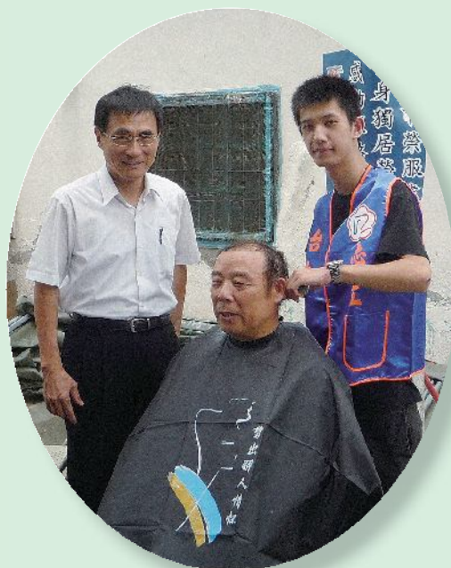
▲台中市榮服處榮欣 志工為榮民義剪。