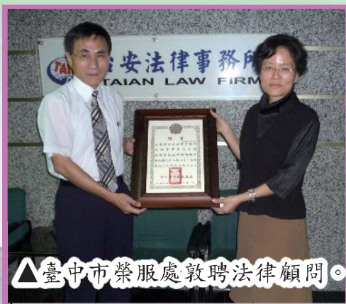
△臺中市榮服處敦聘法律顧問。