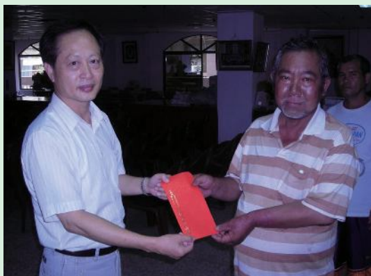
▲高雄縣榮服處處長陳國屏訪慰清寒榮民。