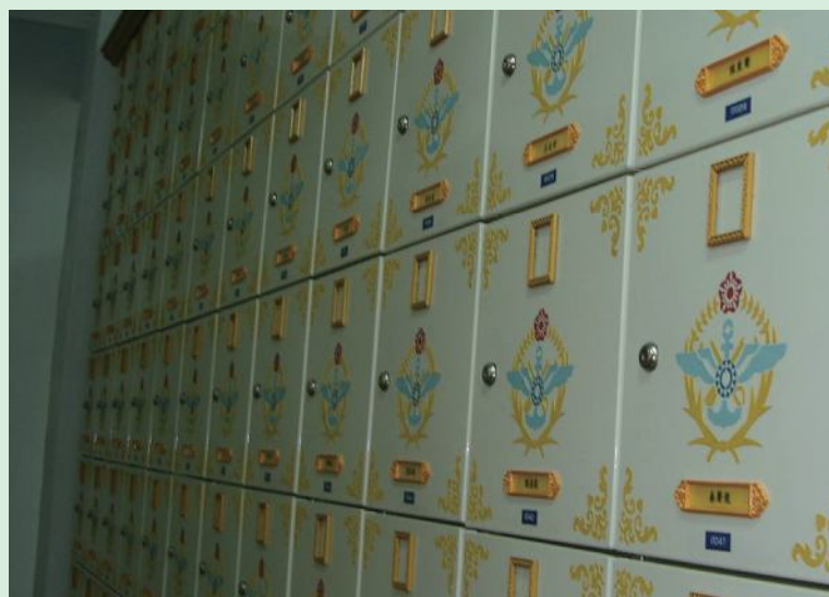
▲台東縣軍人公墓忠靈祠目前的龕位。