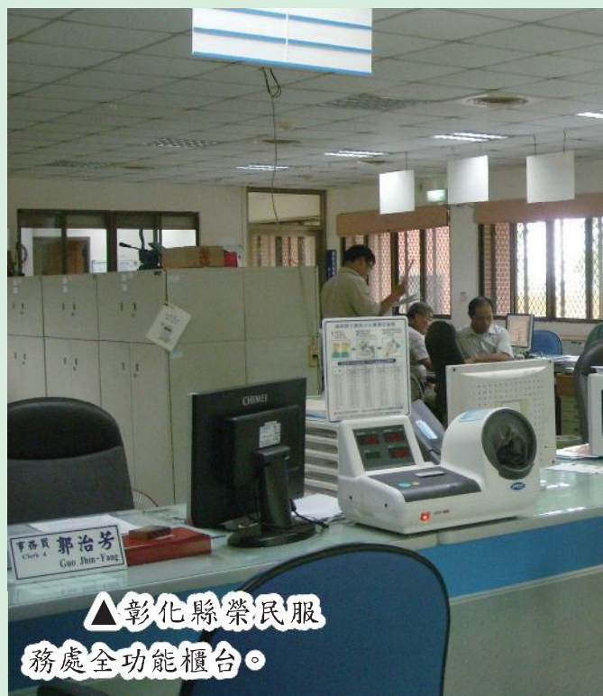
△彰化縣榮民服務處全功能櫃台。

1. 秉持「榮民在那裡，用心在那裡，服務到那裡」的理念，以台澎金馬地區22個榮民服務處為「服務平台」，協調整合輔導會各機構的資源，集中力量落實推動輔導會四大核心任務為榮民解決就醫、就養、就學及就業等問題，同時發揮承上啟下的功能，藉由榮服處這個服務平台，連接地方行政資源，增進服務照顧榮民的深度與廣度，以取得更多的社會福利資源來造福榮民（眷），並為榮民創造了服務的便利性。