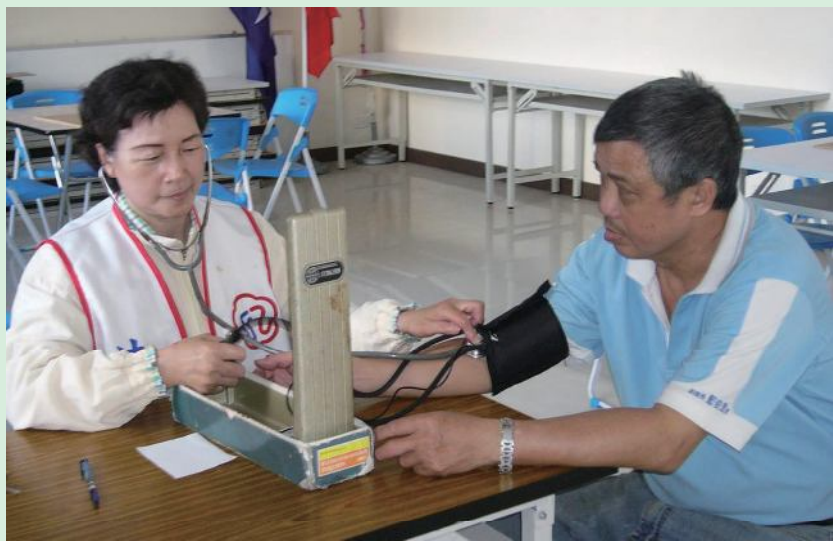
▲澎湖縣辦理榮民分區座談時，榮欣志工為榮民量血壓。

1. 各縣市榮服處運用職工、社區服務體系（由全國各縣市劃分393個服務區，採專人專責主動式服務，遴用設籍於該服務區之榮民眷擔任社區服務組長393人及服務員23人）及榮欣志工等人力，有計畫至榮民(遺眷)住地實施居家訪視，隨時協助解決急困。依榮民及遺眷生活、身體、居住狀況，區分為「特別需要照顧」（3日-7日訪視一次）、「較需照顧」（1個月-2個月訪視一次）與「一般照顧」（1年-1年半訪視一次）榮民，建檔列冊，定時探視。98年7月止總計訪視71萬3,130人次；引進「遠距居家照顧系統」，提供未支領退休俸具高危險因子之單身獨居榮民裝設，降低意外事件的衝擊。