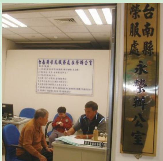
▲台南縣榮服處永榮辦公室服務榮民。