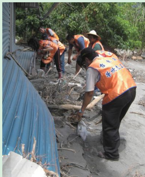
▲台東榮服處榮欣志工協助榮民整理家園。