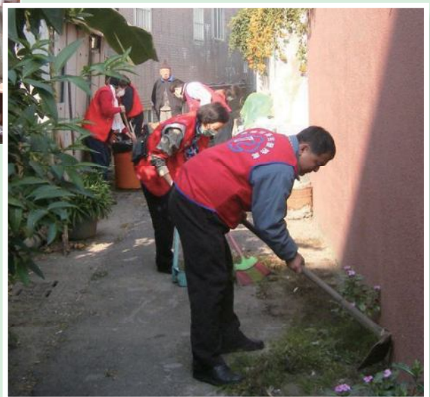
▲►高雄市榮服處榮欣志工，訪視慰問特需照顧榮民，並協助環境打掃。