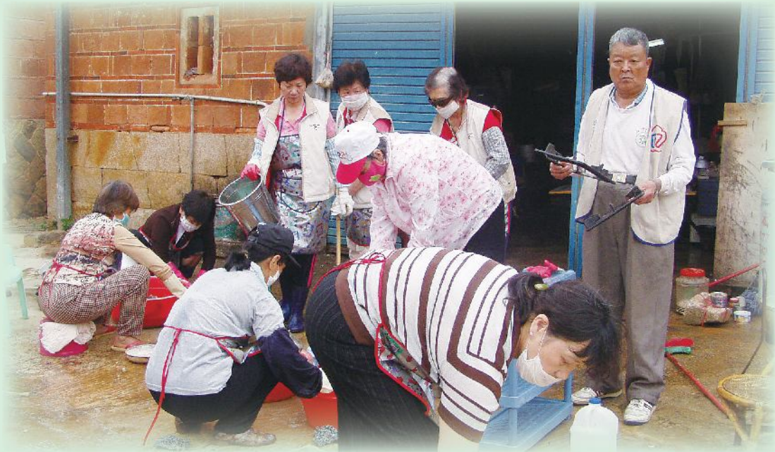
▲金門縣榮服處榮欣志工協助榮民打掃環境。

3. 以社區化照顧為導向，結合當地資源，有效建構更縝密之服務網絡，要求各機構協調轄內海巡署所屬單位、各地郵局及國軍大型營區等，針對各該駐地周邊獨居年長榮民就近協助關懷訪視、送餐或居家服務等工作，以消弭因轄區幅員遼闊、住處偏遠、服務體系人力不足等，造成無法完善照顧之罅隙。