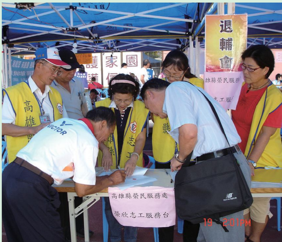
▲高雄縣榮服處於佛光山開設八八水災服務台。

2. 普設便民服務據點於各榮（總）院、清境、武陵等高山農場、國軍地區醫院、署立醫院及榮民（眷）就醫眾多的大型私立醫院設置60個服務台。每月提供就醫、探病榮民（眷）服務及諮詢工作約1萬餘人次。偏遠山區海濱等，普設161個服務據點，服務偏遠地區榮民（眷），達成「走向偏遠，扶持弱勢」施政目標。每月辦理各項收件、詢問及意見反映、居家服務等，計服務1萬7千餘人次，深獲榮民（眷）肯定。此次88水災，於各災民收容所均派出服務人員，提供災民即時急需之諮詢及協助。