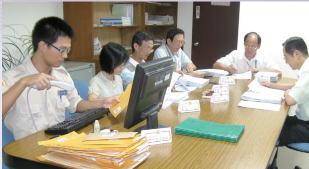
▲榮民就學獎助審查作業情形。