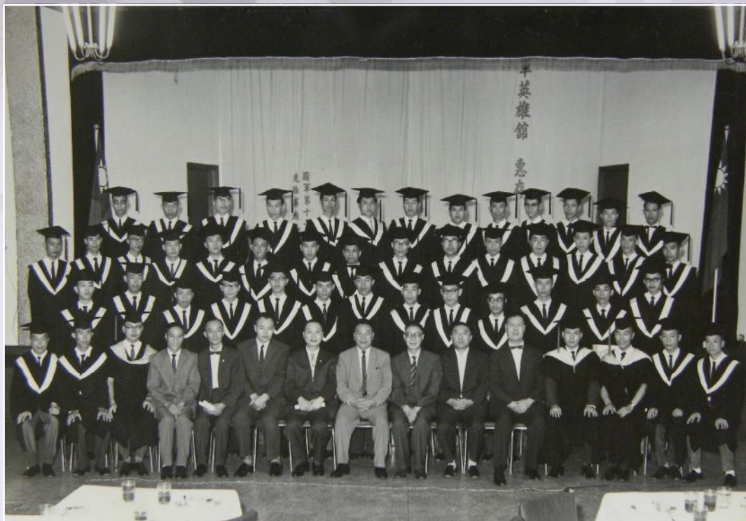
▲經國先生與畢業生合影。