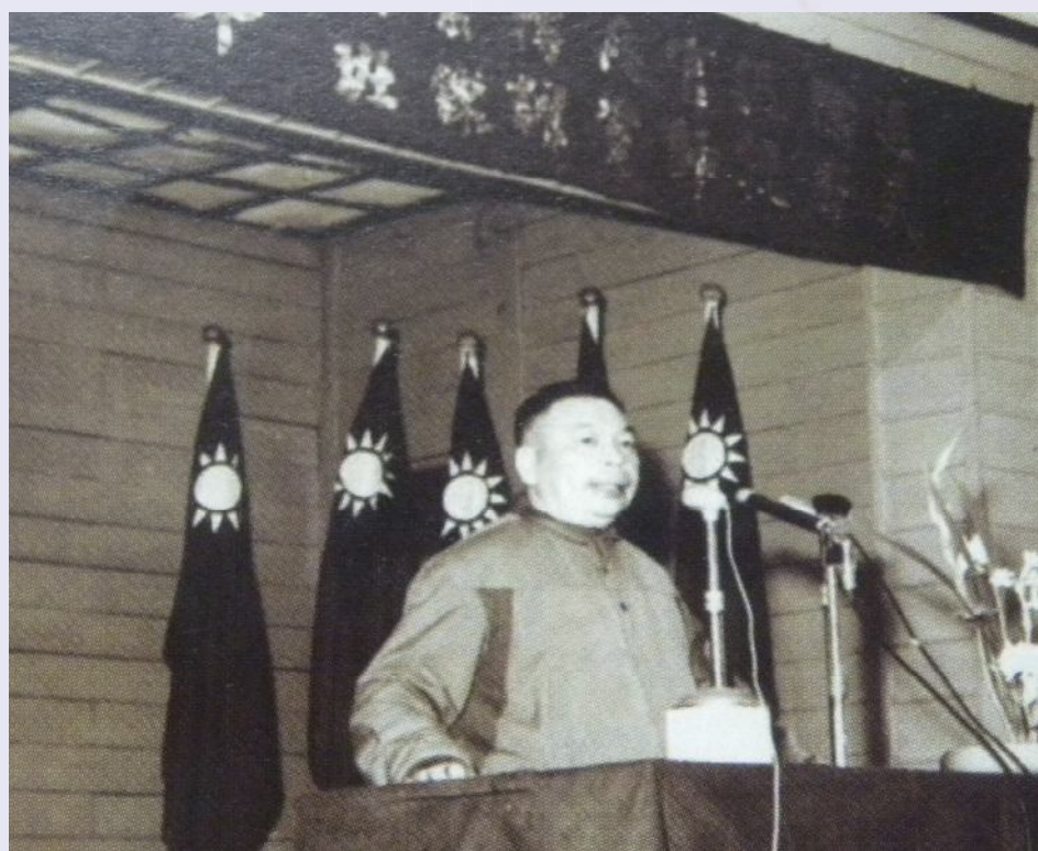
▲蔣前主任委員主持師資訓練班開訓典禮。

輔導會在民國43年成立之初，其任務在配合政府建軍政策，使不適服現役之官兵次第退出軍中，謀求妥善照顧，務使退而能安，繼續發揮智能潛力，獻身於國家建設，繁榮經濟，安定社會。故初期工作，在專責辦理退除役官兵之「就業」、「就醫」、與「就養」等三項主要工作，務期壯有所業，病有所醫，老有所養。迄45年，因鑑於退除役官兵中有志繼續入學深造者，大有人在，為此，遂增設「就學」一項業務，期使退除役官兵能學有所長，開創新的事業。