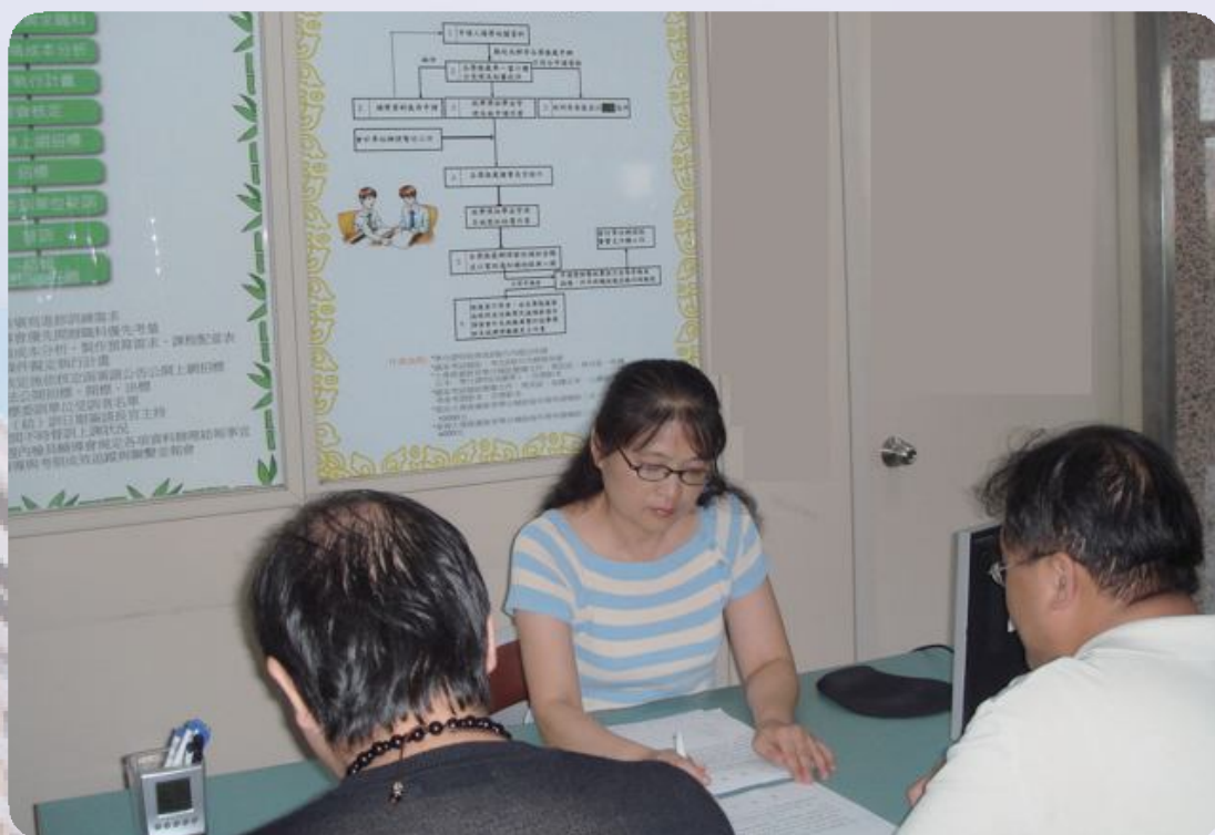
▲推甄榮民就讀專科進修學校錄取分發作業。