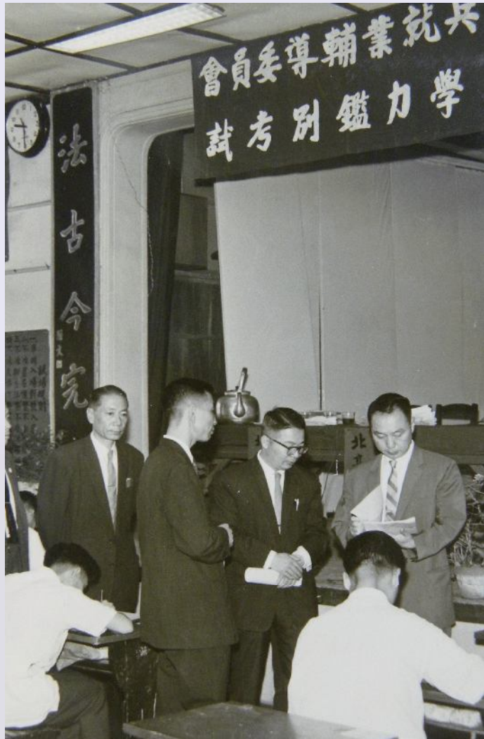
▲退除役官兵學力鑑別考試。

民國62年，鑒於台灣地區之中小學師資已漸達飽和，乃不得不另闢輔導就學的途徑，經再洽請教育部同意，畢