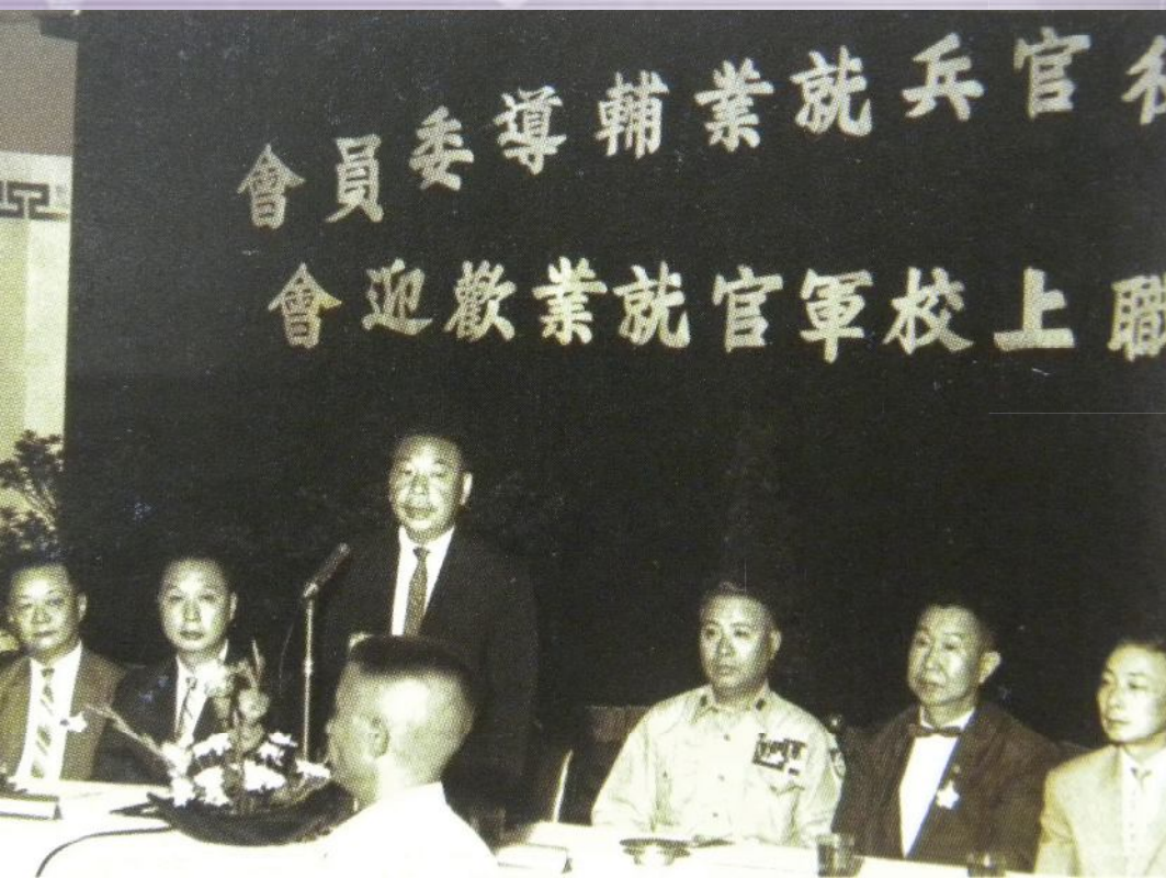
▲民國54年蔣前主任委員（中）向轉業資深上校致詞期勉。