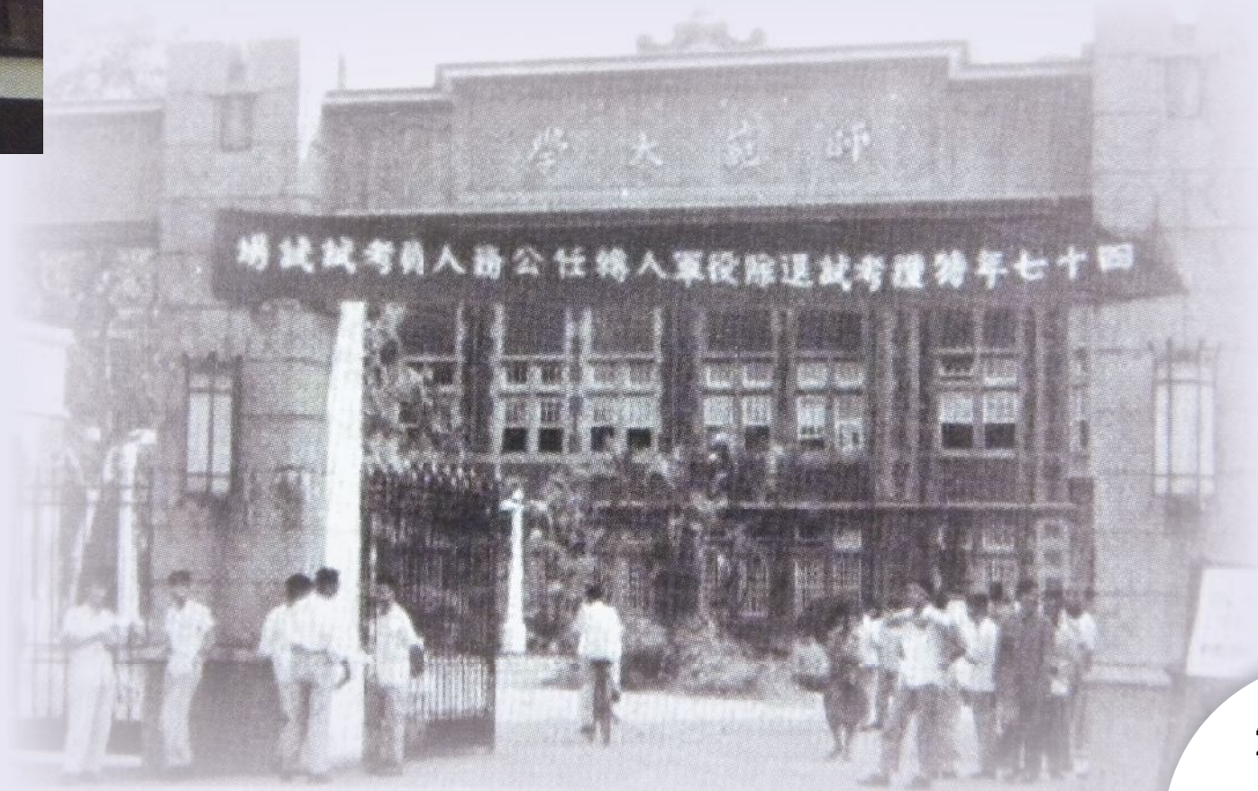
▼民國47年退除役軍人轉任公務人員特考師大考場。