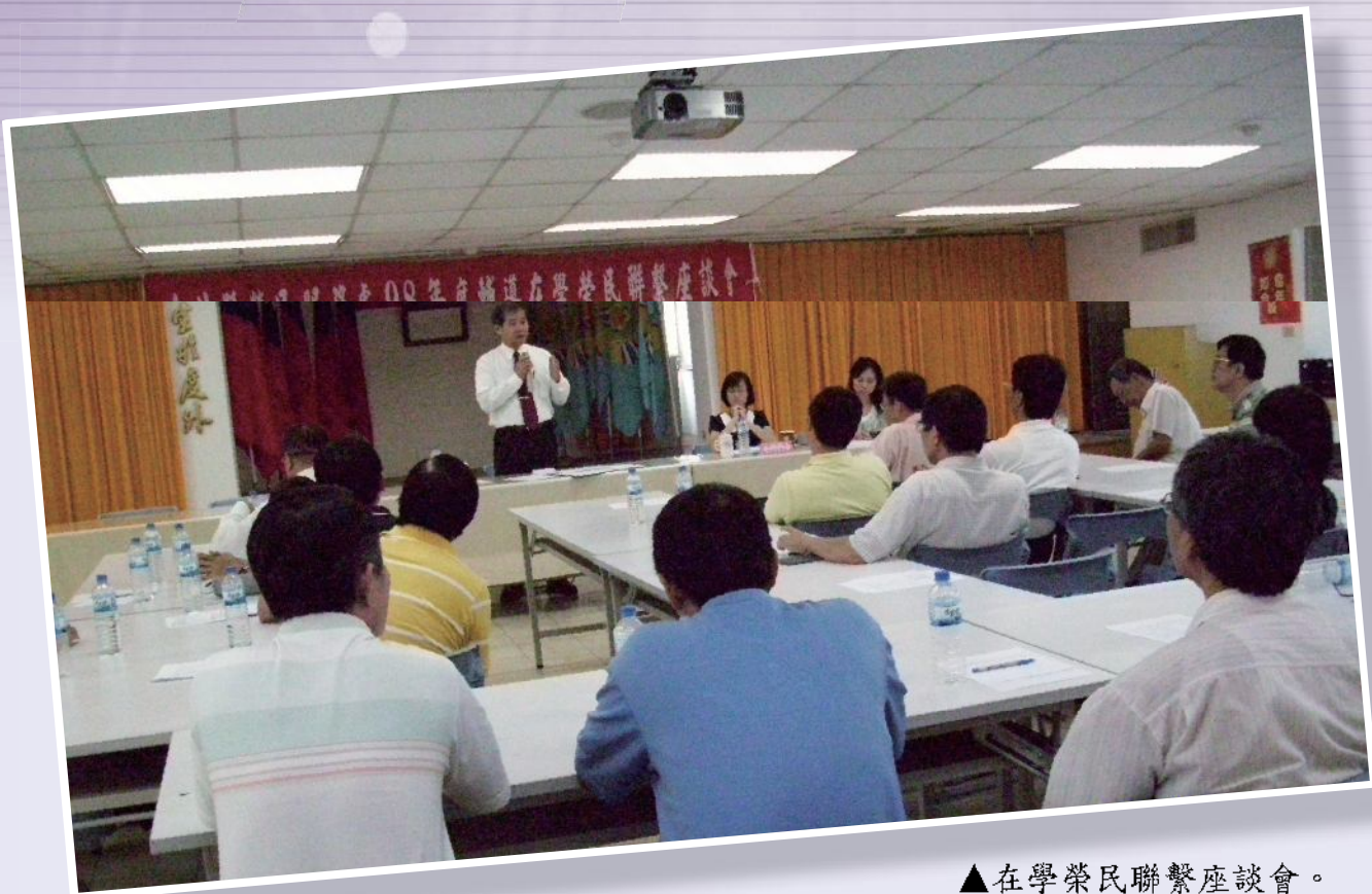
▲在學榮民聯繫座談會。