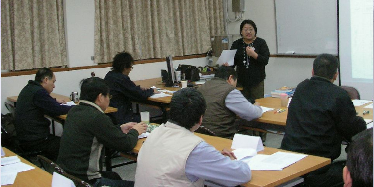
▲輔導會與中興大學合辦榮民碩士學分專班上課情形。