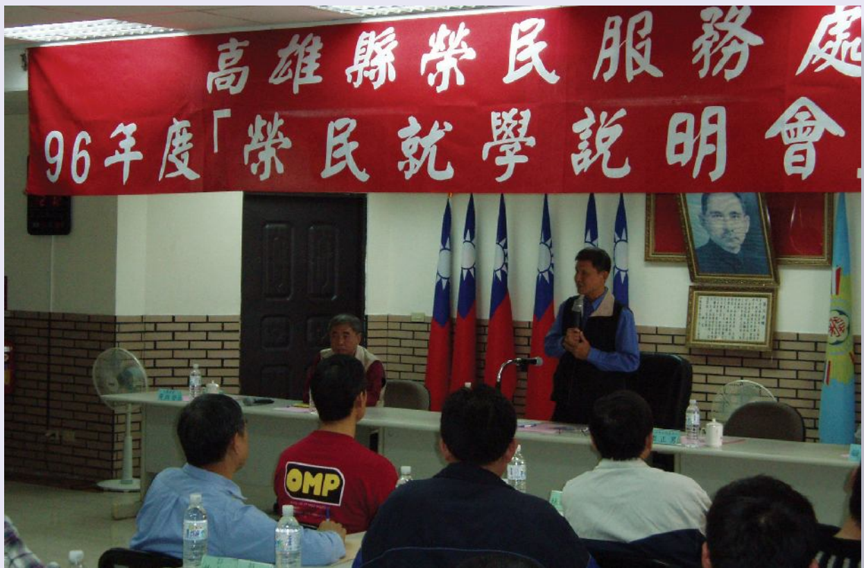
▲高雄縣榮服處舉辦榮民就學說明會。