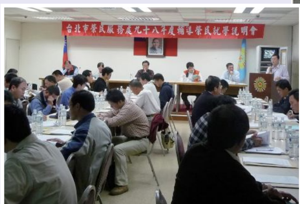
▲榮民就學宣導說明會。

參與考選就讀二年制技術系的學校，目前計有：國立台北科技大學、中國文化大學、元智大學、朝陽科技大學、國立高雄應用科技大學、龍華科技大學、大華技術學院、中臺科技大學、弘光科技大學、崑山科技大學、輔英科技大學、明新科技大學、清雲科技大學、中州技術學院、長榮大學等15所校院。提供學系有：機械工程、電機工程、電子工程、材料及資源工程、營建工程、化學