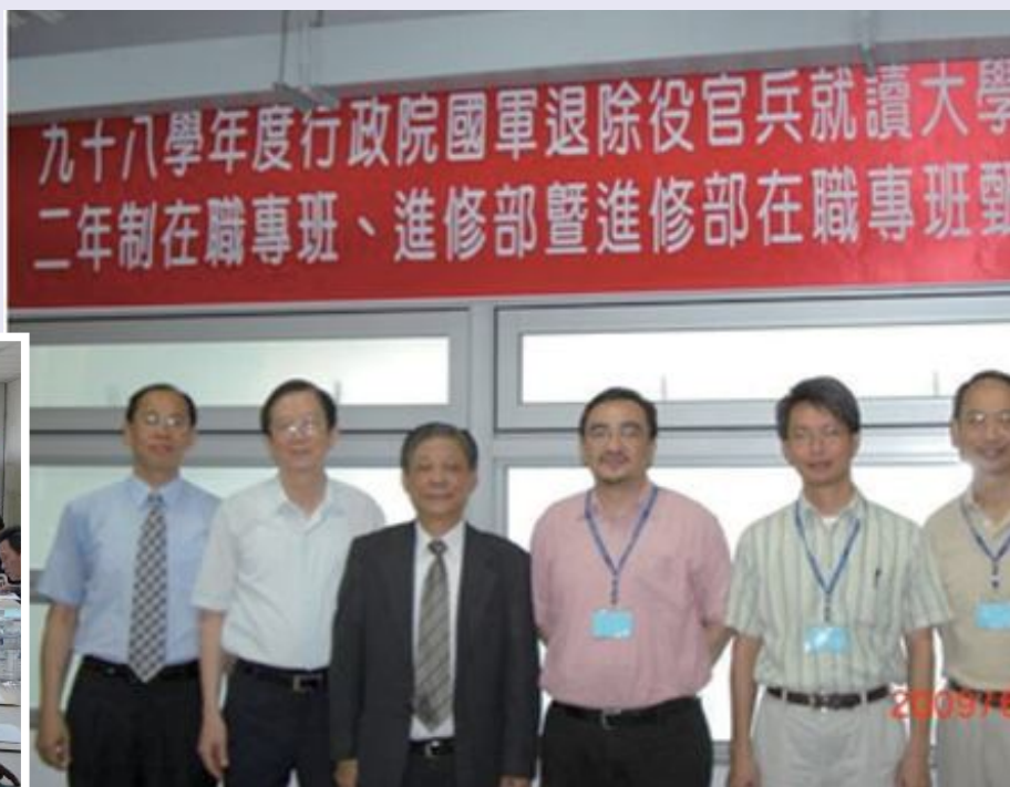
▲韋參事（左三）督導退除役官兵考選大學暨技術學院二年制試務。