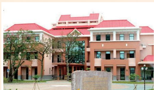
▲馬蘭榮家現今安養大樓外觀。