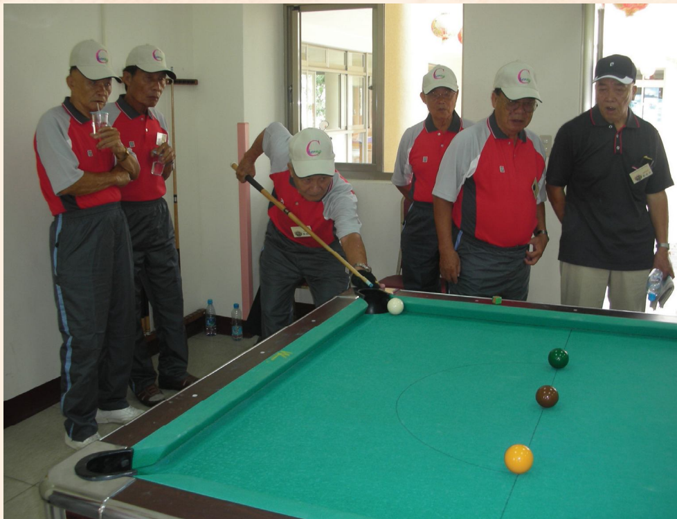
▲榮民才藝嘉年華會一撞球比賽。