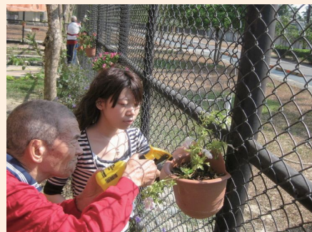
▲屏東榮家規劃失智榮民園藝治療。