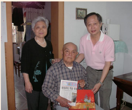
▲輔導會派員訪問長期居住大陸榮民。

依據民國81年7月31日總統公布「臺灣地區與大陸地區人民關係條例」（以下簡稱「兩岸人民關係條例」）第27條，暨行政院81年11月24日核定之「就養榮民進入大陸地區定居就養給付發給辦法」，本會82年1月19日訂定「就養榮民進入大陸地區定居就養給付發給作業實施規定」。82年9月27日修正前述發給辦法第4條，主要修正重點為：於76年11月2日以後，本辦法施行前，經許可進入大陸地區者，因罹患重病或其他不可抗力之事由，致滯留大陸地區者，得檢附經行政院設立或指定之機構或委託之民間團體驗證之相關文件，向安養機構申請定居及就養給付。89年9月20日續修正前述發給辦法第6條，將大陸定居權責下授由各榮家核定後報會備查。92年10月29日配合行政院修正公布「兩岸人民關係條例」第27條，於93年2月28日修正「就養榮民赴大陸地區長期居住就養給付發給辦法」及相關作業規定，主要修正內容為：1.大陸定