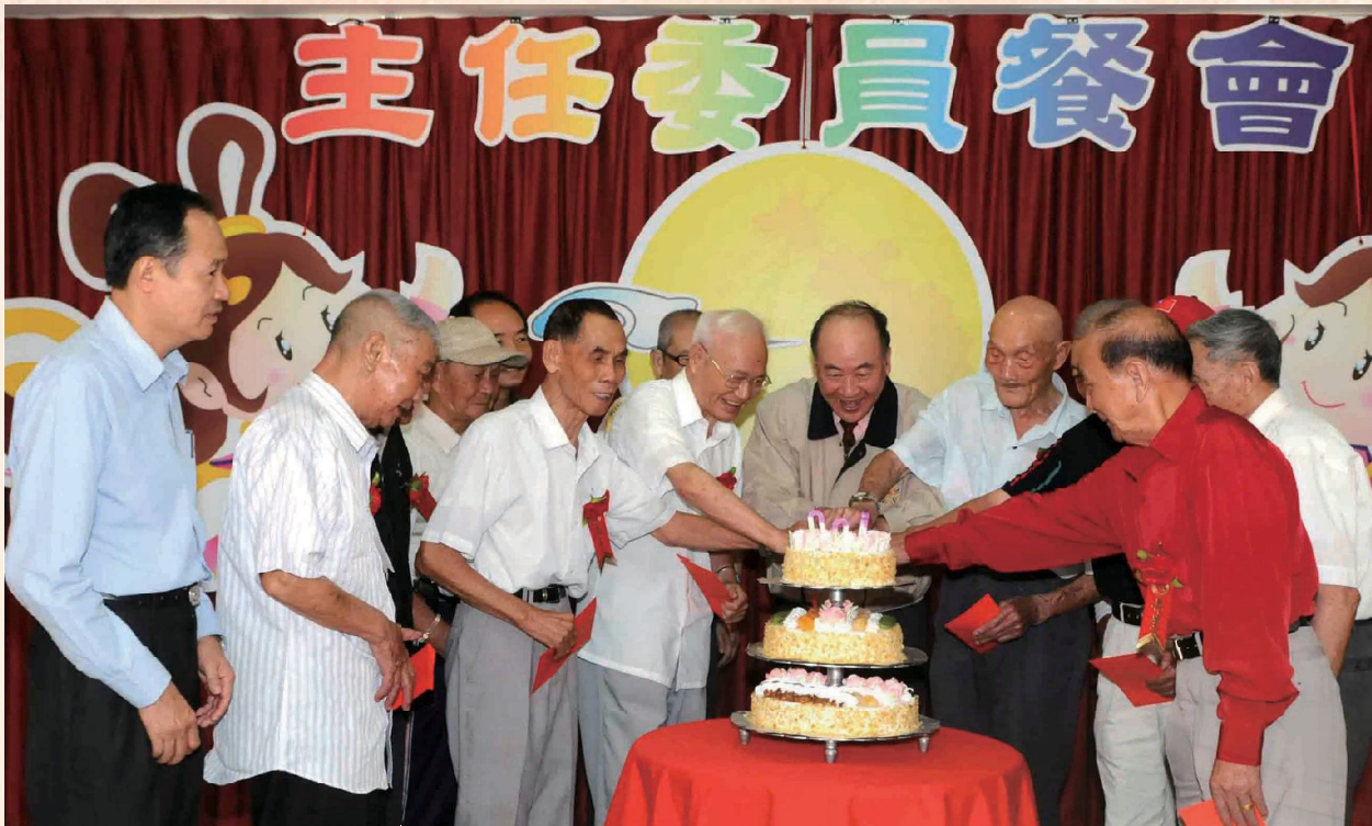
▲曾主任委員（右四）主持新竹榮家秋節餐會，與榮民壽星一同切蛋糕。

民（眷）長期照顧需求，提升本會及所屬機構功能品質，並永續發展外，亦能協助政府滿足地方民眾服務照顧，發揮資源整體效能，其規劃原則如下：