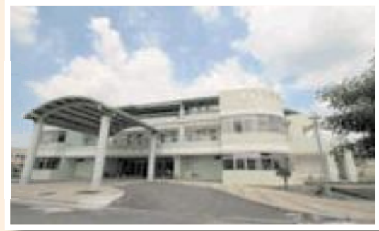
▲岡山榮家新建安養大樓。