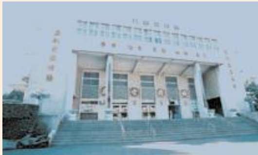
▲新竹榮家中正紀念堂原貌。