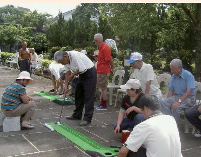
▲白河榮家高爾夫球推桿比賽。