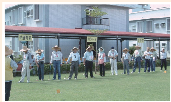
▲花蓮自費安養中心現今槌球場。