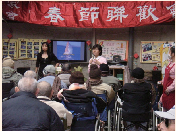
▲榮家舉辦春節聯歡。

費安養。花蓮榮民自費安養中心自92年3月16日起收容安置，白河榮家自92年4月1日起，佳里、台南及太平等3所榮家，自93年11月1日起收容安置。