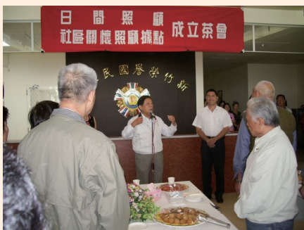
▲榮家成立日間照顧及社區關懷照顧據點。