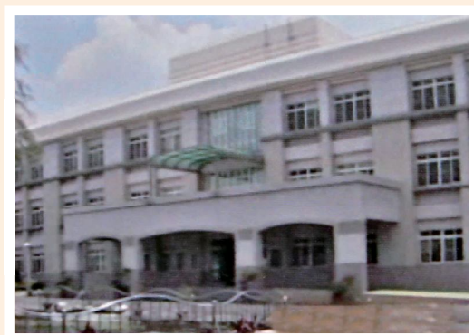
▲雲林榮家現今養護區外觀。