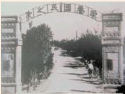
▲民國42年台南榮家大門。