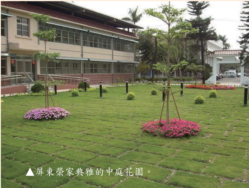
▲屏東榮家典雅的中庭花園。