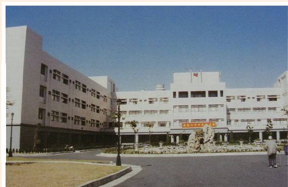
▲八德自費安養中心現今外觀。