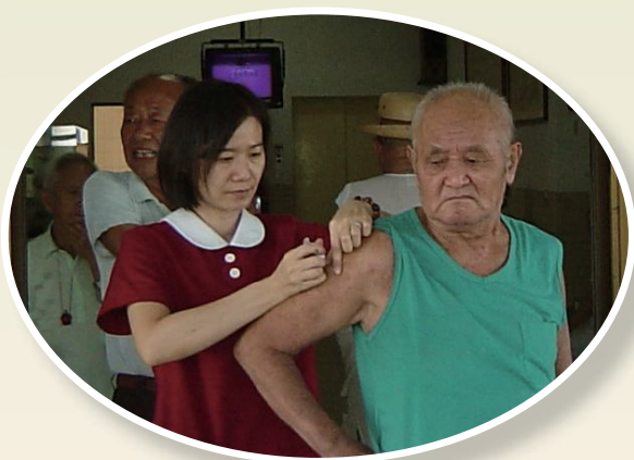
▲岡山榮家保健組護理人員為榮民注射流感疫苗。