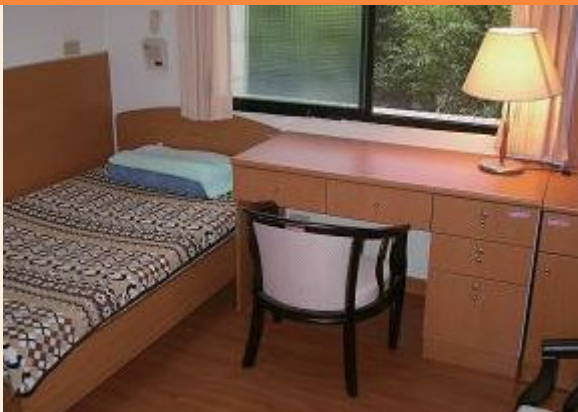
▲彰化自費安養中心溫馨舒適之個人套房。