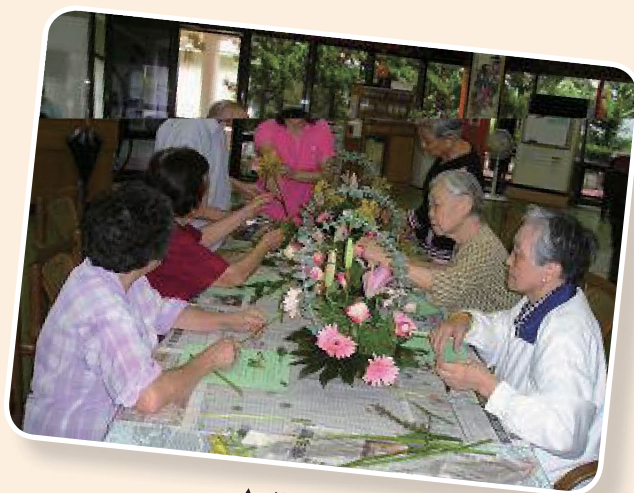
▲佳里榮家花藝活動。