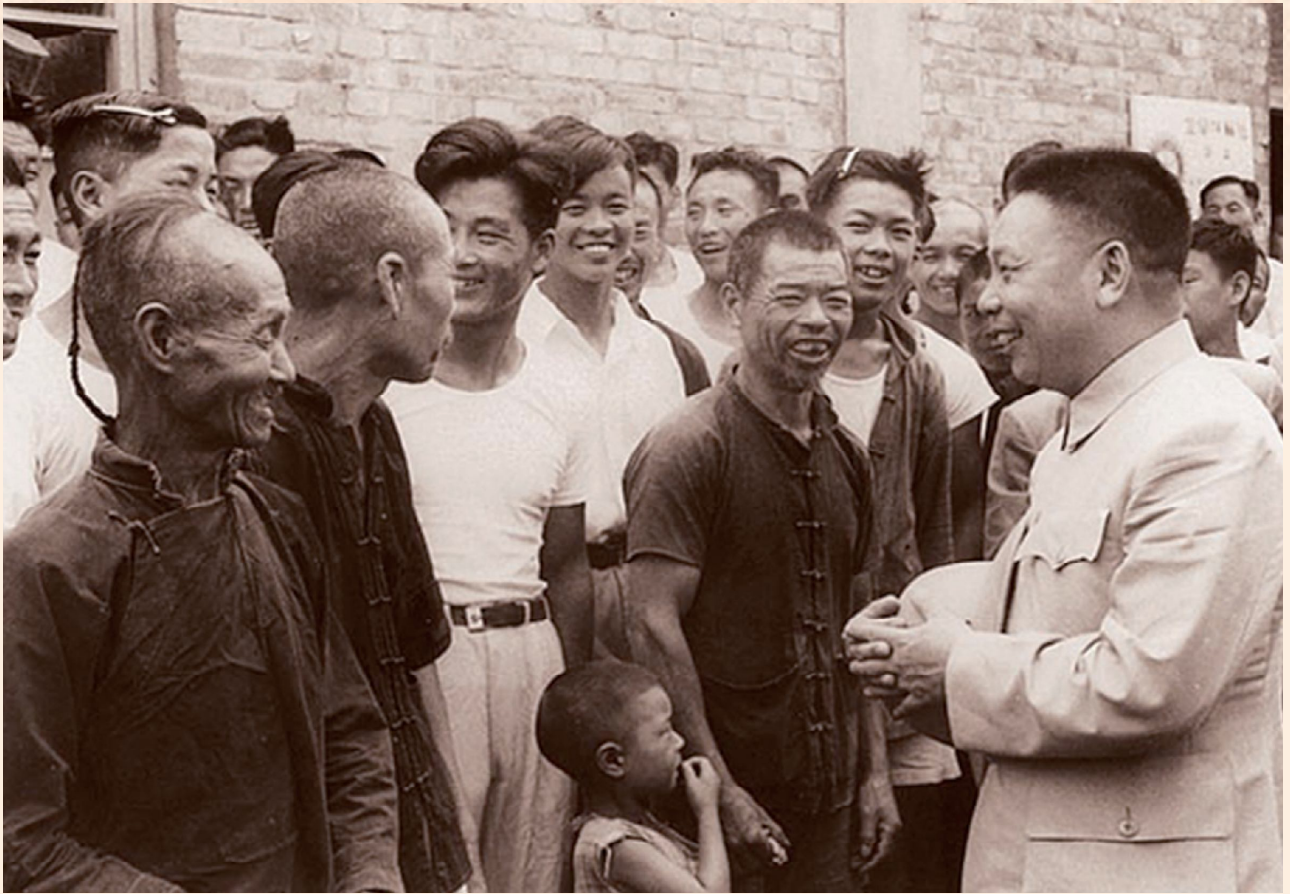
▲民國44年4月1日，輔導會副主任委員經國先生在員山榮家與就養榮民話家常。