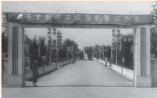
▲民國48年岡山榮家初成立時大門。