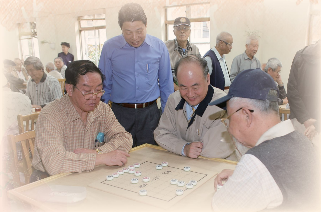
▲曾主任委員觀看台北榮家榮民下棋。