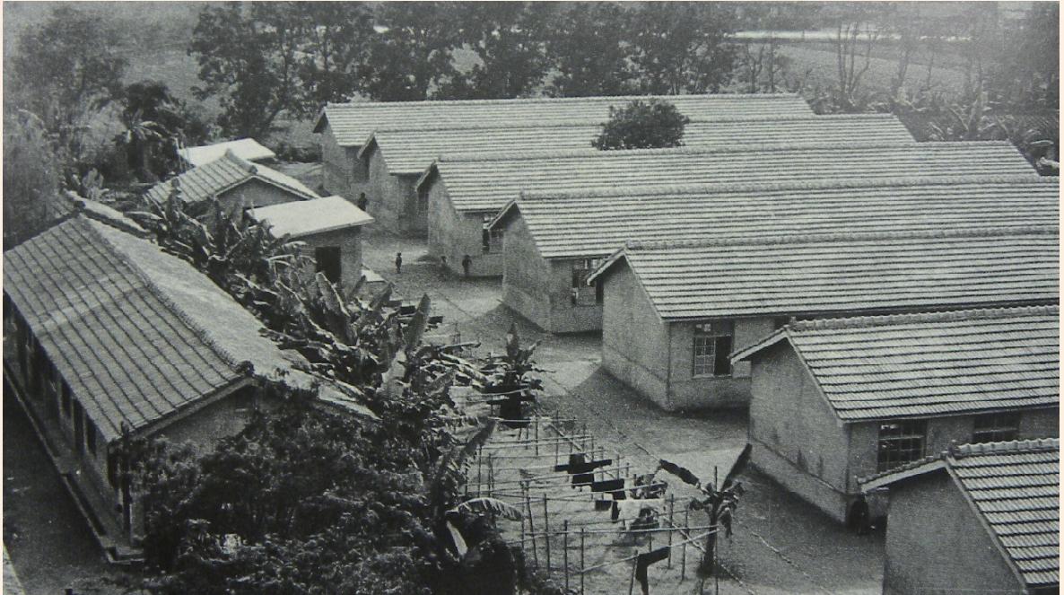
▲民國48年屏東榮家榮民宿舍。

輔導會，43年11月1日正式成立「國軍退除役官兵就業輔導委員會」，11月3日發布組織規程，主任委員由台灣省政府主席兼任，下設3室4組（1組辦理假退役軍官就業訓練，2-3組辦理除役士兵就業、手工藝、工廠、農墾等就業指導，4組辦理除役士兵就業前之各項聯繫與生活救助），以辦理輔導就業為主。