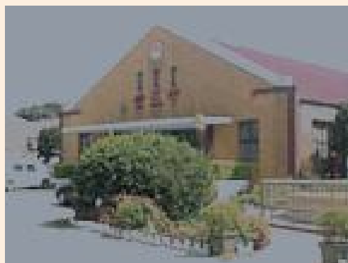
▲八德自費安養中心前身— 講習所成立時外觀。