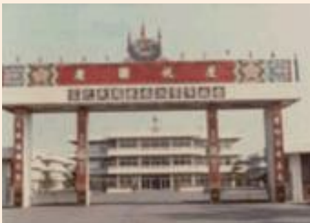
▲桃園榮家前身—台北市第二榮譽國民之家。