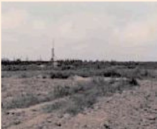
▲佳里榮家前身—高雄大同農莊。