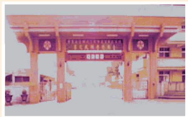
▲民國74年台南榮家新建大門。