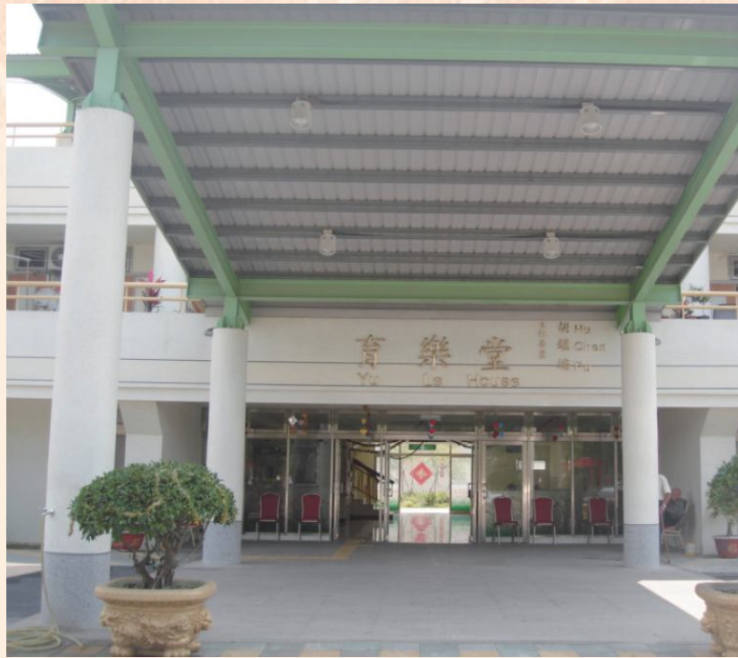
▲飯店式的榮民房舍。

各項生活及休閒設施（備），使年老榮民及眷屬，能在溫馨、安適有尊嚴的環境中安養晚年。