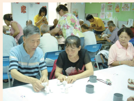
▲社區關懷照顧據點舉辦文康活動。