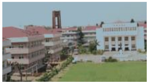
▲桃園榮家整建後之外觀。