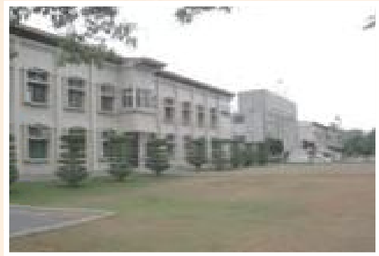
▲彰化自費安養中心改制後榮舍。