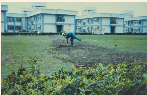
▲花蓮自費安養中心原槌球場。