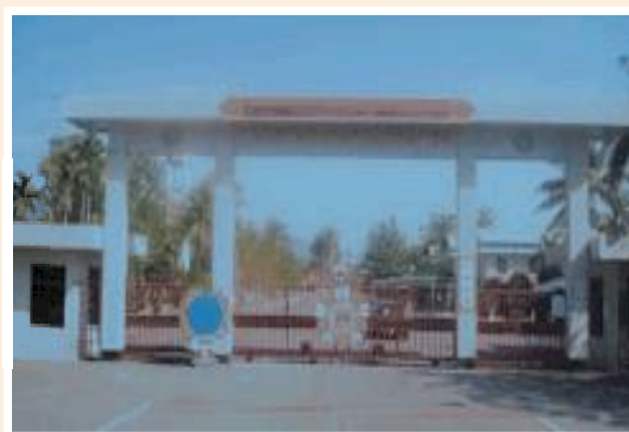
▲太平榮家現今大門面貌。