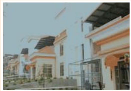
▲民國94年彰化榮家修建後之養護堂。