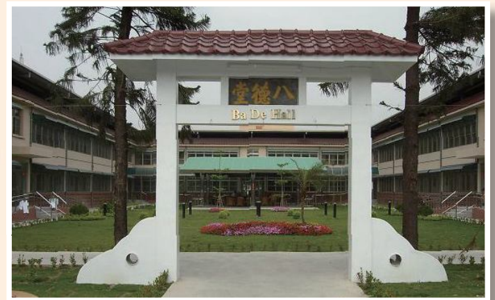
▲屏東榮家現今安養堂。