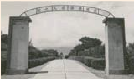
▲民國42年花蓮榮家初成立時所建大門。