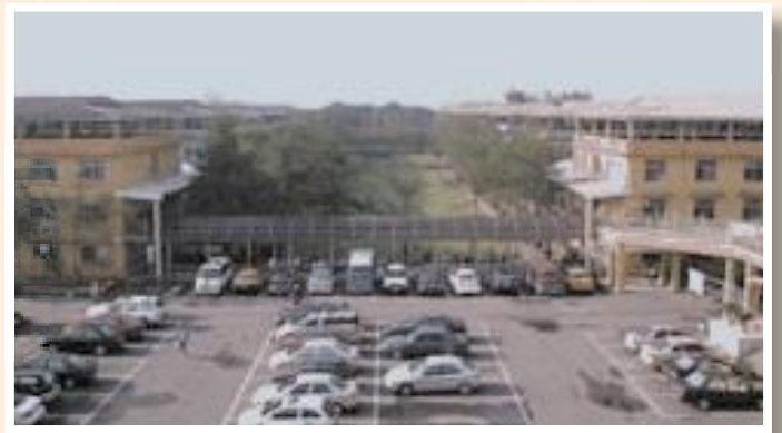
▲板橋榮家民國70年整建後的情形。