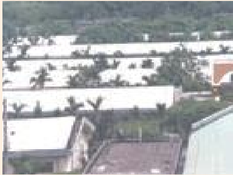
▲彰化自費安養中心成立時榮舍。