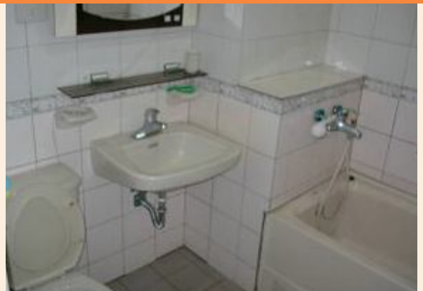
▲彰化自費安養中心套房內個人衛浴設備。