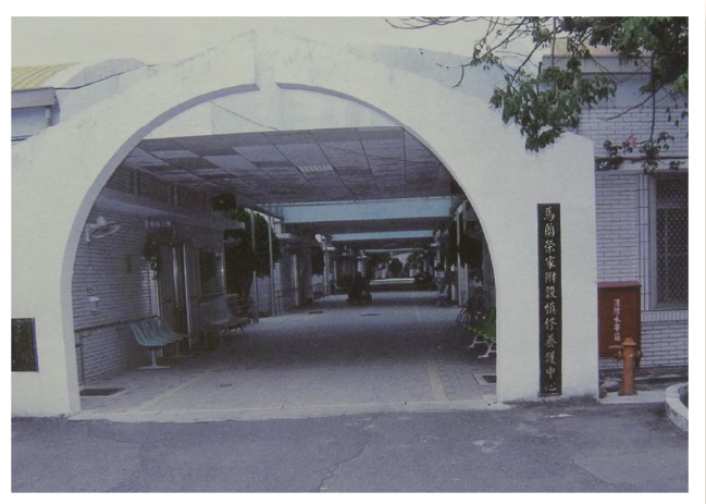
◀▲馬蘭榮家附設慎修養護中心。