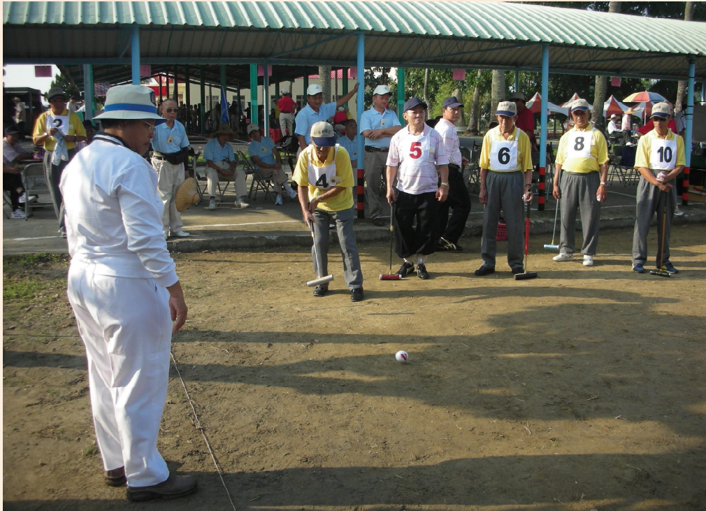
▲榮民才藝嘉年華會—槌球比賽。

活動有藝文陳展，內容為榮民、榮眷及地方社區民眾之手工藝品、書法、美術、攝影、雕刻、陶瓷、盆栽等作品；就業媒合為地區會屬各服務機構協調當地工商機構，辦理就業媒合各項活動，以增加榮民（眷）就業機會；並實施家區導覽，展現安養機構溫馨祥和尊嚴的頤養環境，由專人引導各服務機構外住榮民，參觀家區各項生活休閒醫療設施，期使外住榮民樂於返家安養。