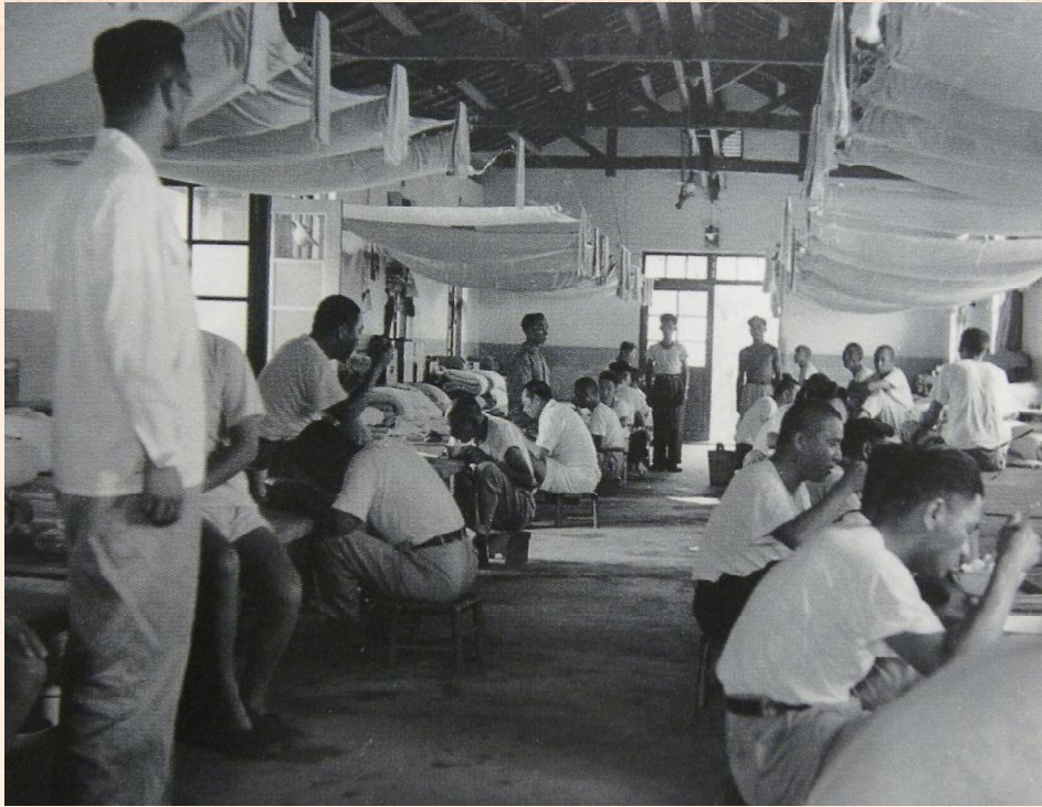
▲民國48年，屏東榮家榮民在寢室內用餐情形。

榮民安養工作的法源依據，其後陸續訂定的「國軍退除役官兵輔導條例施行細則」（57年10月15日）及「國軍退除役官兵就養安置辦法」（57年11月1日）則進一步確立了榮民安養工作的法制化。