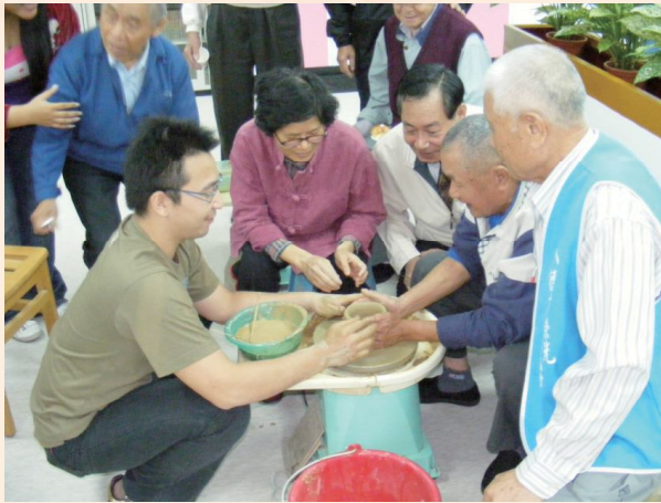
▲榮民參與製作陶土。