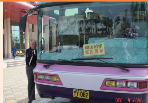
▲岡山榮家就診專車。