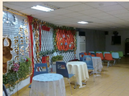
▲佳里榮家將牆壁佈置成衛教展示櫥窗。

屏東榮家：規劃失智榮民園藝治療，並將所栽種之花草送予養護榮民，藉榮民感動榮民。由美和技術學院學生，配合實習方案計畫進行「園藝治療活動」，希望透過園藝栽培讓失智專區榮民進行團體治療，經前後測量結果，均有減緩失智症之效益。