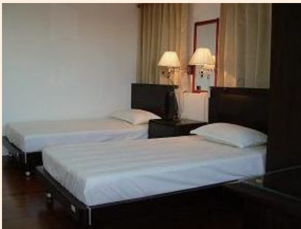
▲佳里榮家夫妻套房。

當年所製發榮民證之式樣、顏色，依其退除役時之階級而有不同，79年將退伍將官、軍官、士官兵之榮民證樣式、顏色予以統一，不再有所區別。