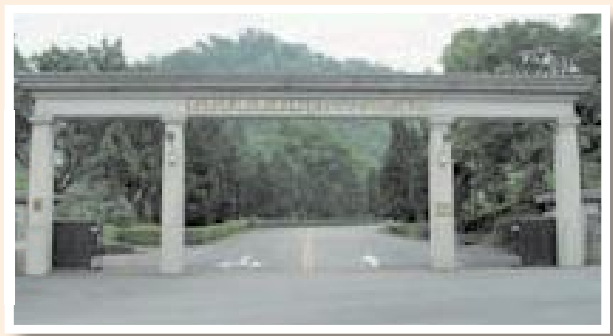
▲民國83年於三峽白雞成立台北榮家。