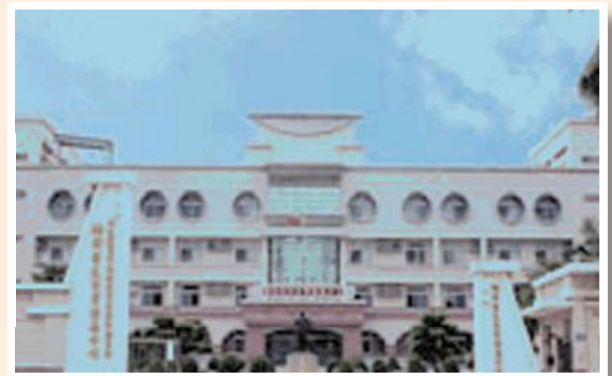
▲楠梓自費安養中心現今外觀。