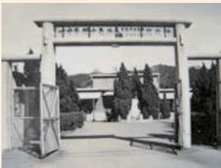
▲台北榮家前身—桃園虎頭山反共義士輔導中心。