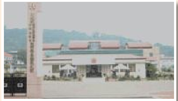
▲白河榮家現今大門景觀。