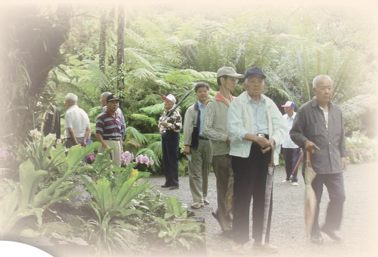
▲桃園榮家榮民自強活動。