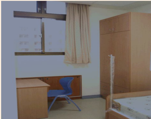
▲飯店式的榮民寢室。