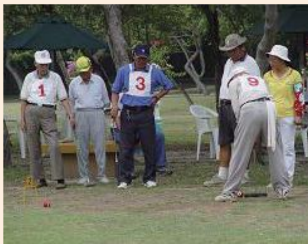
▲佳里榮家槌球比賽。