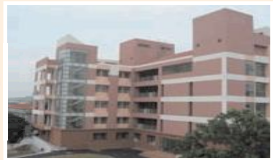
▲新竹榮家中正紀念堂改建成安養大樓。