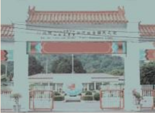
▲白河榮家舊大門景觀。