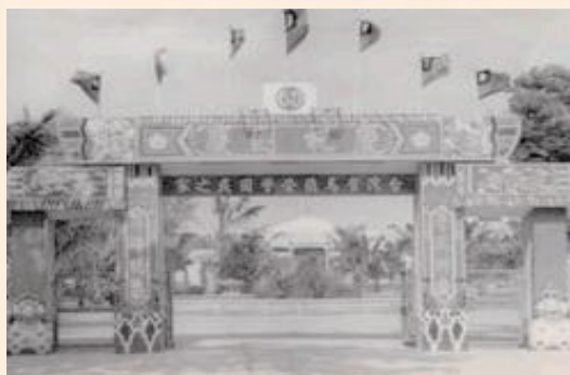
▲民國58年馬蘭榮家大門。