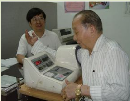
▲台北榮家為榮民量血壓。