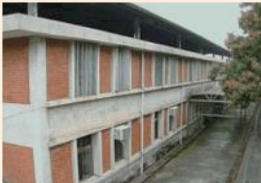
▲民國62年彰化榮家房舍。