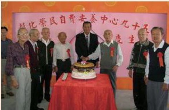
▲彰化榮民自費安養中心慶生會。