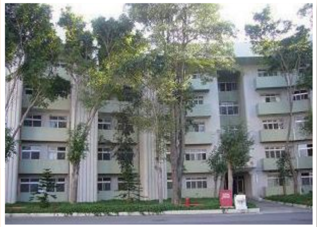
▲佳里榮家現今安養大樓。