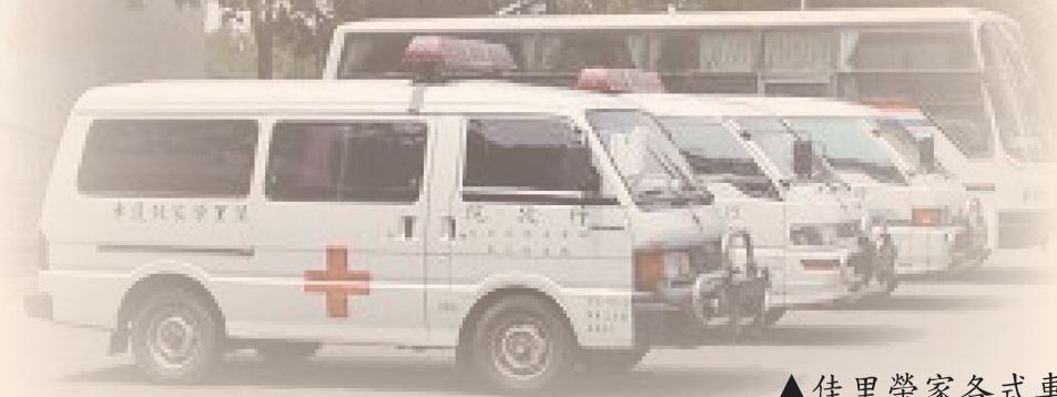
▲佳里榮家各式車輛。