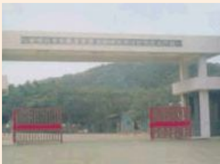
▲楠梓自費安養中心原於台南烏山頭舊址大門。