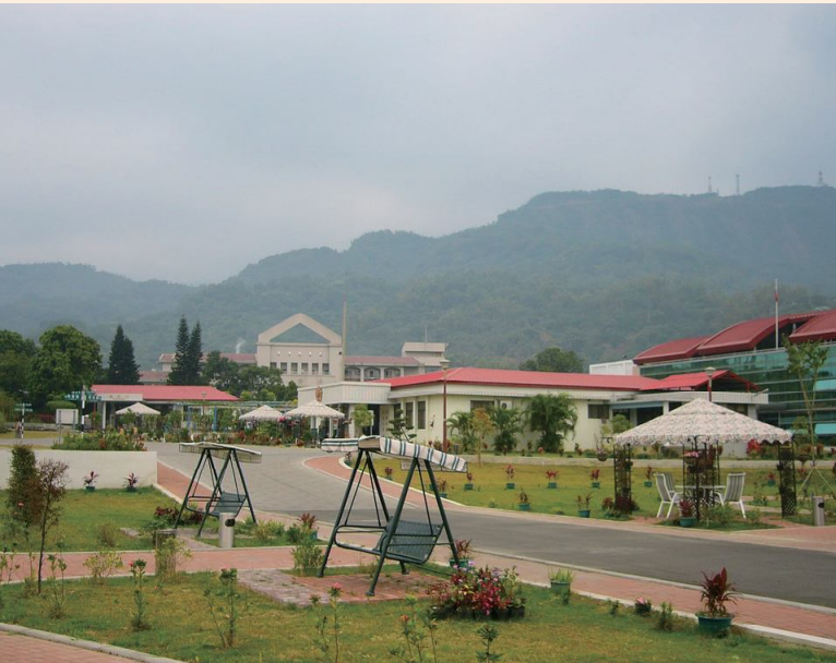
▲白河榮家優美景致。