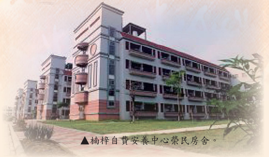
▲楠梓自費安養中心榮民房舍。