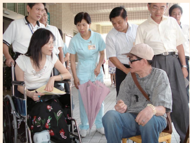
▲安養機構評鑑委員實地訪問榮民。