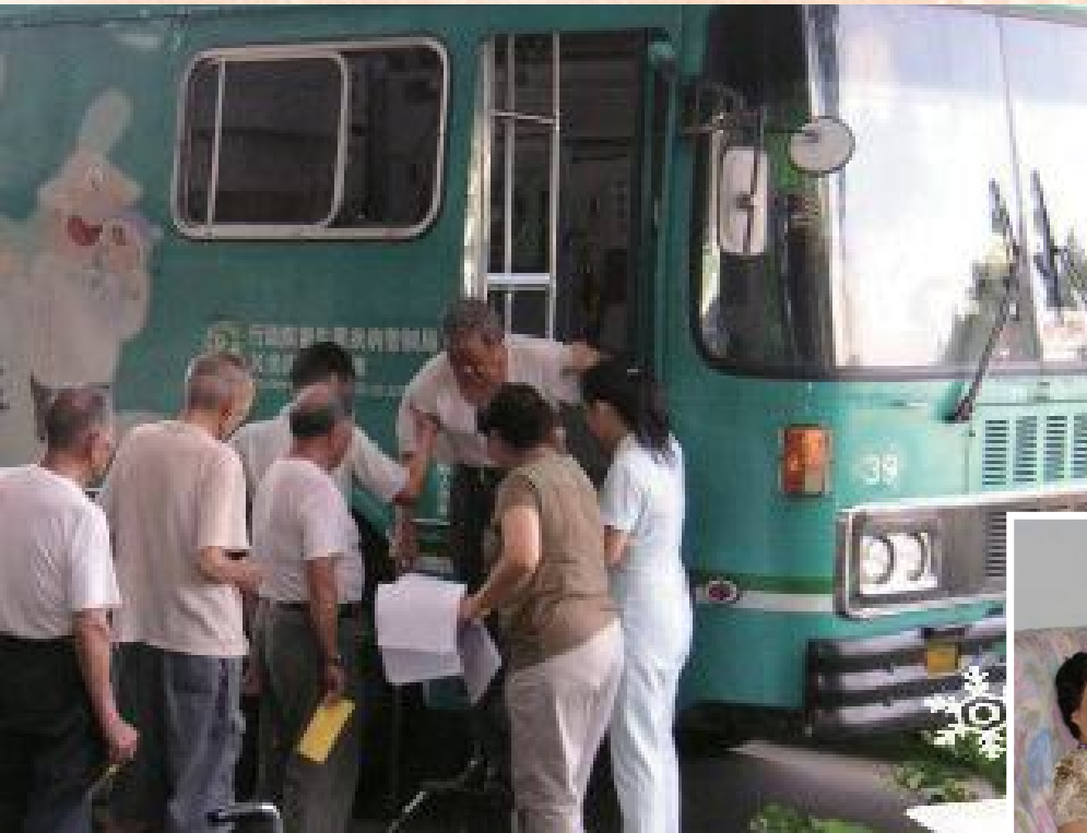
▲桃園榮家榮民X光檢查。