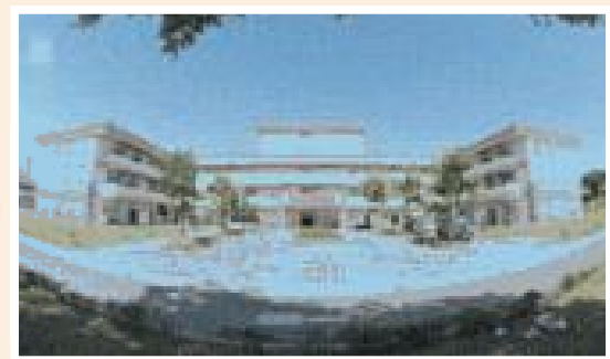
▲花蓮榮家環境總體營造中程計畫後之安養大樓。