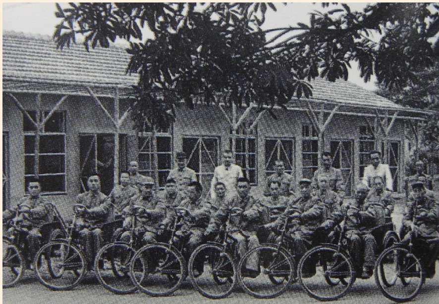
▲早年於屏東榮家接受就養之身障榮民。

「輔導條例」施行細則於79年2月9日修正施行前已入營服役者、各軍事學校已在訓之學生及經專案核定為輔導對象，或由國防部或各軍種總部核發「視同退伍證明書」者，納入退除役官兵對象。