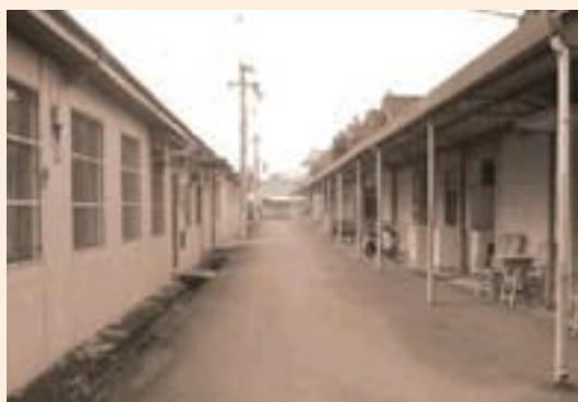
▲民國46年雲林榮家榮舍。