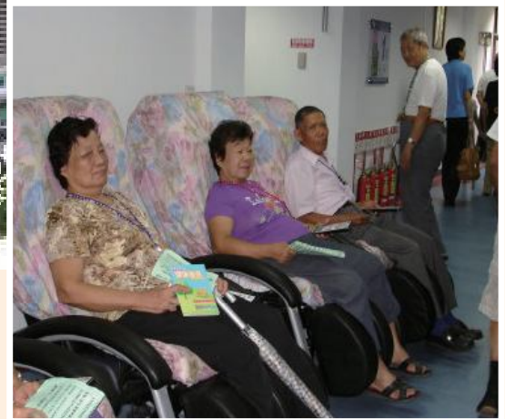
▲彰化榮家復健資源分享社區民眾。