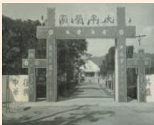
▲太平榮家早期大門外觀。