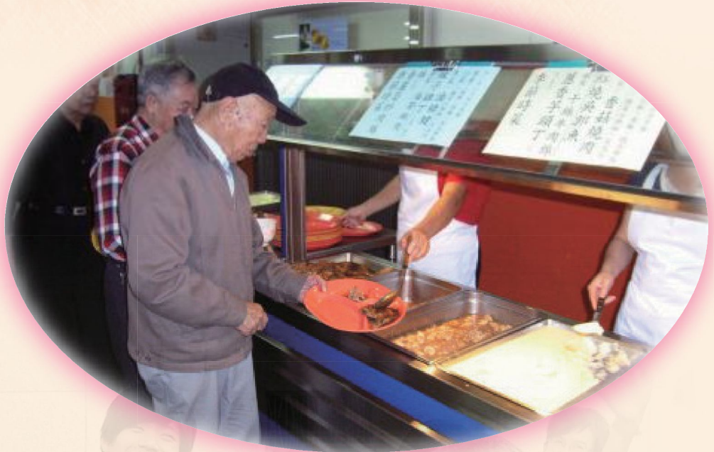
▲榮家榮民用餐情形。