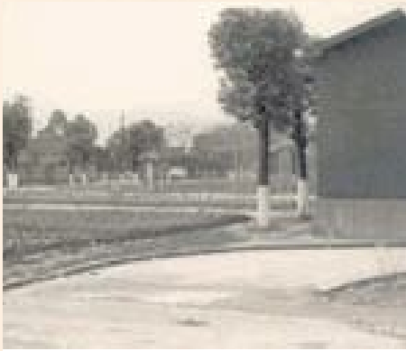
▲板橋榮家整建前實況。