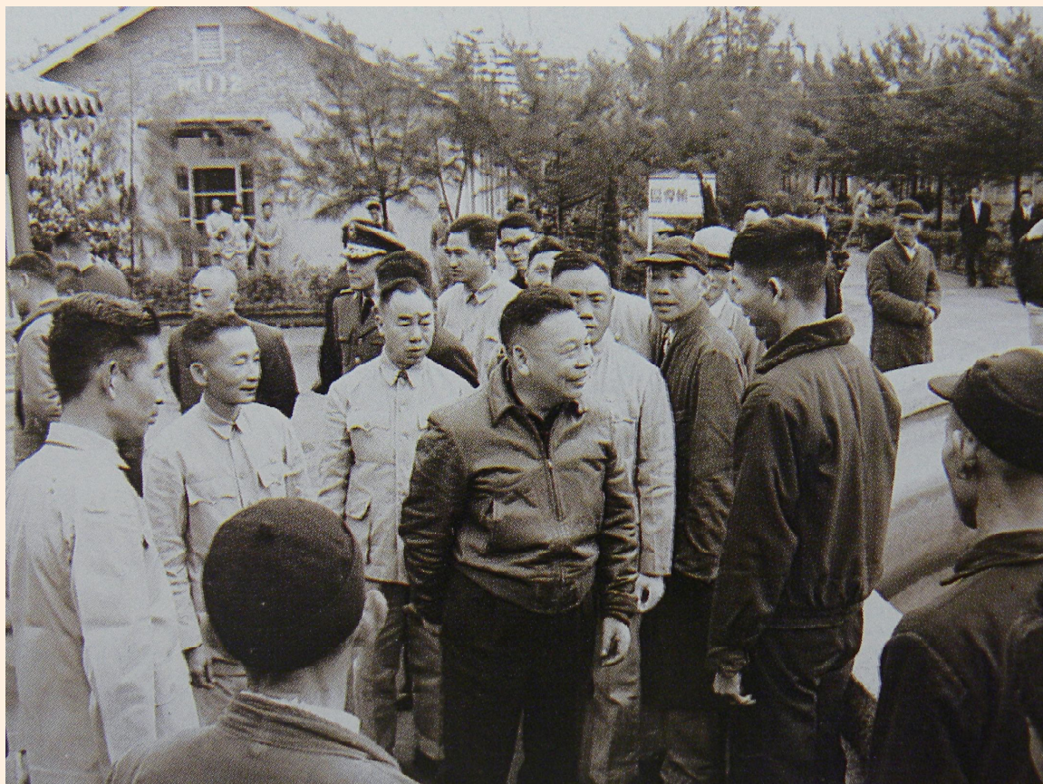
▲經國先生親切問候住家榮民。

先總統蔣公為促使國軍精壯，激勵青年從軍報國，並落實「在營為良兵，在鄉為良民」之國防政策，指示制定國軍退除役官兵輔導制度，期使國軍官兵在軍旅中能安心為國家奉獻，退伍除役後，亦能各適其所、各展所長，達到「壯有所業、學有所用、病有所醫、老有所養，孤獨廢疾困苦者，皆能獲得適當服務照顧」之輔導理念，進而確保國家安全、社會安定、促使經濟繁榮，厚植國家有形無形之發展潛力，於民國42年指示籌設