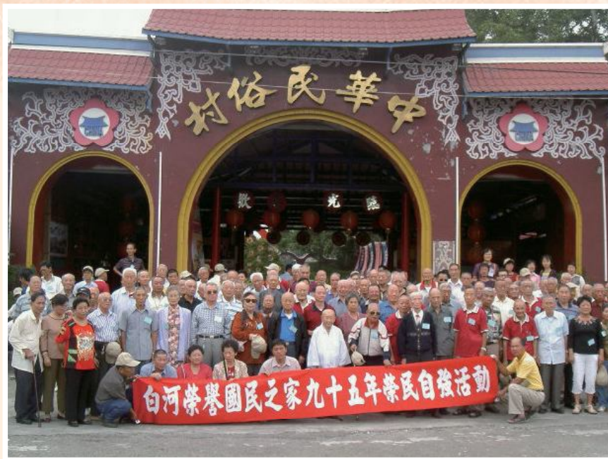
◀白河榮家榮民自強活動。