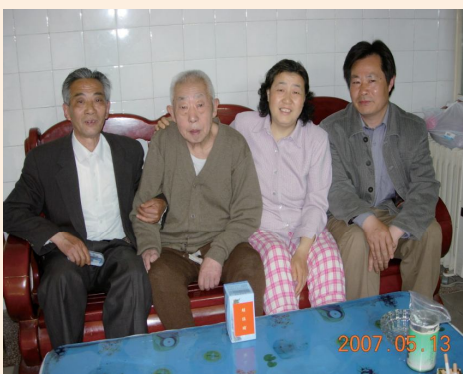
▲長期居住大陸榮民與家人合影。